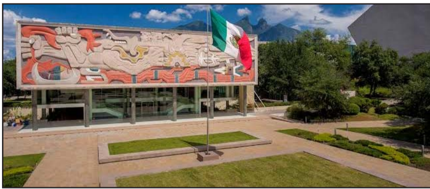
La edición 2027 del QS World University Rankings colocó a la universidad en el lugar 188 de entre más de 8,000 instituciones evaluadas en 106 naciones.