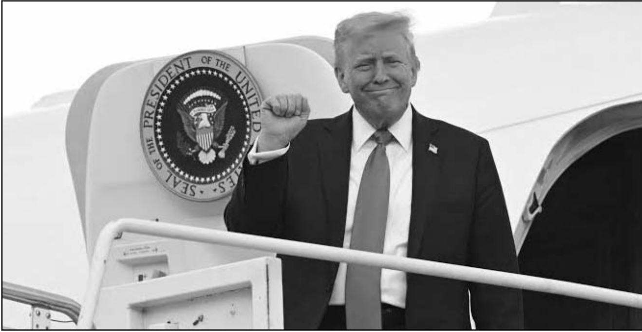
La aceptación del avión por parte del Pentágono generó cuestionamientos éticos y preocupaciones de seguridad.