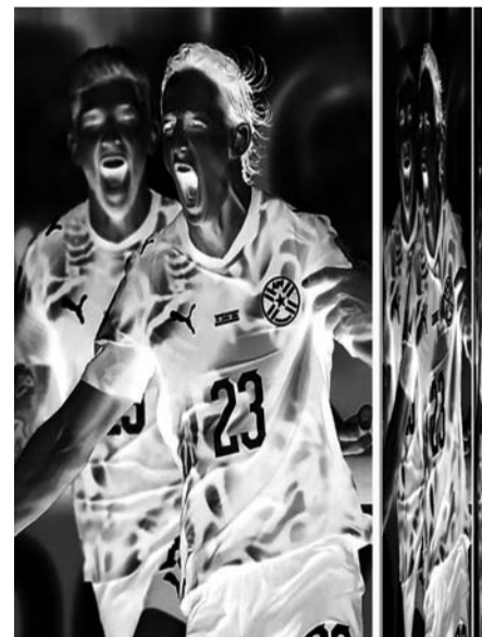
La expulsión hace historia, al ser la primera de este tipo en un Mundial bajo la nueva regla de conducta que prohíbe a cualquier jugador que no sea

Sin apenas respiro para reaccionar a la ventaja del conjunto de los del argentino Gustavo Alfaro, el encuentro, que se disputó en el Estadio de la Bahía de San Francisco, se prestó tenso para ambas selecciones, en un intento por llevar el control y salvaguardar su permanencia en la fase de grupos.