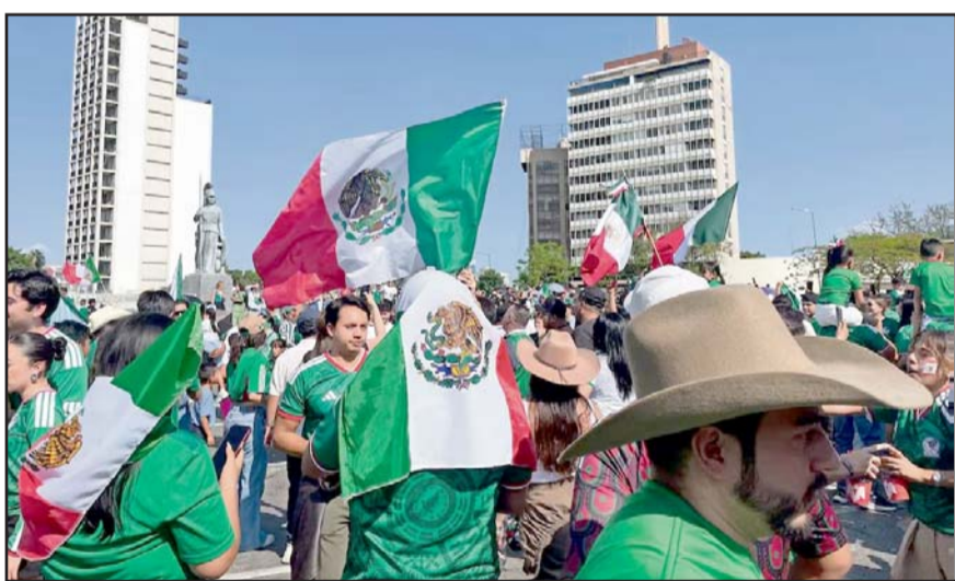
Miles de aficionados tomaron las calles para celebrar la victoria que encendió la ilusión mundialista.