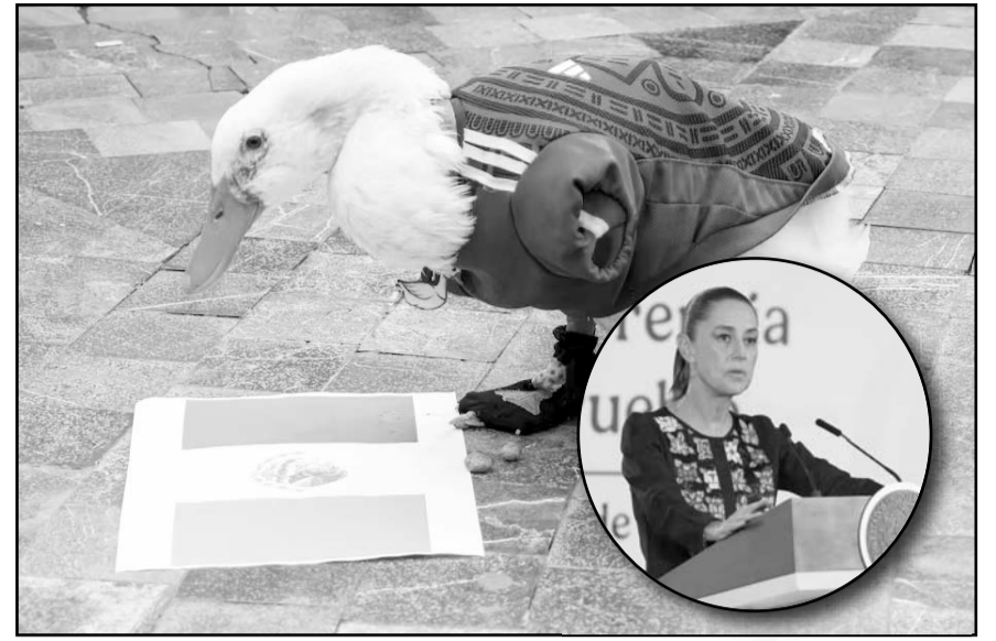
La Mandataria federal consideró que el popular animal refleja el carácter y la cultura de los mexicanos durante el Mundial.