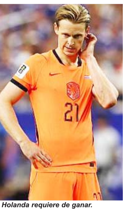
Holanda requiere de ganar.