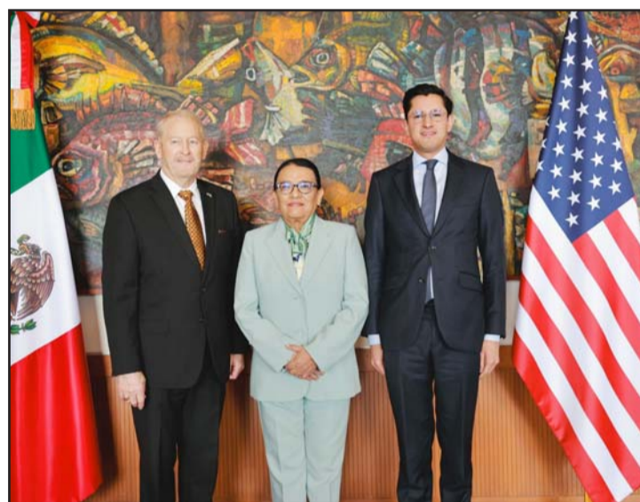
En el encuentro reafirmaron su compromiso de trabajar con diálogo, respeto y cooperación.

"Durante la reunión, se destacaron los avances alcanzados por el gobierno de México