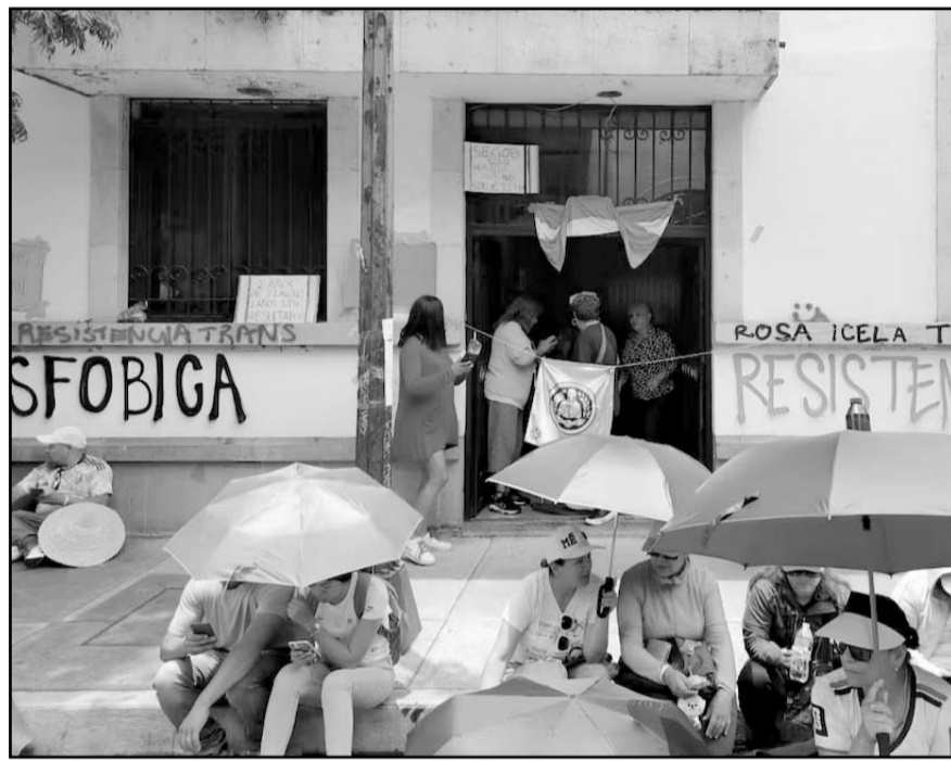
Activistas denuncian falta de avances en sus demandas y aseguran que las mesas de trabajo han sido una simulación.

Hicieron un llamado a no criminalizar su protesta y garantizaron que no realizarían ningún acto de iconoclasia. "¡Nos quedamos aquí hasta que nos den una reunión con la secretaria de Gobernación!", advirtieron.