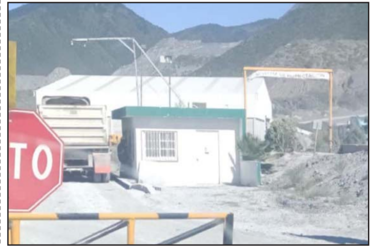
El trabajador quedó sepultado en su máquina.

Mencionaron que las autoridades cerraron el paso en ambos sentidos, para evitar que los vehículos fueron arrastrados por el agua.