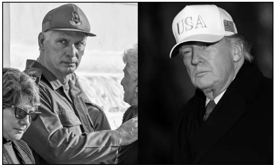
Trump reveló que el secretario estadounidense de Estado, Marco Rubio, está "muy involucrado" en los planes para la isla.

para confrontar la profunda crisis que sufre la isla y las exigencias de Washington.