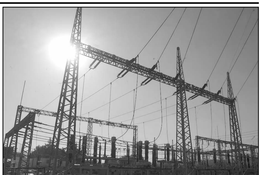
La revisión del T-MEC y la estabilidad regulatoria siguen siendo factores decisivos para los inversionistas extranjeros.

En materia de certidumbre para la inversión, el especialista consideró que los empresarios continúan observando con atención tanto la revisión del T-MEC como el entorno político e institucional en