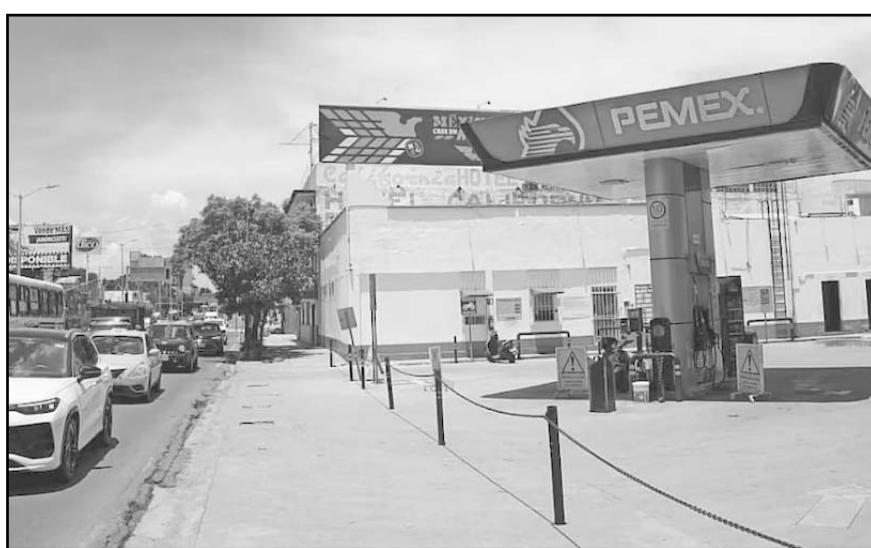
Entre 15 y 25 estaciones cerraron diariamente por la falta de gasolina durante las protestas.

El abastecimiento de combustible a las diferentes estaciones de servicio de la ciudad de Oaxaca y municipios de la región Valles Centrales, se regularizó luego de que maestros de la Sección 22 del Sindicato Nacional de Trabajadores de la Educación (SNTE) dejaron libre por la noche y parte de la mañana del viernes la terminal de almacenamiento y despacho de Pemex.