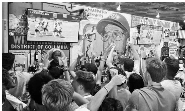
El juego ahora sí hizo vibrar a la unión americana.