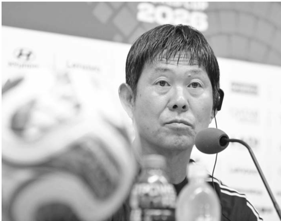
Hajime Moriyasu, técnico de Japón.

"Suena chistoso decirlo, pero este sábado daremos un partidazo que esté a la altura del partido mil en los Mundiales",