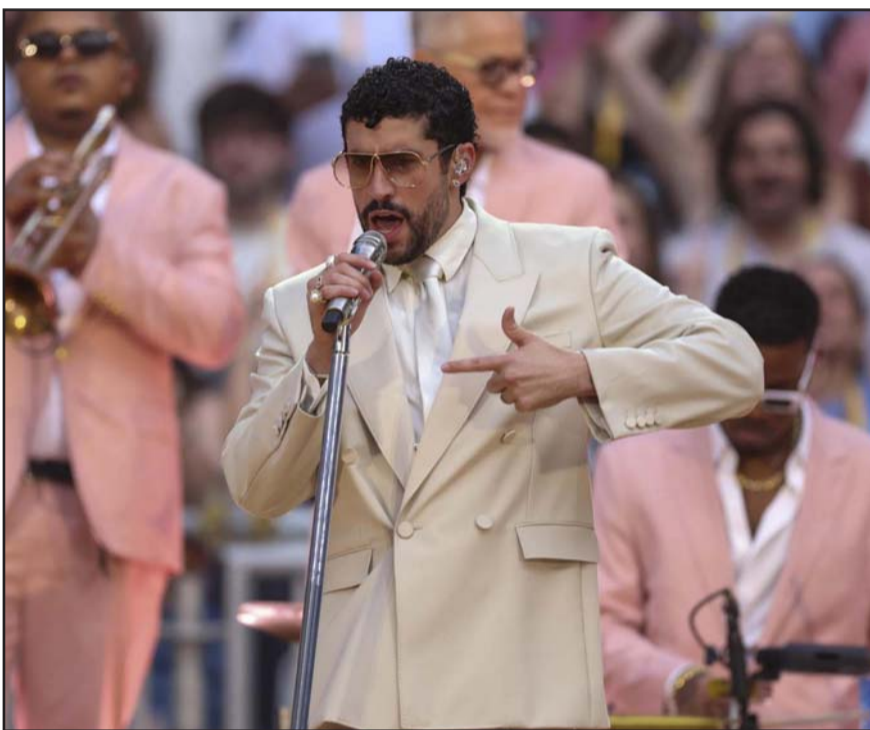
Bad Bunny es el primer artista en alcanzar esta suma sin interpretar música de lengua inglesa.

Otro de los logros que Bad Bunny alcanzó este año fue convertirse en el primer artista en ganar un Premio Grammy en la categoría "Mejor Álbum del Año" por un disco hecho completamente en español con "Debí Tirar Más Fotos".