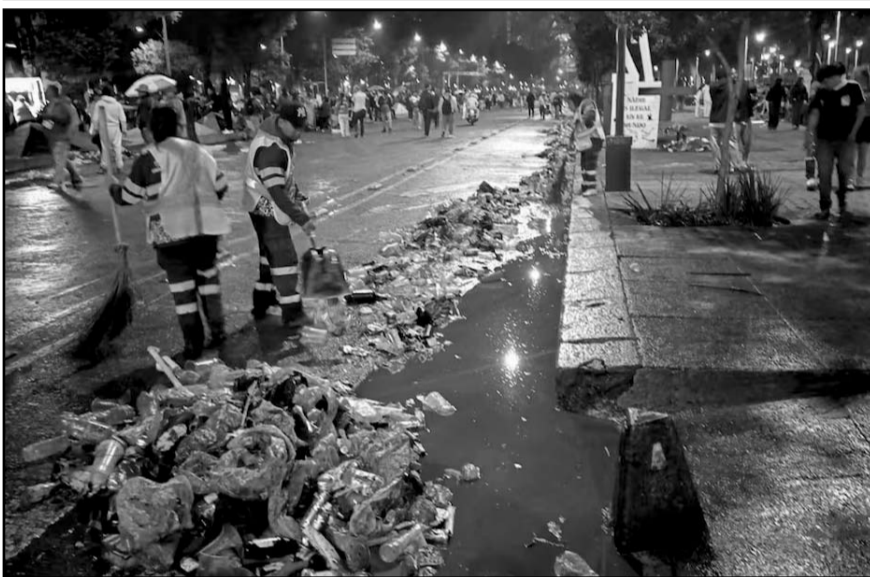
La Sobse reportó labores intensivas de limpieza luego de la concentración masiva de aficionados.

El magisterio también exige el regreso al sistema solidario de pensiones, la jubilación por años de servicio, así como el incremento salarial del 100% directo al sueldo base, la homologación de prestaciones y la eliminación del sistema de cuentas individuales y del cálculo de pensiones en Unidad de Medida y Actualización (UMA).