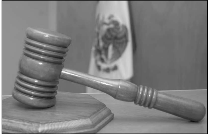
La Comisión de Disciplina revisa si existieron irregularidades en el desempeño del juez suspendido.

Agregó que las resoluciones judiciales deben considerar siempre su impacto en la vida de las personas, en la protección de las víctimas y en la confianza pública en el sistema de justicia penal.