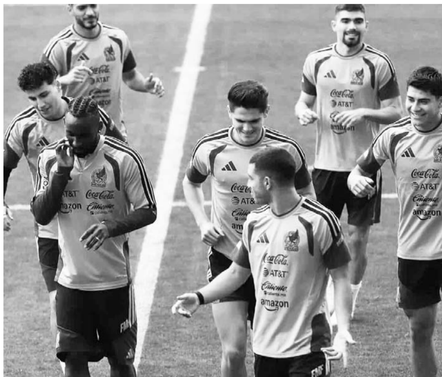
México buscará cerrar perfecto por primera vez la fase de grupos en un Mundial.

La escuadra azteca ya aseguró el primer lugar del grupo A y su duelo frente a República Checa será el próximo miércoles, iniciando todo a las 19:00 horas.