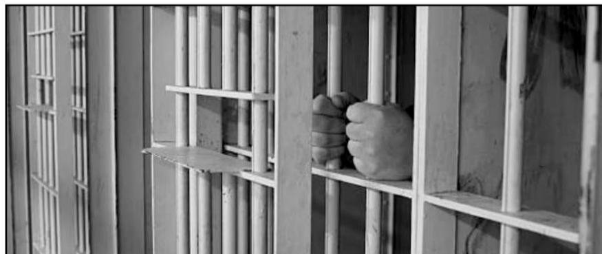
El traslado incluyó vuelos, convoyes terrestres y vigilancia de fuerzas federales y estatales.

Este aseguramiento representa una afectación económica de más de 29 millones de pesos, lo que debilita la estructura financiera y operativa de las organizaciones delincuenciales, aseguró la Secretaría de Marina en un comunicado.