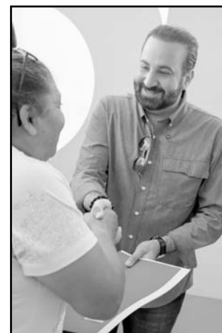
El programa busca facilitar la planeación patrimonial y acercar servicios jurídicos.

ofrecerse de manera gratuita. "Mucha gente cree que es un trámite más, pero la verdad es que tener las cosas en orden en vida, da tranquilidad a uno mismo, a nuestras familias; un testamento lo da y nos pone en orden. Para nosotros es un placer poder servir, dar este tipo de servicios y apoyos, que es regresar lo que los ciudadanos en impuestos pagan y nosotros poderlo transmitir en servicios de este tipo", comentó. (ATT)