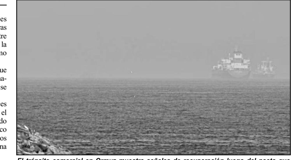
El tránsito comercial en Ormuz muestra señales de recuperación luego del pacto que busca poner fin al conflicto regional.

En el marco del acuerdo de paz entre Estados Unidos y México, el principal negociador de Irán, Mohamad Baqer Qalibaf, declaró ayer que las conversaciones con Estados Unidos seguirán estando limitadas