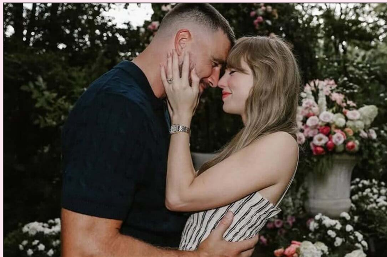
La pareja ha solicitado a los encargados del evento requisitos específicos durante la celebración de la boda.