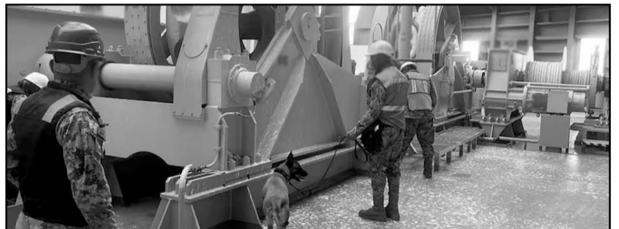
Cinco ciudadanos ecuatorianos fueron detenidos tras el hallazgo.