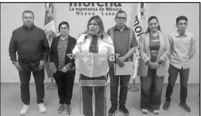
El partido realizará registros en línea y presenciales como parte de su estrategia.