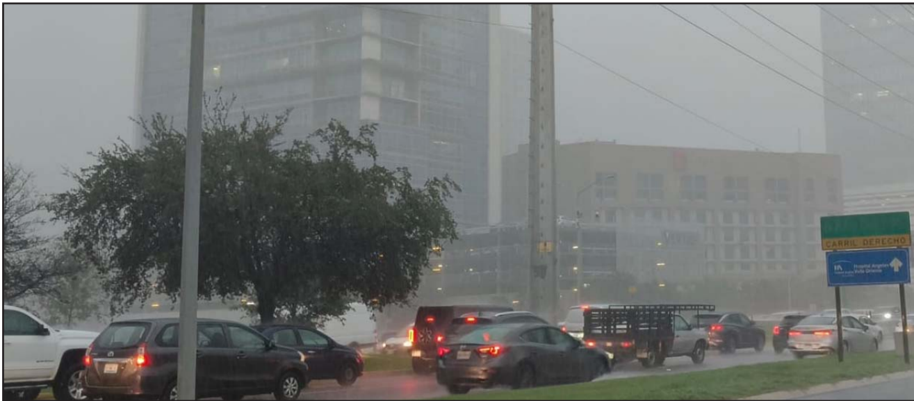
Como cada vez que llueve, cientos de calles quedaron bajo el agua en toda la Ciudad.