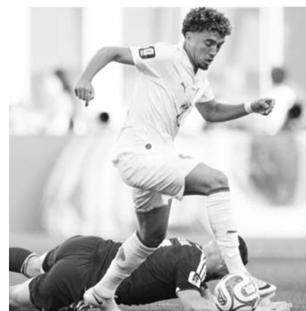
Marruecos es segundo del grupo.

Habían pasado tan solo 71 segundos, pero el equipo dirigido por Mohamed Ouahbi demostró desde la primera jugada que el empate contra Brasil no fue ninguna sorpresa: después de alcanzar las semifinales en Qatar 2022, los Leones del Atlas vuelven a ir muy en