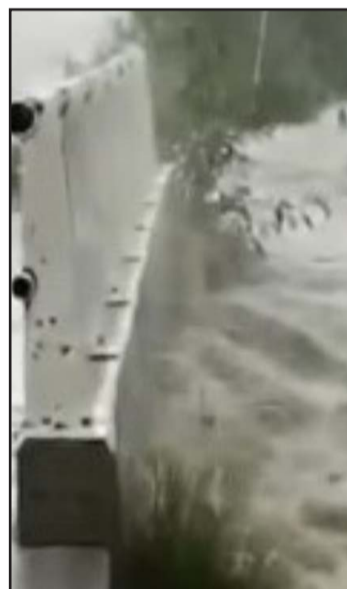
La lluvia fue muy intensa.

Personal de Protección Civil de Guadalupe en coordinación con elementos estatales, buscan a persona que fue arrastrada por la corriente de agua en el Río La Silla.