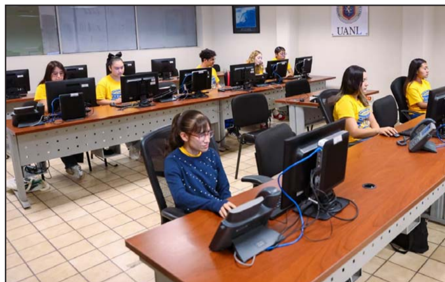
El centro opera con turnos rotativos de 7:00 a 24:00 horas, aunque se tiene previsto que la atención sea las 24 horas del día mientras dure el torneo.

Para garantizar la precisión en situaciones críticas, los grupos son super-