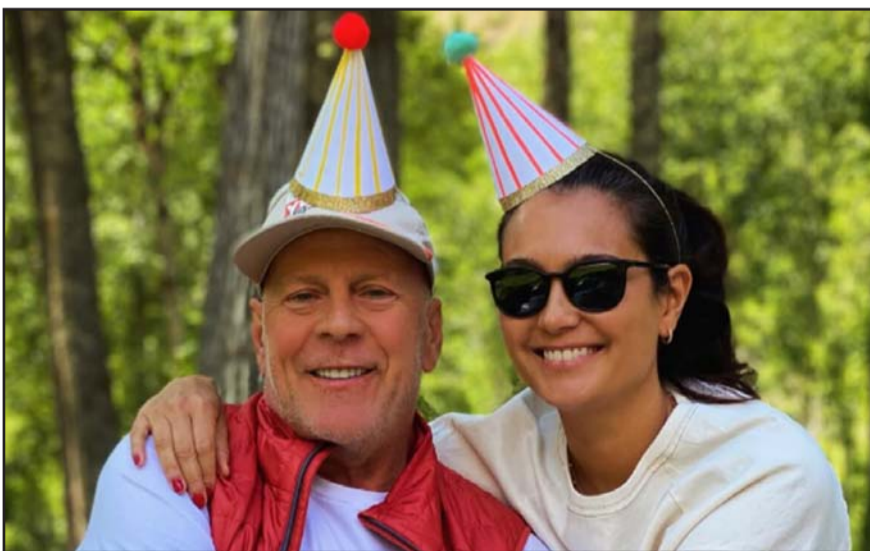
Bruce Willis, una de las grandes estrellas de Hollywood.

En su mensaje de cumpleaños, Emma expresó que su deseo para esta nueva década es lograr un futuro con mayor apoyo, recursos y esperanza para las familias que enfrentan la demencia, además de reducir el estigma alrededor de esta condición.