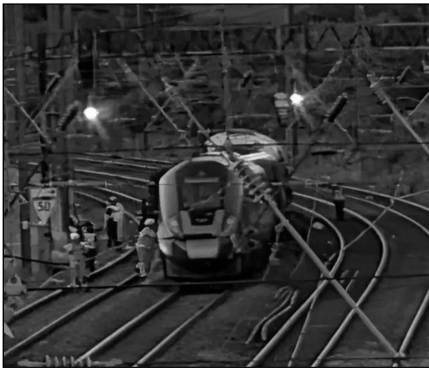
Las autoridades han informado de un total de 89 heridos con diversa gravedad en sus lesiones.