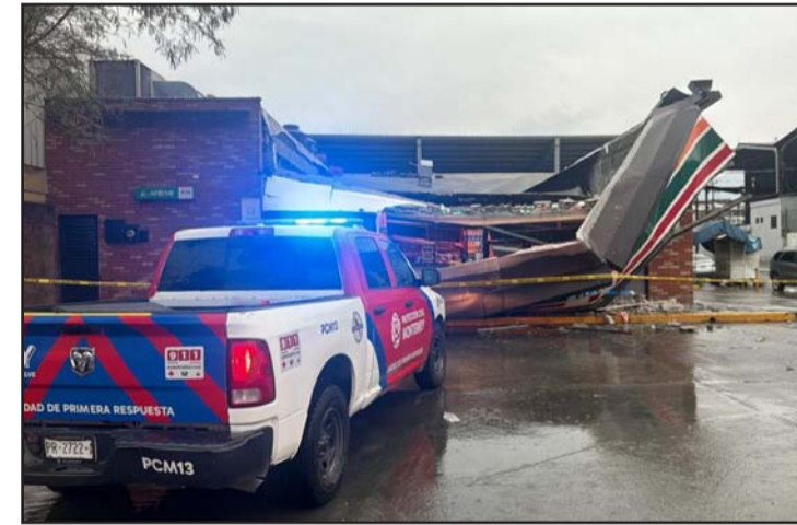
No hubo víctimas mortales tras el incidente.

Los paramédicos entrevistaron al personal de la tienda de conveniencia, a quienes les