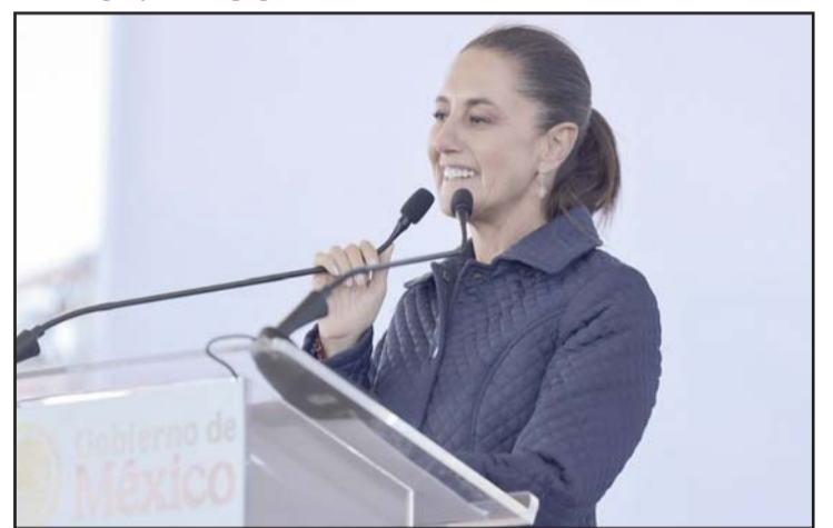
La mandataria federal supervisó acciones del Plan de Justicia para San Quintín.

Desde la Universidad Intercultural de Baja California y acompañada por la gobernadora Marina del Pilar Ávila Olmeda, la presidenta Claudia Sheinbaum destacó que el plan contempla 36 mil apoyos de 40 mil pesos para mejora de vivienda, un hospital general con 80 camas que brindará servicio sin importar la derechohabencia.