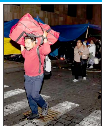
La Sección 22 acordó retirar a sus bases del Zócalo.

La ANR tiene la tarea de formalizar la decisión sobre el receso del paro nacional y definir la ruta política y organizativa que seguirá la CNTE en las próximas semanas.