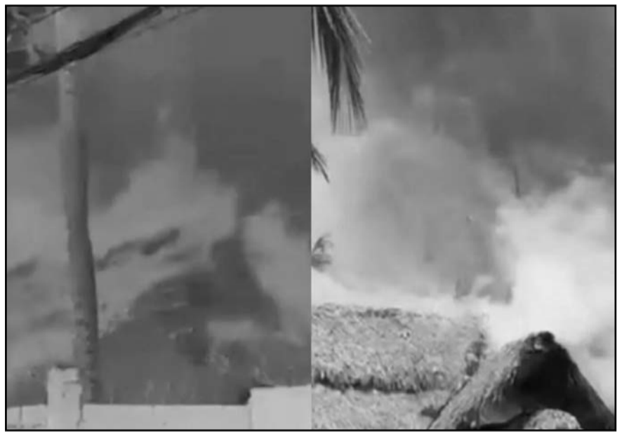
De acuerdo con el Centro de Operaciones de Emergencias (COE), el siniestro dañó parte de las instalaciones del complejo.

Los lesionados presentaron síntomas como inhalación de humo, mareos, náuseas, palpitaciones y debilidad general, condiciones asociadas tanto a la exposición al calor como al esfuerzo físico realizado durante la emergencia.