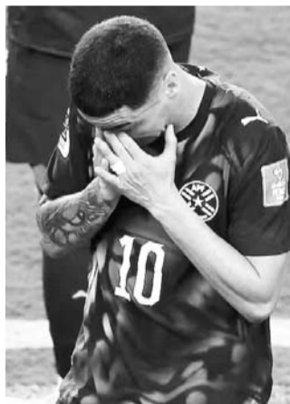
Miguel Almirón, de Paraguay.

Almirón le dijo algo al lateral derecho turco Mert Müldür y se tapó con su mano la boca, por lo que rápidamente los jugadores de Turquía pidieron que el VAR revisara lo ocurrido.