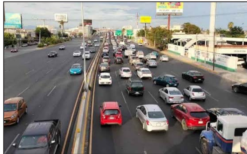
Se juntarán la Marcha de la Diversidad con el duelo Japón-Túnez.

Este panorama de saturación no resulta ajeno a los habitantes de la ciudad, quienes apenas esta misma semana han enfrentado retos severos derivados de tormentas intensas y granizadas que provocaron inundaciones, cierres de avenidas clave y fallas en el suministro eléctrico en di-