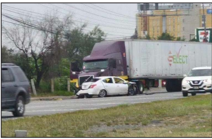
Fue un choque entre un tráiler y varios vehículos.