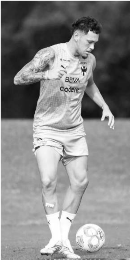
Monterrey sigue en su pretemporada.

Los Rayados están cerca de cumplir dos meses de haber jugado su último partido, en menos de un mes debutarán en el torneo Apertura 2026 y aún no se han hecho de refuerzos.