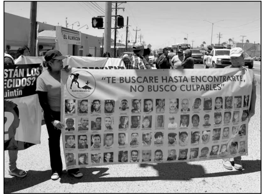
Colectivos denuncian que Baja California enfrenta miles de desapariciones y cuerpos sin identificar.

"Sabemos que ella no es responsable de la creación de esa Ley del 2007, pero ahorita tiene todas las posibilidades de poder buscar una ruta y alternativa para poder salir de este problema. Es lo que solicita el magisterio, que se haga de manera paulatina, que no se detenga también las ganas de querer