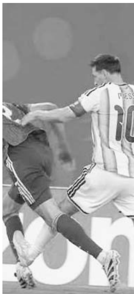
Messi hizo esta entrada artera.

era en que nos apoyaron y celebraron la victoria me emocionó mucho. Hubo una conexión perfecta entre el equipo y la afición", consideró.