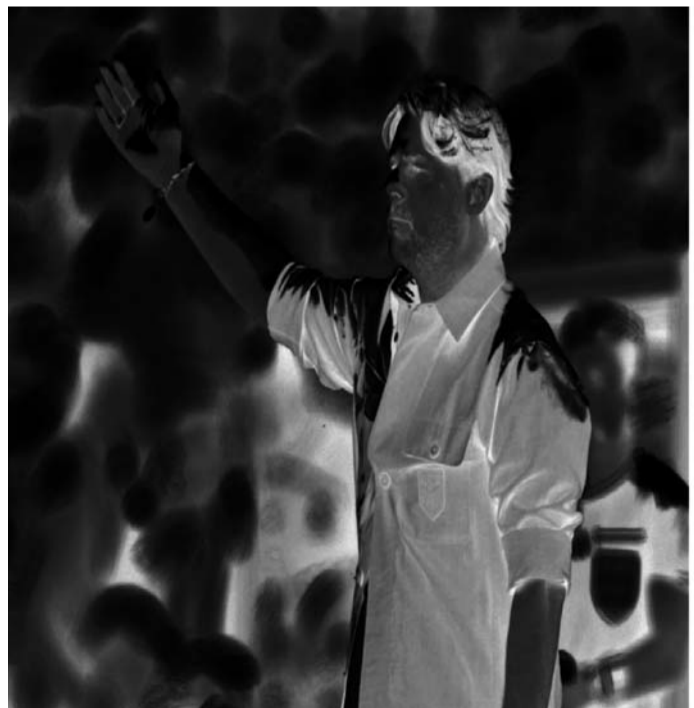
Mauricio Pochettino, técnico de Estados Unidos.

"Incluso sin ser estadounidense, después del partido estaba muy sensible porque el apoyo fue increíble. Los aficionados estuvieron increíbles: la man-