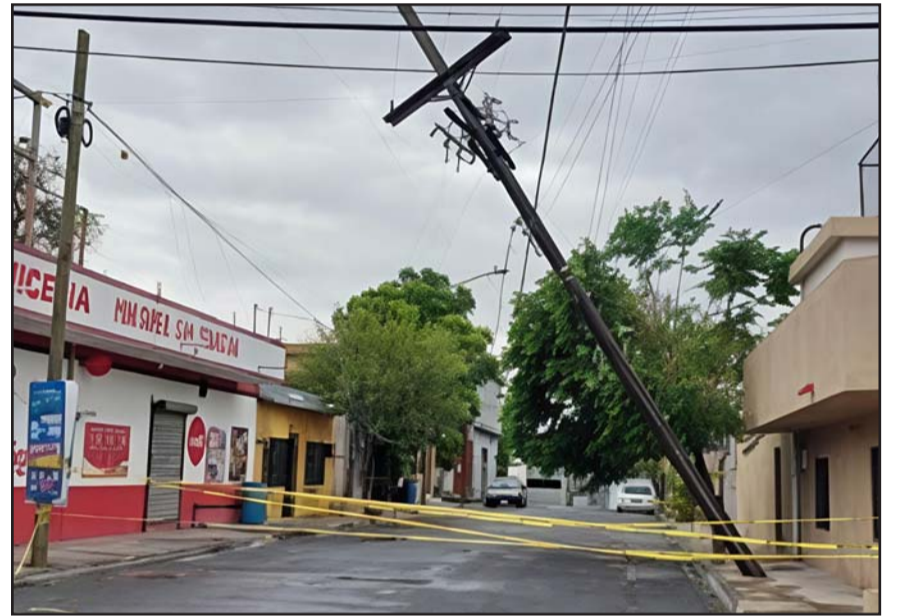
La tormenta ocasionó graves daños en el sistema eléctrico.

Asimismo se aconseja contar con una reserva de agua potable.