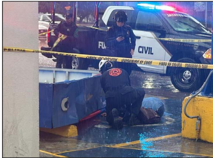
Los hechos se registraron en San Nicolás.

panorámico se desprendió y antes de caer a la carpeta golpeó a la persona, ocasionándole la muerte.