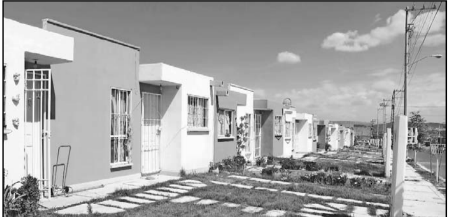
El proyecto contempla una inversión superior a 9 mil 500 millones de pesos y beneficiará a miles de trabajadores.