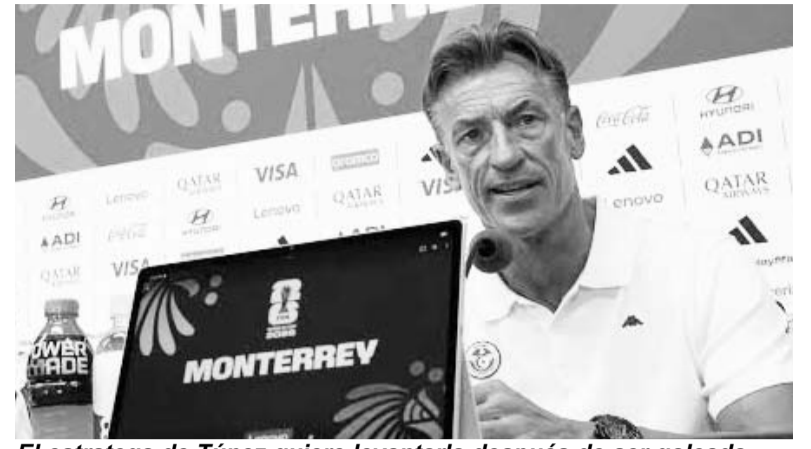
El estratega de Túnez quiere levantarla después de ser goleada.

Hervé Renard, el nuevo técnico de Túnez tras la destitución de Sabri Lamouchi, consideró que la unión como equipo será clave para competir de la mejor forma posible ante Japón en la fase de grupos del Mundial y aspirar a un triunfo que les mantenga con sus aspiraciones de clasificar a los 16vos de final del Mundial, por lo que vio ese duelo como "una revancha" luego de la goleada que sufrieron contra Suecia.