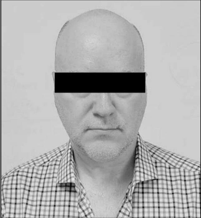
El proyecto inmobiliario por el que se investiga al detenido nunca se concretó.

Esta semana elementos de la Agencia Estatal de Investigaciones (AEI) ejecutaron una orden de aprehensión en contra de Gabriel "N", de 51 años de edad, por su presunta responsabilidad en el delito de fraude relacionado con una inversión inmobiliaria por 20 millones de pesos. Dicho ello la detención fue realizada el pasado 18 de junio en la colonia Residencial Chipinque, en el municipio de San Pedro Garza García. Donde los detectives adscritos a la Coordinación General de Aprehensiones de la Fiscalía General de Justicia de Nuevo León llevaron a cabo estas acciones. Esto se deriva del caso del pasado mes de mayo del año 2018, cuando el ahora detenido habría convencido a un inversionista de participar