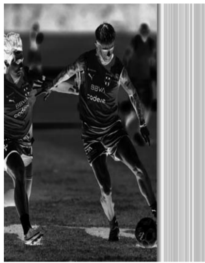
Orellano iría de titular.

La escuadra regia volverá a la ciudad el lunes y su debut en el Apertura 2026 va a ser el próximo 18 de julio cuando enfrenten al Santos en el estadio Monterrey. (AC)