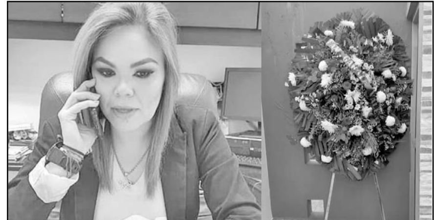
La diputada promovió un amparo después de encontrar una corona fúnebre frente a su domicilio.

Con respecto a la mención del supuesto secuestro del que fue víctima en 2021 y que el abogado sugiere que lo menciona hasta ahora porque tiene aspiraciones políticas, la diputada local dijo que no presentó denuncia ante la Fiscalía del Estado en ese momento porque "no hubo autoridad que me la quisiera recibir y sobre todo porque fui amenazada por el entonces gobernador para no hacerlo".