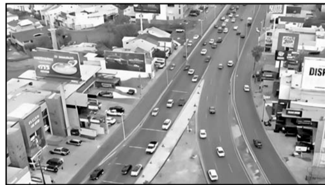
A partir del lunes 22 de junio, el carril reversible de Paseo de los Leones extenderá su recorrido hasta nueve kilómetros.

ba, los conductores que habitualmente transitan desde la calle Sevilla hacia Leones deberán seguir una ruta alterna: deberán dirigirse al oeste hasta la avenida Richard L. Byrd, continuar por Pedro Infante y posteriormente realizar su incorporación al sentido oriente de Paseo de los Leones. La Secretaría de Seguridad y Protección a la Ciudadanía desplegará agentes de tránsito a lo largo de toda la zona intervenida para orientar a los usuarios y supervisar el