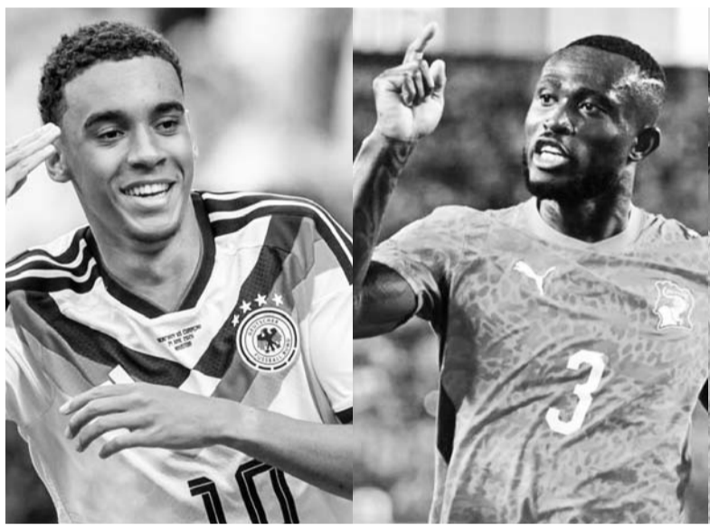
Alemania, a ver si es cierto ante los marfileños.

"Te permite apreciar toda la historia del tomo: los mejores partidos y los mejores jugadores que escribieron los capítulos más increíbles en la historia de la Copa Mundial (de la FIFA)", concluyó. (AC)