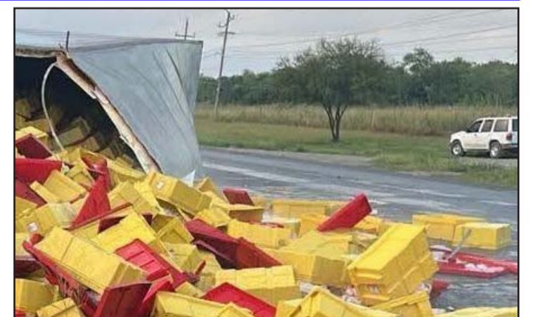
Ocurrió en la Carretera Nacional.

Por otro lado, un choque volcadura dejó una mujer lesiona-