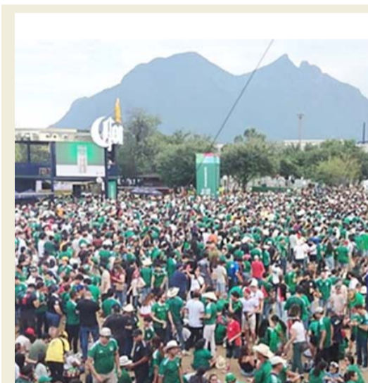
La gente se quedó con las ganas.