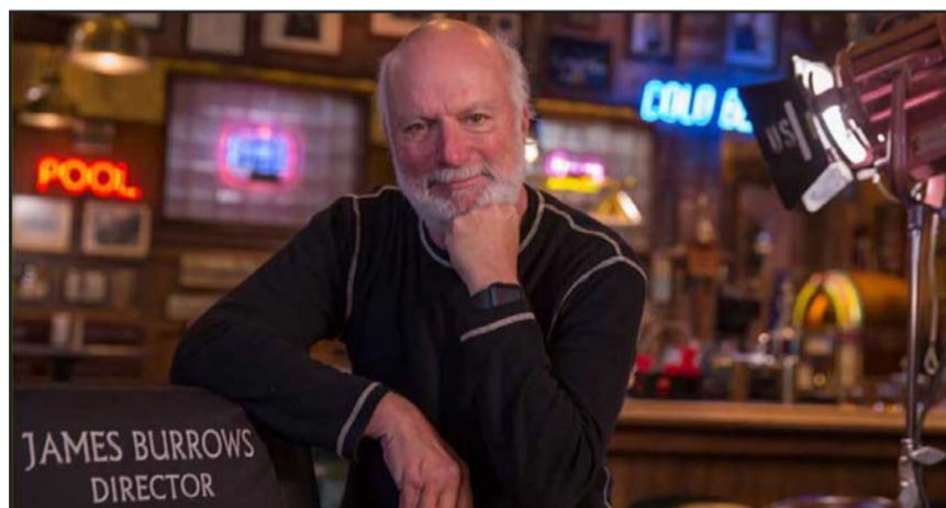
James Burrows inició en el mundo del entretenimiento como asistente de dirección escénica en 1967.