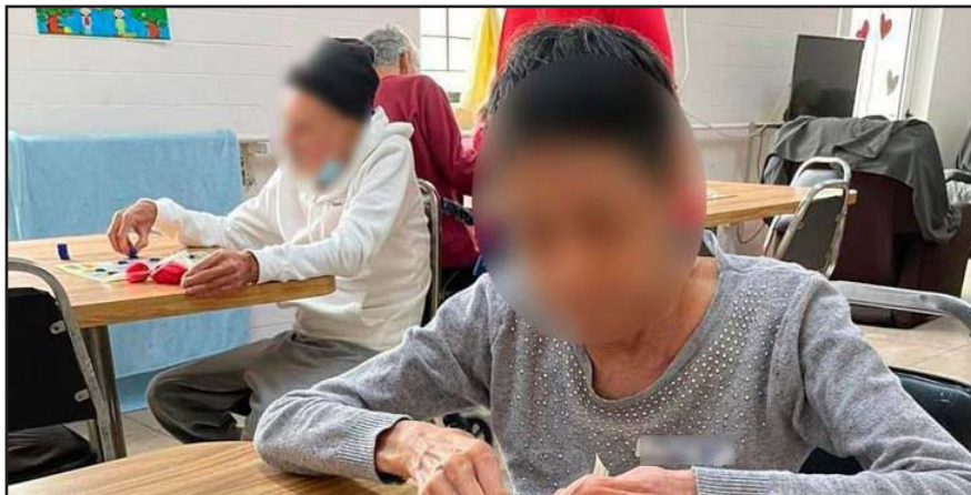
La resolución judicial marca un precedente en la protección a los adultos mayores.