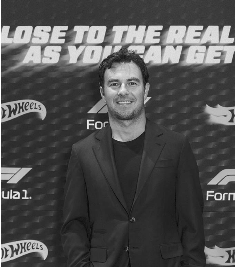
Pérez tendrá a partir del próximo lunes en Cadillac los primeros test de pretemporada previo a la próxima temporada de Fórmula 1.