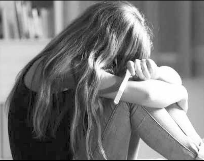
Métodos de planificación familiar son parte de la estrategia.

Pero mientras son peras o manzanas, hay trabajos a medio terminar y que se aprecian por lo que vale parar oreja.