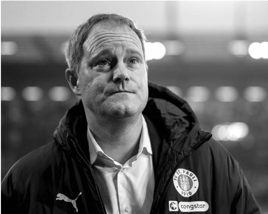
Oke Göttlich, presidente del club de la Bundesliga, St. Pauli

Las declaraciones de Göttlich vienen en un momento de tensión entre Estados Unidos y algunos países europeos por el tema de Groenlandia, por lo que se espera que de esto hayan más novedades con el pasar de las horas.