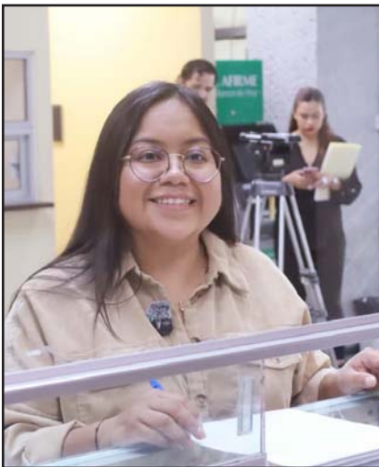
Diputada Marisol González

Asimismo, se establecen límites a la operación de este tipo de hospedaje, con un máximo de 180 noches por año y estancias continuas no mayores a 90 días, además de lineamientos en materia de seguridad, atención de quejas y comunicación con vecinos. A partir del tercer inmueble registrado, los propietarios deberán cumplir con los permisos y usos de suelo correspondientes.