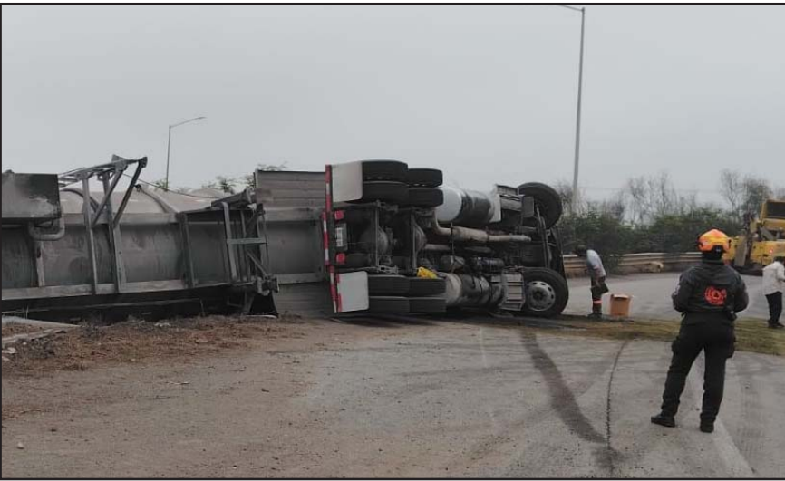
Ocurrió en el municipio de Apodaca.

La caja de un tráiler quedó volcada en un tramo ferroviario de la colonia Lázaro Cárdenas en el municipio de Escobedo, luego de ser impactada por el ferrocarril.