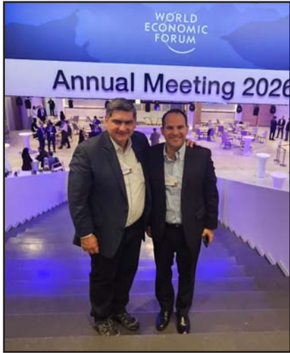
Bajo el lema “Espíritu de diálogo”, Davos 2026 se celebró del 19 al 23 de enero.