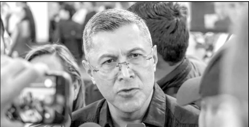
La difusión podría buscar inquietar a la población, señaló SSP.

etud o temor entre la sociedad, ante los casos recientes, de asesinatos de elementos policíacos, como sucedió el jueves pasado. Sobre los asesinatos que se han registrado contra miembros de diversos cuerpos de policía, indicó que sus actividades implican riesgos, pero, pese a ello, las fuerzas federales y estatales y municipales que participan en los diversos operativos van a continuar.