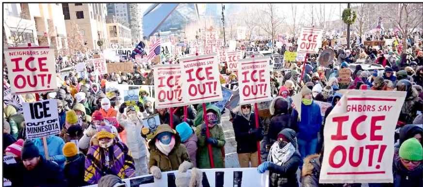
El niño migrante fue utilizado como cebo para detener a sus padres.