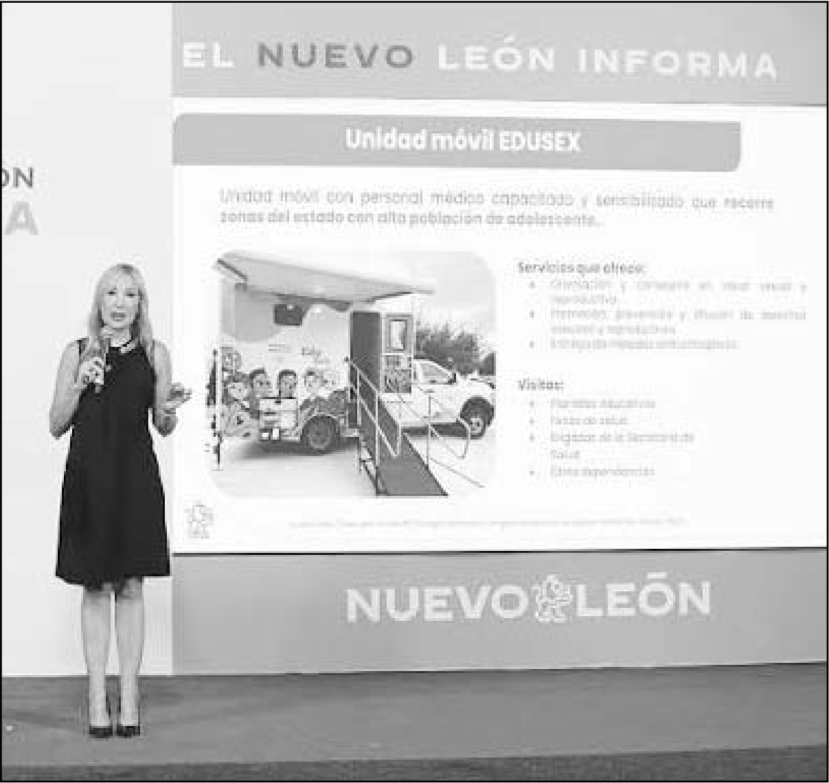
Los nacimientos en términos absolutos han disminuido un 25 por ciento.

“Quisiéramos tener cifras mucho más bajas, menores, pues deberíamos de estar en ceros, estamos trabajando y buscando