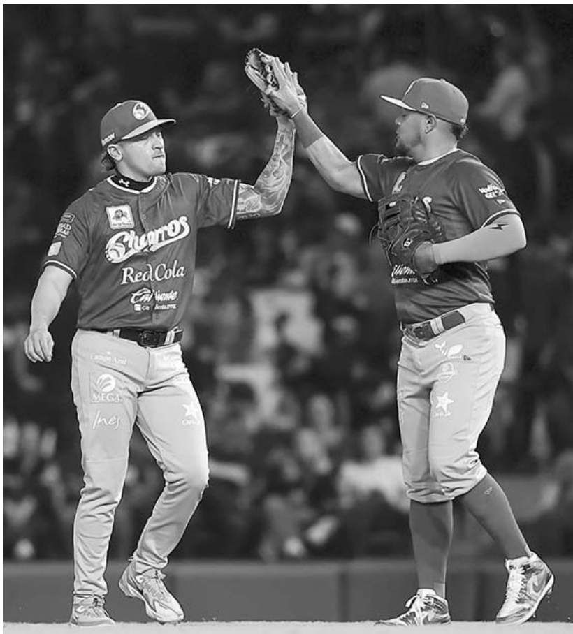
El conjunto tapatío se encuentra a dos victorias de alzar el título

El encuentro entre Alexander Zverev y Francisco Cerundolo será a partir de mañana, en horario por definir.