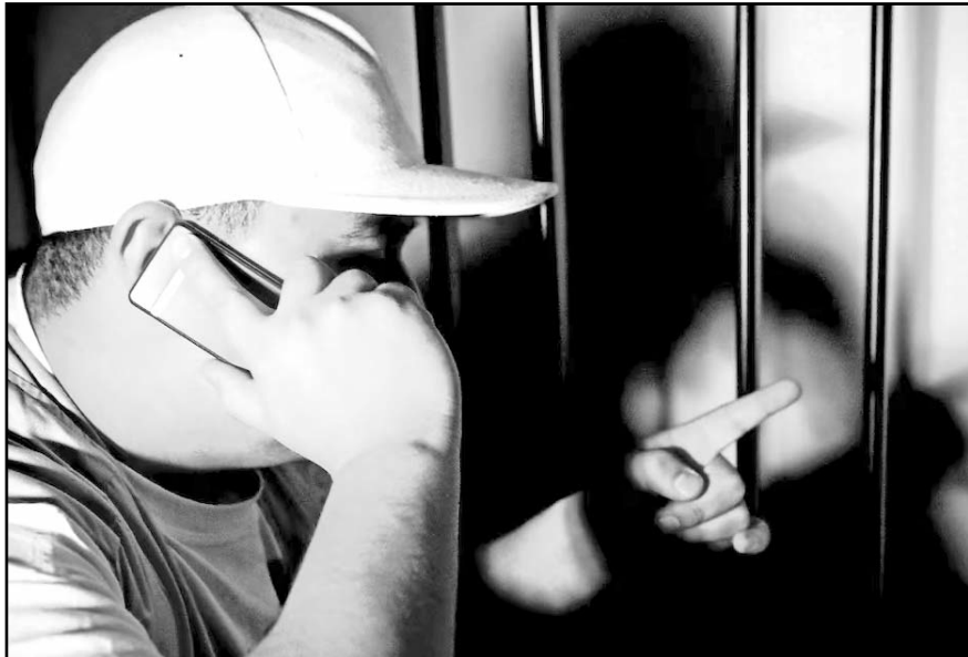
Mediante denuncias al 089 y coordinación con telefónicas, se canceló más del 90% de las llamadas fraudulentas.

"El objetivo es que haya más seguridad y que se use menos el teléfono para la comisión del delito", afirmó.