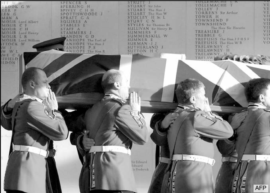
Reino Unido destacó el despliegue de más de 150 mil soldados y la pérdida de 457 efectivos, rechazando que se minimice su papel militar.

Entre los otros aliados de la OTAN, Canadá perdió 158 soldados en Afganistán, Francia lamentó la pérdida de 89, y Dinamarca tuvo 44 soldados muertos, 37 de ellos en combate, Polonia perdió a 43 efectivos.