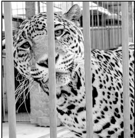
Los animales eran mantenidos de forma irregular en un inmueble.

Dos guacamayas verdes, tres pericos, un jaguar negro, un jaguar amarillo y un mapache fueron recuperados y trasladados a