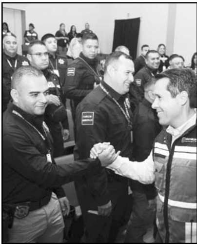
El alcalde felicitó a los elementos

La ciudad nicolaíta también se mantiene entre las más seguras del país, con el quinto lugar a nivel nacional y el segundo a nivel local, pues el 72.5% de los nicolaítas señalan sentirse seguros en San Nicolás. Con la estrategia de seguridad, que incluye la integración de nuevos elementos, capacitación constante, equipamiento moderno, inclusión de nuevas tecnologías como drones, la administración de Carrillo Martínez , ha logrado que ocho de cada 10 habitantes se perciban seguros mientras realizan sus actividades diarias. Carrillo Martínez, aseguró que esto es resultado de una estrategia con-