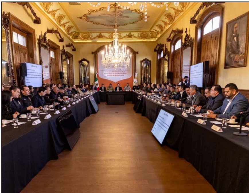
Según la encuesta de la ENSU de INEGI se alcanzó una calificación de 76.4 puntos