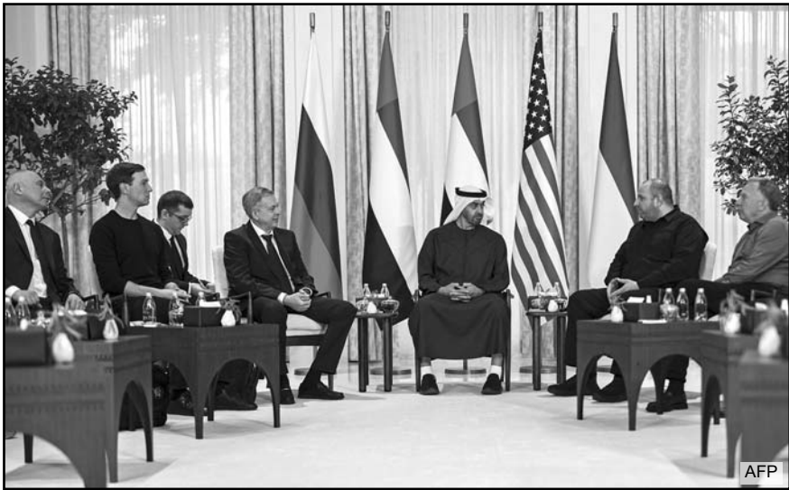
Rusia, Ucrania y Estados Unidos celebraron en Abu Dabi sus primeras negociaciones directas.

Cuando estaba a punto de ser detenido por la Policía canadiense, Wedding huyó a México desde donde ordenó el asesinato de varias personas y dirigió su red de narcotráfico.