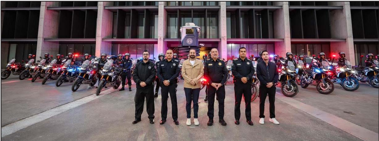
De acuerdo la encuesta del INEGI el 91.3 por ciento de la población sampetrina se siente segura en su entorno.