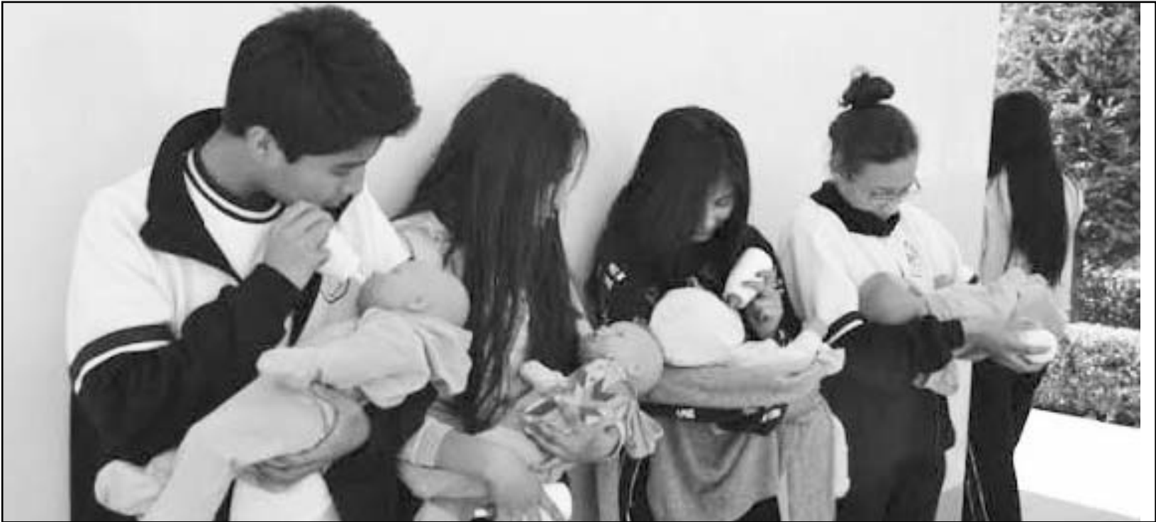
El llamado a las autoridades de salud es a intensificar las medidas de prevención para continuar con esta tendencia a la baja.