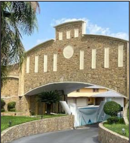
Pudo ser una muerte natural.