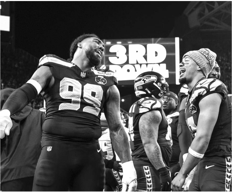
Seattle es, en su mayoría de los apartados en defensa y ataque, el mejor.

En el apartado de la mejor defensa en promedio de puntos permitidos por encuentro, ahí lideró Seattle en esta postemporada con apenas seis, aunque después le siguió Nueva Inglaterra con 9.5, posteriormente continuó Carneros con 24 y en el último sitio se encontró Denver con 30, así como también los Halcones Marinos fueron la mejor defensa en la cantidad de ceros que colgaron en cada uno de los períodos que jugaron ya que no permitieron puntos en tres de cuatro ante San Francisco en la ronda divisional, en el 75 por ciento de las ocasiones, mientras que después le siguió Nueva Inglaterra que conservó el cero en el 50 por ciento de las situaciones posibles, en cuatro de los ocho cuartos que disputaron ante Cargadores en la ronda de comodines y Houston en el divisional, pero después continuó Carneros que conservó el cero en cuatro de los ocho cuartos que jugaron contra Carolina y Chicago, en el 50 por ciento de las oca-