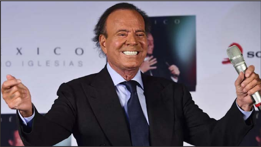
La decisión se sustentó en la falta de jurisdicción y competencia de los tribunales españoles para conocer los hechos.

Finalmente, el abogado reclamó acceso al expediente para ejercer la defensa y demostrar, según sus palabras, la falsedad de las acusaciones y proteger el honor del cantante frente a lo que calificó como una campaña mediática abusiva.