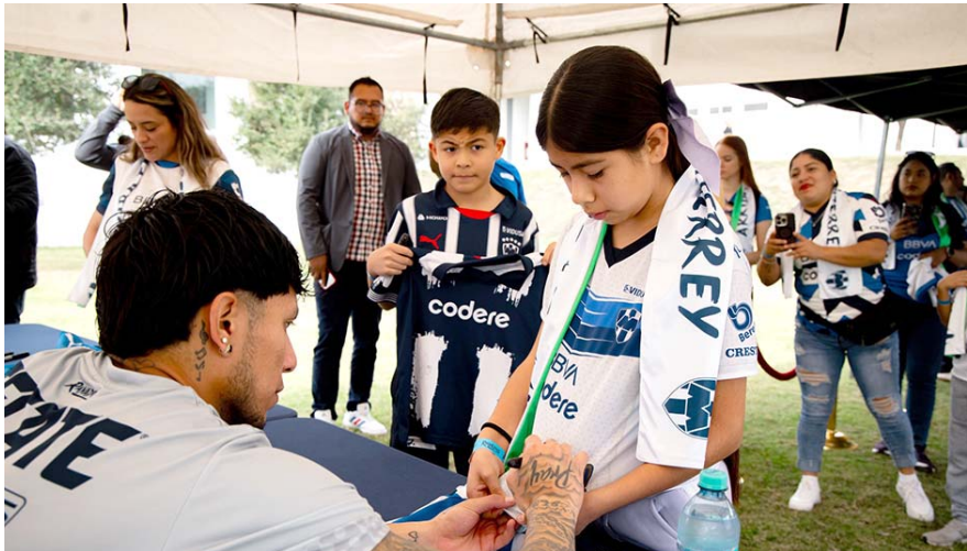
Posterior a la práctica los jugadores tuvieron una convivencia con la afición albiazul, con quienes se tomaron fotos y les brindaron autógrafos.