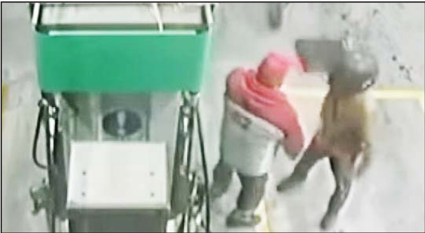
Los atracadores viajaban en una motocicleta.

Mientras que su cómplice que viajaba en la parte trasera, vestía pantalón