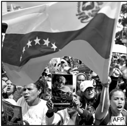
Familias acusan lentitud en el proceso de liberación anunciado.

ayer salió en conmemoración de la caída de la dictadura militar de Marcos Pérez Jiménez en 1958 y con el reclamo persistente de ver libres a Maduro y su esposa.