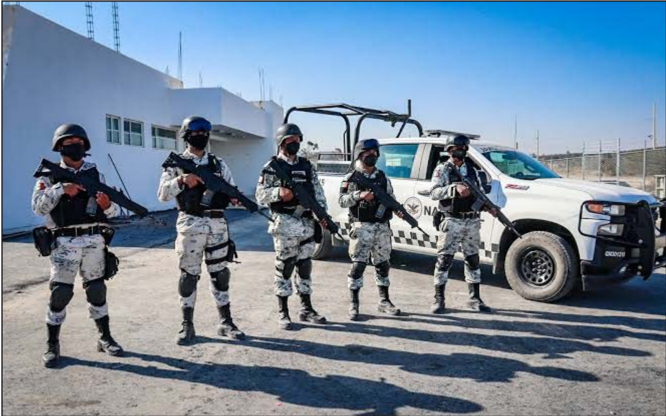
Se anunció que con eso se reforzarán las acciones de seguridad y prevención del delito