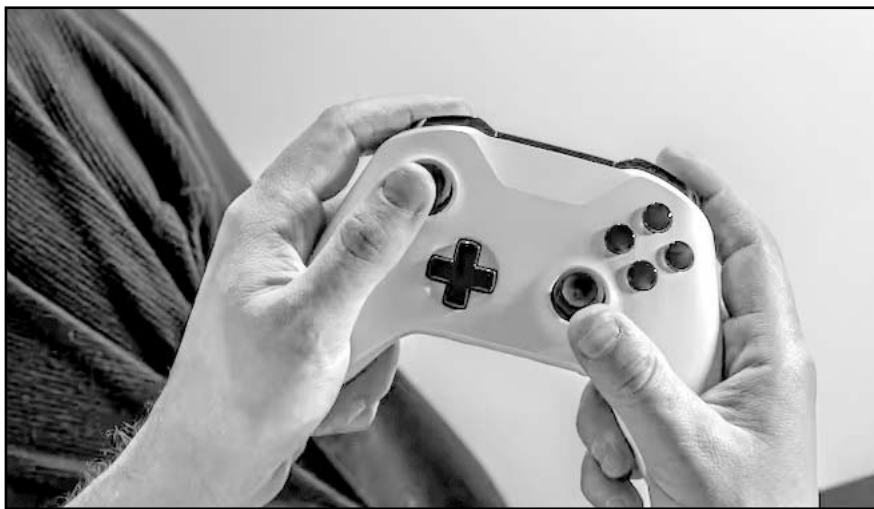
El impuesto de 8% fue aprobado en noviembre pasado.

Frente a este panorama, Protección Civil reiteró el llamado a la población a reforzar medidas de autoprotección. Entre ellas, abrigarse con varias capas de ropa para enfrentar el frío extremo, proteger tuberías expuestas y garantizar ventilación adecuada en caso de utilizar calentadores de gas o leña para evitar intoxicaciones por monóxido de carbono.