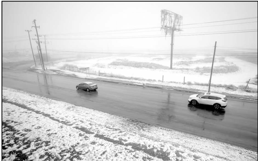
Protección Civil alertó por la interacción de tormenta invernal, frente frío y aire ártico, que provocará frío extremo y nevadas.

La CNPC alertó que el riesgo en carreteras aumentará de manera significativa la noche del sábado en Coahuila, debido al pronóstico de lluvia engelante, fenómeno que congela de forma inmediata la superficie del asfalto. Además, se esperan nevadas o caída de aguanieve en sierras