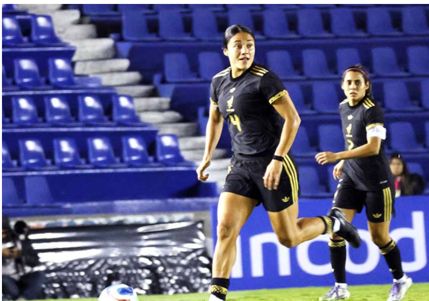
El club que se consagre campeón del torneo intercontinental recibirá aproximadamente 39.1 millones de pesos mexicanos

En total, la FIFA distribuirá casi 68 millones de pesos mexicanos entre los seis equipos que tomarán parte en esta primera edición.