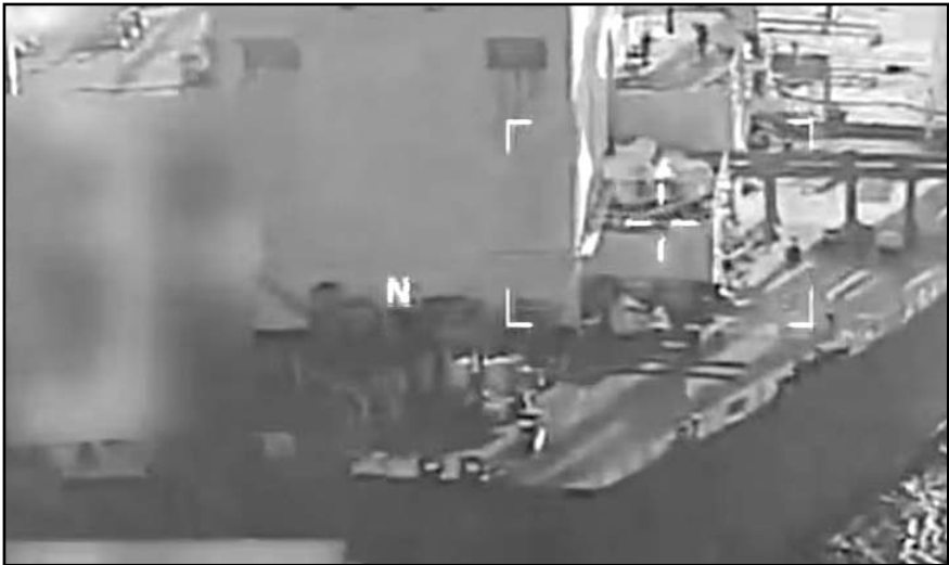
El Depto. Tesoro señaló que los ingresos del petróleo se desvían a financiar represión interna, grupos armados y programas armamentísticos de Irán.

"Estamos sinceramente interesados en una solución del conflicto por medios político-diplomáticos", aseguró Ushakov. Pero, "mientras no sea así, Rusia seguirá alcanzando sus objetivos (...) en el campo de batalla", añadió.