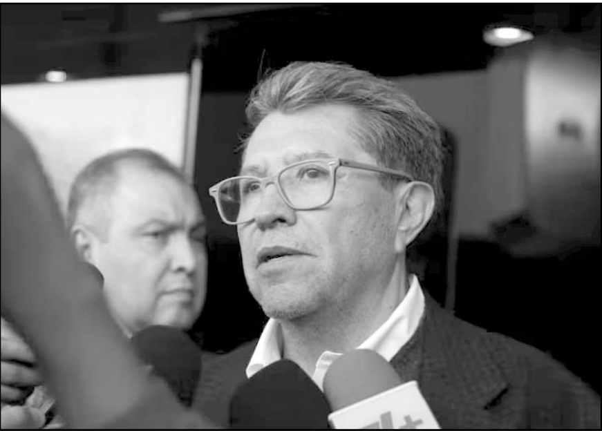
Ricardo Monreal advirtió que el proyecto de ley de Sheinbaum no avanzará sin el respaldo de los partidos aliados en la Cámara Baja.