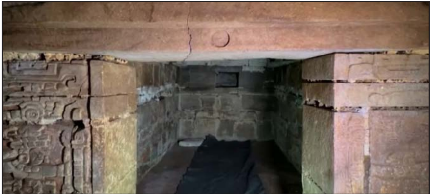
Este descubrimiento se debió a una denuncia anónima por saqueo.

Por dentro, una cámara contiene un friso sobre un dintel de diferentes lapidas de piedra grabadas con nombres calendáricos, y al fondo una cámara funeraria con procesión de personajes.