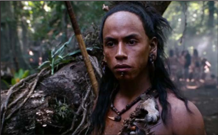
Ha enfrentado problemas legales recurrentes que han opacado su trayectoria, este arresto se suma a un historial turbulento.

toria, este arresto se suma a un historial turbulento: en octubre de 2025 fue detenido en Texas por asalto tras un incidente en un muelle donde lo esposaron por agredir a un familiar impidiéndole la respiración, y en 2017 por conducta desordenada en un casino de Miami bajo influencia del alcohol, según reportes policiales.