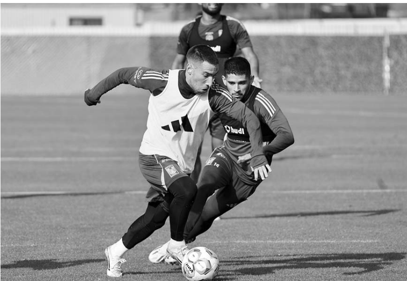
Los felinos han disputado tres partidos donde le marcaron dos goles al San Luis, aunque antes no le generaron tantos a Pumas y Toluca.