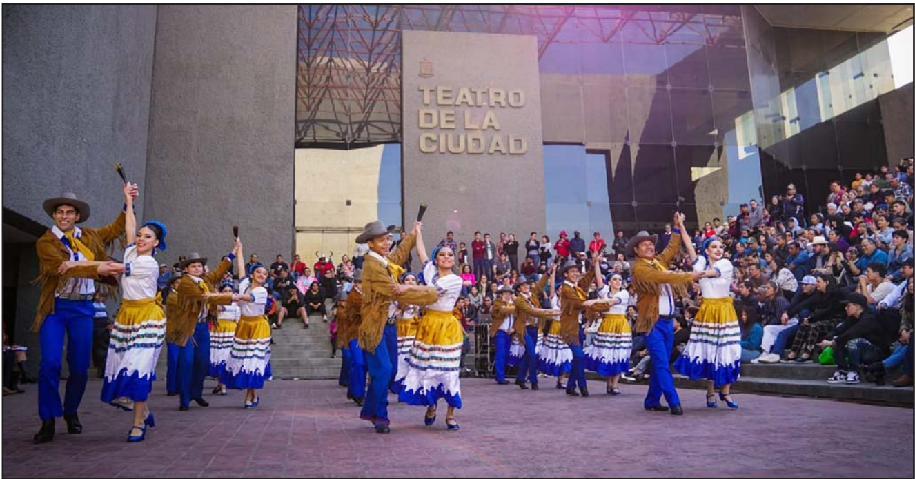
El homenaje será el domingo 25 de enero en el Escenario al Aire Libre del Teatro de la Ciudad con entrada gratis.