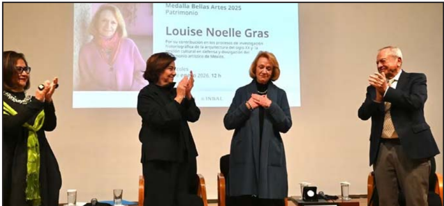
La académica del Instituto de Investigaciones Estéticas de la UNAM se ha dedicado a la investigación de la arquitectura mexicana del siglo XX.

Con su participación, el Grupo Educativo Tecnológico de Monterrey reafirma su compromiso con el liderazgo académico global, la innovación responsable y la transformación del mundo a través de la educación.