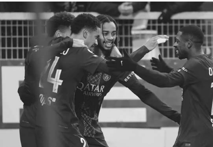
París Saint Germain superó 1-0 de visitante al Auxerre