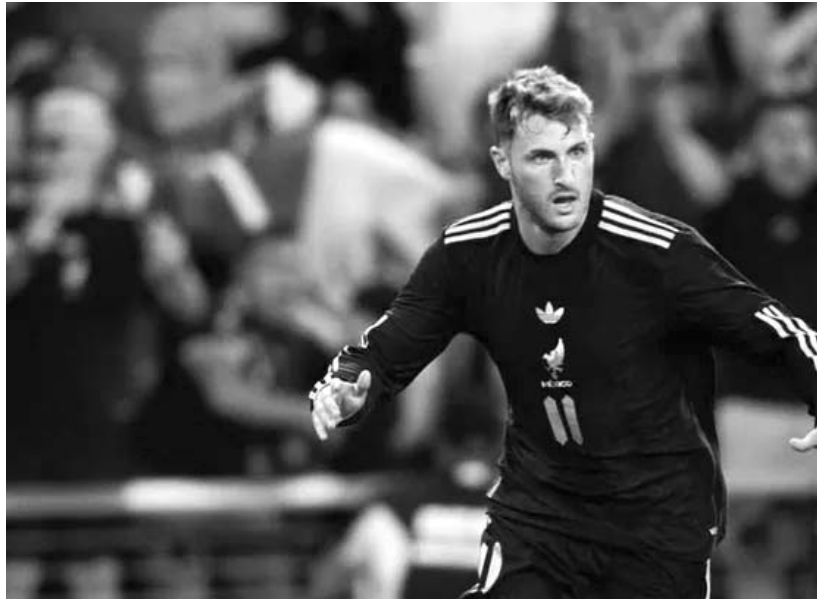
“Creer no cuesta nada y soñar tampoco; ahora hay que llevarlo a la práctica y contagiar a la gente”

De esta forma, Tigres está afrontando una clara crisis goleadora en pleno 2026, por lo que solamente quedará esperar a ver si la logran solucionar en algún momento del torneo Clausura, esperando que así sea desde el sábado cuando visiten al León en la fecha cuatro de la Liga MX.