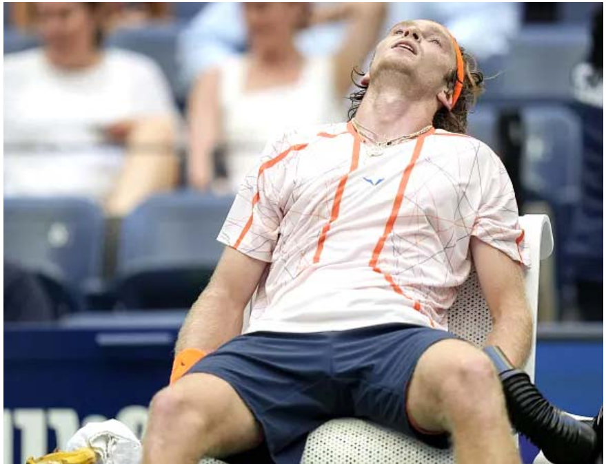
El calor extremo obligó a suspender brevemente la actividad sabatina en el Abierto de Australia.