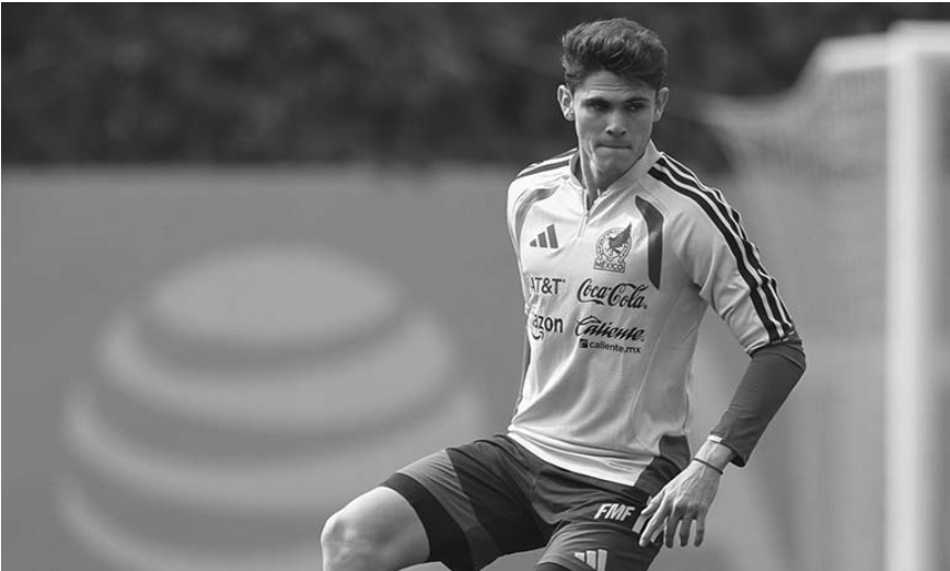
La Selección Mexicana entrenó ayer en Panamá luego de su partido amistoso frente a los canaleros

Ayer se dio a conocer el plantel de la Selección Mexicana Sub-17 que com-