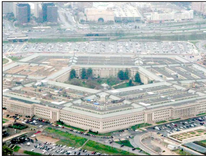
La Unión Americana advirtió que actuará sola si sus 'socios' no combaten al narcotráfico.

En la Estrategia, agregó que "nos relacionaremos de buena fe con nuestros vecinos, desde Canadá hasta nuestros socios en Centroamérica y Sudamérica, pero nos aseguraremos de que respeten y cumplan con su parte