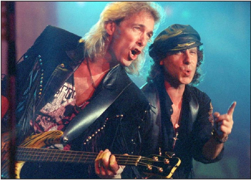
Francis Buchholz nació en Hannover en 1954, fue un bajista alemán que dedicó su vida al rock.