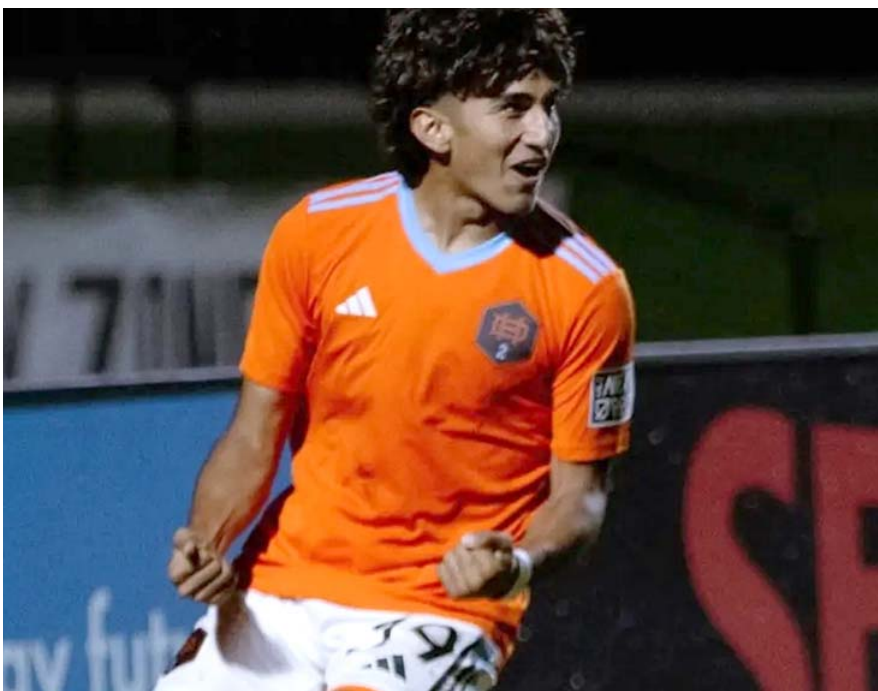
Rodríguez tiene apenas 18 años y milita en el club estadounidense Dynamo de Houston de la MLS.

Su arribo al Club de Fútbol Monterrey sería bajo la condición de préstamo por un año con opción de compra.