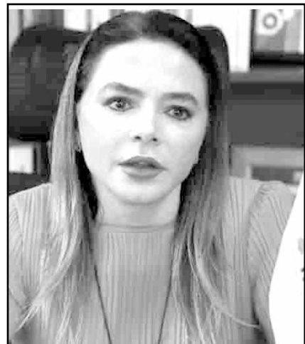
Humphrey pidió el acceso del INE a información sin secreto ministerial.

Pidió eliminar Junta General Ejecutiva Un tema que ha generado profundas diferencias entre los consejeros del instituto ha sido la reforma que en 2024 se otorgó a Guadalupe Taddei la posibilidad de nombrar sin consenso del Consejo General a los encargados.