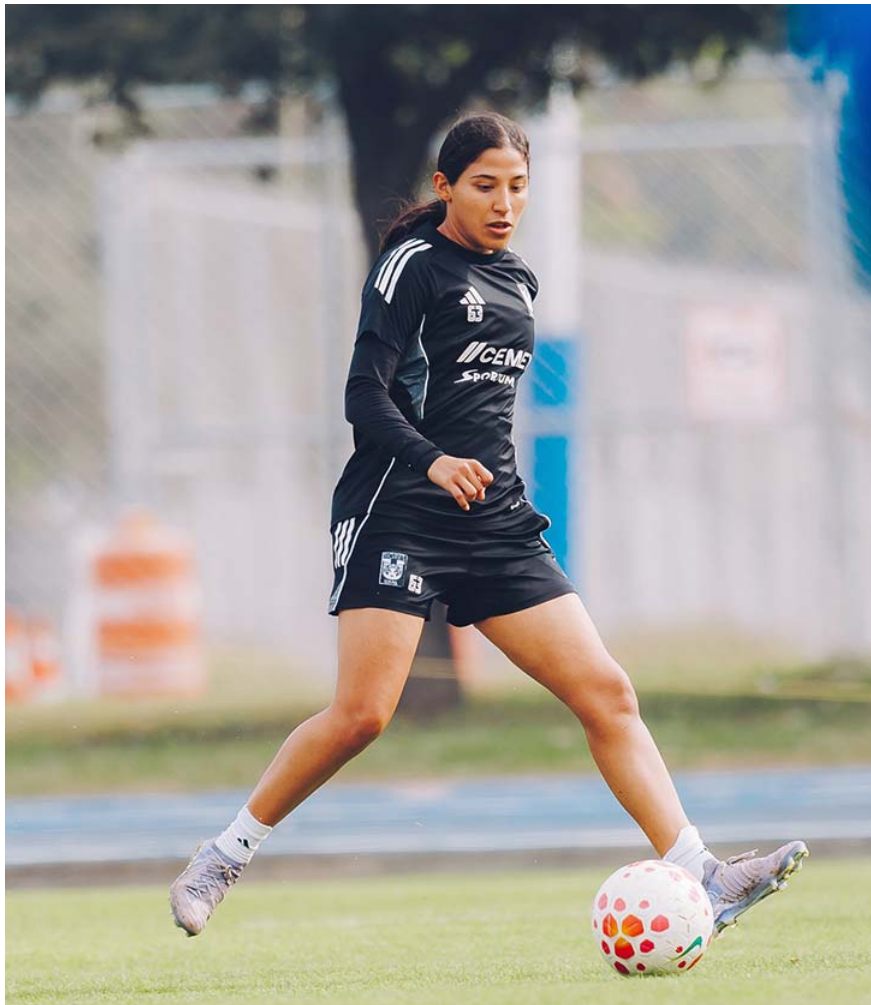
Tigres Femenil intentará mantener esta noche su invicto en el torneo Clausura 2026 cuando enfrenten en casa al Atlas de Guadalajara.

De rival tendrán a un Atlas que con un punto cosechado en cuatro jornadas