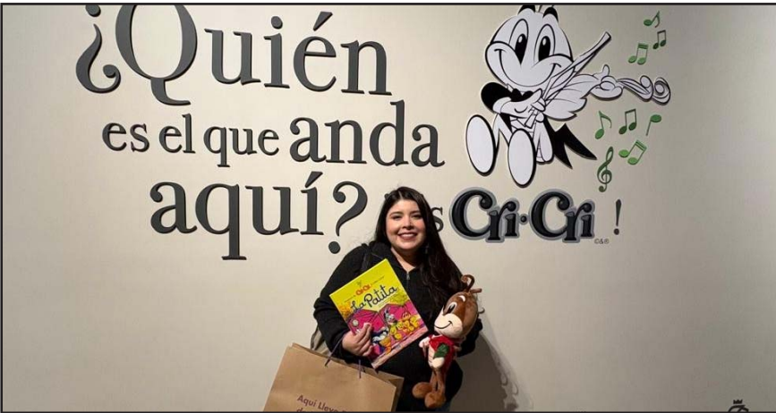
Esta exposición que cerrará sus puertas el domingo 25 de enero en el Museo del Noreste, fue inaugurada el domingo 20 de julio.

La exposición cerrará el domingo 25 de enero, ese último día la entrada será gratuita, para que el público disfrute de este homenaje a una figura fundamental de la cultura mexicana.