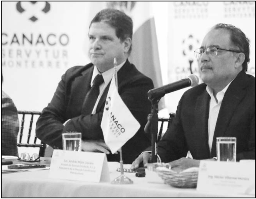
El alcalde de Escobedo explicó las ventajas de trabajar con esa propuesta

impulso a la Ley de Coordinación Metropolitana, la renovación del convenio metropolitano, el trazado de un plan integral de movilidad, la creación del Instituto Metropolitano de Planeación, así como un Programa de Ordenamiento Metropolitano con visión al 2050 y el seguimiento puntual a los acuerdos que emanen de las comisiones metropolitanas. Mijes reiteró que esta forma de trabajo conjunto coincide con la visión de la Presidenta Claudia Sheinbaum, basada en la colaboración, la planeación y el bienestar colectivo, principios que dan sustento a la 4T Norteña como una ruta para transformar Nuevo León.(CLR)