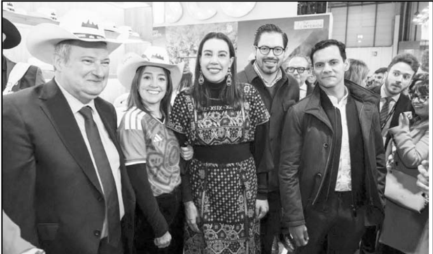
Santiago también estuvo presente en la Feria de Turismo

como motor económico, resaltando el papel clave de la colaboración entre autoridades, sector privado y actores estratégicos. En la FITUR, promueven a Monterrey como un destino importante para los negocios, para el turismo médico y este año, como sede de la fiesta por el Mundial de Fútbol. La Feria Internacional de Turismo recibe a 60 naciones y 10 mil empresas de turismo para analizar el desarrollo del sector, la promoción de la tecnología, la sustentabilidad y los diferentes tipos de visitas que se pueden llevar a cabo alrededor del mundo.(CLR)