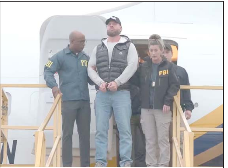
La fiscal Pam Bondi afirmó que la operación de Wedding generaba más de mil millones de dólares anuales.

Al salir, comenzó a liderar una organización criminal y huyó a México, donde hasta ayer fue detenido.