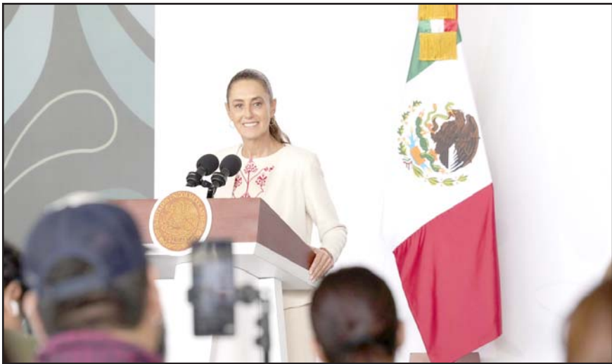
Sheinbaum pidió a la SCJN informar públicamente la adquisición.

Ante las críticas registradas el jueves en redes sociales por esta compra, la SCJN aseguró que la renovación de la