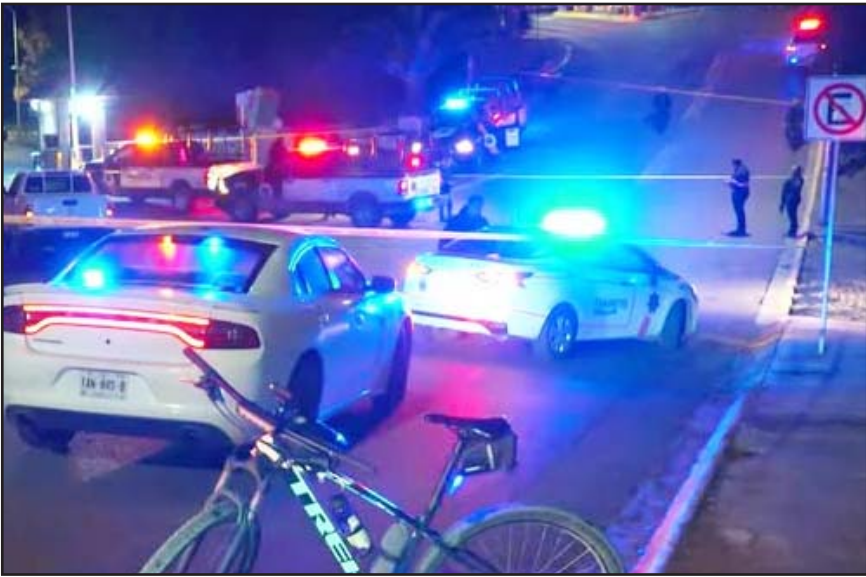
Los hechos se registraron en el municipio de Guadalupe.