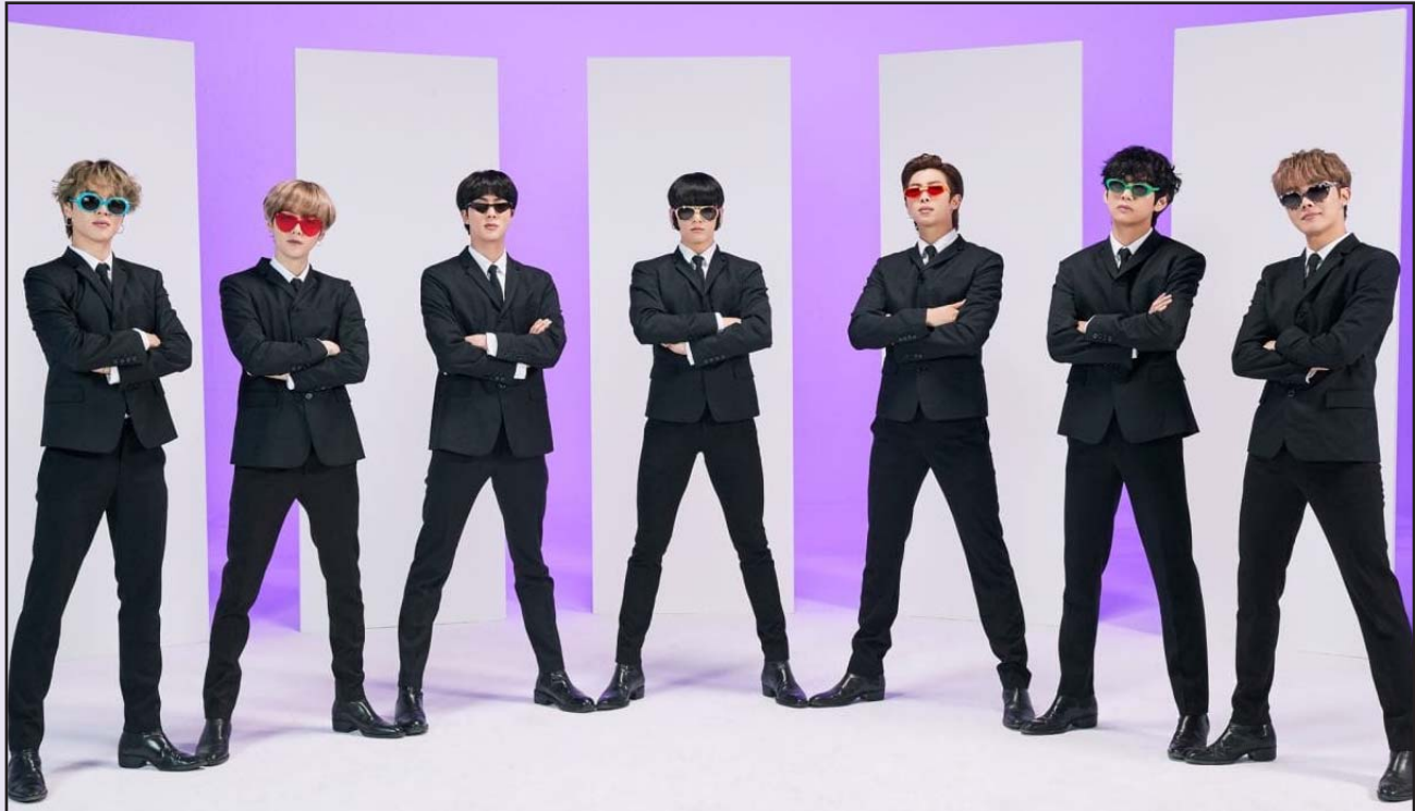
Para entrar a la compra de boletos, previamente se tenía que registrar como seguidor de la banda surcoreana.