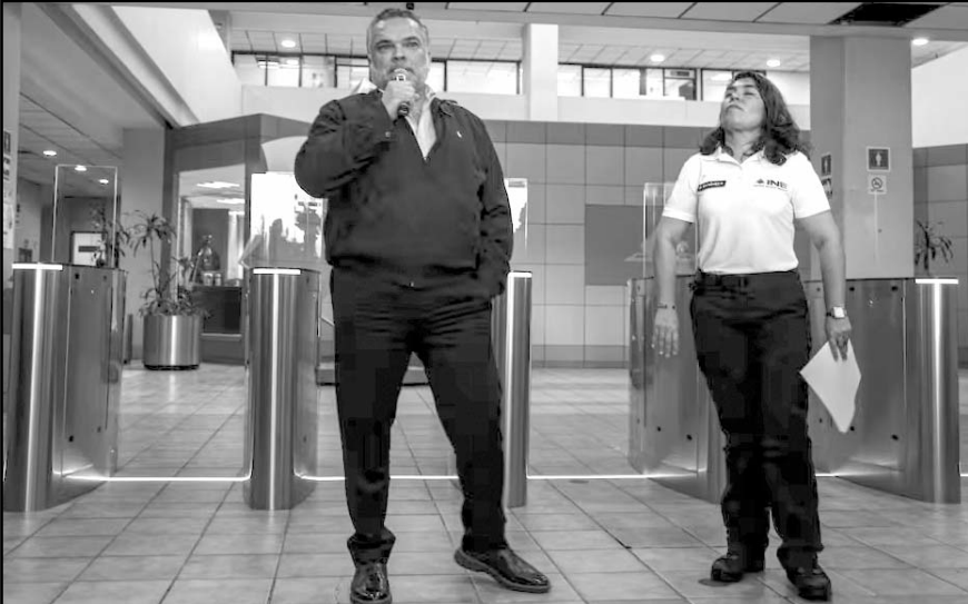
Funcionarios señalaron que la actualización era necesaria, ya que el Instituto llevaba más de 15 años sin renovar su equipo de seguridad.

quetes en el lobby y nuevas cámaras en los pasillos. En la Sala de Prensa había dos cámaras, ante supuestas sustracciones de equipo de cómputo que hubo en el pasado, pero se instalaron dos nuevas "porque había puntos ciegos", según informó Sánchez Frías. La jefa de Seguridad del INE tuvo una contradicción durante el recorrido: primero afirmó que no se instalaron nuevas cámaras, pues se hizo el nuevo sembrado en el mapa de sembrado anterior, pero al referir las dos nuevas posiciones de cámaras de videovigilancia en la Sala de Prensa del Instituto, admitió que hubo algunas nuevas instalaciones.