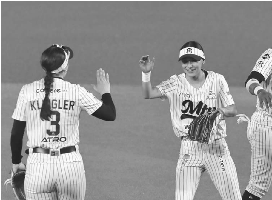
El conjunto regionmontano dividió triunfos con las Olmecas en su primera serie de la temporada.

Se espera que la serie ante ese rival en la Comarca Lagunera inicie con el duelo de hoy a la 19:00 horas.