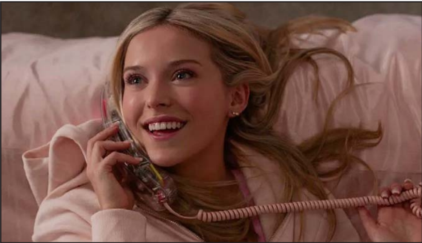
En la nueva serie que será transmitida a través de Amazon Prime Video, "Elle Woods" será interpretada por Lexi Minetree.

Aunado a ello, una de las noticias que destacó junto con su fecha de lanzamiento, fue que el éxito de esta producción está respaldado, pues actualmente las filmaciones de la segunda temporada de "Elle" ya se están realizando.