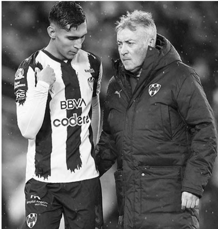
Torrent no haya la fórmula para reactivar el Monterrey.