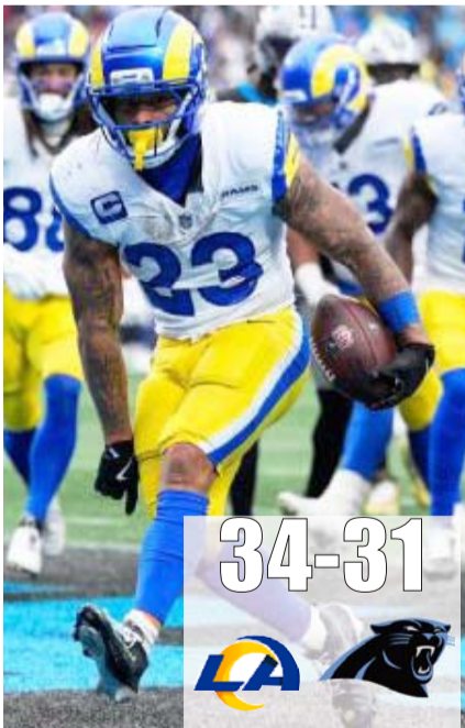
Carneros se veía superior.

Sin embargo, los Carneros ganaron el encuentro y su pase a la ronda divisional con un pase de anotación de Matthew Stafford hacia Colby Parkinson, finalizando así el encuentro.