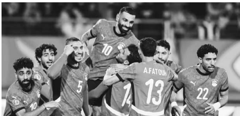
Egipto venció 3-2 a Costa de Marfil.