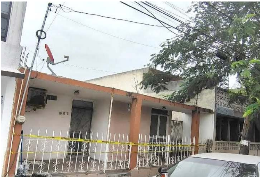
Los cuerpos de las víctimas no presentan huellas de violencia o síntomas de intoxicación