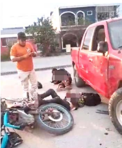
El conductor de la motocicleta y su acompañante resultaron seriamente lesionados

Vialidad y Tránsito recabaron datos para determinar las causas del choque.