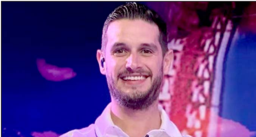
El creador de contenido dijo que necesita tiempo para invertir en sí mismo.

A través de la red social se puede observar la imagen de su casa con el siguiente mensaje: "Los 4 años más infelices de mi vida los viví aquí. Nunca se casen, raza".