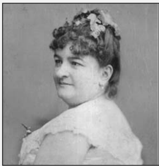
Emilia Pardo Bazán

Habrá mejores momentos para pensar y escribir recitando refranes y clichés. Por hoy, he de concluir. Quedo en deuda para otro domingo.