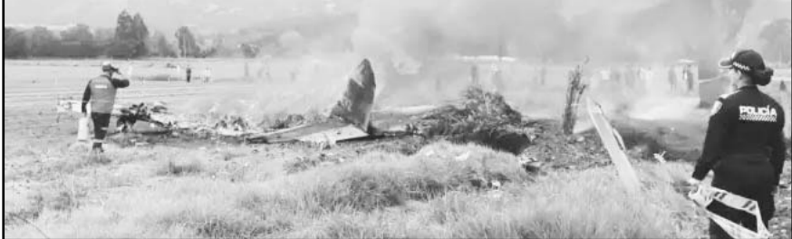
El siniestro aéreo cobró la vida de las 6 personas que volaban en la avioneta, que se dirigía a Medellín.

El intérprete de música popular colombiana, que mezcla ritmos de rancheras y corridos de influencia mexicana, era muy conocido en el país y algu-