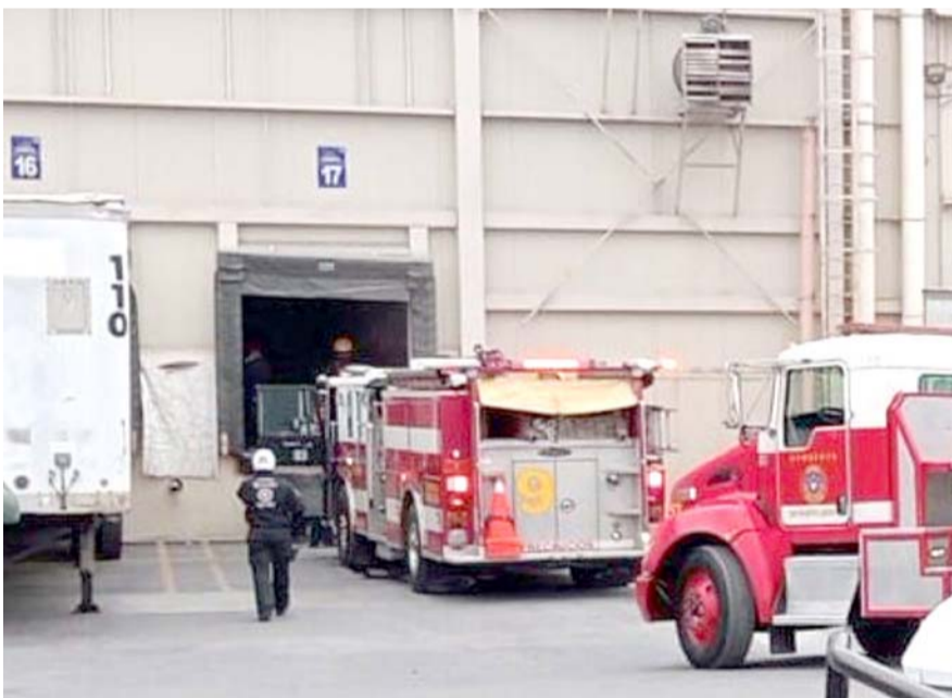
Aparentemente una batería para vehículo, ubicado junto a otras piezas similares, hizo reacción e inicio el fuego que se extendió rápidamente.

Fueron los encargados de la vigilancia los que se percataron del incendio, por lo que llamaron a los puestos de socorro.