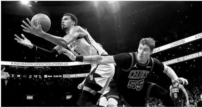
Spurs venció a los Celtics para seguir entre los mejores.

De esta forma, Sergio Pérez tendrá las herramientas suficientes para dar resultados positivos en Cadillac desde el Gran Premio de Australia que será el próximo ocho de marzo, donde comenzará la temporada 2026 de la categoría reina del deporte motor.