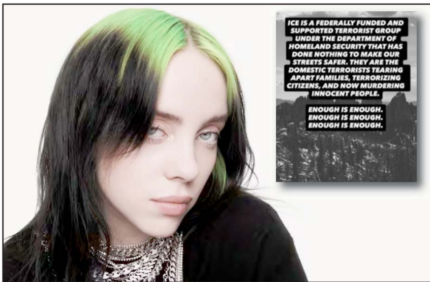
Billie Eilish arremetió contra el Servicio de Inmigración y Control de Aduanas tras la muerte de una mujer en Minneapolis.

A través de sus historias de Instagram, la intérprete criticó duramente a la agencia federal y acusó a sus agentes de hacer uso excesivo de la fuerza.