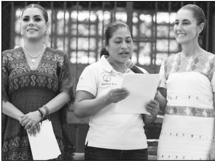
Presidenta Claudia Sheinbaum presenta nuevo centro de acopio del programa café y maíz del Bienestar Atoyac, Guerrero

Respeto al centro de acopio del Café Bienestar, Sheinbaum indicó que forma parte de la estrategia de Alimentación para el Bienestar, cuyo objetivo es aumentar y mejorar la producción de productos como maíz, frijol, miel, café y cacao, comprándolos directamente a los productores a buen precio y procesándolos para mejorar su calidad y ponerlos a disposición de las y los mex-