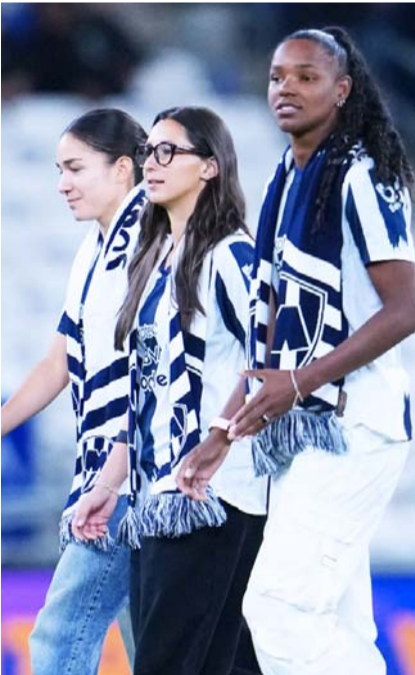
Las tres nuevas rayadas.

vuelve a Rayadas tras estar con el equipo en 2024, relató lo que tendrá que hacer en cancha para ganarse la titularidad.