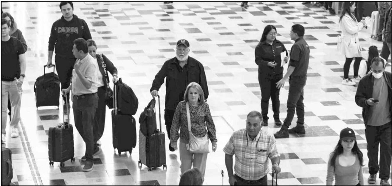
Los aeropuertos mexicanos atendieron a 59 mil venezolanos entre enero y noviembre en 2025, una disminución de 11.7% en comparación con el mismo periodo de 2024.