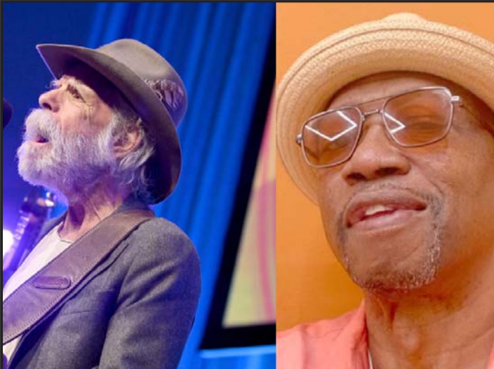
El mundo del entretenimiento despidió al actor estadounidense T.K. Carter y el músico Bob Weir.

años 80 con títulos como The Thing, junto a Kurt Russell, además de Poltergeist y City Heat, consolidando su presencia en producciones de gran alcance.