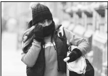
Frente frío 27 ocasiona lluvias, vientos intensos y descenso de temperatura.

Para el domingo 11 de enero se prevén lluvias puntuales intensas en zonas de Puebla, Veracruz, Tabasco, Oaxaca y Chiapas; muy fuertes en Campeche, y fuertes en entidades del centro y norte como San Luis Potosí, Querétaro e Hidalgo. Estas precipitaciones podrían estar acompañadas de actividad eléctrica y generar incrementos en niveles de ríos y arroyos, deslaves e inundaciones en zonas bajas.