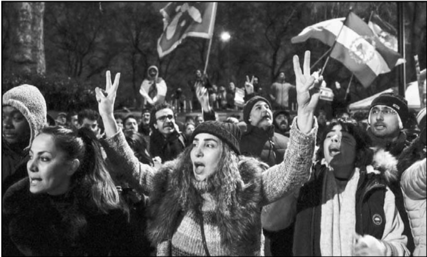
Manifestantes anti-régimen iraní participan en una manifestación frente a la Embajada iraní en el centro de Londres el 10 de enero de 2026.

Las autoridades estadounidenses subrayaron que estas acciones buscan degradar la capacidad operativa del EI y evitar nuevos ataques contra personal militar y aliados en la región. El Comando Central reiteró que continuará utilizando “fuerza decisiva” cuando sea necesario para proteger a sus fuerzas y mantener la presión sobre las células remanentes del grupo yihadista, al que considera una amenaza persistente para la estabilidad regional.