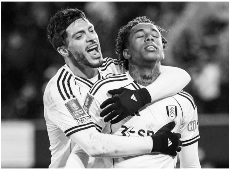
Full Ham avanzó en la copa FA.

Por Crystal Palace descontó Yeremi Pino con su gol que fue al 90', pero no fue suficiente y perdieron el encuentro.