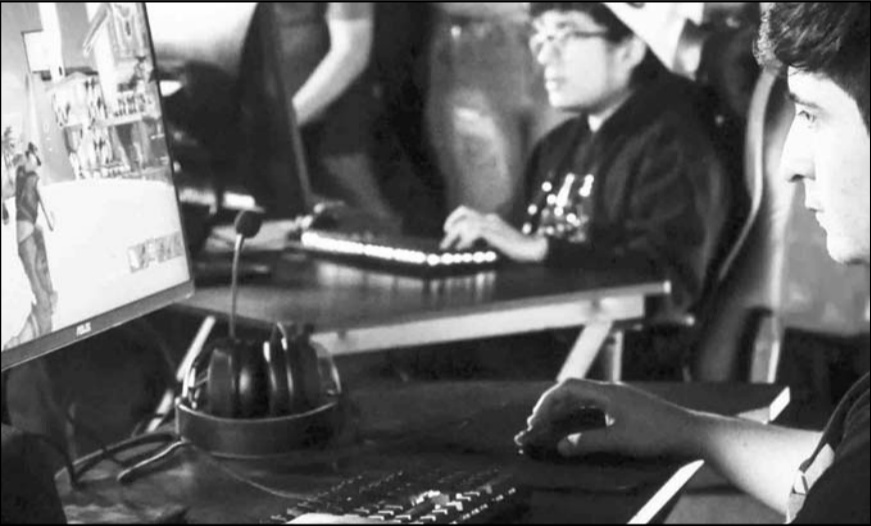
Jóvenes juegan videojuegos, en medio del debate por los estímulos fiscales que eliminaron el IEPS a videojuegos violentos.

Confiamos en que constatarán la absoluta inocencia de Javier Corral frente a las injustas acusaciones de las autoridades de Chihuahua, y que esto será también la base para desenmascarar la brutal fabricación de un delito a quien encabezó uno de los mayores esfuerzos en el país en contra de la corrupción política, como lo hemos denunciado ante la propia FGR.