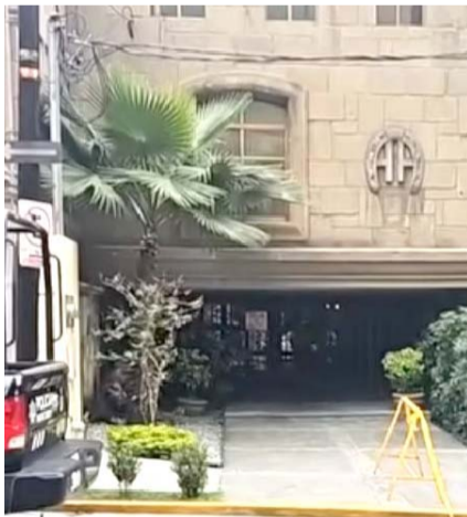
Hasta el momento las autoridades no han informado sobre la identidad del ahora occiso.

Será la autopsia de ley correspondiente la que determinará las causas del deceso.