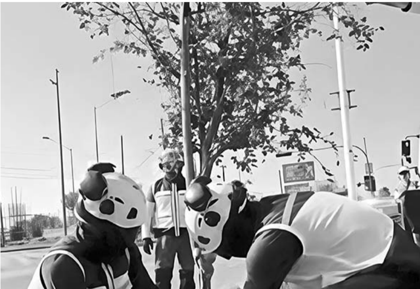
Se estima que un espacio arbolado reduce la temperatura entre 10 y 15 grados.

Es de destacar que a la par se trabaja en corredores verdes en el Par Vial Morones Prieto-Constitución, las Líneas 4 y 6 del Metro, así como las Líneas 1, 2 y 3.