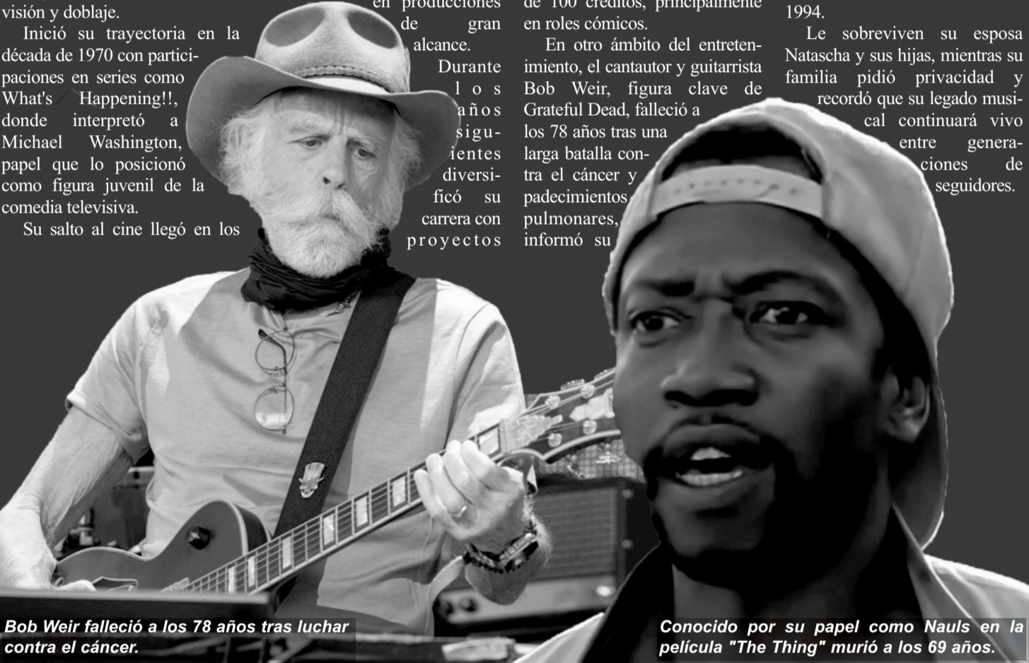
Bob Weir falleció a los 78 años tras luchar contra el cáncer.