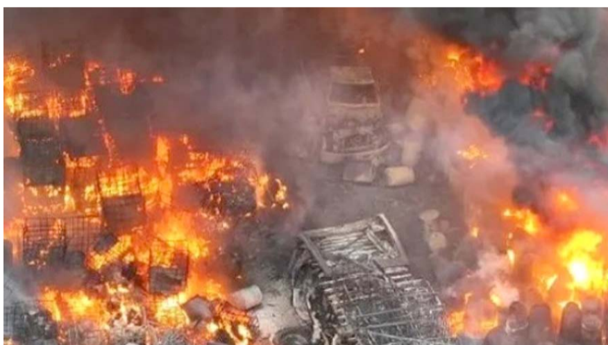
Hasta el momento se desconocen las causas que originaron el siniestro.

Como medida preventiva, se procedió al desalojo de zonas aledañas donde se ubican comercios y algunas viviendas.