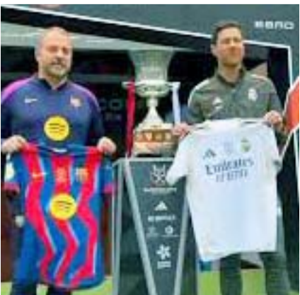
El juego será en Arabia.