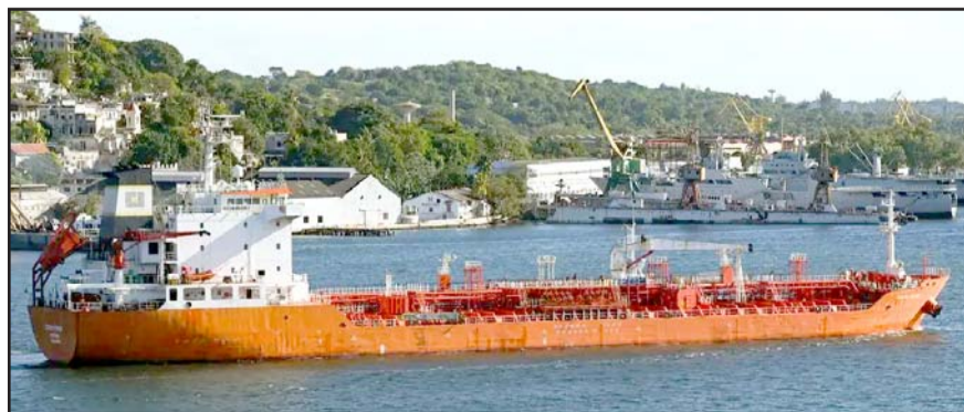
El senador del Partido Acción Nacional demandó información total sobre envíos del petróleo mexicano a la isla caribeña.

Hasta ahora, siete de los detenidos por este caso eran sus escoltas y están acusa-