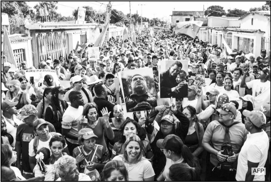
Manifestantes sostienen fotos del difunto presidente venezolano Hugo Chávez durante una manifestación en apoyo al depuesto presidente venezolano Nicolás Maduro.

Al cierre de la jornada, familiares de detenidos continuaban concentrados frente a cárceles y centros de reclusión, denunciando que las liberaciones avanzan “a cuentagotas”, pese a los anuncios oficiales y a la expectativa generada tras la caída de Maduro.