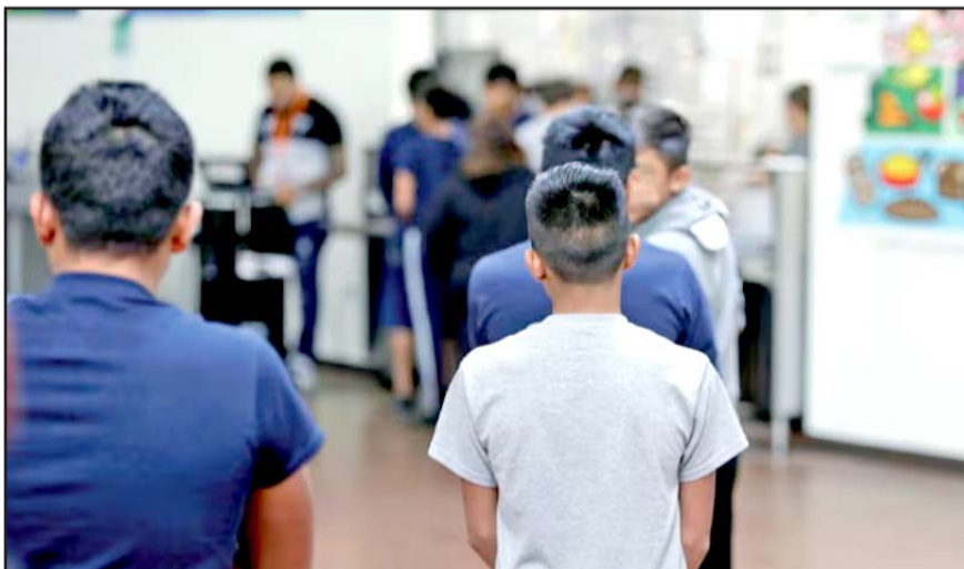
En 2024 hubo 30,320 repatriaciones de niñas y niños a nuestro país.