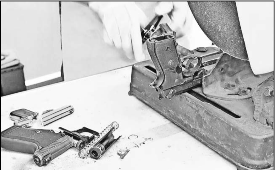
Personal de la Secretaría de la Defensa Nacional será el encargado de custodiar las armas recabadas.

Para quien entregue de forma voluntaria este año un lanzamisiles, la Secretaría de Gobernación pagará 7 mil