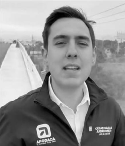
César Garza Arredondo, alcalde de Apodaca

El alcalde de Apodaca, César Garza Arredondo, realizó un recorrido de supervisión para constatar los avances en la etapa final del nuevo puente Apodaca-Juárez, una obra clave para mejorar la movilidad y seguridad vial en la zona. Durante la visita, el edil informó que el puente ya se encuentra abierto a la circulación, aunque aún se trabaja en detalles finales como la instalación de luminarias y trabajos de pintura. Asimismo, señaló que ya se está colocando carpeta asfáltica en la lateral del puente que conecta con la autopista, la cual quedará habilitada para su uso el mismo día. "Cinco cosas que debes de saber sobre la etapa final del nuevo puente Apodaca-Juárez, número 1 el puente ya está abierto a la circulación solamente nos faltan detalles de las luminarias, pintura y estamos trabajando en ello, número dos ya estamos tirando carpeta en la lateral del puente que lleva a la autopista, hoy mismo queda lista para que la utilices", dijo. Garza Arredondo explicó que como