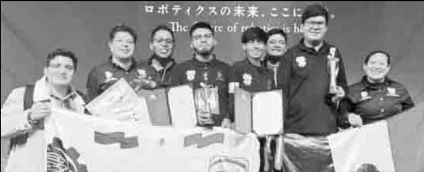
Estudiantes del Conalep y del TecNM, ganadores en certámenes internacionales de innovación y robótica en Singapur, Japón y Ecuador.

consiste en un dispositivo modular que permite generar agua potable a través de la captación de humedad atmosférica mediante un proceso de licuefacción de gases, lo que representa una solución innovadora y de alto impacto