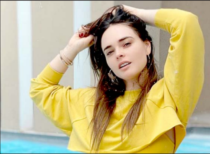
La actriz regiomontana espera conocer a Guillermo del Toro durante la ceremonia.