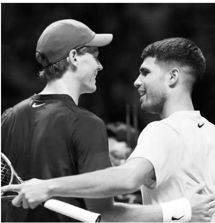
Sinner y Alcaraz.

Este enfrentamiento solamente fue una ‘probadita’ de lo que podría suceder en el próximo Abierto de Australia que arrancará en lunes que viene.