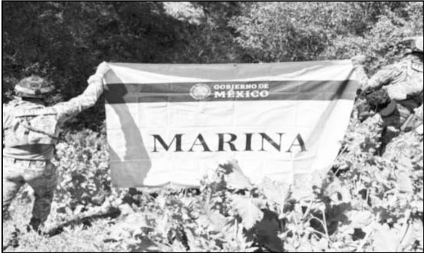
Armada localiza y destruye 32 plantíos de amapola en Nayarit (10/01/2026).

tribuye en la suma de esfuerzos del Gobierno de México para combatir la producción y elaboración de drogas en nuestro país, debilitando con ello la fabricación de droga por parte de grupos delictivos e impidiendo su distribución, venta y exportación a otros países, con lo que se evita que ésta se