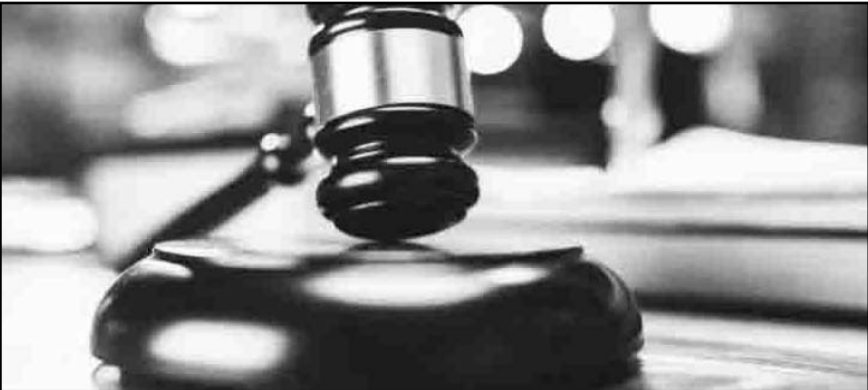
Caso por presunto peculado del exgobernador Javier Corral será atraído por autoridades federales.

La estrategia considera el fortalecimiento de su infraestructura operativa y tecnológica, así como el aprovechamiento de su red de atención en todo el país.