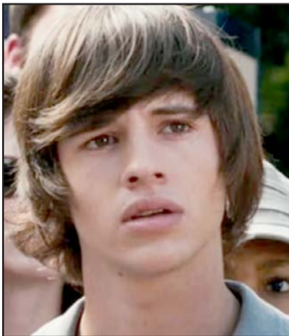
Matt Prokop fue arrestado en Texas por presunta posesión de pornografía infantil.

El incidente ocurrió el 10 de diciembre de 2025 en un hotel de Camarillo, condado de Ventura, donde policías lo citaron tras una supuesta solicitud de servicios sexuales. No fue arrestado ni fichado —