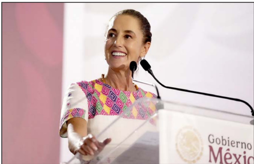
La Presidenta, Claudia Sheinbaum recordó el costo histórico de la independencia y fijó límites claros a la relación bilateral.

"Es muy, muy triste ver lo que ha pasado en ese país", añadió el mandatario estadounidense.