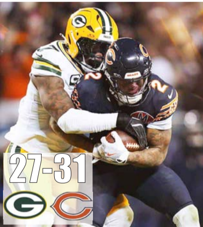
Chicago avanzó en la NFL.

Green Bay se alejó a 11 puntos tras un pase de anotación de Matthew Golden a pase de Jordan Love y Chicago se acercó a tres unidades