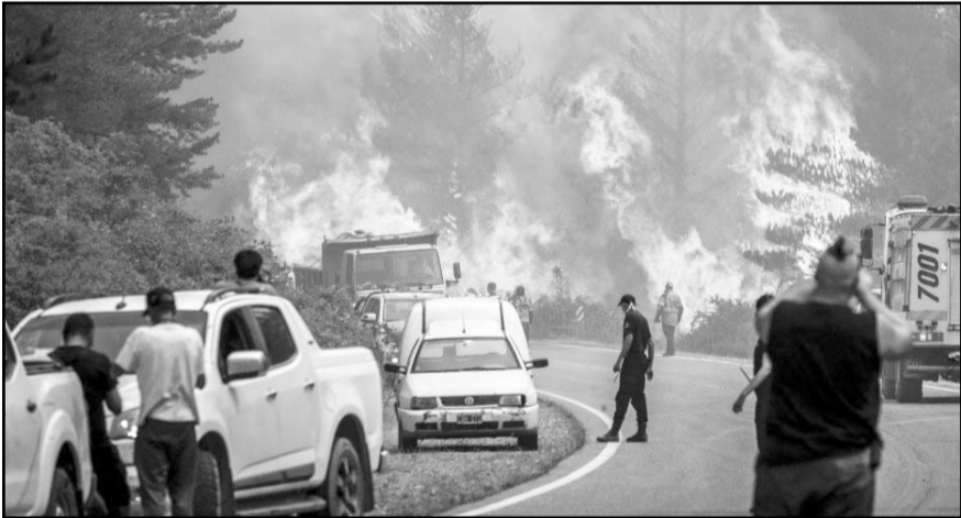
Los bomberos luchan contra las llamas para extinguir un incendio forestal en el Monte Pirque, en El Hoyo, en la región patagónica.

El gobernador de la provincia, Ignacio Torres, aseguró en X que por las condiciones climáticas adversas para el fin de semana, las "próximas 48 horas serán vitales" para contener el fuego.