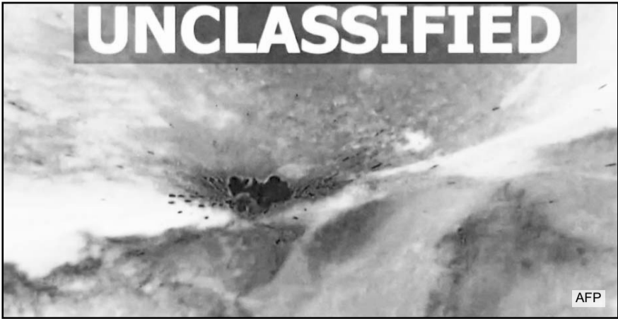
Captura de pantalla obtenida el 10 de enero de 2026 a partir de un video publicado por el Mando Central de EU. en su cuenta X.