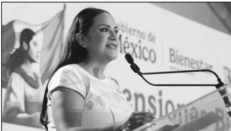
Durante un evento público, Ariadna Montiel subrayó que el gobierno federal prioriza a los sectores más vulnerables mediante programas de Bienestar con entrega directa de recursos.