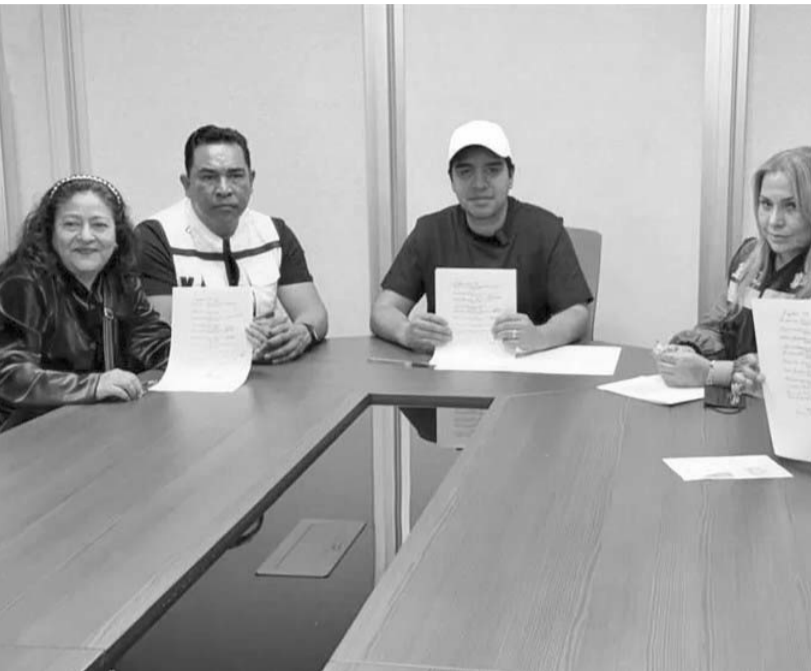
El municipio recurrió a las instancias federales y estatales para que abran una investigación en relación a los malos olores que se presentaron la noche del miércoles siete de enero en varias colonias