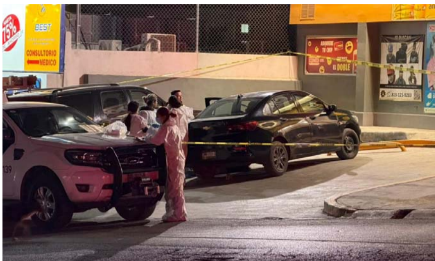
Una mujer fue ejecutada a balazos cuando subía su vehículo estacionado en una tienda de conveniencia

Agentes ministeriales del grupo de homicidios y Policías del municipio, se aproximaron al lugar de los hechos para comenzar con las investigaciones