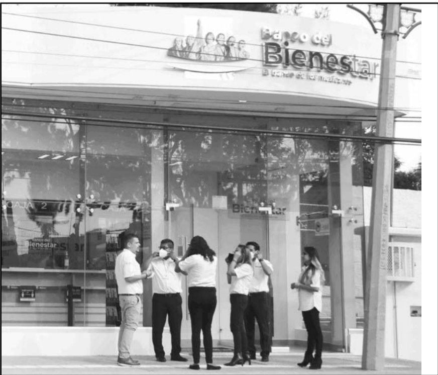
La Financiera para el Bienestar atraerá funciones del Banco del Bienestar, que sólo se encargará de dispersar los recursos de programas sociales.

Detalló que los créditos a la palabra están dirigidos principalmente a personas que enfrentan barreras estructurales para acceder al financiamiento formal, como la falta de historial credi-