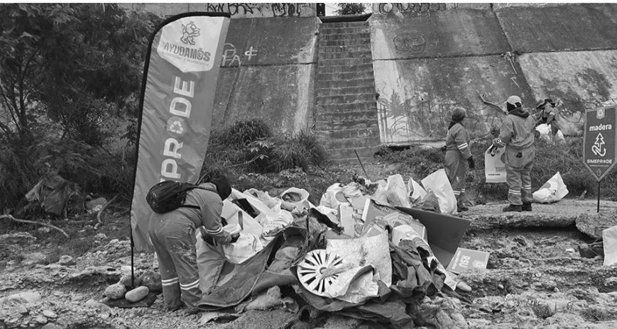
Los Leones en Acción levantaron más de una tonelada de residuos.

Fuerza Civil y Protección Civil, así como personal de Limpia León. Es de destacar que seis personas voluntarias encontraron los juguetes escondidos en el río. Para ser parte de Leones en Acción, los ciudadanos pueden llamar al 070 o consultando las bases en las redes sociales de la Secretaría de Participación Ciudadana. Adicionalmente pueden participar en paseos de perritos en adopción, elaboración de prótesis mamarias y preparación de alimentos para familiares de pacientes de hospitales. (CLG)