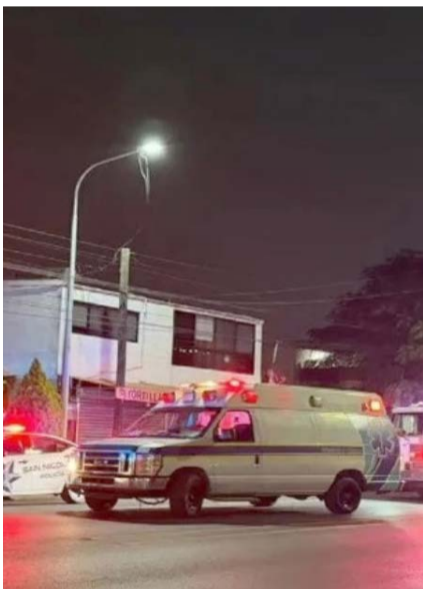
Se esperan los resultados de la autopsia.

Además, había ventanas abiertas, se esperan los resultados de la autopsia para determinar cuál o cuáles fueron las causas del fallecimiento de ambas víctimas.