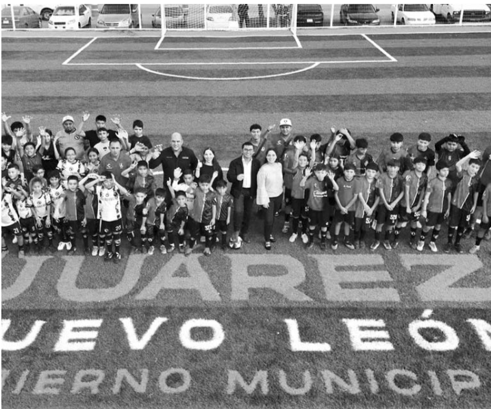
Apuestan por el deporte como herramienta de transformación social

voleibol entre otros. Adelantó que durante la segunda etapa se planean mejoras para más disciplinas deportivas que ayuden a mejorar el entorno y el bienestar de las y los juarenses. El proyecto contempló la construcción de banquetas y andadores con una superficie de 268.77 metros cuadrados, la instalación de malla sombra, así como la rehabilitación de cancha de pasto sintético con una reja perimetral de 4 metros de altura. (IGB)