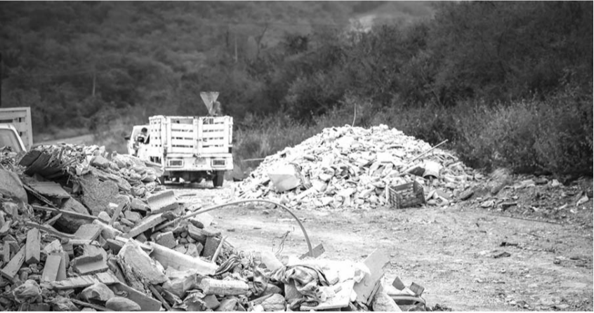
Multas llegan a los 100 mil pesos.

Las autoridades municipales continuarán con la supervisión ambiental, la aplicación de sanciones y las acciones necesarias para prevenir la contaminación y preservar el equilibrio ecológico en el municipio.