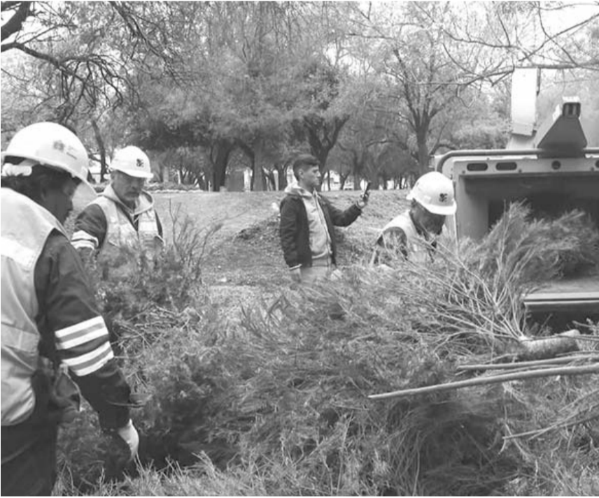
Los árboles naturales son destruidos para transformarlos en composta o mantillo para jardines

cipalmente en el cuidado en el medioambiente y en la lucha del cambio climático.