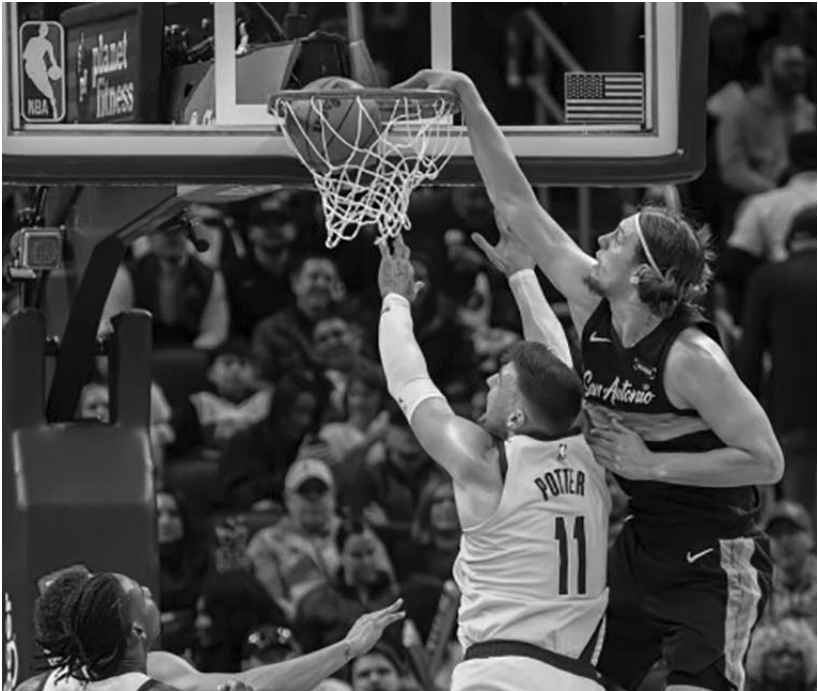
Los Spurs de San Antonio llegaron a 25 victorias tras vencer ayer por un marcador de 123-113 a los Pacers de Indiana.