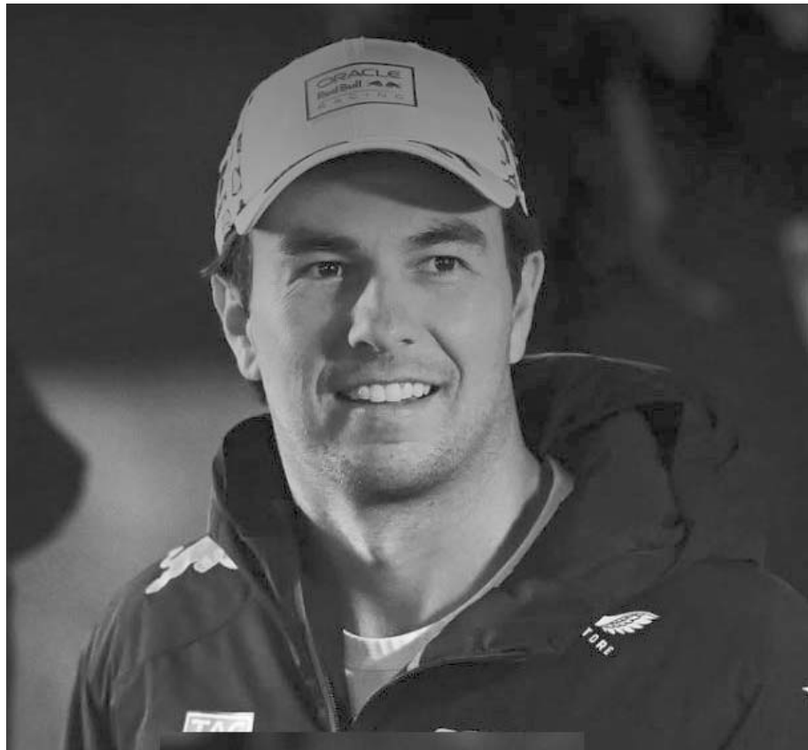
En la red social de Twitter, la Fórmula 1 destacó que la escudería Cadillac haya elegido a Sergio Pérez y a Valtteri Bottas como sus dos pilotos para la temporada 2026

Verstappen le entregó a Sergio un casco que usó cuando ambos compartían escudería, catalogando al mexicano como “el mejor compañero de equipo que ha tenido en la Fórmula 1”.