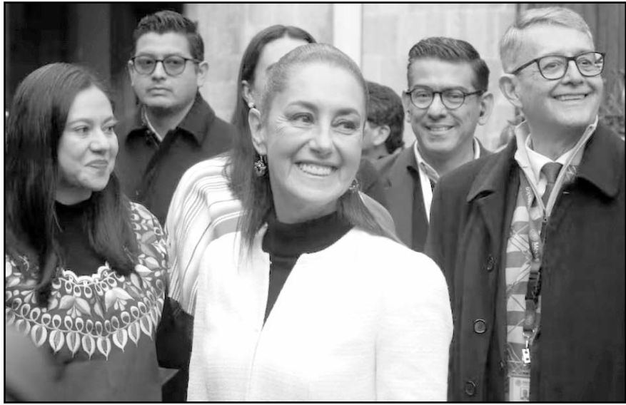
De lunes a miércoles, las mañaneras continuarán en la Ciudad de México, explicó la mandataria federal.