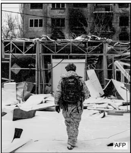
La medida afecta a localidades de Zaporizhzhia y Dnipro.

Por su parte, el ministro de Relaciones Exteriores de Irán tachó de "imprudente y peligrosa" la declaración del presidente estadounidense, que amenazó con intervenir si las autoridades iraníes matan a