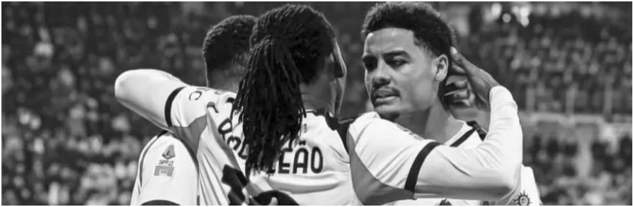
Milán comenzó este año con un triunfo de 1-0 ante Cagliari

A su vez, el conjunto del Cagliari se quedó en las 18 unidades para que así sean décimo cuartos en la tabla de posiciones.