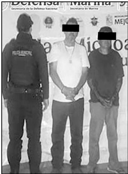
Aseguraron armas, cartuchos, cargadores y vehículos.

Las personas detenidas y los objetos asegurados fueron puestos a disposición de las autoridades. En estos eventos participaron la Defensa, Guardia Nacional, Marina, Secretaría de Seguridad y Protección Ciudadana, Fiscalía General de la República, así como la Secretaría de Seguridad Pública (SSP) y la fiscalía estatal.