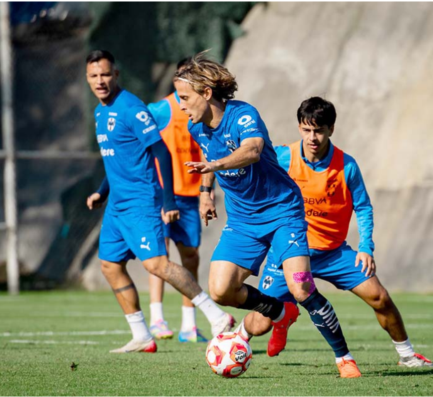
Los Rayados viajaron ayer a la Perla Tapatía para afrontar la Copa Pacífica.