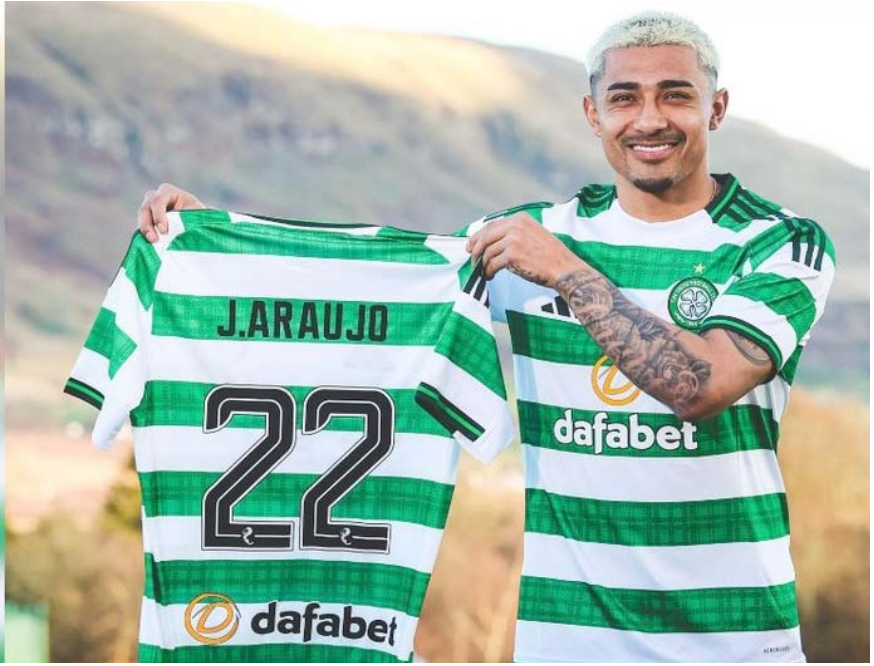
“Estoy muy contento de unirme al Celtic”.