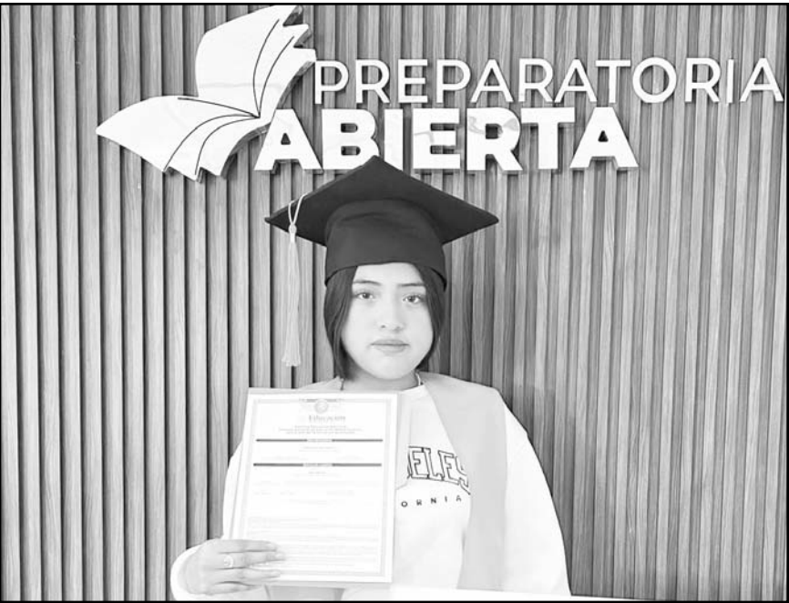
En este sistema los alumnos estudian a su propio ritmo