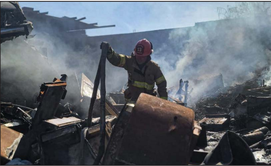
Estaban cortando un material cuando surgió la chispa.

En otro caso, el incendio de un tejaban abandonado movilizó a los cuerpos