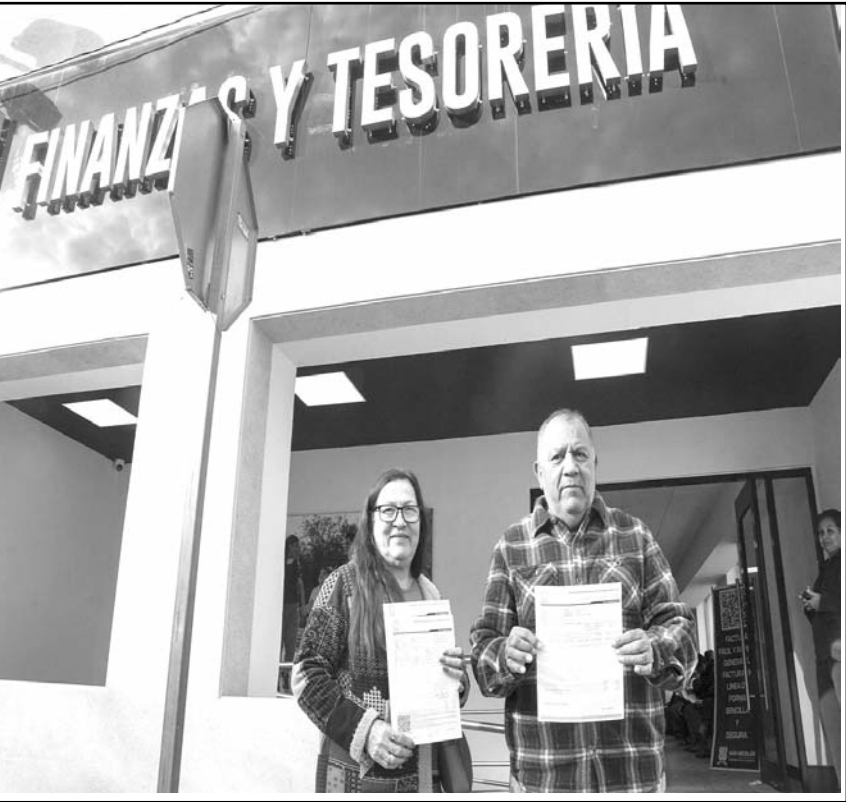
Los nicolaítas se caracterizan por ser muy cumplidores con sus impuestos

Además, está disponible para el pago el “Tesomóvil”, ubicado en Av. Titán N. 98 cruce con Famosa, en la Col. Cuauhtémoc, las delegaciones 24 horas del Centro Médico Valle Dorado, ubicado en Av. Arturo B. de la Garza y Av. Jorge Gonzáles Camarena y Ciudad Seguridad, localizada en Av. López Mateos S/N KM 2.5 y Av. Conductores, al igual que pago en línea, a través de la página http://consulta.sanicolas.gob.mx/MultipagoCSQL/default.aspx .(CL R)