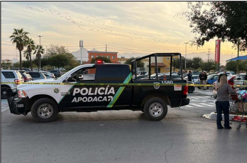
Los hechos se registraron en el estacionamiento de un HEB de Apodaca.

A bordo de un vehículo se aproximaron sujetos armados que comen-