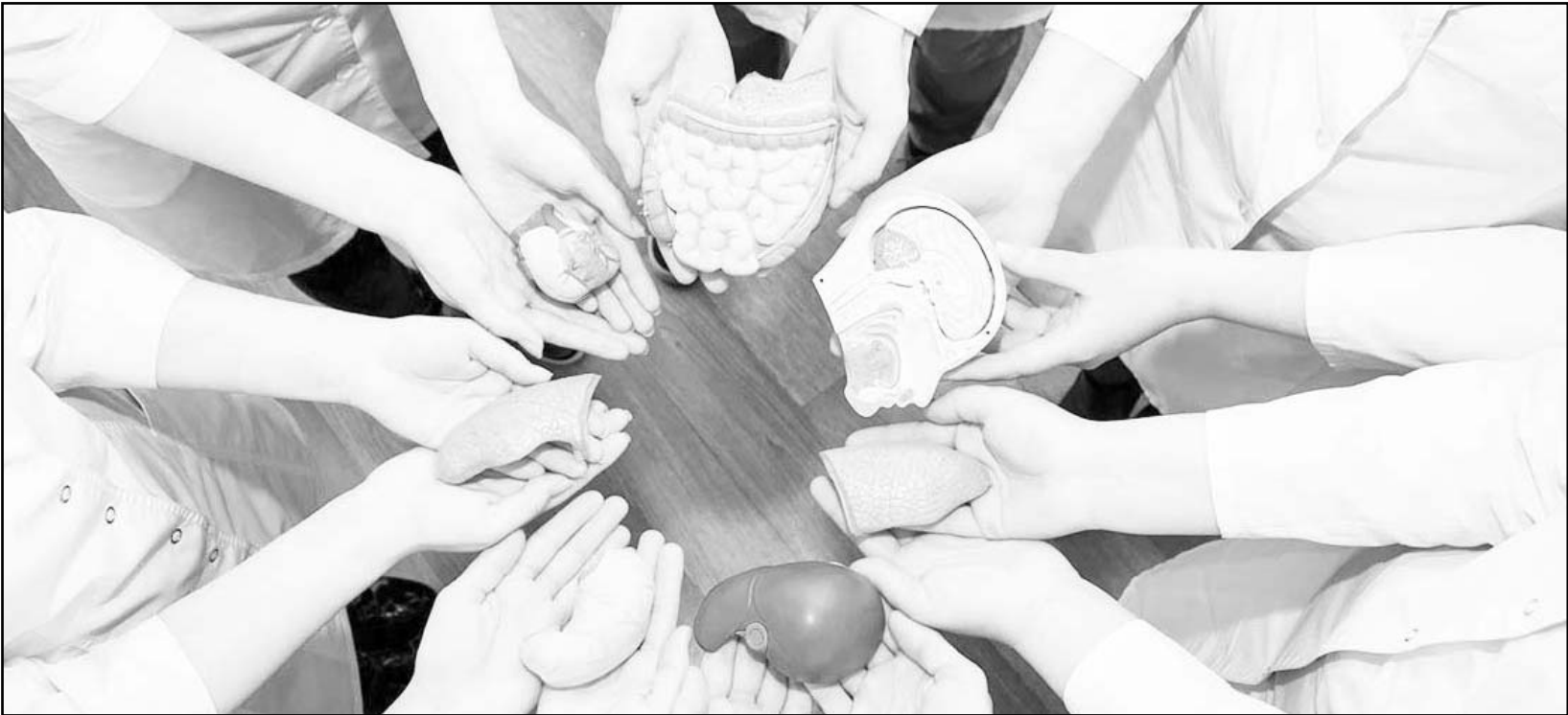
Actualmente el país ha consolidado su capacidad para realizar trasplantes con resultados que cumplen estándares internacionales.