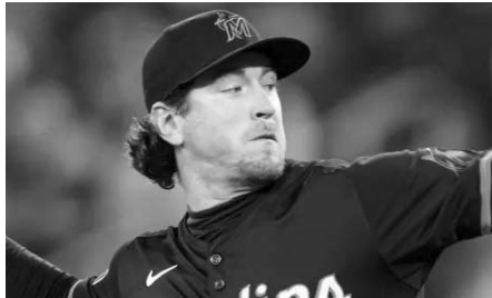
Baumann ha firmado un contrato de un año con los Mets de Nueva York.

Baumann, de 30 años de edad, proviene de los Orioles de Baltimore, donde jugó de pitcher abridor en las