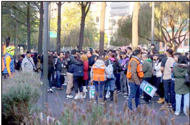
Se registraron 420 réplicas del movimiento telúrico.