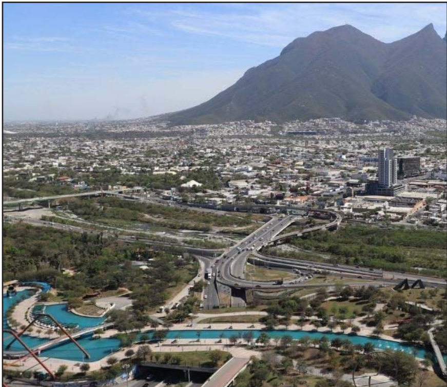
Esto posiciona al estado como uno de los que tienen planeación climática

También hay subsidio del 25 por ciento en el pago de refrendo 2026 para personas mayores de 65 años, propietarios de un solo vehículo registrado en el Estado, modelo 2020 o anterior.