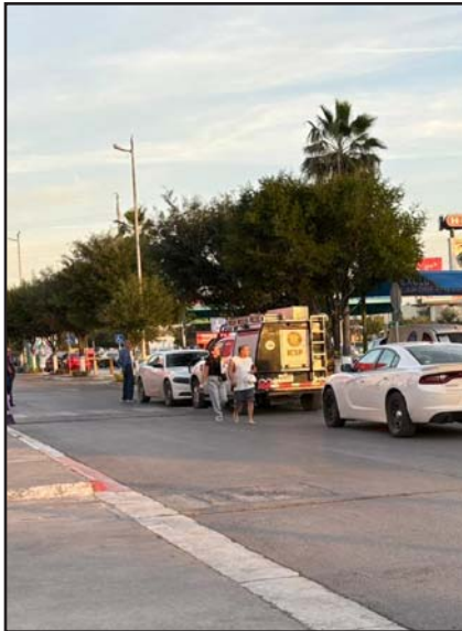
Hubo pánico en el lugar.

Elementos de la Policía de Monterrey realizaban un recorrido de