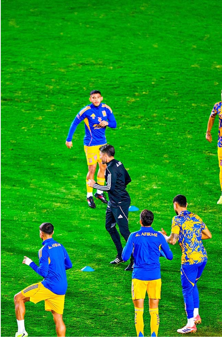
Se espera que el plantel felino reporte hoy en la Facultad de Organización Deportiva de la UANL para los exámenes físicos y médicos

El galo se retiró del lugar poco antes del mediodía, aunque posteriormente eso lo hicieron tanto Purata como Farfán.