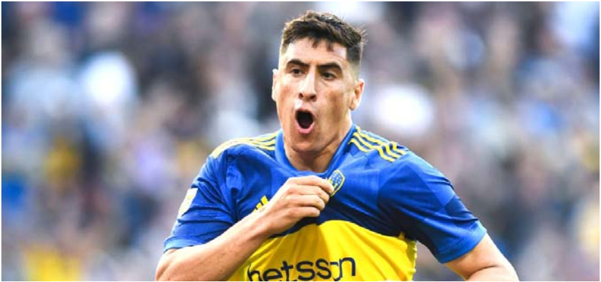
Merentiel tiene 29 años y es un futbolista de origen uruguayo

Para eso primeramente deberían de prescindir de Nicolás Ibáñez, lo cual todavía no ha sucedido.