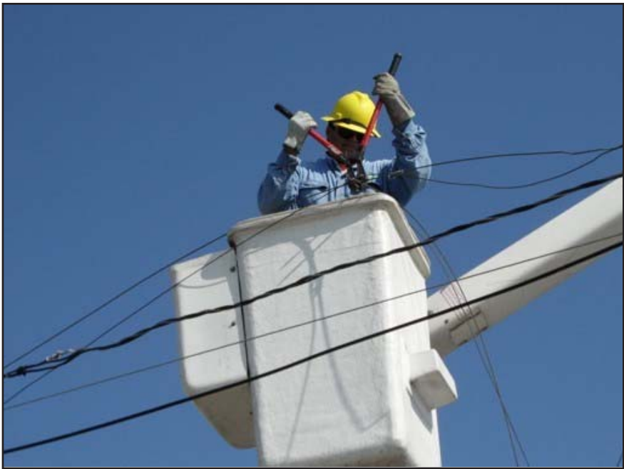
Será desde las cero horas de mañana domingo y hasta las ocho horas.