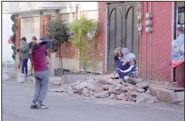
La CFE informó afectaciones a 688 mil usuarios.