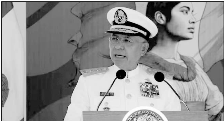
El acto fue presidido por el almirante Raymundo Pedro Morales Ángeles, quien destacó su vocación de servicio y lealtad.

La Secretaría lamentó la pérdida de los cuatro marinos fallecidos en actos del servicio, cuyo ejemplo deja un legado que habremos de recordar en sus nombres los cuales quedan inscritos en la bitácora naval de quienes honran a la nación con valor e integridad.