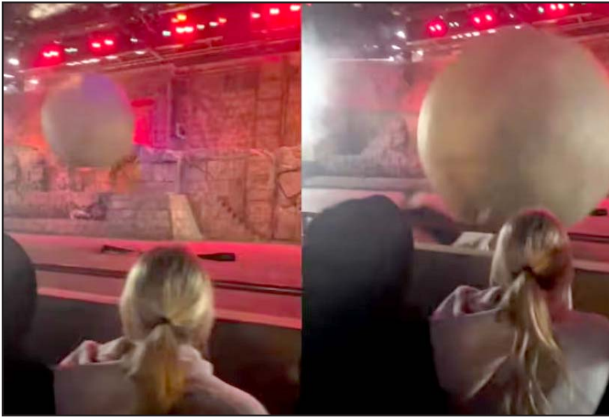
El hecho ocurrió durante el espectáculo Indiana Jones Epic Stunt Spectacular en Hollywood Studios.

"Ese elemento del show será modificado cuando nuestro equipo de seguridad termine la evaluación de lo que ocurrió", añadió.