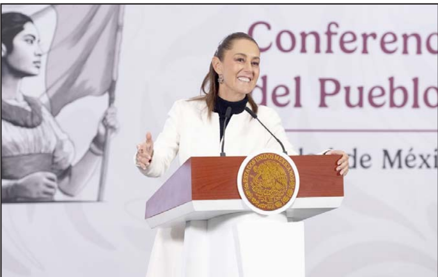
Claudia Sheinbaum informó ayer que se reunirá con la Comisión Presidencial para revisar la iniciativa.

Al ser consultada sobre un eventual encuentro con el mandatario estadounidense, la Jefa del Ejecutivo federal explicó que actualmente existe comunicación permanente entre las autoridades económicas y comerciales de ambos países.