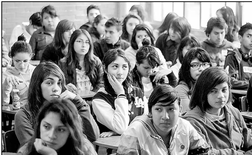
La reforma incluye un sistema informático nacional para matrícula, ingreso, egreso y expedición de un certificado único de bachillerato.

Explicó que el objetivo central es garantizar la protección de los comunicadores, y señaló que puede ampliarse la atribución del mecanismo federal.