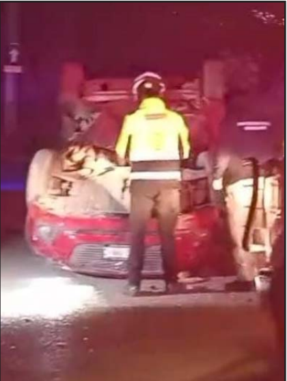
El reporte es de un lesionado.

Agentes ministeriales, policías municipales de Apodaca, San Nicolás y Fuerza Civil, arribaron al lugar de la situación de riesgo, para comenzar con las investigaciones del caso.