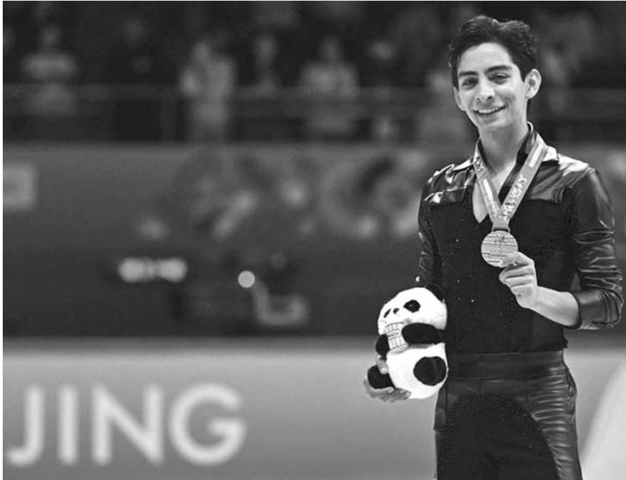
Del 6 al 22 de febrero Carrillo viajará hasta las frías ciudades de Milán y Cortina d'Ampezzo en Italia

"Me siento tan feliz. Aún estoy temblando. Ha sido un largo camino, pero estoy agradecido por esta nueva oportunidad y capítulo en mi carrera. Este es el inicio de algo increíble", celebró el mexicano después de sellar su clasificación en septiembre.