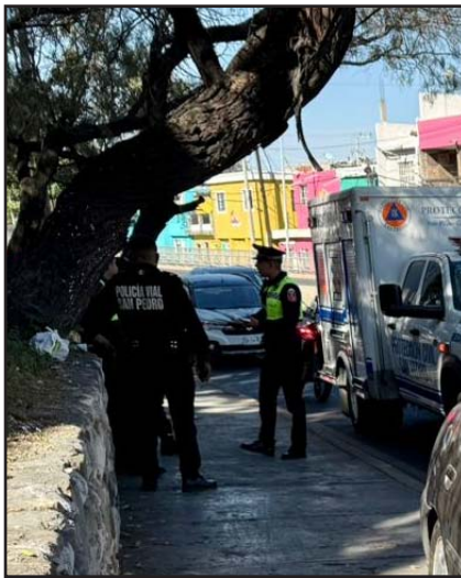
Impactó un poste.

Entre los elementos de ambas corporaciones de rescate se coordinaron para la extracción de los lesionados.