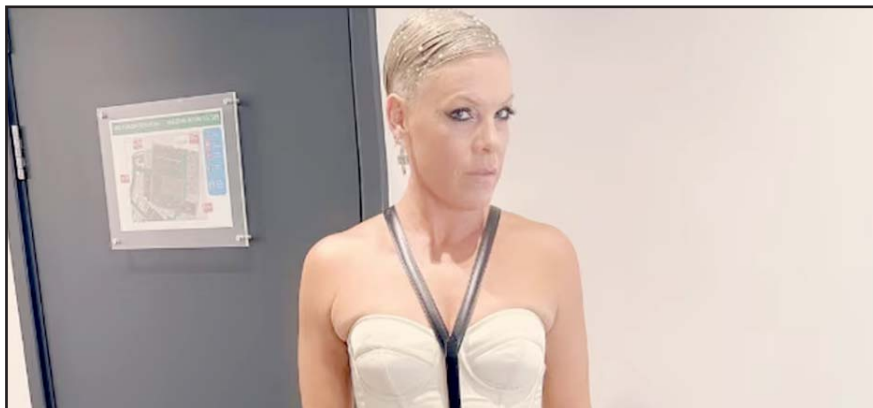
Entre sus mensajes, la cantante subrayó la importancia de cuidarse a uno mismo y a los demás.

La intérprete de "Just Give Me a Reason" también bromeó sobre su intervención quirúrgica al señalar: "Puede que no sea un lifting facial elegante". Añadió que el procedimiento le dejará una nueva cicatriz como recordatorio de la importancia de cuidar su cuerpo para poder seguir haciendo lo que ama. "El rock and roll es un deporte de contacto", escribió.