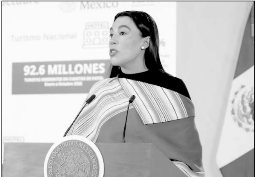
De enero a octubre de 2025, México recibió 38.4 millones de turistas internacionales, 5.8% más que en 2024.

Detalló que, en materia turística, para la Copa Mundial de la FIFA 2026, el gobierno de México realiza una inversión en los aeropuertos, se agilizan los trámites de migración para los visitantes, además de que se avanza en un protocolo de seguridad.