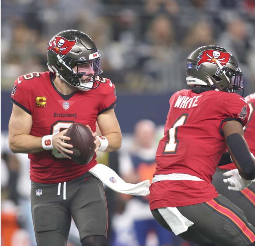
Tampa Bay y Carolina se enfrentarán para disputarse un boleto a los postemporada

Una fuente indicó que la decisión de prescindir de Diggs se debió a “una acumulación de acontecimientos, incluyendo su rendimiento”.