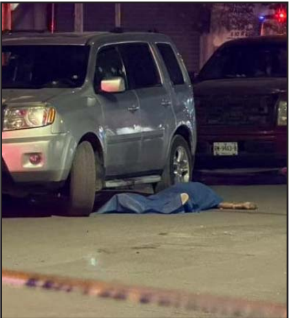
Estaba en su camioneta.