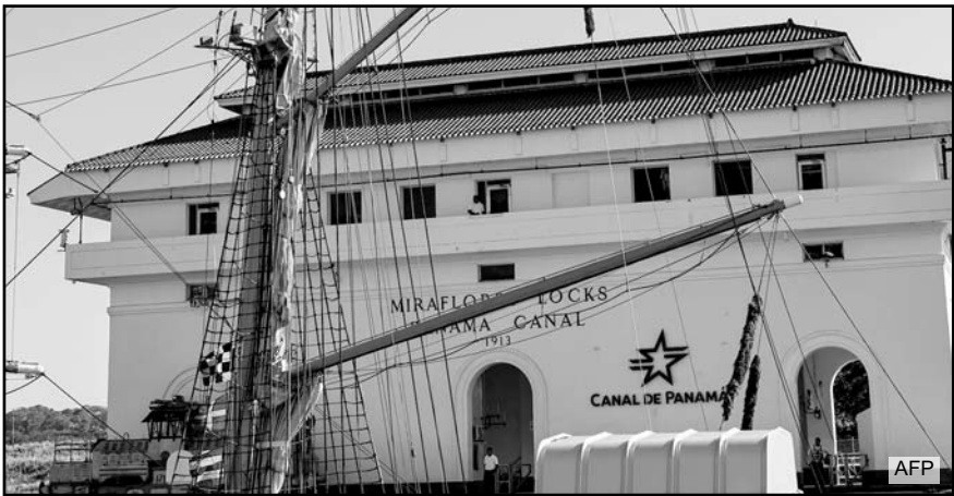
Donald Trump acusó en 2025 a China de influir en el canal panameño mediante Hutchison Holdings.