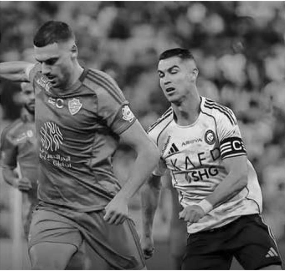
Cristiano Ronaldo comenzó con el pie izquierdo este 2026, tras la derrota de su equipo Al Nassr por marcador de 3-2 frente al club Al Ahli en la primera división del futbol árabe.