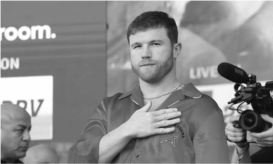
El oriundo de Guadalajara, no tiene interés en recuperar la corona de los supermedianos, o al menos no en un futuro próximo.

La respuesta del equipo de Iglesias fue un "sí" de inmediato, mientras que en la esquina del 'Canelo' fue lo contrario; en gran medida por la cirugía de codo de la cual se recupera el tapatío. Esta ecuación dejó al tijuaneño Jaime Munguía como