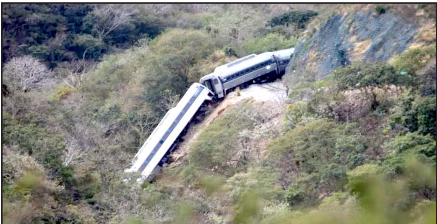
La Fiscalía expresó que las diligencias buscan esclarecer los hechos y garantizar la reparación integral del daño a víctimas y familiares.

La FGR enfatizó que la Fiscalía Especializada de Control Regional (FECOR), en coordinación con la Subsecretaría de Derechos Humanos de Gobernación y la Comisión Ejecutiva de Atención a Víctimas (CEAV), da seguimiento al estado de salud de las personas que permanecen hospitalizadas.