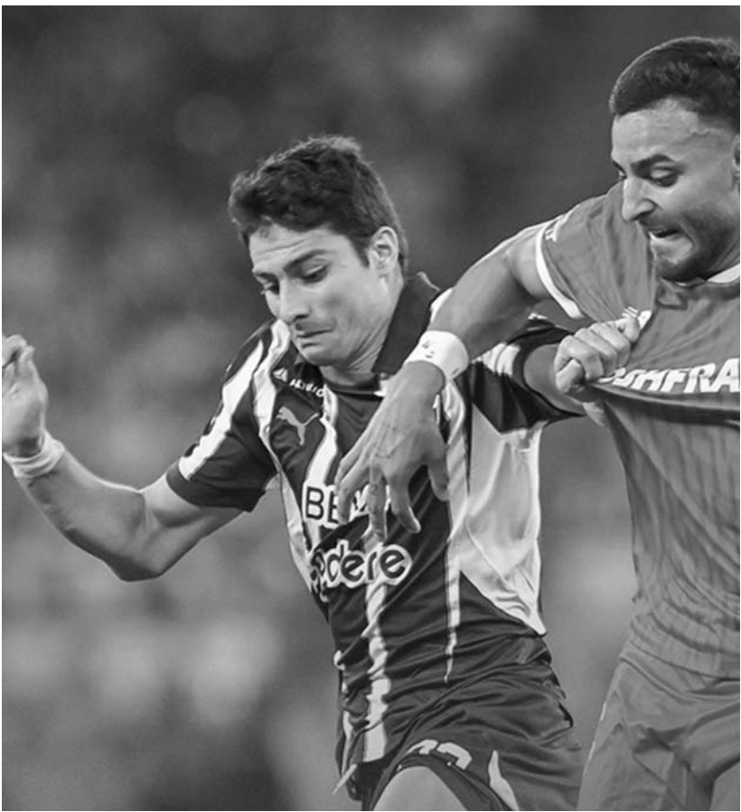
Toluca registra ya una marca de cinco partidos sin triunfo en sus últimas visitas a la Sultana del Norte.