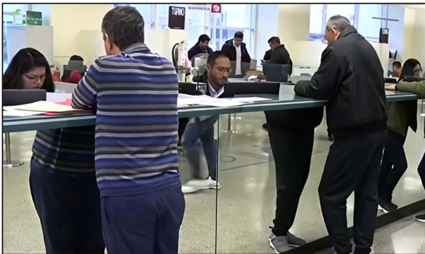
Desde temprana hora decenas de contribuyentes acudieron a pagar.