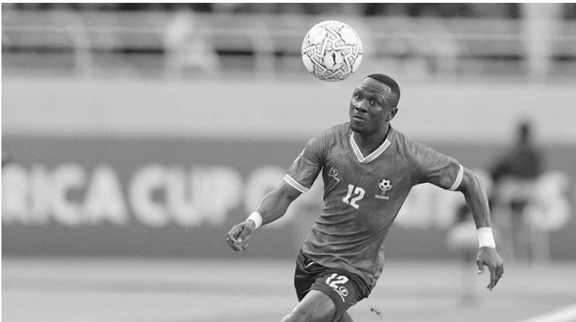
Buscan el pase a los cuartos de final de la Copa Africana de Naciones.