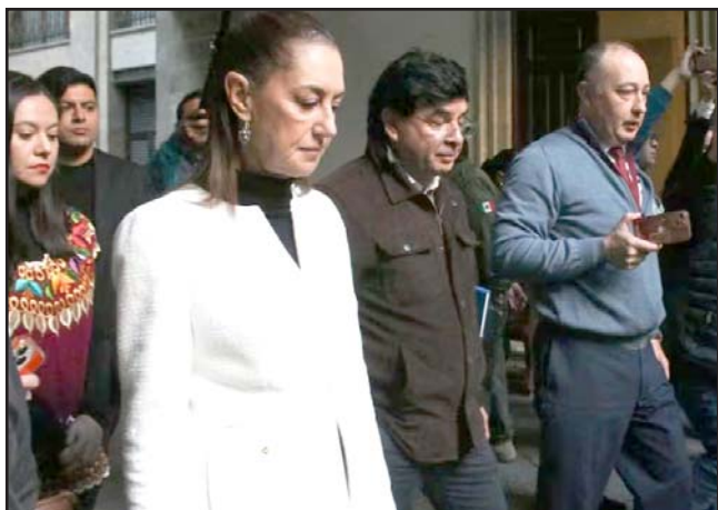
La conferencia matutina fue interrumpida por el sismo.

En Acapulco, el sismo provocó temor en los miles de turistas que se encontraban en los hoteles; cientos salieron de sus habitaciones, a muchos no