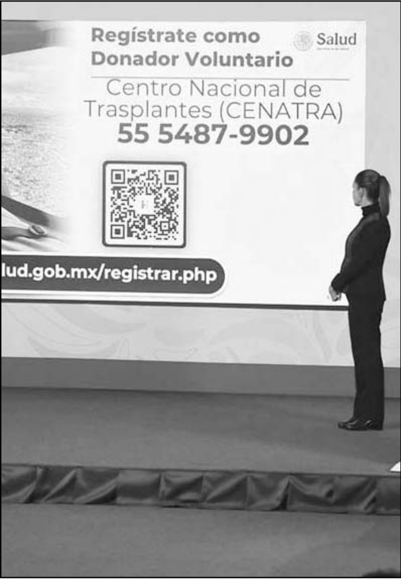
La presidenta Claudia Sheinbaum recibió un informe a detalle

Detalló que tan solo durante el 2025, realizaron 2 mil 783 trasplantes de riñón, de los cuales 76 por ciento se efectuaron en hospi-