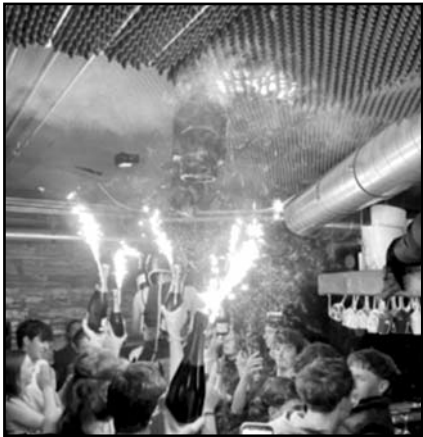
El siniestro de Crans-Montana dejó 40 muertos y 119 heridos.

"Todo indica que el fuego se originó por bengalas o velas bengala colocadas sobre botellas de champán, acercadas demasiado al techo", señaló la fiscal del cantón de Valais durante una conferencia