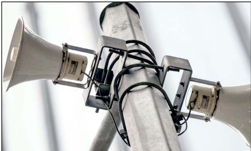
El polígono de alertamiento fue definido por el Sistema de Alerta Sísmica Mexicano y el Centro de Instrumentación y Registro Sísmico.