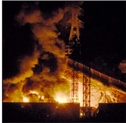
Fuertes explosiones y ruidos similares a los de aviones sobrevolando la capital venezolana.

"Maduro declaró "el estado de Comoción Exterior en todo el territorio nacional, para proteger los derechos de la población, el funcionamiento pleno de las instituciones republicanas y pasar de inmediato a la lucha armada", prosiguió el documento leído en cadena nacional.