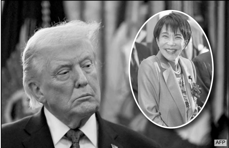
Trump y Takaichi acordaron reforzar la cooperación económica y de seguridad, según la cancillería de Japón.