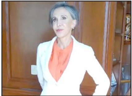
La actriz afirmó sentirse satisfecha con su apariencia actual.