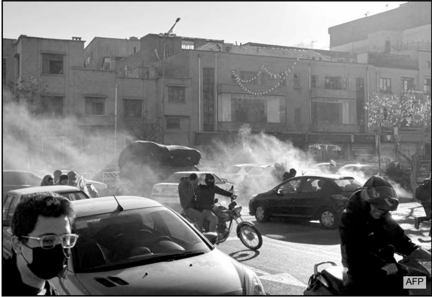
Las manifestaciones, motivadas por la crisis económica, dejaron al menos seis muertos, incluidos civiles y un agente de seguridad.

Una declaración que el canciller iraní, Abás Araqchi, tachó de "imprudente y peligrosa", y avisó que las fuerzas armadas están "atentas" por si se produce cualquier intervención.