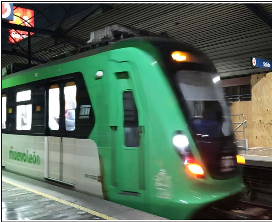
Desde junio del 2022 se ha estado aplicando un deslizamiento mensual.

Dicha alza también permanecerá vigente hasta los 17.50 pesos.