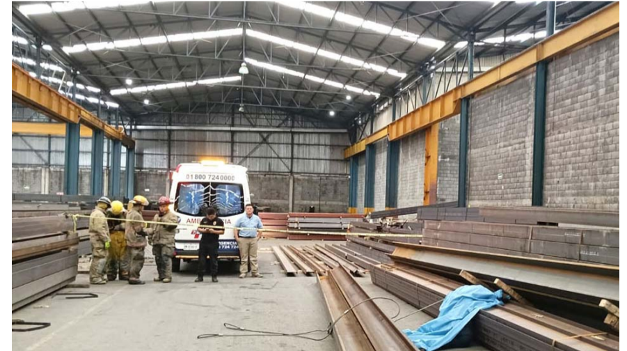
El accidente se registró poco después de las 09:00 horas dentro de la empresa Aceromex

Algunos compañeros del ahora occiso lo estuvieron auxiliando mientras llegaban los elementos de rescate, quienes finalmente al revisarlo se percataron que ya no contaba con signos de vida.