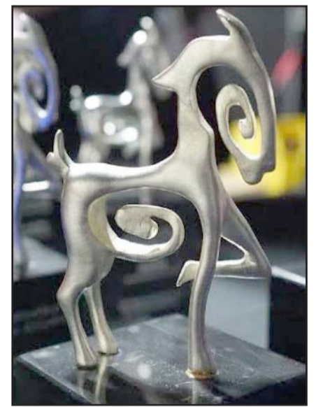
La edición número 21 del festival se realizará hasta el año 2026.

Por último, se comprometieron a que en la edición 21 seguirán con el posicionamiento de Monterrey y Nuevo León como referentes internacionales en el fomento de la industria del cine la cultura y las artes.