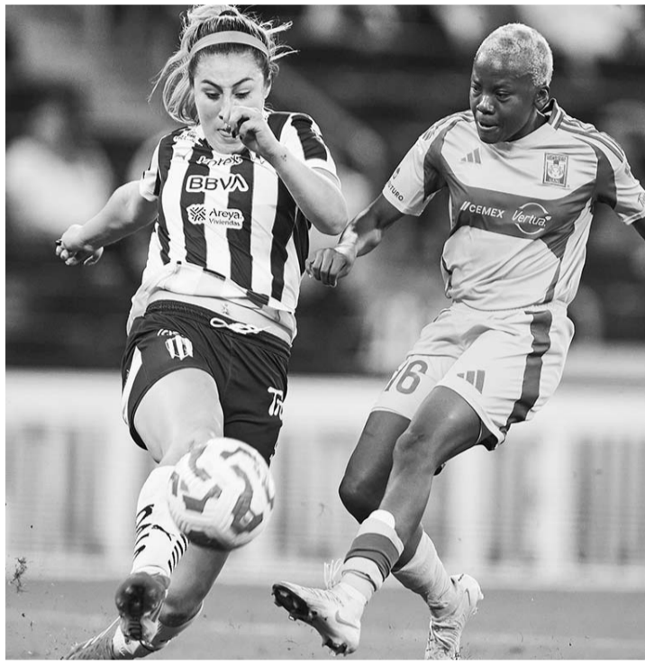
Ambos equipos dejaron el corazón en la cancha.

"Pachuca es un gran rival y vamos paso a paso, entonces estamos listas para afrontar esa eliminatoria y pelear por el pase a la final", expresó.