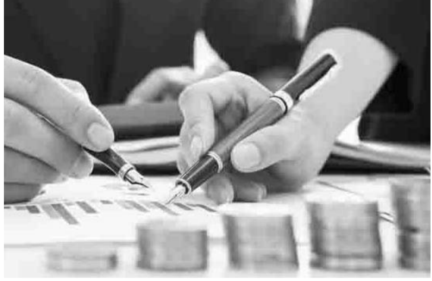
Las importaciones reportaron un aumento del 7.05 por ciento anual en marzo, según datos del Inegi.

de Relaciones Exteriores de China señaló que Donald Trump no ha tenido conversaciones con el presidente chino Xi Jinping, negando las afirmaciones hechas por Trump a finales de la semana pasada. En este contexto, el dólar reanudó las pérdidas frente a sus principales cruces, cayendo 0.51% de acuerdo con el índice ponderado, su mayor retroceso desde el lunes 21 de abril. El mercado de capitales cerró la sesión con ganancias entre los principales índices bursátiles a nivel global, con la excepción del Nasdaq Composite que registró una ligera pérdida de 0.10%. Por su parte, el Dow Jones registró una ganancia de 0.28%, mientras que el S&P 500 avanzó 0.06%, con lo que ambos índices hilaron 5 sesiones en terreno positivo. En México, el Índice de Precios y Cotizaciones de la BMV cerró la sesión con una ganancia de 0.46%, ligando nueve sesiones al alza, algo que no ocurría desde las primeras nueve jornadas del 2023. Al interior, resaltaron los aumentos de las emisoras como Cemex con un alza de 3.7%; Banorte, 2.1%; Grupo México, 2.3%; Walmex, 1.9%; y América Móvil, 1.1%.