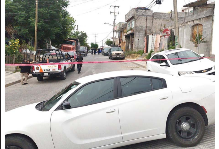
Al lugar acudieron elementos de Protección Civil

Por su parte, elementos del Instituto de Criminalística y Servicios Periciales de la Fiscalía General de Justicia llegaron a la escena del crimen y recogieron como evidencia más de 10 casquillos.