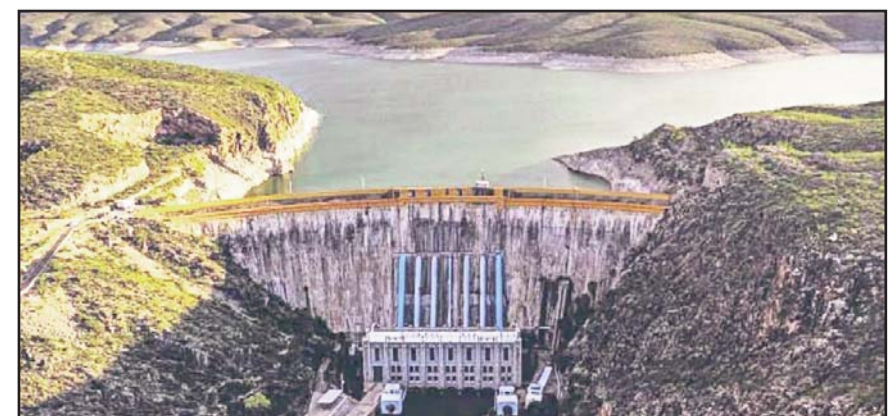
El acuerdo busca mitigar un posible faltante en el actual ciclo de cinco años, que concluirá el 24 de octubre de 2025.

Límites y Aguas (CILA). "La sección mexicana de CILA además dará seguimiento tanto a la ejecución de estas acciones y a la evolución de las condiciones de la cuenca en conjunto con la Conagua, con la meta de generar un plan para el siguiente ciclo del Tratado de 1944", aseguraron.