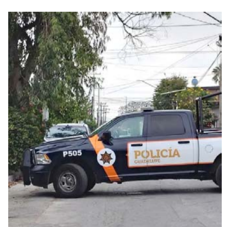
Se realizan las investigaciones.

Una vez que el personal de Servicios Periciales revisó el cadáver, así como la zona de los hechos, trasladaron el cuerpo en la Unidad del Servicio Médico Forense al Anfiteatro del Hospital Universitario para la autopsia correspondiente.