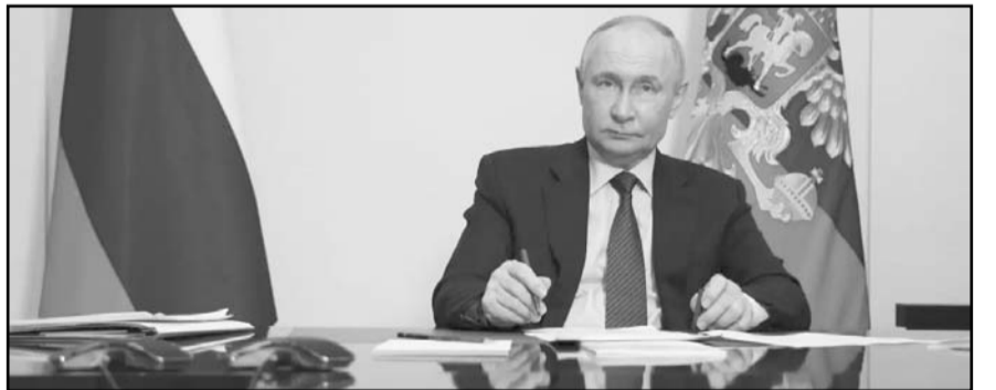
Rusia y Ucrania están inmersos en una guerra que comenzó hace tres años.

Las encuestas señalaban que los liberales estaban encaminados a una nueva victoria y que ganarían una cómoda mayoría parlamentaria, aunque en los últimos días las cifras señalaron que la ventaja del Partido Liberal en Canadá se había reducido con respecto al opositor Partido Conservador.