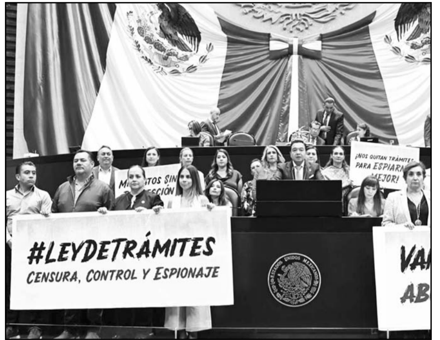
El pleno de San Lázaro aprobó en lo general la Ley Nacional para Eliminar los Trámites Burocráticos que envió la presidenta Sheinbaum.

algunos desatinos, como que se incumple en acuerdos internacionales, o han dicho que se contó con poco tiempo para el diseño de esta iniciativa, pero ambos planteamientos son incorrectos. El primero, organismos internacionales como la OCDE han recomendado a todos los países tres acciones: combate a la corrupción, transparencia