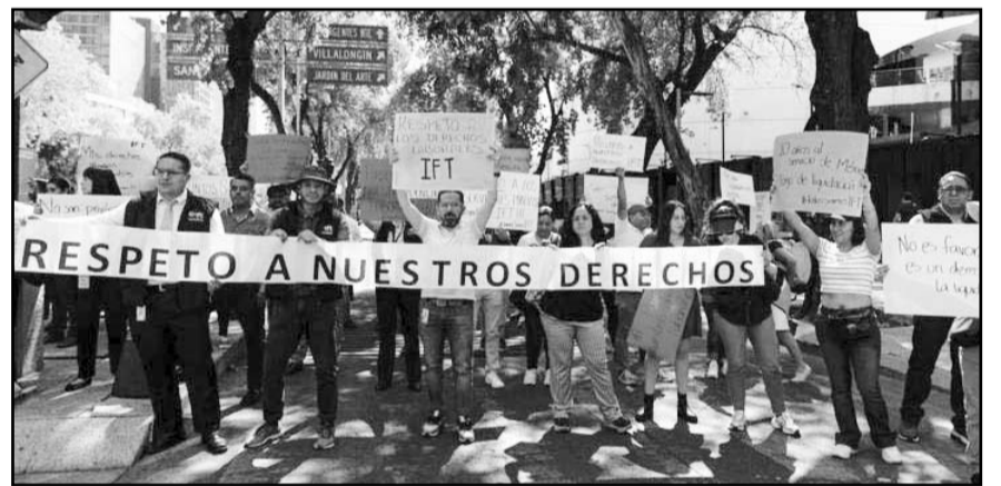
Ante extinción del IFT, trabajadores protestan en el Senado; acusan que no hay mesas de diálogo para una transición.