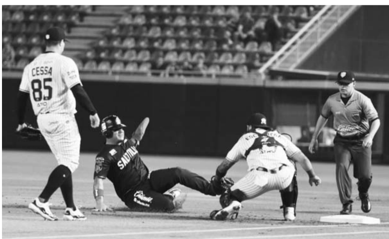
La novena regia no pudo superar a los coahuilenses.

A eso hay que sumarle que la escuadra del Porto no disputará en la próxima temporada la Liga de Campeones de la UEFA, lo que en parte es por responsabilidad de Anselmi, quien no ha tenido buenos resultados en el club.