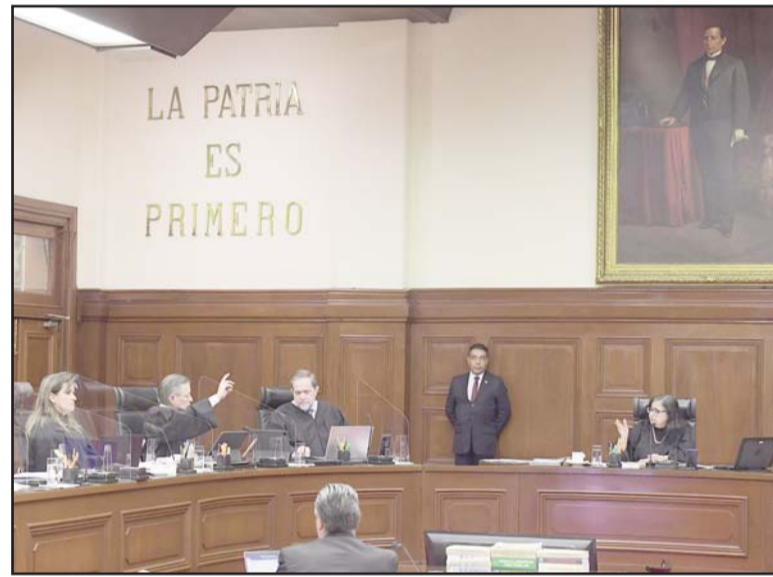
La ministra Loretta Ortiz defendió la constitucionalidad de la reforma penal por inteligencia artificial.

La ministra ponente, Loretta Ortiz Ahlf, planteó declarar fundado el recurso de inconstitucionalidad promovido por el Poder Ejecutivo, que solicitó invalidar la reforma, al considerar que existen violaciones al principio de taxatividad en materia penal, por la falta de claridad y certeza sobre lo que debe entenderse