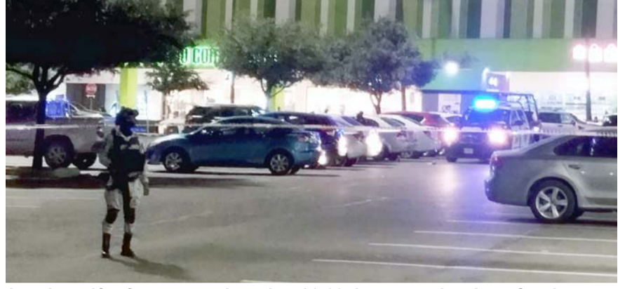
La ejecución fue reportada a las 20:00 horas en la plaza Sendero, en Apodaca

Los efectivos ministeriales buscaban entre las cámaras de seguridad, las características del presunto criminal y saber la forma en que se dio a la fuga la noche del lunes.