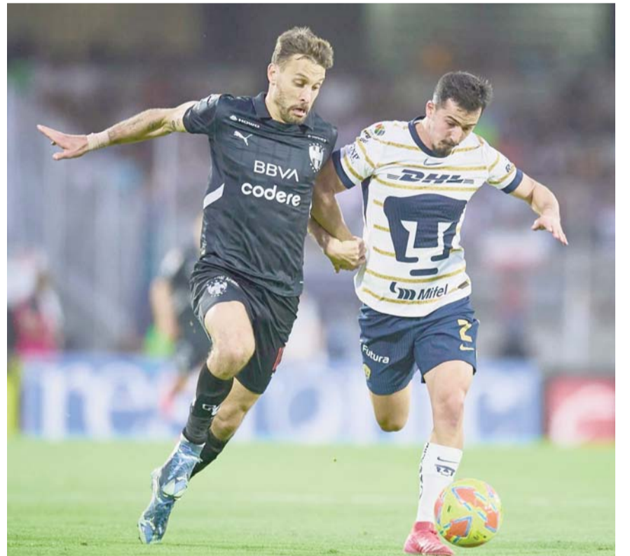
Monterrey recibe a Pumas el domingo en busca de ganar ahora sí.

Rayados y Pumas definirán en el play in definitivo al rival del Toluca en los cuartos de final del campeonato mexicano.