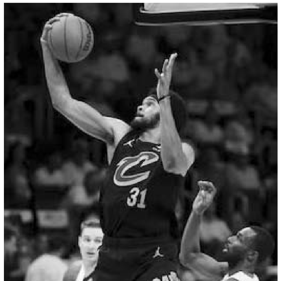
Cavaliers de Cleveland pasó con facilidad sobre el Heat.

Damián Lillard, jugador de los Bucks de Milwaukee, se perderá lo que resta de la postemporada en la NBA ya que se lesionó y presenta un desgarro en el tendón de Aquiles.