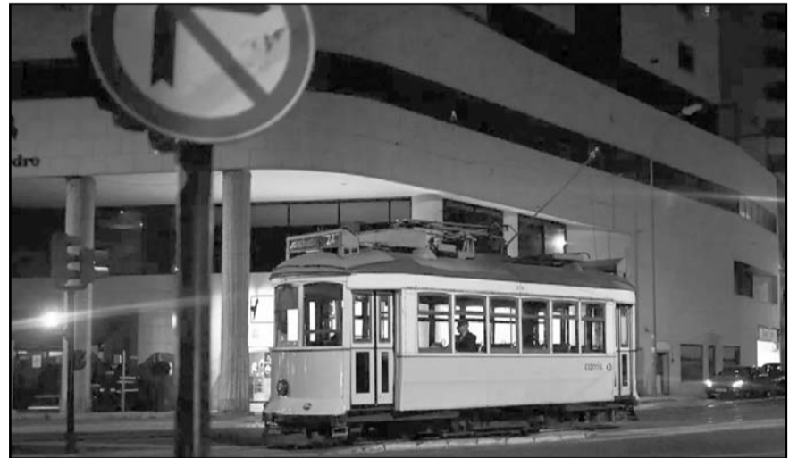
El apagón de origen desconocido duró varias horas.

El tráfico portuario está funcionando con normalidad, y el aéreo ha sufrido algunos retrasos y cancelaciones, ha proseguido, con solo 300 vuelos anulados de los 6.000 programados en toda España.