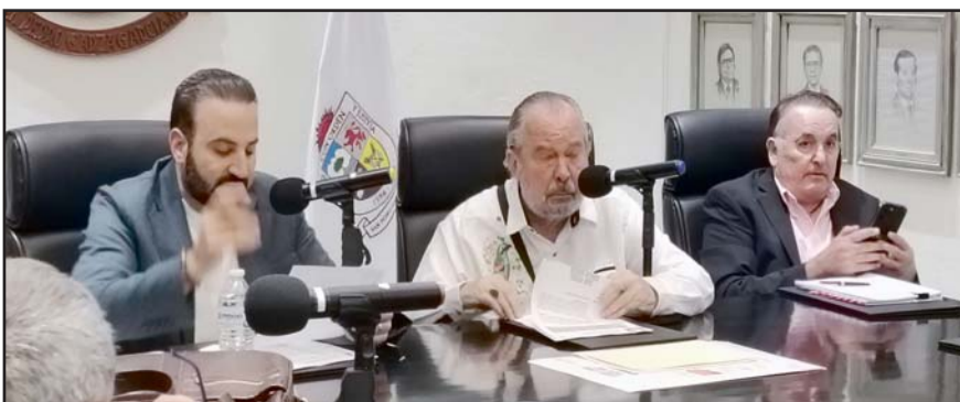
Se realizaron acuerdos con los desarrolladores y el Cabildo.

Con la decisión aprobada este lunes por mayoría en el Cabildo, con cuatro votos en contra de los ediles de Movimiento Ciudadano y los independientes, el Municipio refuerza su compromiso con un San Pedro ordenado y sustentable.