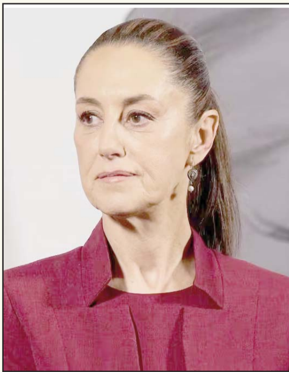
Sheinbaum descartó una reforma fiscal, pero señaló que buscarán ajustes que no afecten al contribuyente.

También impugnó la integración del Consejo Estatal de Archivos y los requisitos de elegibilidad, señalando que estos limitaban derechos humanos.