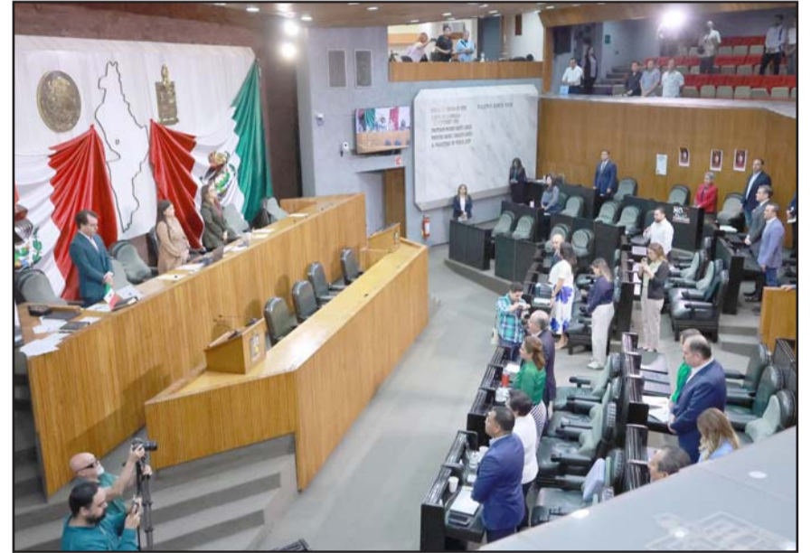
Antes de la reubicación, las autoridades federales realizarán una supervisión para evitar otro incidente como el ocurrido hace días.

"Hay que ir por partes, la primera es que se le puedan hacer revisiones periódicas a la empresa por parte del gobierno del estado para que haya acuerdo entre Profepa y la Secretaría de Medio Ambiente para que los inspectores es-