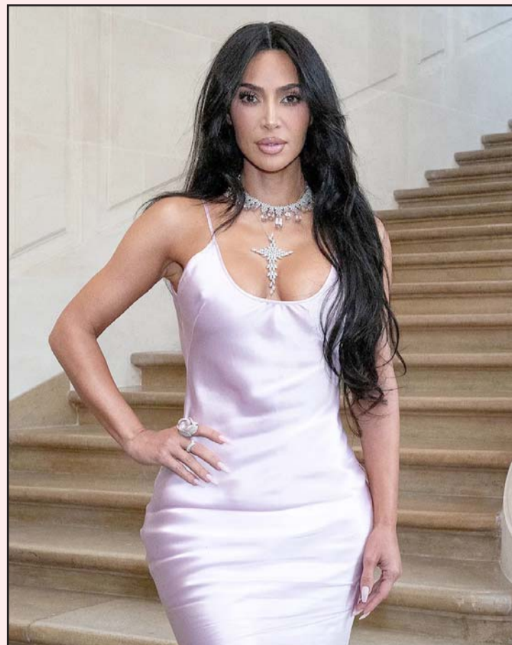
El juicio arrancó ayer lunes en el Palacio de Justicia de París.