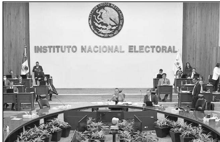
Candidatos a ministros y magistrados podrán gastar hasta 1.4 millones de pesos, acuerda INE.

El microsítio es parte de la estrategia del INE para implementar el principio constitucional de paridad y prevenir que personas con antecedentes de violencia lleguen al poder, como parte de un proceso electoral que busca ser más equitativo, justo y libre de violencia de género.