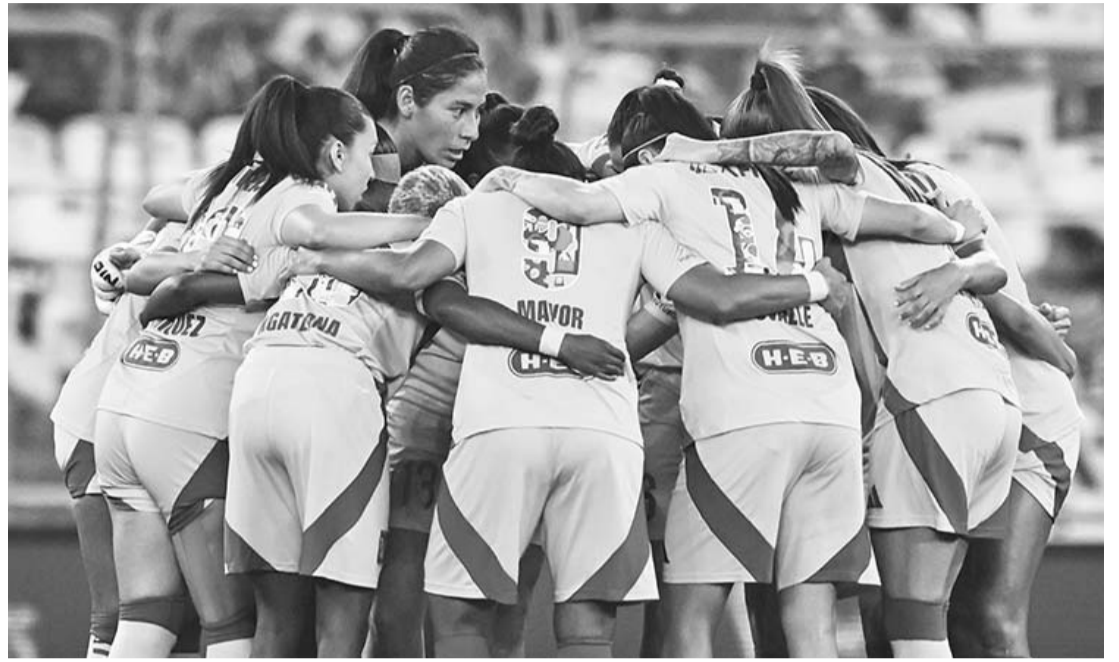
El técnico felino lamentó las lesiones de sus jugadoras.