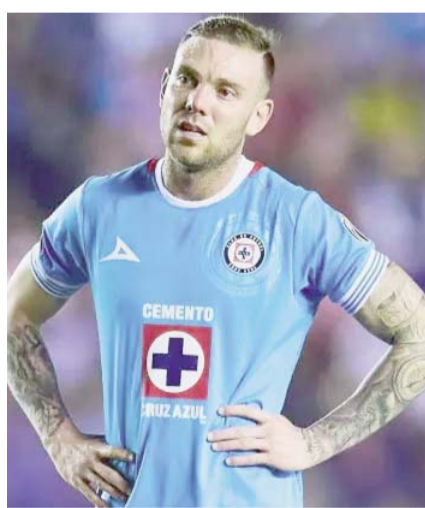
La Máquina, ¿ahora sí?

Concachampions del 2021, tras caer 1-0 con Monterrey en la semifinal de ida, Cruz Azul fue el local en la revancha, pero los regios vencieron 4-1 a los celestes y accedieron a la final.