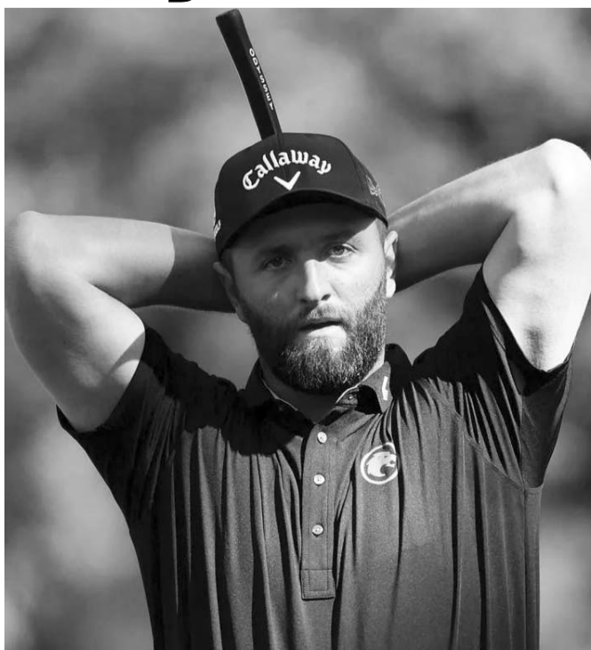
Los planes están en marcha.