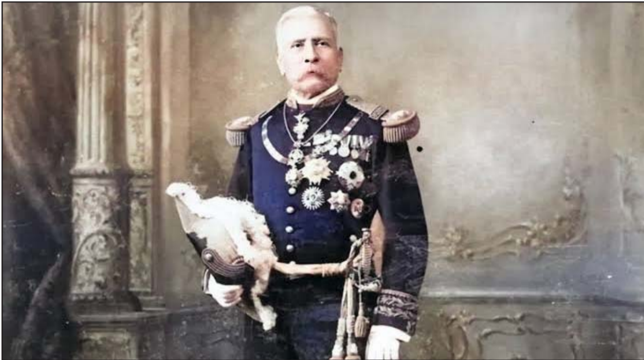
Debatirán el cuestionamiento si Porfirio Díaz fue un dictador o un modernizador en la historia mexicana.