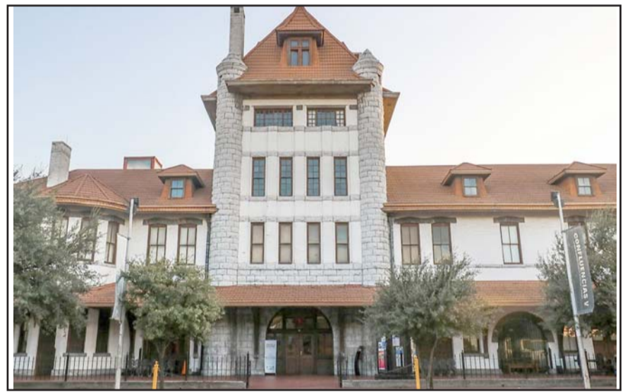
El Día Mundial del Libro y del Derecho de Autor se celebró el 23 de abril.

Esta actividad es organizada por la Coordinación de Servicios Educativos de CONARTE y se llevará a cabo este miércoles 30 de abril a partir de las 16:00 horas, con entrada sin costo y para todo público. La Casa de la Cultura de Nuevo León se ubica en Colón 400, entre las calles Emilio Carranza y Mariano Escobedo, en el Centro de Monterrey.