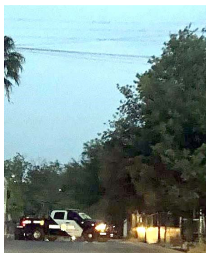
El hombre no fue identificado.

Cuando se encontraban en el lugar, fueron informados de una persona lesionada por impactos de arma de