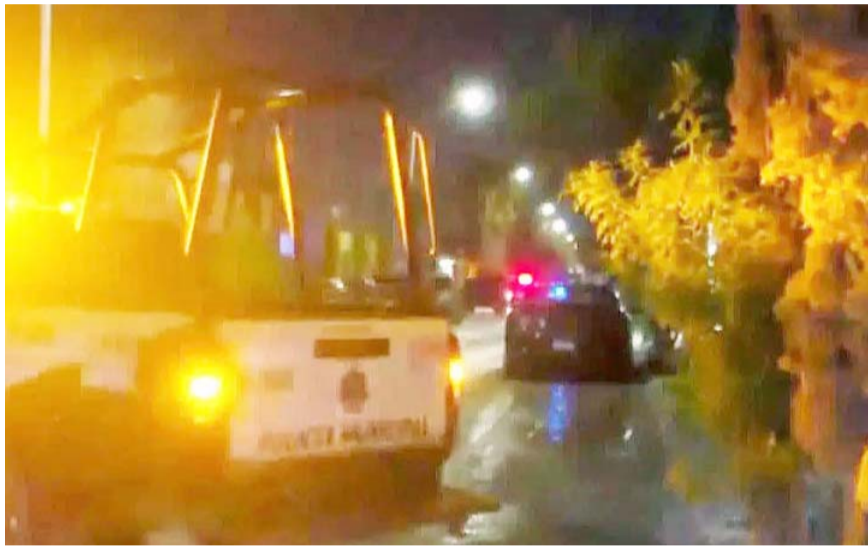
La muerte violenta fue reportada a las 22:05 horas sobre la calle Paseo San Isidro, en la Colonia Paseo de San Isidro.

Al lugar arribaron elementos de Protección Civil municipal quienes al brindarle los primeros auxilios al masculino, ya no contaba con signos vitales.