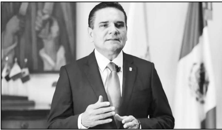
Aureoles realizó el pago de garantía de 52 mil pesos que le impuso el secretario en funciones de juez para mantener vigente la suspensión y frenar su detención.