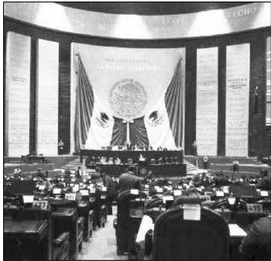
Diputados aprueban reforma que permite a funcionarios de Pemex, CFE, SAT y Banxico portar armas.