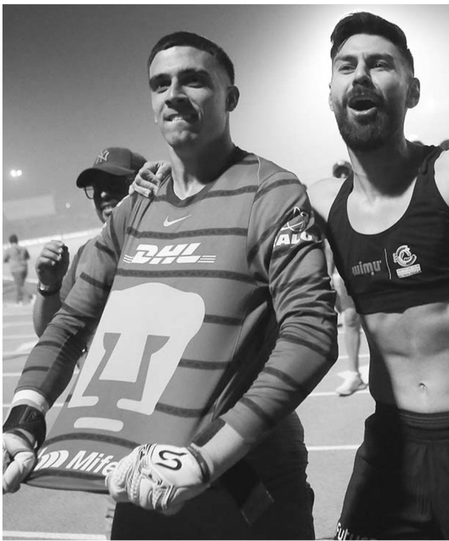
El arquero unamita paró tres penales en la tanda ante Juárez.

Luego del triunfo, Pumas tendrá que buscar el último lugar en la Liguilla del Clausura 2025 de la Liga MX ante Monterrey, equipo que perdió en casa ante Pachuca.