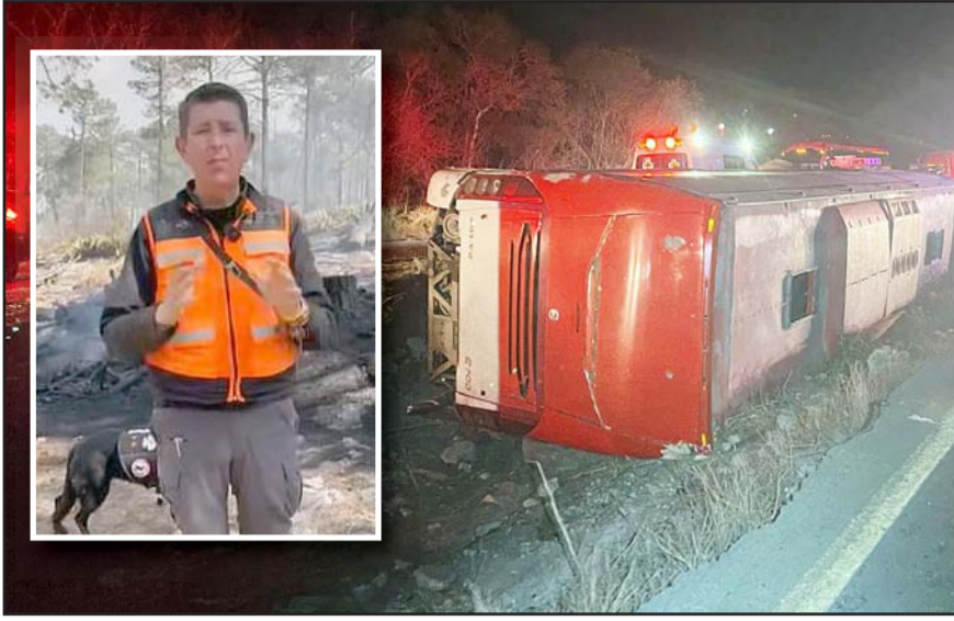
Las cifras contrastan con las del 2024, en el que se registraron 13 muertos.