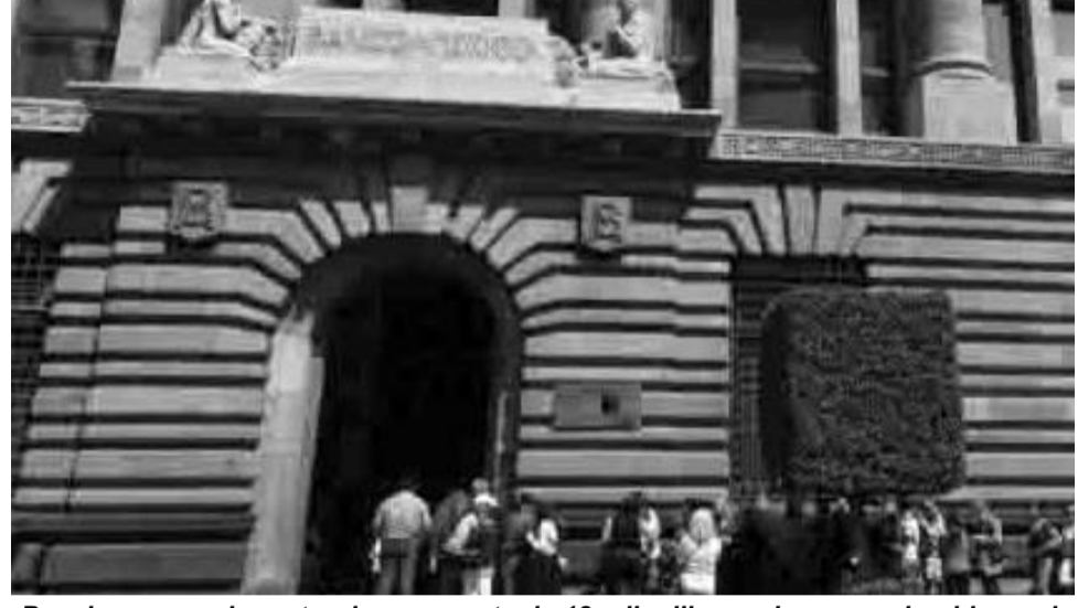
Banxico se queda corto: da remanente de 18 mil millones de pesos al gobierno de Sheinbaum

Desde 2016 no se veía una escena como ésta: el Banco de México (Banxico) anunció que el gobierno de Claudia Sheinbaum recibirá un remanente de operación de 17 mil 994.8 millones de pesos; una cifra que se quedó muy lejos de lo que el mercado esperaba. Esta tarde del 28 de abril, la institución autónoma más importante del país explicó que la Junta de Gobierno definió que sí se entregará un monto de remanentes a la Secretaría de Hacienda y Crédito Público (SHCP). Desde 2016 no se veía un escenario como este, pero no porque se hubiera retenido el dinero, sino porque simplemente no había sobrado. Durante años, no se generaron excedentes o las obligaciones de Banxico no permitieron que pudieran ser entregados al gobierno federal. Hasta ahora. En 2016, Banxico entregó un remanente de 321 mil 700 millones de pesos, casi veinte veces más que lo que ahora recibirá el gobierno federal. Menor a lo esperado Bajo el marco de su propia ley, el banco central recordó que el recurso aprobado en este 2025 deberá entregarse a más tardar el 30 de abril. Es decir, el reloj ya corre contra