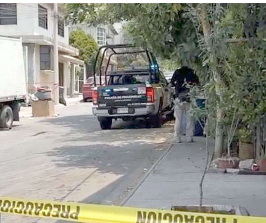
La persona presentaba diversas golpes y lesiones de arma blanca, mismas que le ocasionaron la muerte.

Agentes ministeriales y Policías de Linares llegaron al lugar del hallazgo del masculino sin vida y comenzaron con las investigaciones del caso.