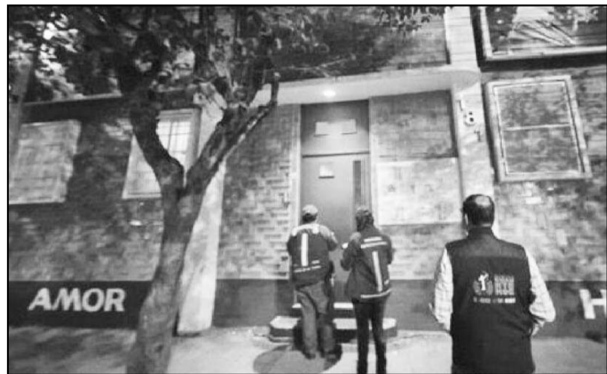
SEP lamenta muerte de estudiante de academia militarizada en Morelos; verificará documentación de la institución

Representantes del sector ganadero en estados del sur del país, como Chiapas y Oaxaca, solicitaron mayor apoyo federal para hacer frente a la contingencia.