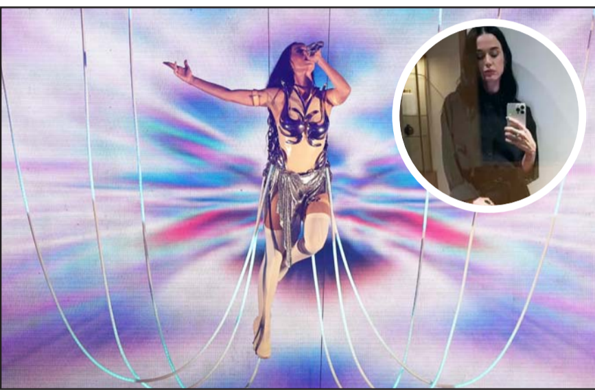
La cantante llegó a la ciudad de Monterrey para ofrecer dos conciertos en la Arena Monterrey.