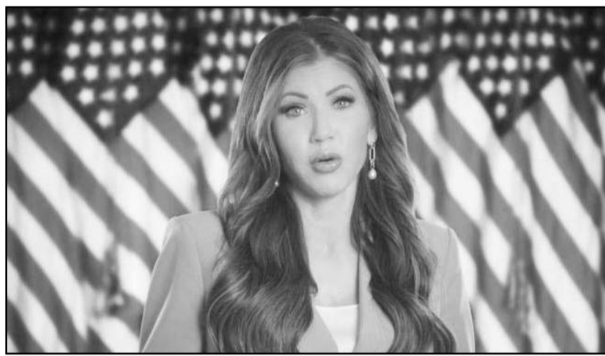
"No es correcto, lo pueden hacer en su país, pero no en el nuestro. Lo que está mal es que las empresas mexicanas promuevan esos anuncios", Claudia.

y mejora regulatoria. Esta reforma es un eslabón más que complementa las acciones que hemos venido aprobando, la reforma de la Ley Orgánica de la Administración Pública, la creación de la Secretaría Anticorrupción y Buen Gobierno, y el Plan México, que prevé fortalecer la inversión y el mercado interno", expuso.