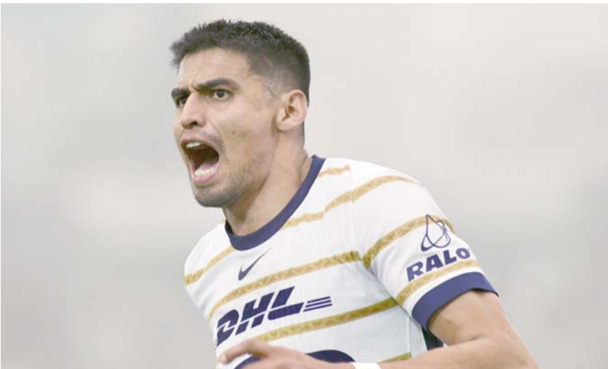
La escuadra capitalina quiere saldar deudas con Rayados.