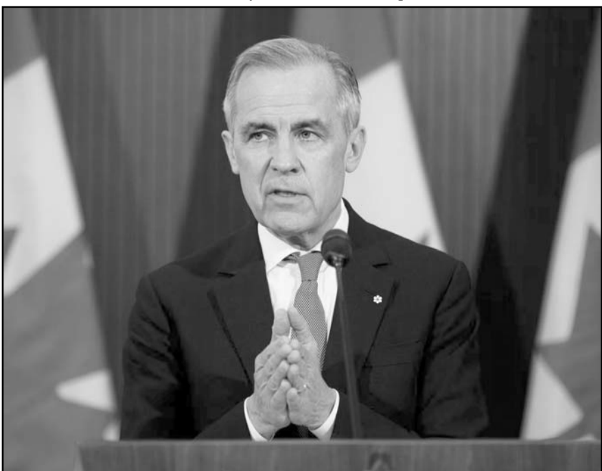
Las últimas tres elecciones habían sido ganadas por el Partido Liberal del primer ministro Mark Carney.

Putin ya había anunciado una tregua del 19 al 20 de abril, por Pascua, pero ambos bandos se acusaron mutuamente de violarla.