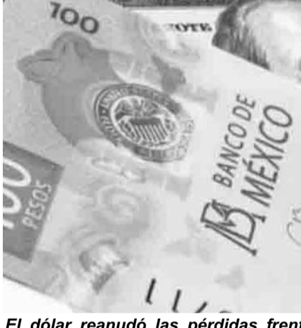
El dólar reanudó las pérdidas frente a sus principales cruces, cayendo 0.51% de acuerdo con el índice ponderado.

La divisa mexicana en los mercados internacionales concluyó alrededor de 19.59 pesos por dólar, lo que significó una depreciación de 0.46% o 9 centavos respecto a la jornada anterior, de acuerdo con información de Bloomberg. Por su parte, el dólar al menudeo terminó este lunes en 20.05 pesos a la venta en las ventanillas de las sucursales de Banamex, 0.15% o 3 centavos por arriba del cierre del viernes pasado.