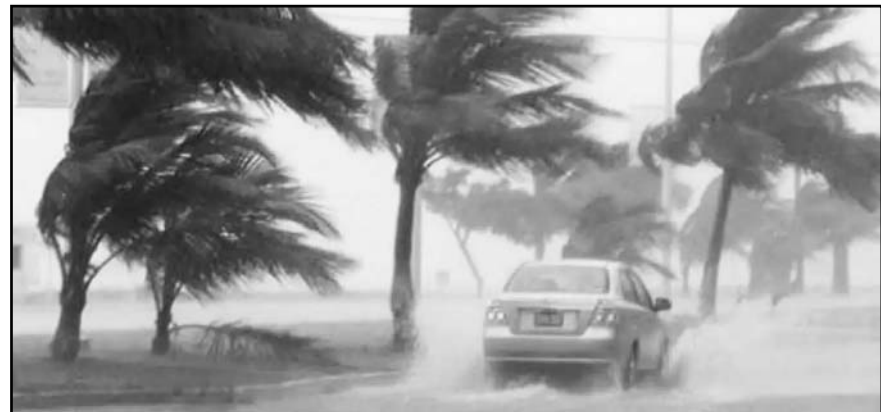
Para el mes de junio de 2025, se prevén lluvias por arriba y cercanas al promedio en la mayor parte del territorio nacional

Asimismo, se espera una disminución en las precipitaciones en la Península de Yucatán, mientras que en el resto del país se observarán precipitaciones dentro de los valores promedio.