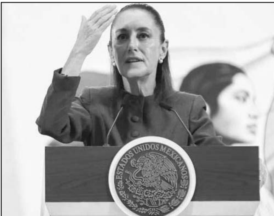
Sheinbaum Pardo aseguró que se está atendiendo la situación del gusano barrenador en el ganado.

La investigación aún está abierta, amigos y familiares del joven fallecido, esperan recibir justicia tras el sombrío hecho.