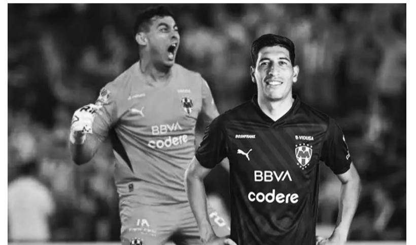
Monterrey debe evitar llegar a los penales.