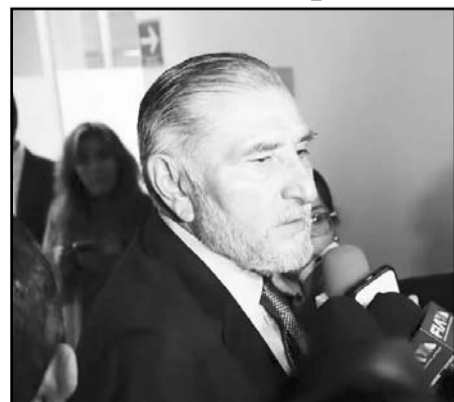
Adán Augusto anunció que la reforma a la Ley de Telecomunicaciones pasará al periodo extraordinario.

periodo extraordinario en el que se votará el dictamen correspondiente. López Hernández subrayó que se busca abrir el debate con todos los sectores involucrados. Por su parte, el presidente del