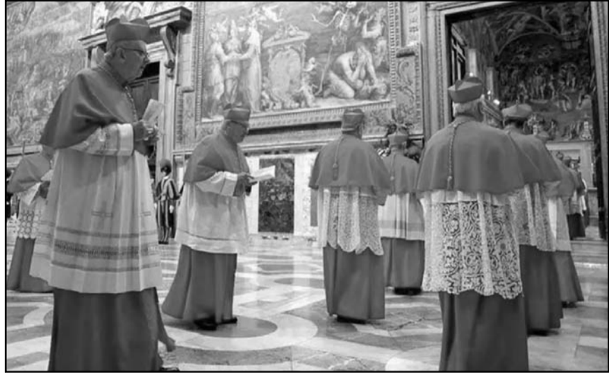
La elección del 7 de mayo refleja un deseo de los cardenales de contar con tiempo adicional para debatir el futuro de la Iglesia.

Los críticos, sin embargo, expresaron su preocupación por que la legislación otorgue a las autoridades un mayor poder de censura.