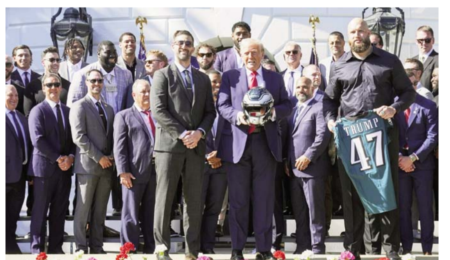
El presidente de Estados Unidos, Donald Trump, recibió a los campeones.

Filadelfia logró en febrero pasado su segundo título de la NFL tras vencer en ese Súper Tazón y por un marcador de 40-22 a los Jefes de Kansas City.