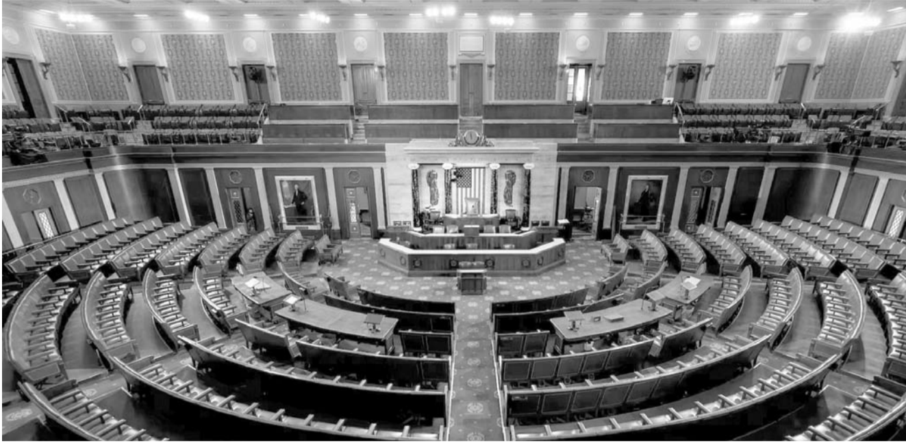
La primera dama Melania Trump respaldó la ley a principios de marzo.

MONTERREY, N.L. MARTES 29 DE ABRIL DE 2025