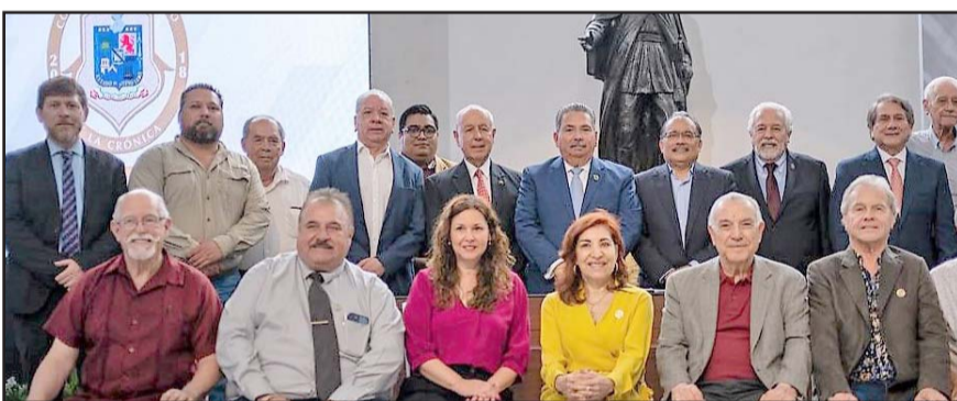
El alcalde de Escobedo, Nuevo León, Andrés Mijes Llovera y compañía.