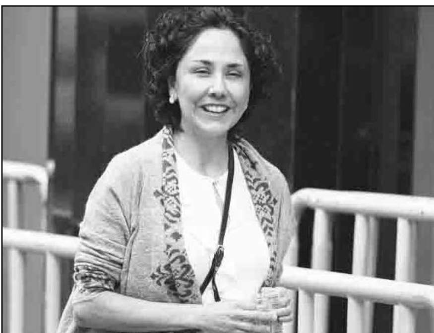
Heredia arribó en un avión de la Fuerza Aérea Brasileña (FAB), enviado a Lima una vez que las autoridades peruanas otorgaron el necesario salvoconducto.

"Hemos informado a Egipto de que el movimiento no está dispuesto a renunciar a las armas de la resistencia. Estas armas son propiedad del pueblo palestino, no de Hamás ni de la lucha", dijo una fuente de alto rango del grupo bajo condición de anonimato y que consideró la exigencia "inaceptable en su totalidad y detalle".