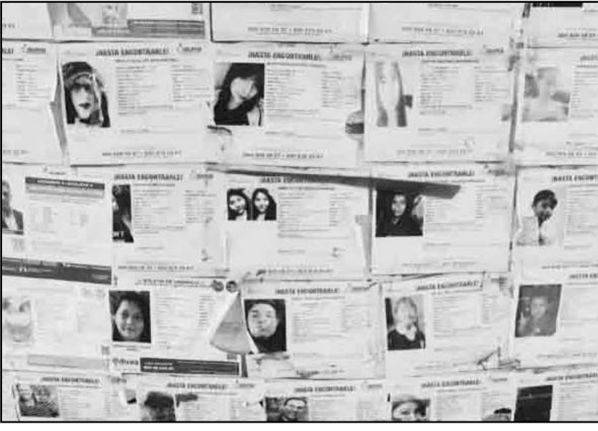
El proyecto propuesto por Kenia López indica que el presupuesto destinado debe garantizar este derecho.