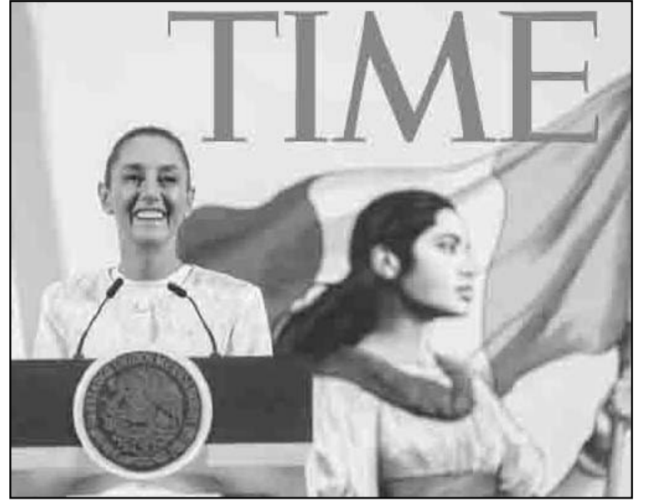
De acuerdo con TIME, esta lista reconoce a las personas que están transformando el mundo, para tratar de comprender nuestros tiempos.

El menor de ellos es el nadador francés Léon Marchand de 22 años;