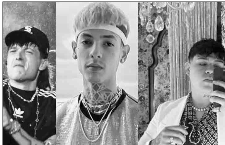
El género de corridos tumbados, actualmente está representado por Peso Pluma, Natanael Cano, Junior H, entre otros.

Señaló que más allá de condenar el hecho, se abre una "buena discusión" sobre este tipo de canciones.