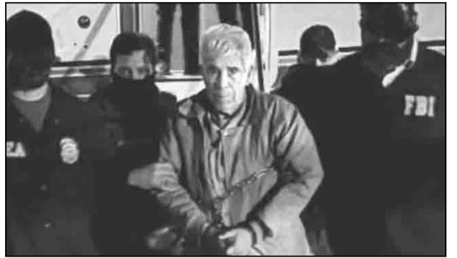
Rafael Caro Quintero llega a Estados Unidos tras extraditado, el 27 de febrero de 2025.

En la Corte del Distrito Este de Nueva York enfrenta múltiples cargos por crimen organizado, tráfico de drogas y uso de armas de fuego.