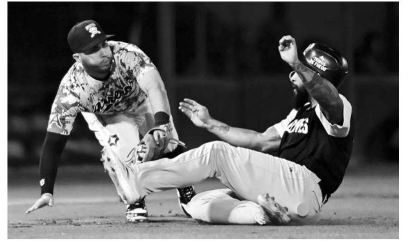
La novena regia arranca mañana hostilidades.