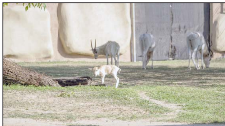
En los últimos días nacieron berberiscos, un borrego entre otros