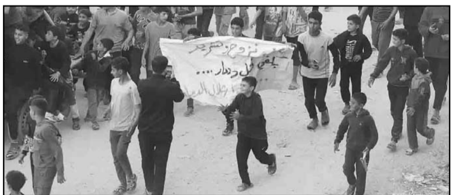
A fines de marzo también se realizaron protestas contra Hamás en Gaza.

Otro expresidente que estuvo asilado en Brasil fue el ecuatoriano Lucio Gutiérrez, quien llegó al país tras ser destituido, en 2005. Fiel a esa tradición diplomática, Brasil asumió el año pasado la custodia de la embajada peruana en Caracas, después de que los diplomáticos de ese país fueran expulsados de Venezuela tras el polémico proceso electoral que confirmó el poder a Nicolás Maduro.