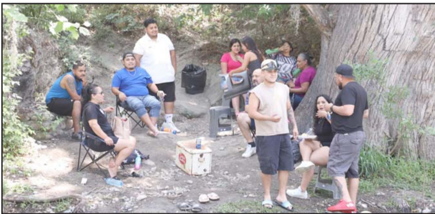
Las autoridades de Allende se reportaron listas.

“Emparejamos el camino para que todos puedan caminar por un lado del Río, desde los más pequeños hasta los más adultos, adecuamos una bajada para personas con discapacidad, así como un espacio en la parte superior para que estacionar su vehículo, pusimos banquetas para poder disfrutar del Río, un amplio camino para que todos puedan pasear y hasta asadores para que las familias puedan hacer aquí su carnita asada”, señaló el edil.