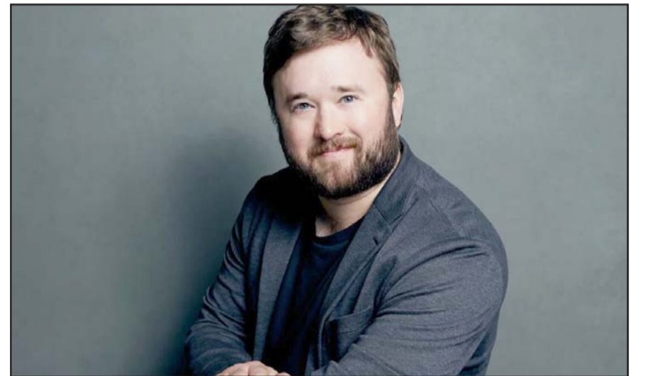
Este no ha sido el único incidente legal del ex niño prodigio.

A pesar de los altibajos, Osment continúa activo en la industria y recientemente participó en la película Papapada dos veces. Su situación actual ha generado preocupación entre sus seguidores, quienes esperan verlo recuperarse pronto.