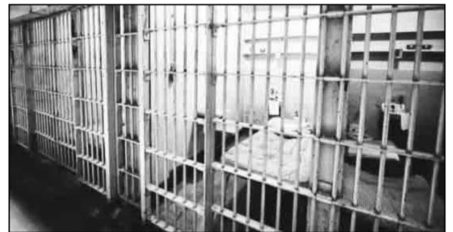
Dan 13 años de prisión a servidor público de la extinta PGR; es acusado por hostigamiento y abuso sexual.