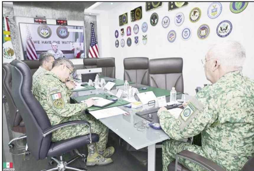
El general Ricardo Trevilla Trejo atendió una videollamada solicitada por el general Gregory M. Guillot.

La Defensa informó que se abordaron temas sobre el fortalecimiento del adiestramiento militar e intercambio académico que se realizan en el marco de los mecanismos de cooperación existentes desde 2016, relacionados con la transmisión mutua de experiencias y procedimientos,