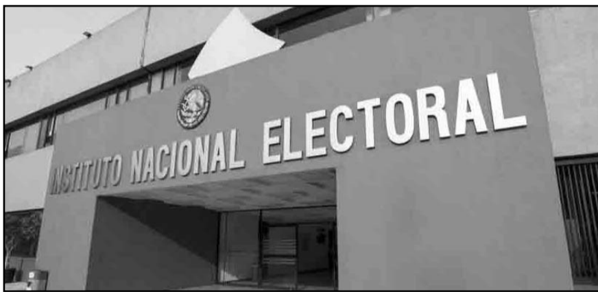
Para la jornada del 1 de junio, el INE requiere 432 mil 745 mamparas, de las cuales ya han producido un 49%.

Para la edición de 2025, TIME eligió a cinco personas como principales influyentes: la actriz Demi Moore, la tenista Serena Williams, los cantantes Ed Sheeran y Snoop Dogg, y Demis Hassabis, CEO de Google DeepMind.