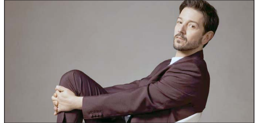
Fue incluido en la categoría de "Artistas", debido a sus contribuciones.

Posteriormente, ha formado parte de producciones exitosas como "Atlético San Pancho", "Y Tu Mamá También", "La Terminal" y "Rudo y Cursi".