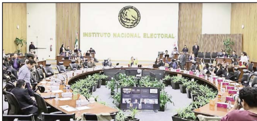
Los consejeros aseguraron que la medida representa un retroceso, según el propio Instituto, ya que se implementa desde 2003.

Señaló que tendrían que imprimir cuadernillos tamaño carta con la lista de las candidaturas, que tendrían un estimado de 42 páginas, lo cual complicaría al