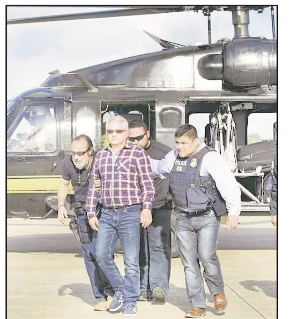
Yarrington fue entregado a agentes de la FGR en la frontera de San Diego con San Isidro.

El exgobernador, Tomás Yarrington fue arrestado en Italia en 2018 y extraditado a Estados Unidos, donde enfrentó un proceso judicial que culminó con una sentencia condenatoria.