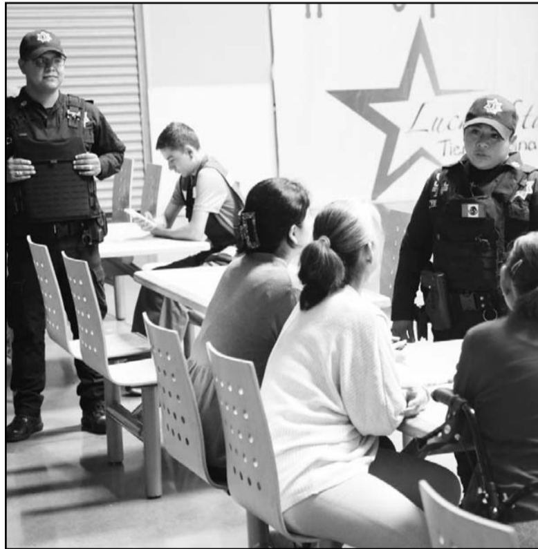
El operativo de extenderá hasta el día 27 de abril

Con estas acciones, Escobedo reafirma su compromiso de ser un Municipio responsable, organizado y enfocado en el bienestar de sus ciudadanos.(CLR)