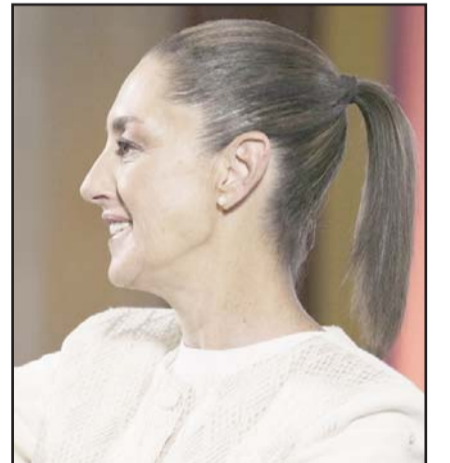
Sheinbaum acusó al gobierno estadounidense de intervenir constantemente en seguridad.

La titular del Ejecutivo federal comentó que su similar ecuatoriano fue el responsable de la invasión a la embajada de México y "a nuestra soberanía".