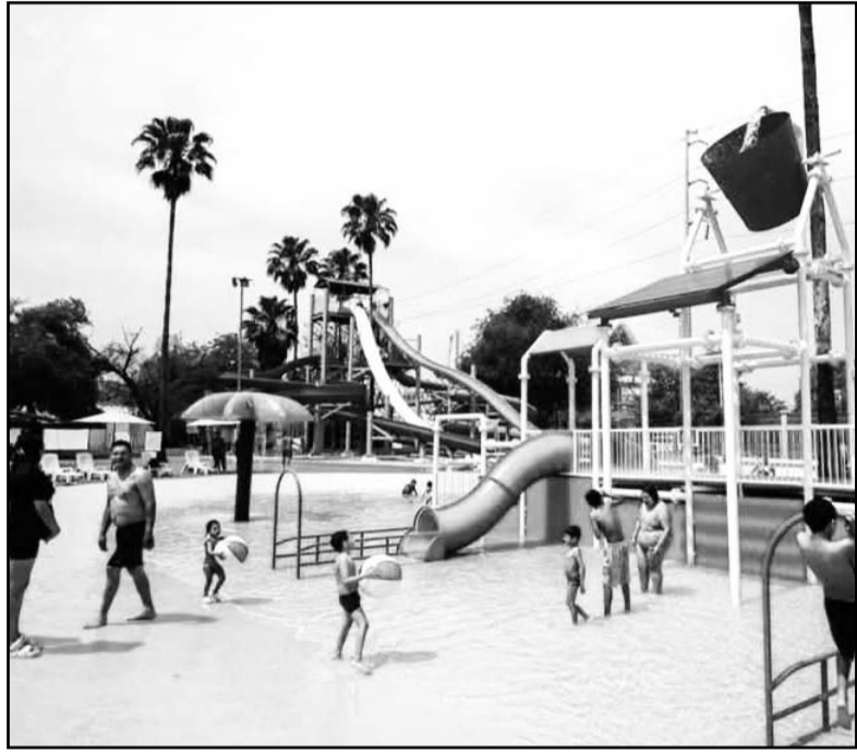
La idea es que sea aprovechado por la mayor parte de familia.

Por lo que las rutas establecidas para hacer senderismo o alguna otra actividad deportiva son: Pared de los gatos, Pequeña Lulú, Casa del Dr. Aguirre Pequeño, Las Rejas, Cueva de la Virgen, Pico La Puerta, Cueva de los murciélagos, Dingos, La Rayita, Pico 22, Guitarras/médicos (ciclismo de montaña), Rinos (ciclismo de montaña), Rompepicos (ciclismo de montaña), Ruta vértigo, Cazuelas, Horcones (hasta la meseta), Navajas, Pico licos y Morteros. (AME)