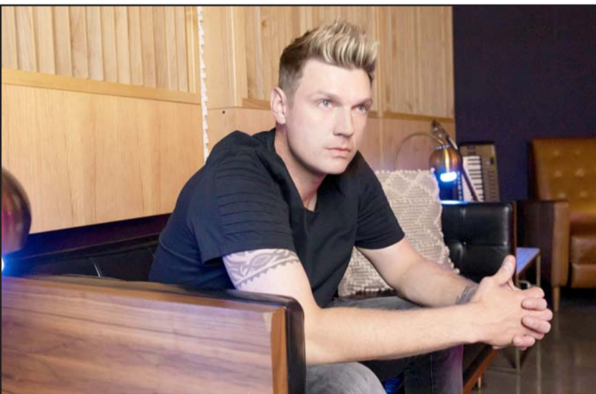
El equipo legal de Nick Carter ha negado categóricamente las acusaciones y emitió un comunicado defendiendo la inocencia del artista.