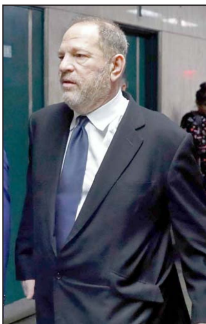
Su estado de salud es "alarmante".