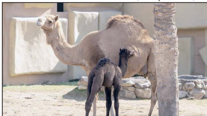
Además de una remodelación ya hay nuevos animales

Los interesados podrán descubrir sus actividades a través del Facebook: ZoológicoLaPastora; el Instagram: zoolapastora; y en Lapastora_zoo, en X.