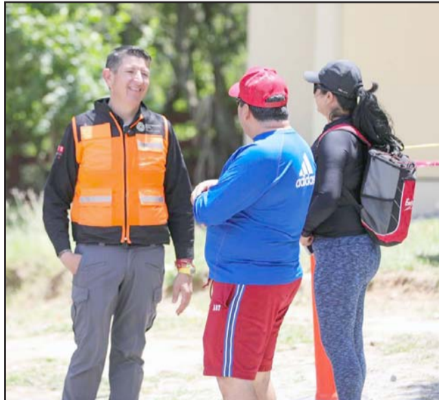
Se les dieron ciertas recomendaciones antes de subir los cerros o las montañas.