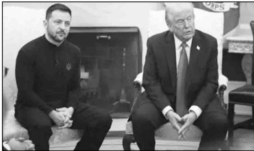
Autoridades estadounidenses esperan que el acuerdo pueda firmarse "esta misma semana".