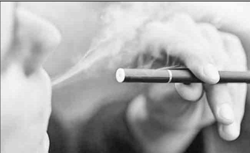
Tabacaleras reiteran que calentadores de tabaco sí están permitidos en la ley; "no es un vapeador ni un cigarrillo electrónico", afirman

Philip Morris México también hizo énfasis en su enfoque de transformación hacia un futuro libre de humo, donde los productos de riesgo reducido puedan ofrecer beneficios tanto para la salud pública como para los propios fumadores adultos. "Nuestro objetivo es dejar atrás el cigarrillo y lograr que, en el futuro, quienes continúan fumando puedan optar por alternativas que reduzcan significativamente su exposición a sustancias nocivas", concluyeron.