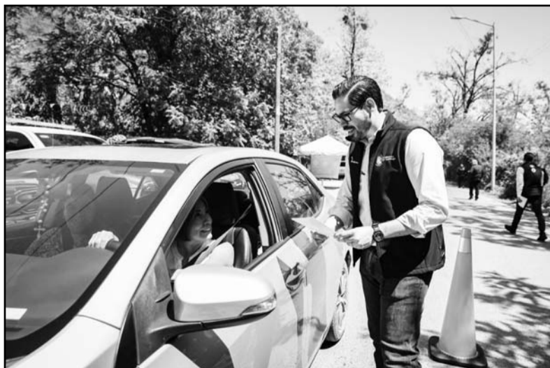
El alcalde estuvo emitiendo recomendaciones a los paseantes.

"Es importante reiterarles a los visitantes que eviten consumir