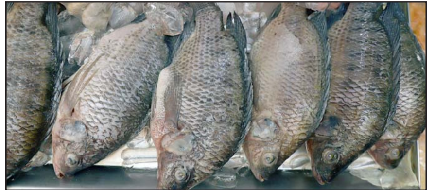
El llamado a la ciudadanía es a comprar en establecimientos verificados.

“Los municipios se tendrán que ir actualizando cada vez que lo haga el estatal, muchos de los municipios tienen más de 20 años sin actualizar esta importante herramienta y la mayoría de los municipios rurales no cuentan con un atlas de alto riesgo”, señaló el líder de los legisladores panistas en el Congreso Local.