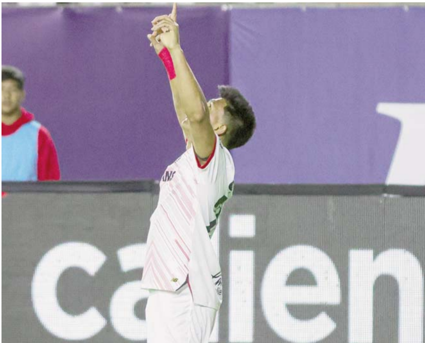
Los Diablos ya son inalcanzables en el torneo.

De paso, el conjunto potosino se quedó en las 15 unidades y con ello ya no tienen posibilidades de jugar el play in.