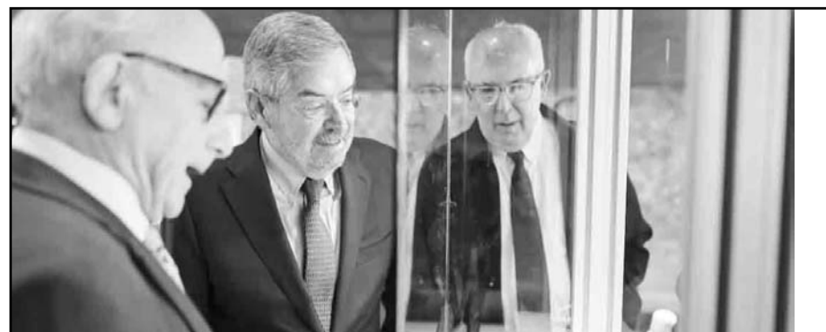
Se han restituido 2 mil piezas arqueológicas en el gobierno de Sheinbaum: De la Fuente; "son la riqueza de nuestras culturas"

"Desde luego, ha habido algunas que son monumentales, son muy impresionantes, grandes estelas que han enriquecido la perspectiva que, desde ahora, tenemos, de la enorme riqueza de nuestras culturas originarias", expresó.