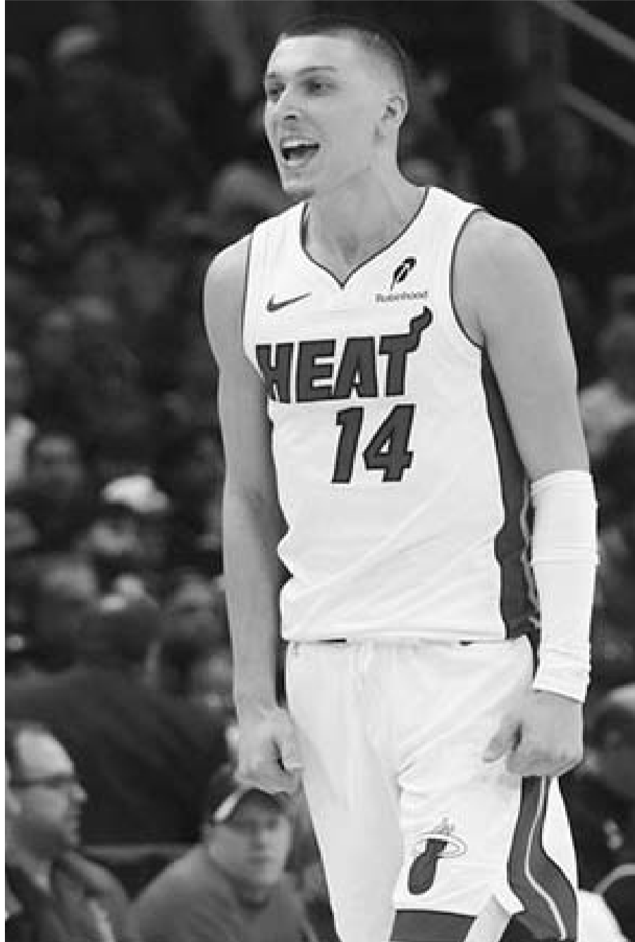
El Heat de Miami avanzó sobre los Bulls de Chicago.