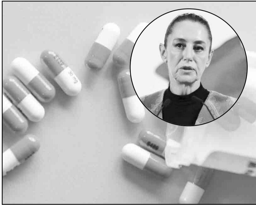
La presidenta Sheinbaum apuntó que la compra de estos cuatro medicamentos oncológicos se realizará bajo subasta inversa.