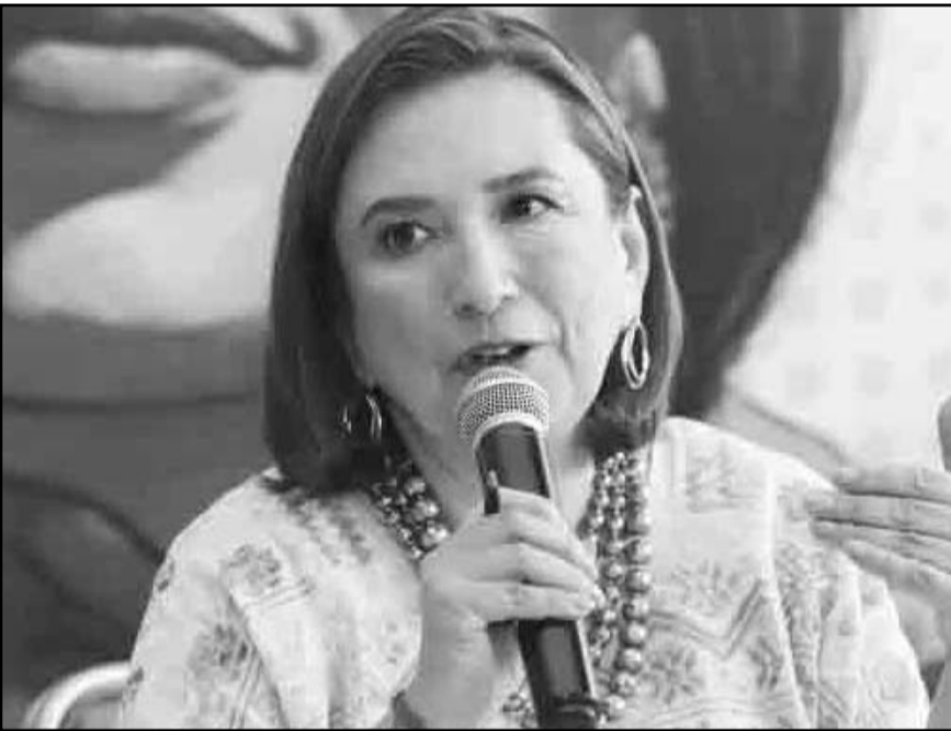
La ex candidata advirtió que México no puede ser víctima cada mes de un acto de extorsión con la aplicación de nuevos aranceles.

Comentó que es una buena noticia que tanto la Secretaría de Gobernación como el Senado de la República recibieran a los colectivos de madres buscadoras, e hizo voto porque la presidenta lo reciba pronto en Palacio Nacional.