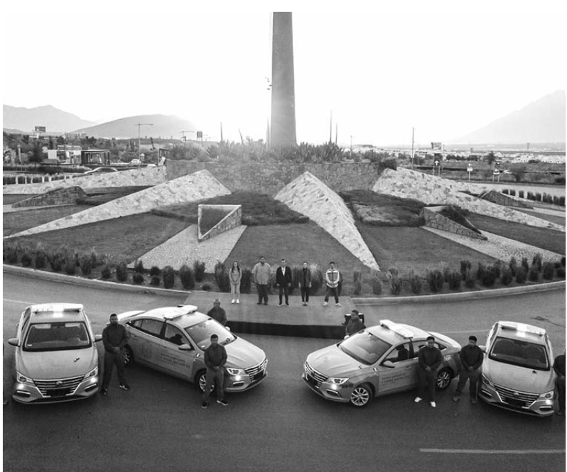
En un evento simbólico, se entregaron las primeras cuatro unidades que comenzarán a operar en diversos puntos del municipio

La Guardia de Protección al Medio Ambiente y Seres Sintientes vigilará, atenderá y sancionará con-