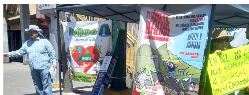
Señalan que hay avances sobre el pago en efectivo.

El representante de la Alianza de Usuarios del Transporte Público invitó a las autoridades estatales en materia de movilidad y a los legisladores, para co-