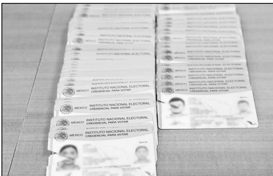
El Instituto invita a las personas en estado de postración que hagan llegar su solicitud de voto anticipado para que personal les lleve la boleta a sus domicilios.