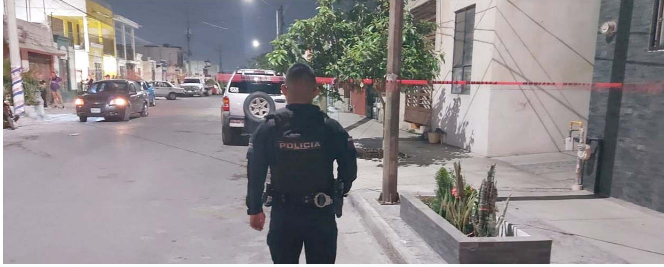
Un hombre que conducía una camioneta fue ejecutado a balazos de vehículo a vehículo, por delincuentes que lo perseguían, en Santa Catarina.

El hombre que murió y que no fue identificado en el lugar, tenía entre 25 a