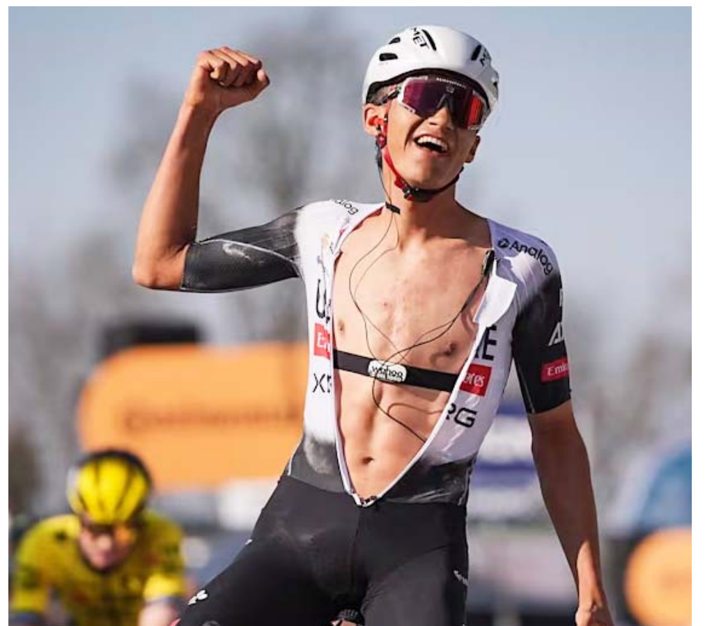
El ciclista mexicano sigue fuerte en las competencias internacionales.

Con esto, del Toro empieza a sonar fuerte en el equipo UAE Emirates, que es uno de los más prestigiosos del mundo.