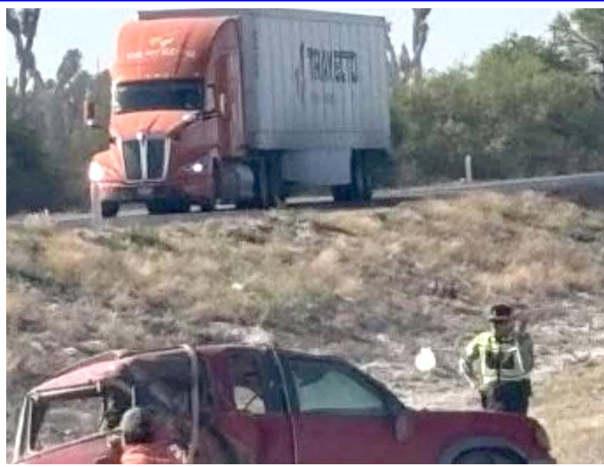
Las autoridades viales mencionaron que, fue el exceso de velocidad lo que provocó el accidente que terminó en forma trágica.

Mientras que los lesionados, que tampoco fueron identificados, viajaban a bordo de una camioneta de la marca