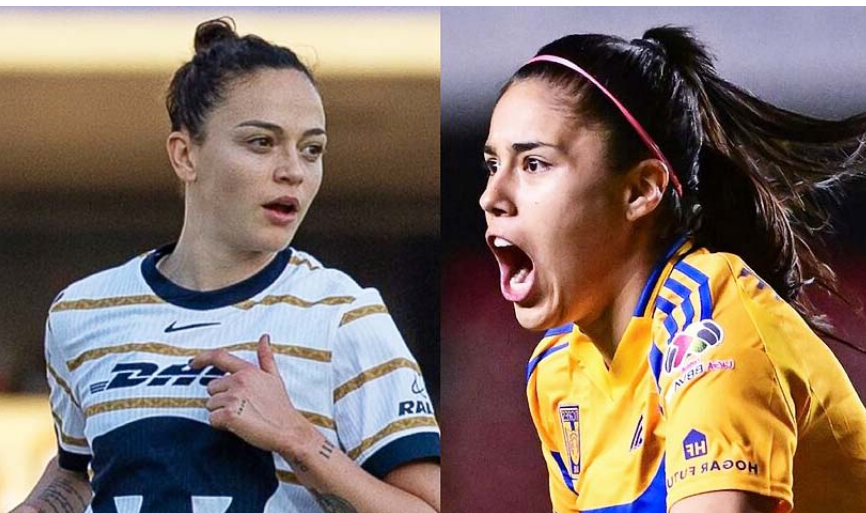
Pumas recibe a Tigres en la capital del país.