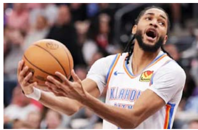
Thunder, el mandón.

Más tarde, a las 13:30 horas, Trail Blazers de Portland jugará con Lakers de Los Angeles,