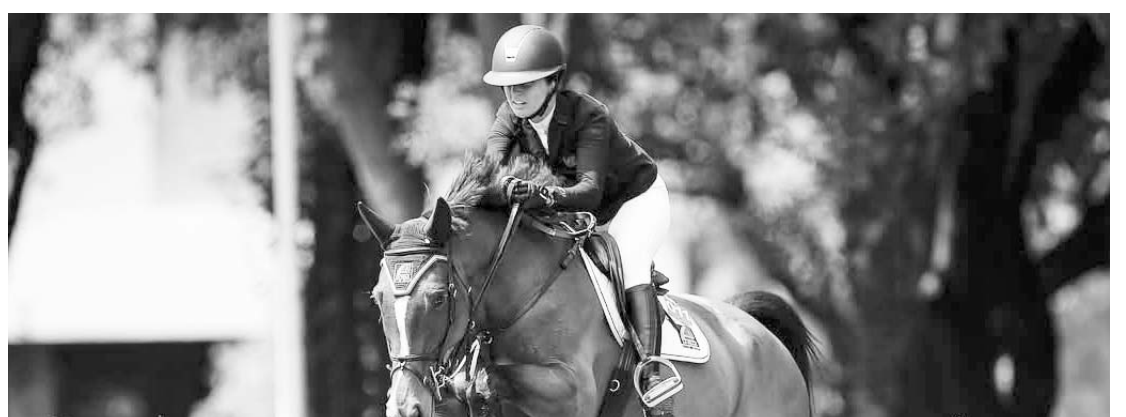
Las actividades continúan en el Club Hípico La Silla.

Cabe señalar que la edición del presente año del Torneo de Ecuestre en Nuevo León dentro del Club Hípico La Silla va a terminar este domingo, en el que será el último día de actividades de este emocionante certamen. (AC)