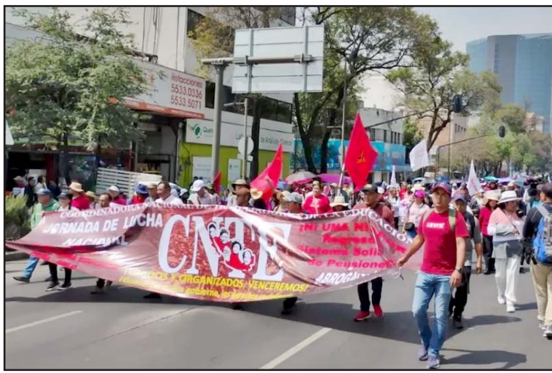
La CNTE rechazó reunirse con la presidenta Claudia Sheinbaum el 8 de mayo, exigiendo diálogo sólo dentro de su jornada de lucha.

"Desconocemos desde ahora a quien se ostenta como secretario general del SNTE, no sólo ya venció el periodo para el que fue elegido, sino también porque ha vendido una y otra vez los derechos de los