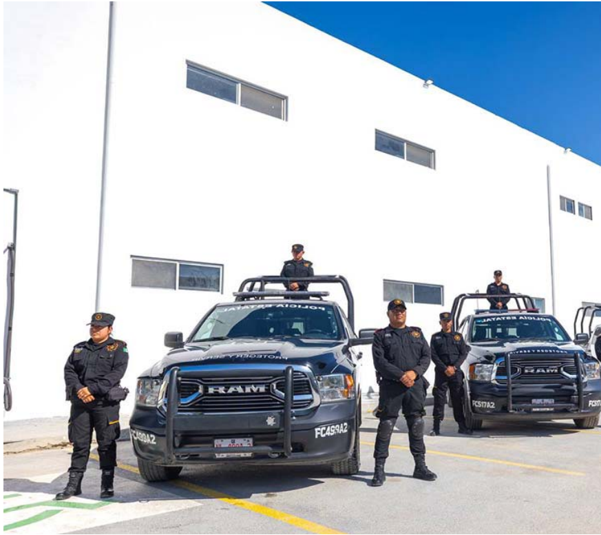
En el lugar se contará con el despliegue de 350 elementos de la corporación.

“Con Coahuila, afortunadamente lo hacen muy bien de aquel lado. Y esto lo que nos tiene que garantizar es que al ya