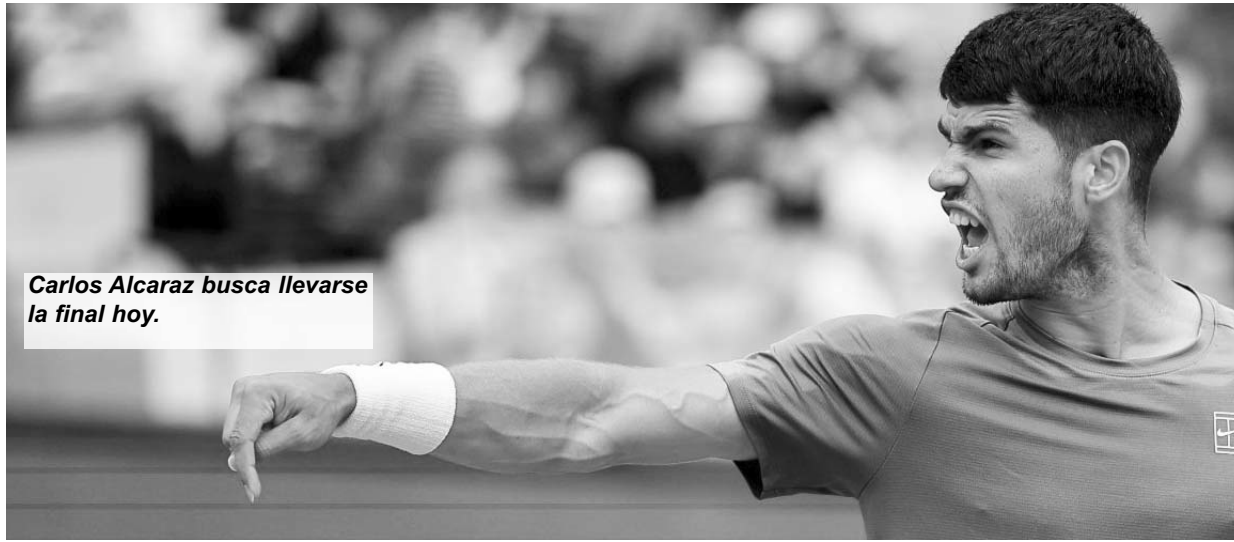
Carlos Alcaraz busca llevarse la final hoy.

De esta forma, Carlos Alcaraz enfrentará este domingo y desde las 16:00 horas al italiano Mussetti, en lo que promete ser una final emocionante.