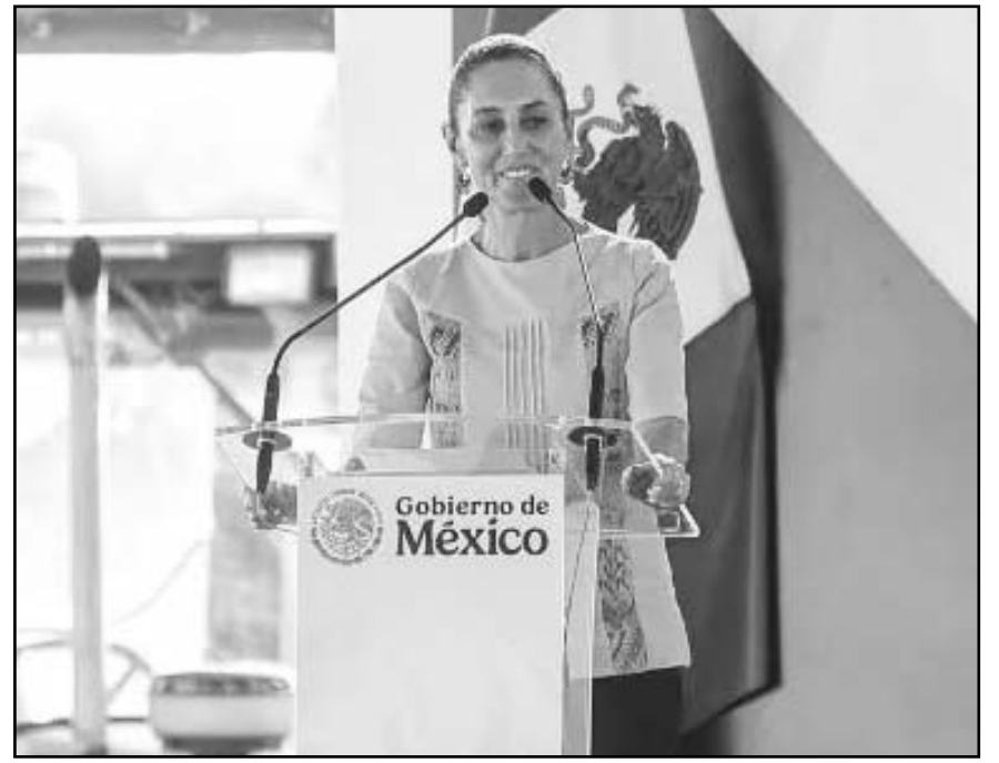
El objetivo es fortalecer la autosuficiencia alimentaria al duplicar la producción de frijol.

Durante el evento, también se realizó un encuentro con líderes campesinos y organizaciones sociales