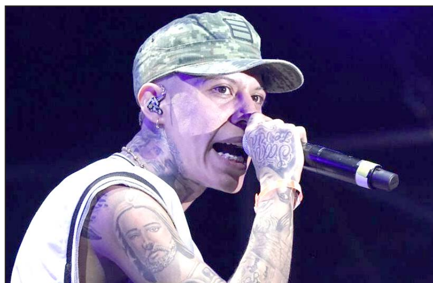
En su mensaje, el rapero aclaró que no fue su intención ofender a Dios ni a la religión católica.

Desde el anuncio del regreso de la familia Wilkerson, Muniz ha estado actualizando a sus seguidores sobre el progreso de la serie. Incluso mostró su entusiasmo por reencontrarse con sus compañeros de elenco: "¡Tengo que ponerme al día con el episodio 151 antes de que volvamos a grabar en unos días! ¡Qué ganas de regresar con mi vieja familia!", escribió en X a mediados de marzo.