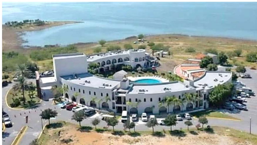
El gobernador de Nuevo León inauguró ayer la remodelación del Parque El Cuchillo.

García Sepúlveda agregó que ‘sembrarán’ lobinas en todas las presas de la entidad, a fin de fortalecer la pesca deportiva y fomentar la convivencia familiar. “Queremos que haya en las cuatro presas, muchísima pesca y los que vengan de fuera por el Mundial, van a querer salir, no estar todo el día en la zona metropolitana”.