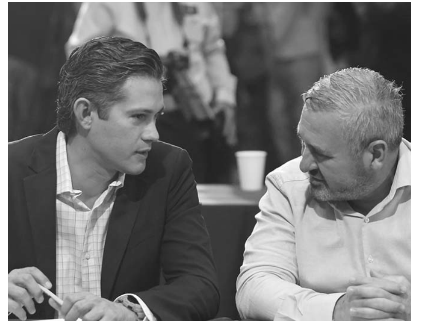
El objetivo es poner orden en las Asociaciones, Uniones y en la Confederación Ganadera del estado,