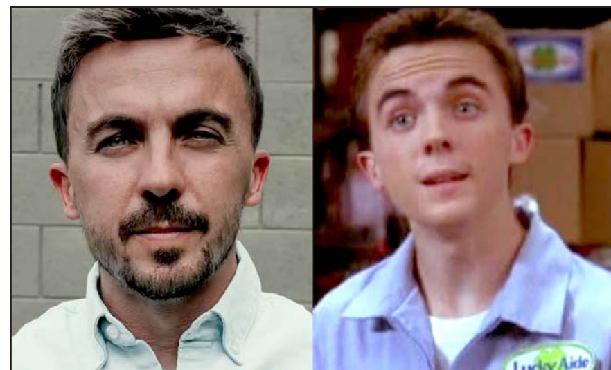
Frankie Muniz anunció que inició el rodaje de los nuevos episodios de la serie de comedia.