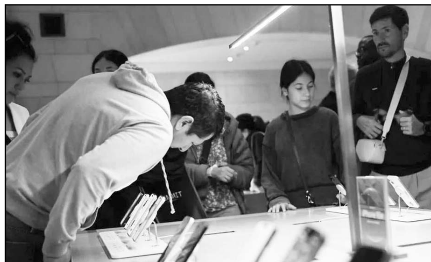
Las exclusiones aplican a teléfonos inteligentes, computadoras portátiles, discos duros, procesadores y chips de memoria.