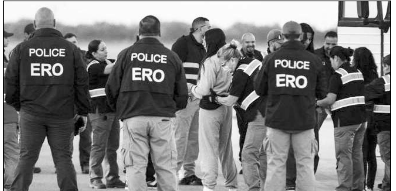
En total, 2.559 venezolanos han regresado a su país desde el pasado febrero en 13 vuelos, según el gobierno de Venezuela.

En total, 2.559 venezolanos han regresado a su país desde el pasado febrero en 13 vuelos, 10 de ellos operados por la línea aérea estatal Conviasa.