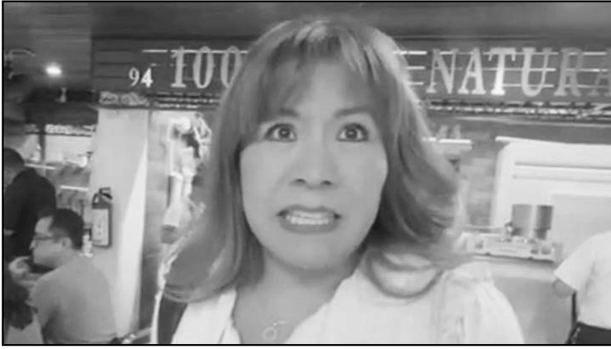
La ausencia de información a la que hace referencia la candidata se refiere a que precisamente para este proceso inédito no hubo financiamiento público.