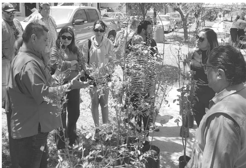
Decenas de vecinos acudieron a la convocatoria, sumando esfuerzos en pro del rescate de espacios verdes.

“Este esfuerzo busca contribuir a la mejora del entorno natural del parque y sus alrededores, además de promover la creación de espacios