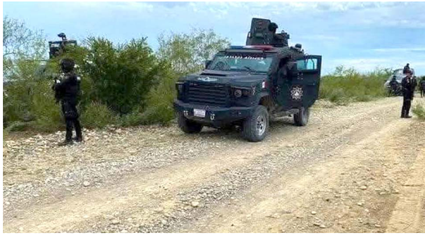
Se cree que esta persona fue privada de su libertad, torturada y posteriormente asesinada.

Mencionaron que el hombre presentaba evidentes huellas de violencia y varios disparos de arma de fuego.