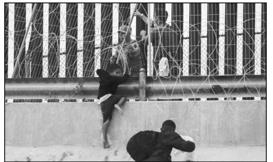
Algunos de los migrantes que cruzan México para llegar a Estados Unidos han sido víctimas de graves violaciones a derechos humanos.

También se subrayó el riesgo que enfrentan los defensores de derechos humanos y colectivos de búsqueda, quienes suelen ser hostigados por autoridades o grupos criminales.