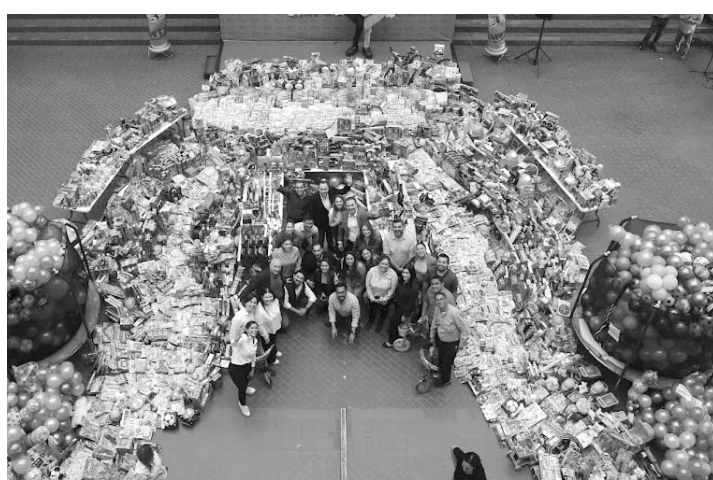
El módulo de recolección se mantiene instalado en las oficinas generales del DIF Monterrey