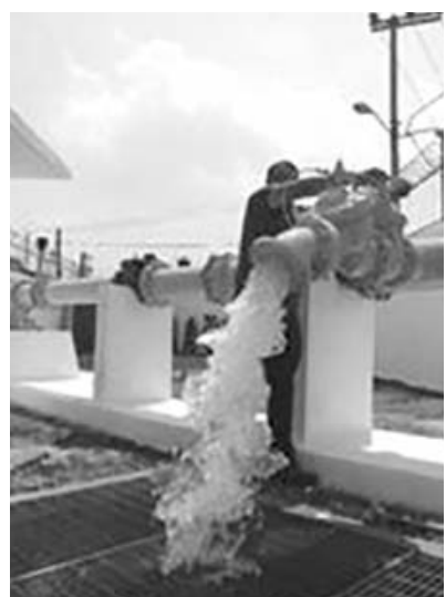
Buscan cuidar el agua

Cuya iniciativa ambiental está alineada al modelo de negocio