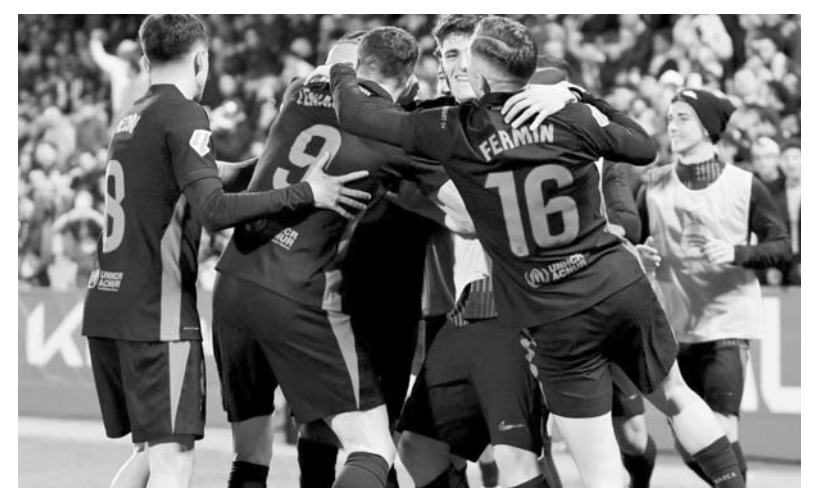
El cuadro catalán venció ayer 1-0 al Leganés.

Mientras tanto, la escuadra del Al Qadisiya se quedó en las 52 unidades para que así sean quintos en el campeonato.