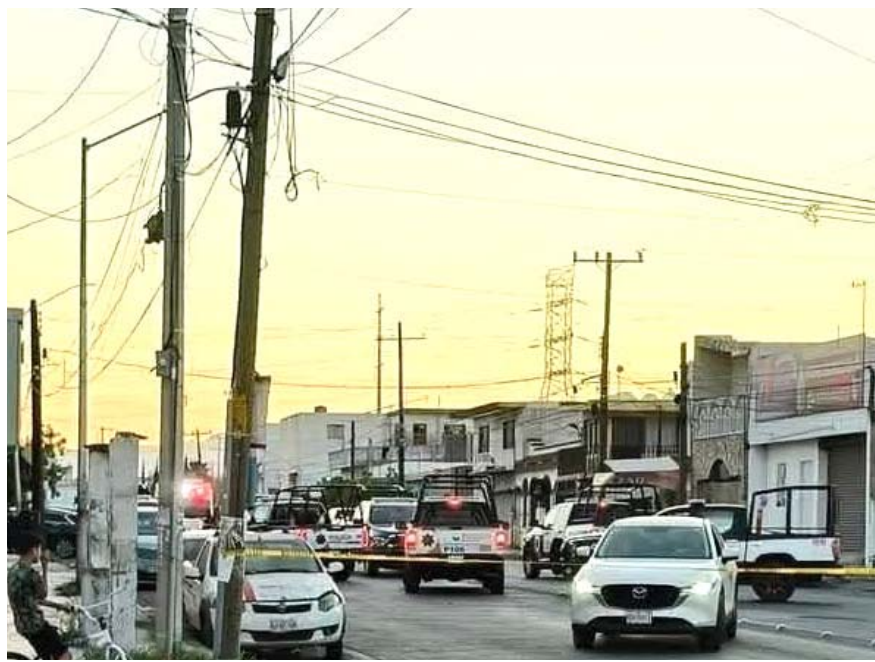
La ejecución fue reportada a las 19:20 horas afuera del restaurante "Puerto Guamuchil"

Los efectivos ministeriales interrogaron a vecinos del sector, en torno a la muerte violenta ocurrida la noche del sábado.