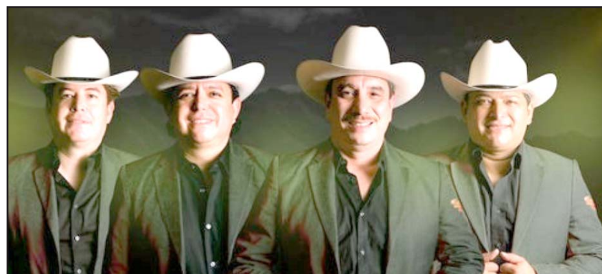
La banda de regional mexicano alcanzó el primer puesto global de Billboard con su tema "El del palenque".