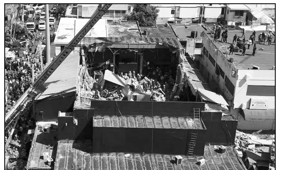
Según las autoridades, 189 personas fueron rescatadas con vida de entre los escombros del popular local de la capital, Santo Domingo.

Las autoridades han dicho que es demasiado pronto para determinar por qué se cayó el techo, aunque los fiscales visitaron el lugar el jueves después de que los equipos de rescate comenzaran a recoger y retirar el equipo pesado.