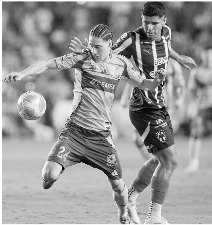
Tigres fue mejor en la cancha y en el marcador.

"Del arbitraje no quiero opinar, prefiero centrarme en lo que pasó en la cancha, en donde fuimos mejores", concluyó. (AC)