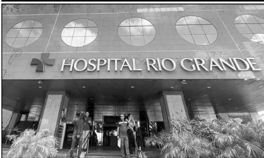
El exgobernante fue ingresado el viernes al Hospital Rio Grande.

La participación de Maduro en los actos del Día de la Victoria también tiene una fuerte carga simbólica, al alinearse con el discurso ruso sobre la memoria histórica y la lucha contra el fascismo.