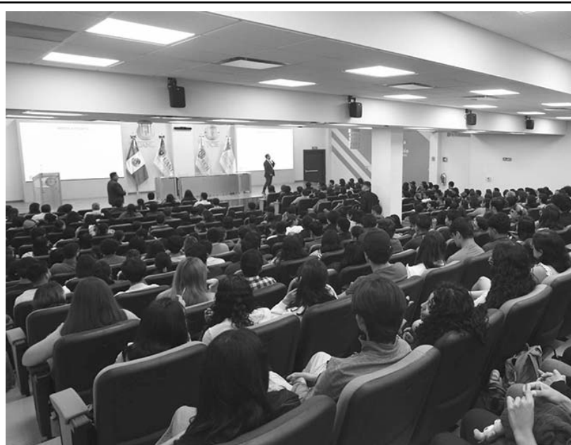
A nivel nacional, se producen 120,128 toneladas de basura diaria, de las cuales 5,310 corresponden a Nuevo León.

“La Universidad tiene años siendo la número uno a nivel sustentable, lo que la ha convertido en un modelo para otras universidades del país en cuanto a medidas y estrategias