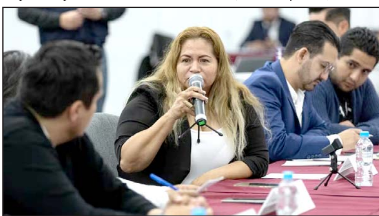
Las madres buscadoras calificaron la ausencia de la funcionaria en las mesas de diálogo como un acto de 'violencia institucional'.

Lo anterior, confirma que cada quince días se cometen más de 600 homicidios dolosos.