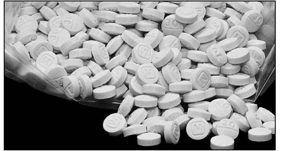
Ambos sujetos fueron detenidos en 2023 con drogas y armas.

Estas acciones son especialmente relevantes ante el aumento del tráfico internacional por temporada vacacional, cuando miles de personas ingresan al país con productos típicos o mascotas sin conocer las regulaciones. La Sader hizo un llamado a la corresponsabilidad ciudadana, invitando a consultar la información oficial antes de viajar y evitar así sanciones, decomisos o riesgos sanitarios que puedan afectar a la agricultura y ganadería nacional.