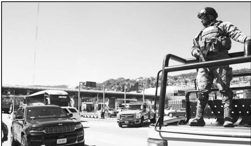
Sader reforzará acciones de inspección en puertos, aeropuertos y fronteras de México

La inspección en estos puntos conforma la primera barrera de protección para evitar la entrada de plagas y enfermedades de plantas y animales ausentes en el territorio nacional, y es parte fundamental de la estrategia para salvaguardar el patrimonio agroalimentario de México.