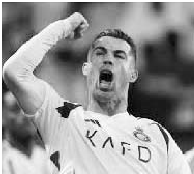
El portugués marcó dos goles ayer.

Cristiano Ronaldo y Julián Quiñones, jugadores del Al Nassr y Al Qadisiya respectivamente, volvieron a marcar goles con sus equipos en la Liga de Arabia, en donde Al Nassr superó 2-1 en casa al cuadro de Al Riyadh y Al Qadisiya cayó 2-1 de visitante frente al contrario Al Feiha.