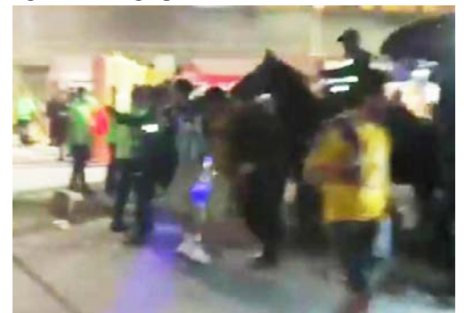
La policía detuvo a dos fans rijosos.

A su vez, aunque a las afueras del estadio Universitario, en las inmediaciones del mismo, la policía de San Nicolás detuvo a dos fans de Tigres y Rayados por estar alterando el orden en ese momento ya que se estaban agarrando a golpes.