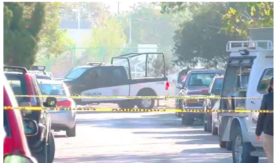
La muerte violenta fue reportada a las 16:45 horas sobre la calle Praderas de la Rinconada, en la Colonia Praderas de Torre Luna.

Agentes ministeriales y Policías de García arribaron al sitio de la agresión