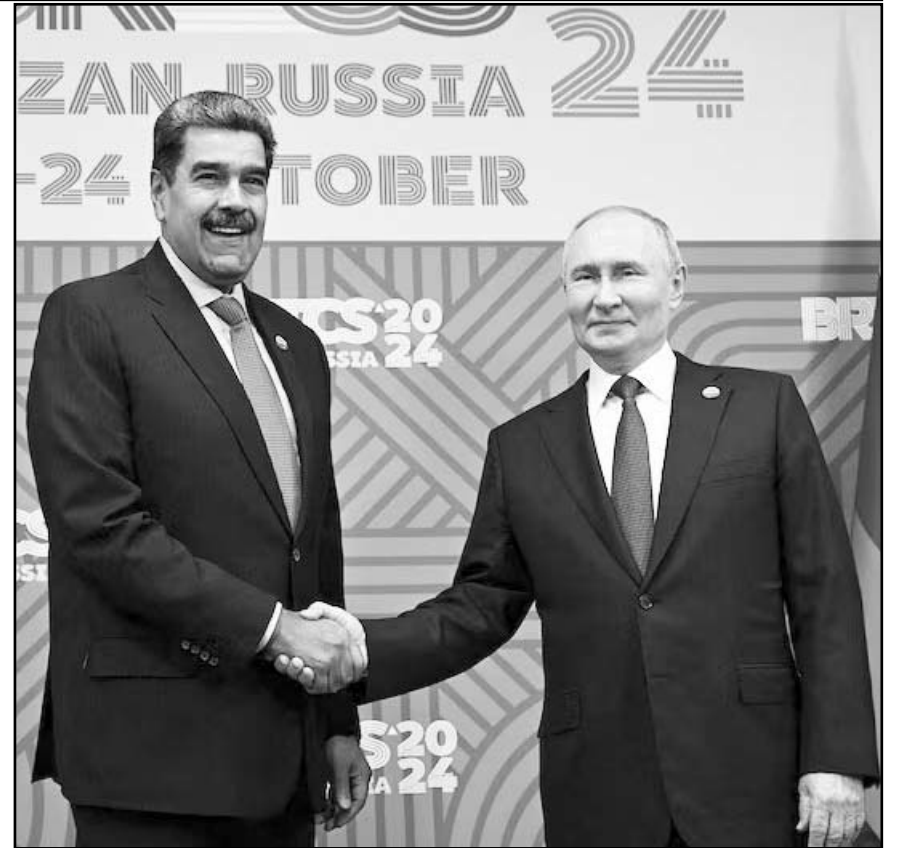
Nicolás Maduro junto a Vladimir Putin en la cumbre de los BRICS en octubre pasado

Expertos en relaciones internacionales interpretan este viaje como un intento de Caracas por fortalecer sus alianzas internacionales frente al aislamiento diplomático que enfrenta en varios frentes. Para Moscú, la visita de Maduro también representa una oportunidad de proyectar influencia en América Latina, en un momento en que Rusia busca reforzar su red de alia-