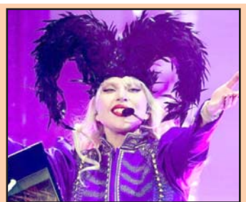
Lady Gaga dio un espectáculo de casi dos horas.