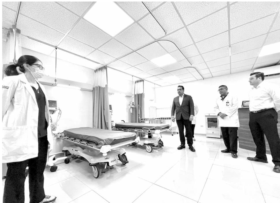
Durante su visita a la Clínica Municipal, el edil constató el impulso a la salud que brinda el gobierno que encabeza

La estrategia implementada por el Municipio establece que la salud es un derecho con cobertura médica accesible y digna para todos los santacatarinenses.