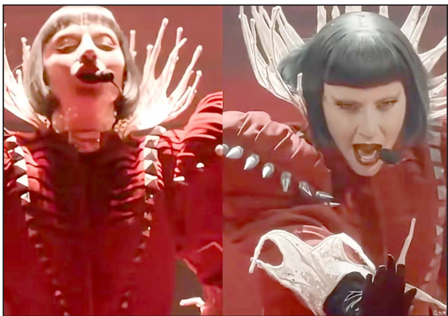
La artista cumplió su promesa de causar "caos en el desierto" con un espectáculo lleno de sorpresas para sus Little Monsters.

Días antes, había prometido "caos en el desierto", pero se guardó los detalles