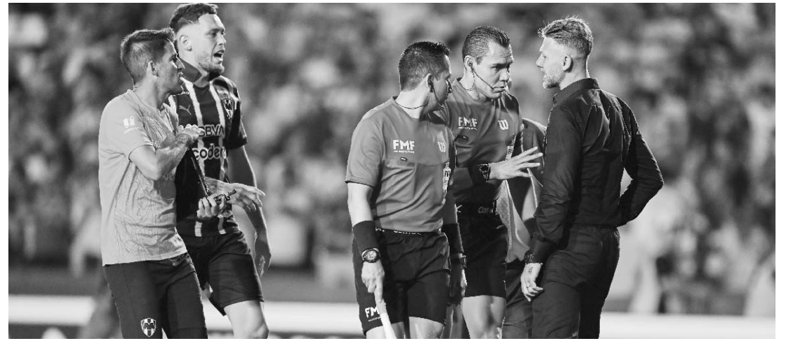
El técnico albiazul dijo que el silbante quiso ser el protagonista.