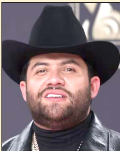
El cantante aseguró que cumplió con el reglamento de la Procuraduría del Edo.

"Entramos a una nueva etapa, mi gente. Sin corridos y todo eso, se siente feo no poder cantar lo que la gente