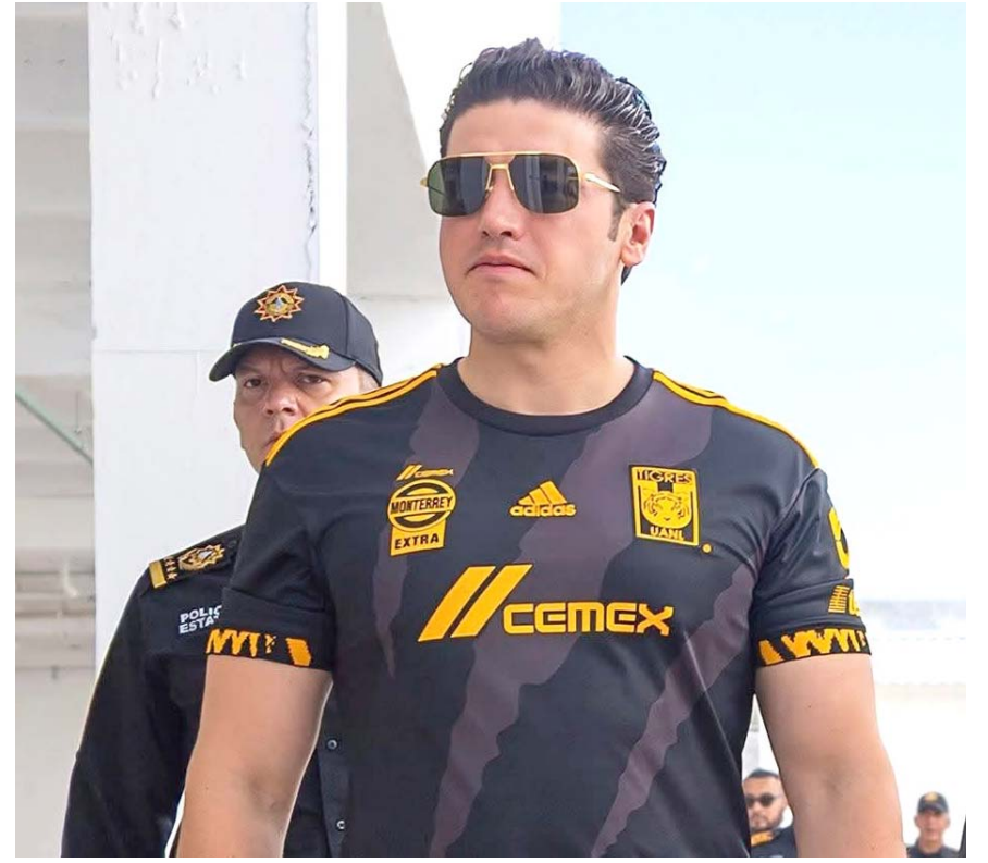
García Sepúlveda aseguró que al igual como solucionaron la crisis de seguridad y la crisis de agua, ahora resolverán la crisis de aire.

“Vamos a arreglar todos los temas, vamos a dejar el mejor Nuevo León posible”, agregó.