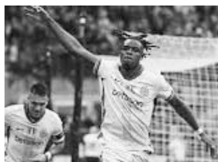
El Inter sigue en la cima.

En más resultados de la Serie A de Italia, Juventus de Turín superó 2-1 al Lecce y Venezia superó 3-1 al Monza.