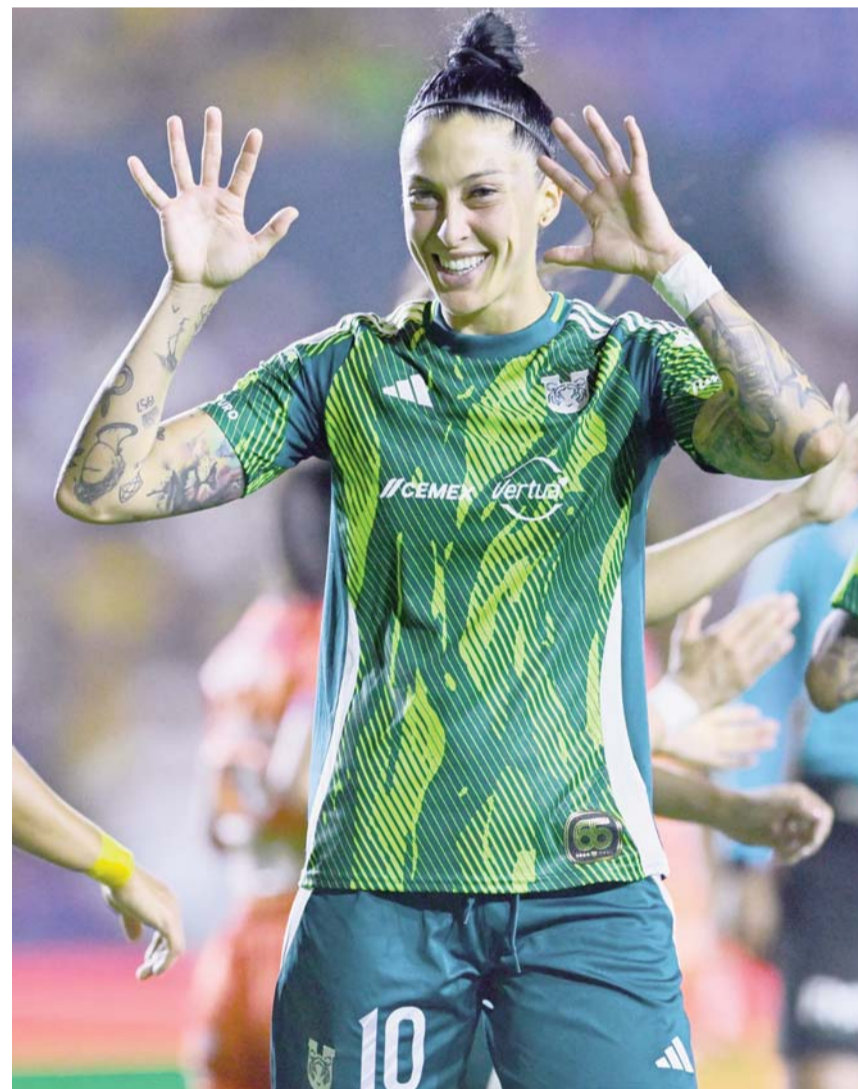
Las felinas dieron muestra de su poderío.