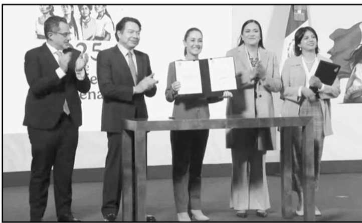
En Agricultura celebramos este avance histórico que salvaguarda la biodiversidad de la nación, señaló la presidenta Claudia Sheinbaum

Se implementará una publicación mensual de las cifras y se dará mayor atención a las víctimas mediante el fortalecimiento de la Comisión Ejecutiva de Atención a Víctimas.