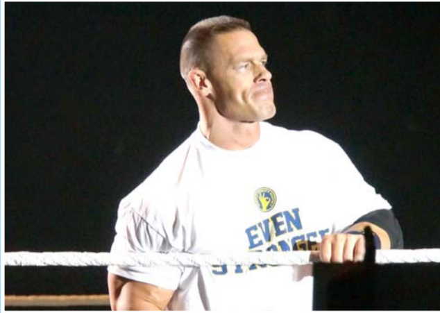
El luchador de 47 años fue abucheado por ocho mil asistentes.

Cena aseguró ser víctima de una "relación abusiva" con los aficionados. "Están haciendo esto más fácil para mí", dijo el veterano, refiriéndose a su retiro de los encor-