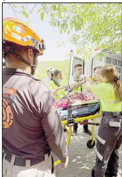
Ocurrió en el Cerro de la Silla.

Una vez que se descendió a la lesionada, en la parte baja ya la esperaban paramédicos, que tras revisarla la llevaron en una ambulancia a un hospital de la localidad.