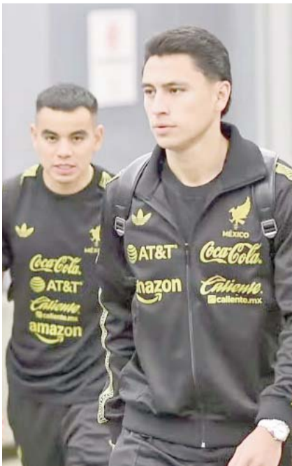
México se medirá a Canadá.

Cabe resaltar que el Tri no ha podido coronarse en el certamen más importante de la zona a nivel de selecciones. De las tres ediciones que se han realizado hasta el momento, México ha perdido dos finales con la selección de las Barras y las Estrellas. Incluso, hace dos años terminó siendo eliminado en las semifinales, por lo que se tuvo que conformar con jugar el partido por el tercer lugar donde derrotó a Panamá.