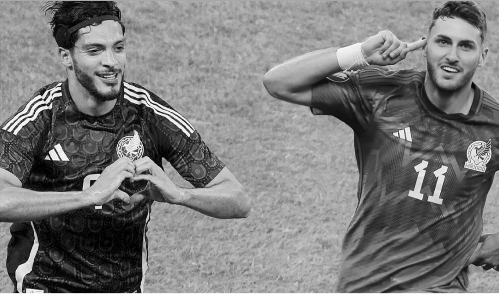
Ambos elementos destacan en sus respectivos clubes. Santiago se convirtió en noticia a finales de enero con su llegada a la Serie A; mientras que Raúl Jiménez se reencontró con su mejor fútbol.

Los partidos de la Selección de México se han convertido en un debate constante entre los aficionados y medios de comunicación que se dividen por elegir a su favorito para la posición de centro delantero, posición peleada por Santiago Giménez y Raúl Jiménez.