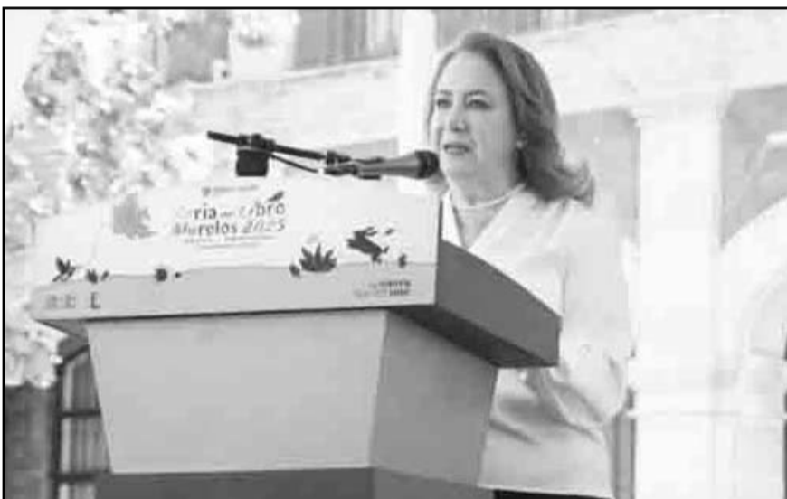
Ministra Yasmín Esquivel presenta libro en Feria de Morelos; expone la impunidad en casos de feminicidio.