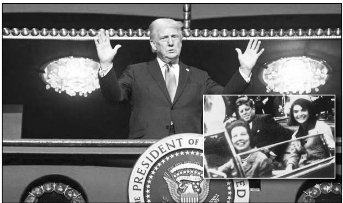
Trump hizo el anuncio mientras visitaba el centro cultural Kennedy Center de Washington, que lleva el nombre del mandatario asesinado.

Los Archivos Nacionales han desclasificado decenas de miles