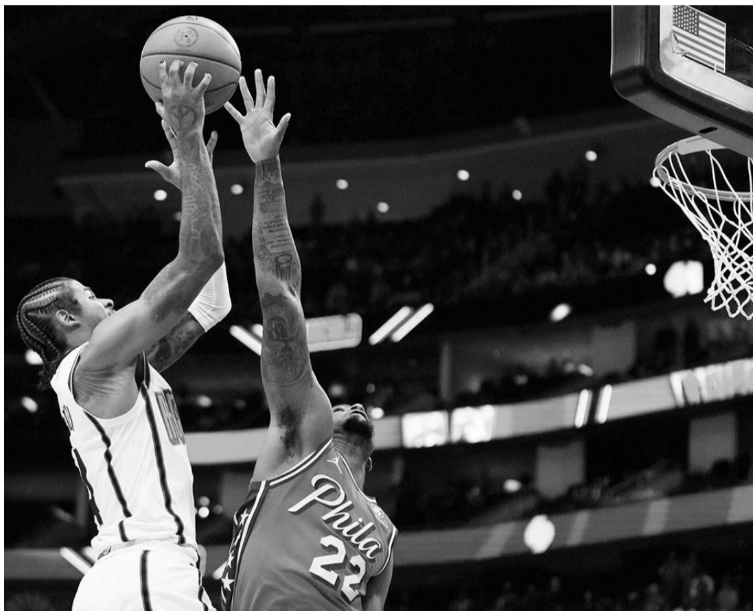
Los Rockets alargaron su racha de victorias.

los Warriors de Golden State a pesar de no contar con dos de sus principales estrellas. Westbrook contribuyó con 12 unidades, así como un máximo de temporada de 16 asistencias y 12 rebotes. Jimmy Butler tuvo 23 puntos, ocho rebotes y seis asistencias y los Warriors vieron interrumpida su racha de siete victorias. Golden State cayó a 14-3 desde que Butler hizo su debut el ocho de febrero y a 14-2 en los partidos en los que jugó.