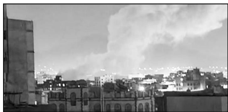
Los ataques representan la operación militar más importante de Estados Unidos en Oriente Medio.