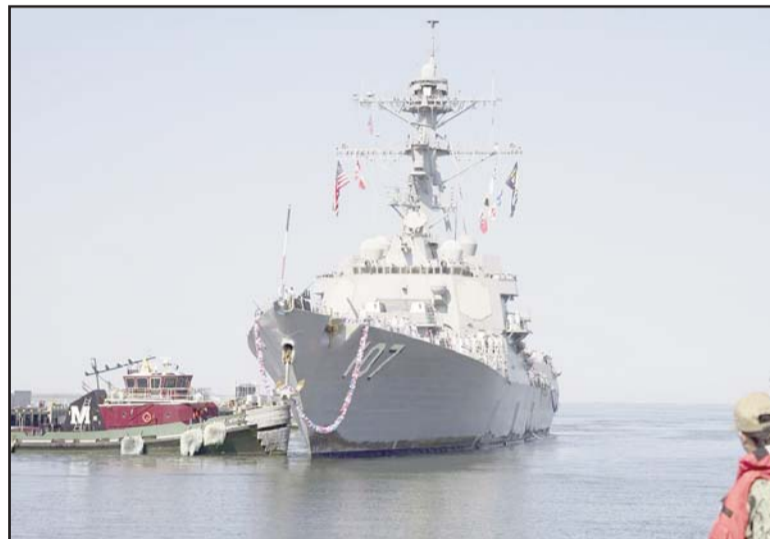
El navío de guerra se une a los 9,600 efectivos desplegados en la frontera para combatir al narcotráfico y la inmigración ilegal.

De acuerdo con funcionarios del Departamento de Defensa de Estados Unidos, que citaron medios estadounidenses, el buque transportará a miembros del Destacamento de Aplicación de la Ley de la Guardia Costera estadounidense y participará en misiones de aplicación de la ley, incluyendo "terrorismo marítimo, proliferación de armas, delincuencia