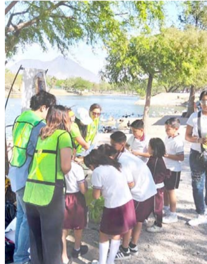
El objetivo, fortalecer la conservación del Parque Lago

trabajado en la recuperación del Parque Lago, para mitigar los impactos ambientales que han afectado la calidad ecológica del área.