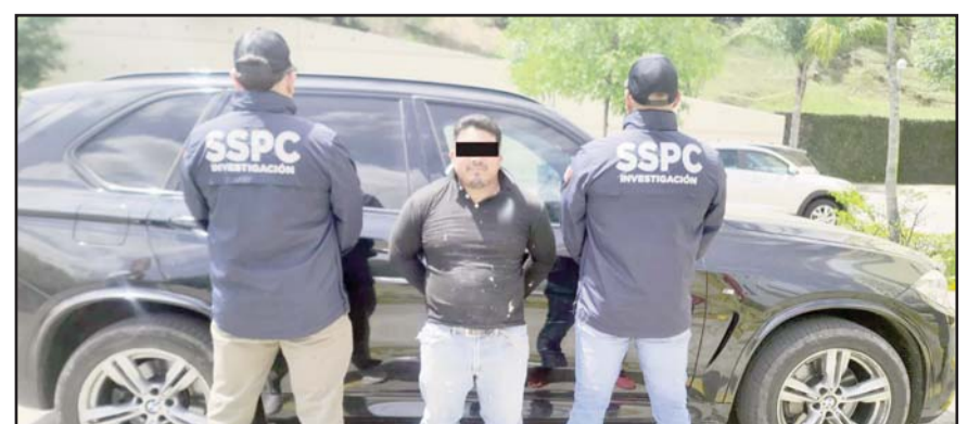
'El Veterano' estaba en la lista de los 10 prófugos más buscados por el FBI.

En el operativo participaron elementos de la Defensa, Semar, FGR, Guardia Nacional (GN) y la SSPC.