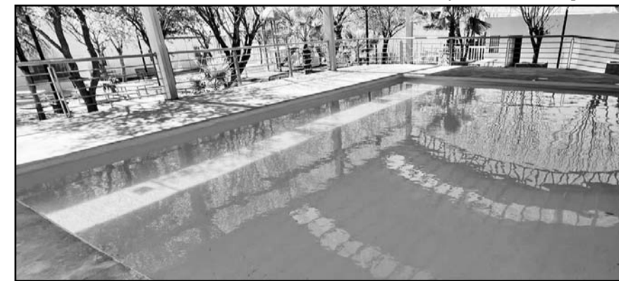
Las albercas ya están prácticamente listas para recibir a las personas