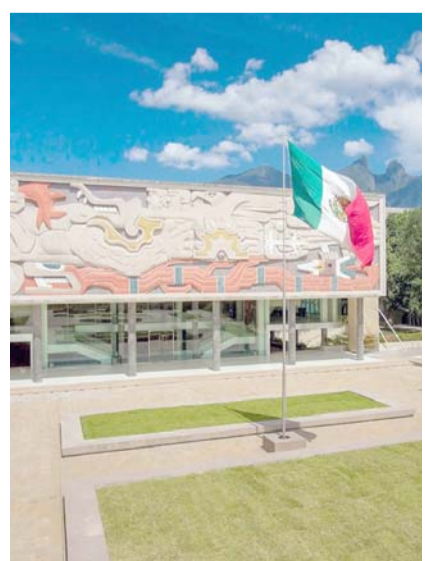
La Institución posicionó 14 disciplinas en el primer lugar en México y 8 en América Latina.

Dicho ranking evalúa disciplinas en cinco áreas del conocimiento: Artes y Humanidades; Ciencias de la Vida y Medicina; Ciencias Naturales; Ciencias Sociales y Administración, e Ingeniería y Tecnología. En esta última área, el Tec de Monterrey está en la primera posición en América Latina y en México. Por otra parte, la metodología utilizada para la evaluación incluye cinco indicadores: reputación académica, reputación de