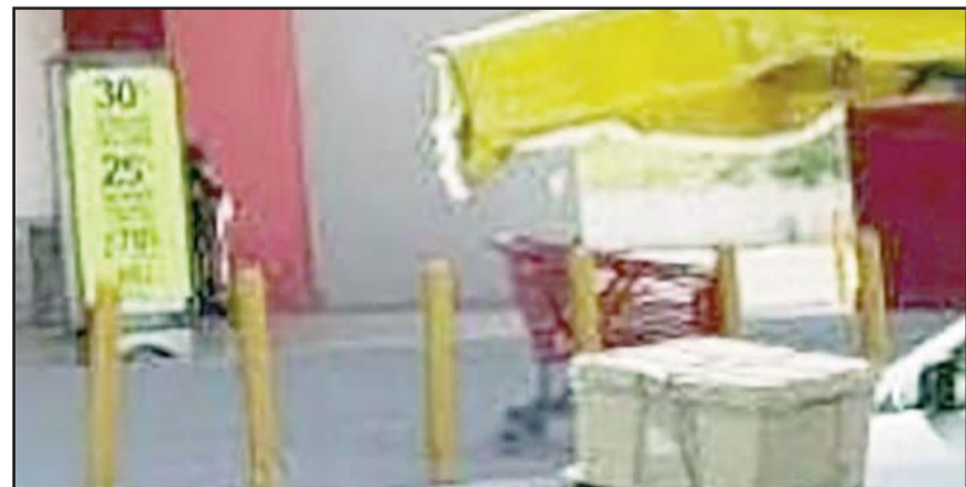
El asaltante llevaba consigo un arma de fuego.

La persona pasó las cajas registradoras sin pagar, por lo que se aproximó uno de los guardias, a quien le apuntó