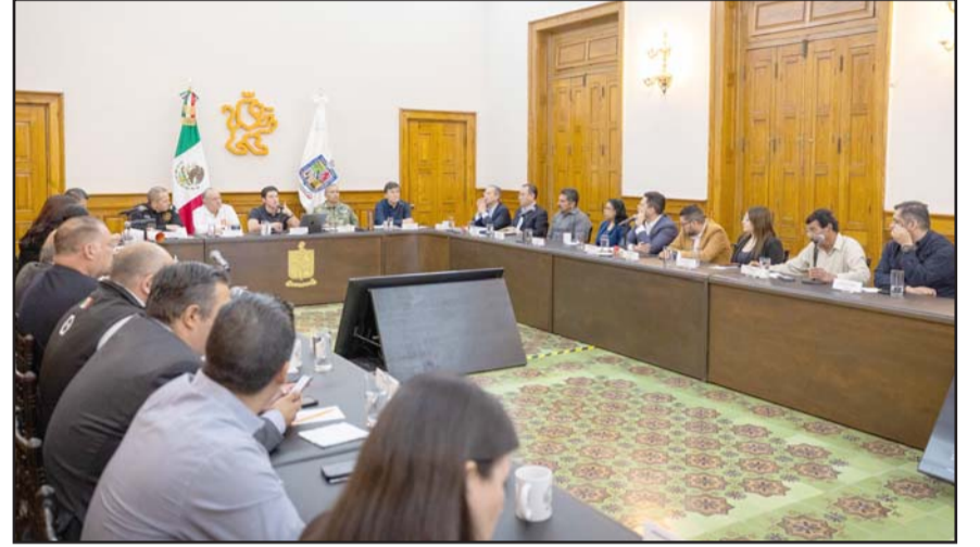
Ayer se realizó la segunda reunión de la Comisión Ambiental Metropolitana

Los asistentes analizaron una comparativa de incendios, destacando que del 10 al 16 de marzo pasado se registraron un total mil 613