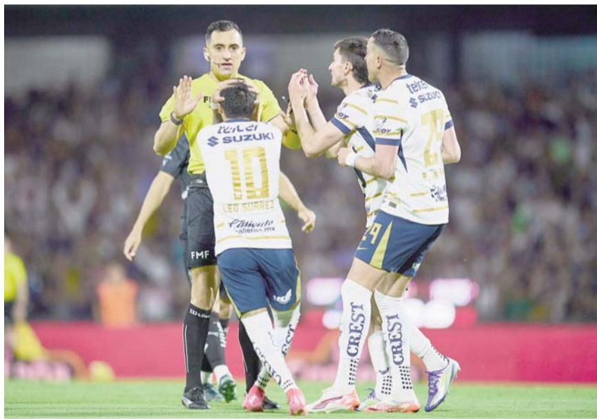
El silbante ha sido muy cuestionado por su actuación.

El mexicano suma siete juegos en 12 jornadas del Clausura 2025, pero con el contexto que atraviesa resulta complicado que pueda superar las 10 apariciones que tuvo en el Apertura 2023.