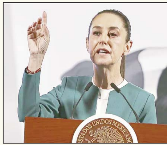
La jefa del Ejecutivo recaló que se esclarecerán los hechos del rancho Izaguirre.