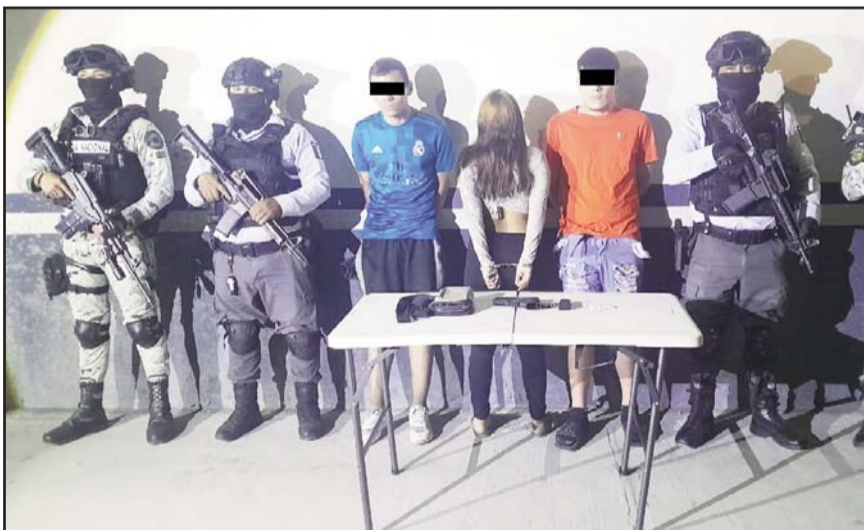
Entre los detenidos hay una menor de edad.