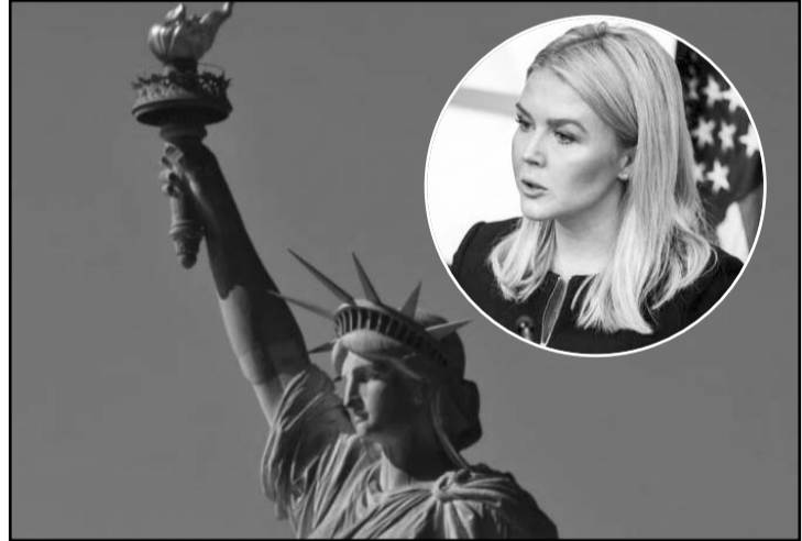
La portavoz Karoline Leavitt rechazó la idea y afirmó que Francia debería agradecer a EE.UU. por no hablar alemán hoy

Declarada monumento nacional en 1924 y Patrimonio de la Humanidad por la UNESCO en 1984, la estatua representa no solo un legado histórico, sino también un vínculo cultural entre Francia y EU.