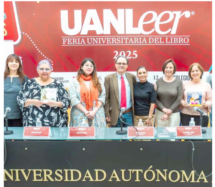
La Secretaría de Cultura de Nuevo León y el Fondo Editorial de Nuevo León presentaron al público de la UANLeer 2025 la “Colección Apapachos - Cultura para la Primera Infancia”.