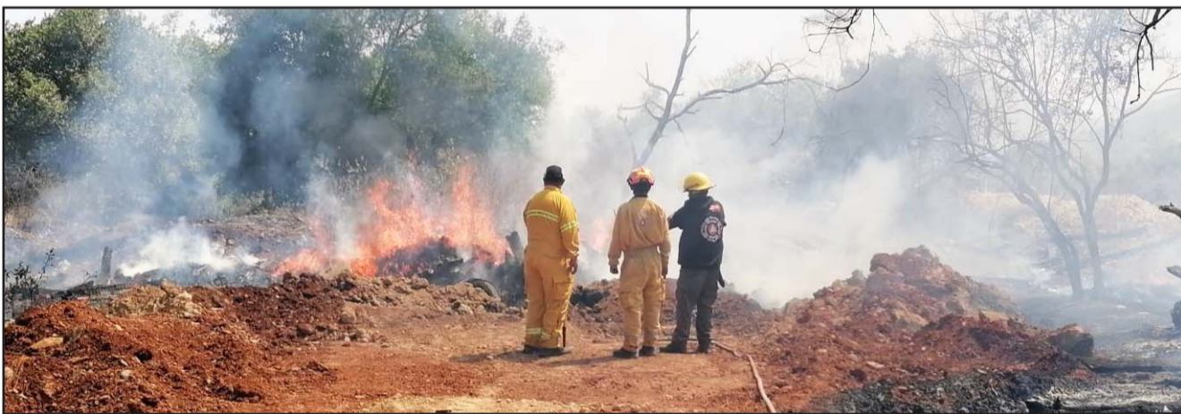
Del lunes 10 al domingo 16 del presente mes se desataron múltiples episodios, la mayoría en lotes baldíos con mil 317.

La edil aseveró que muchas de las administraciones municipales carecen de suficientes herramientas jurídicas para sancionar a quien viole las normas ambientales o provoque los siniestros forestales.