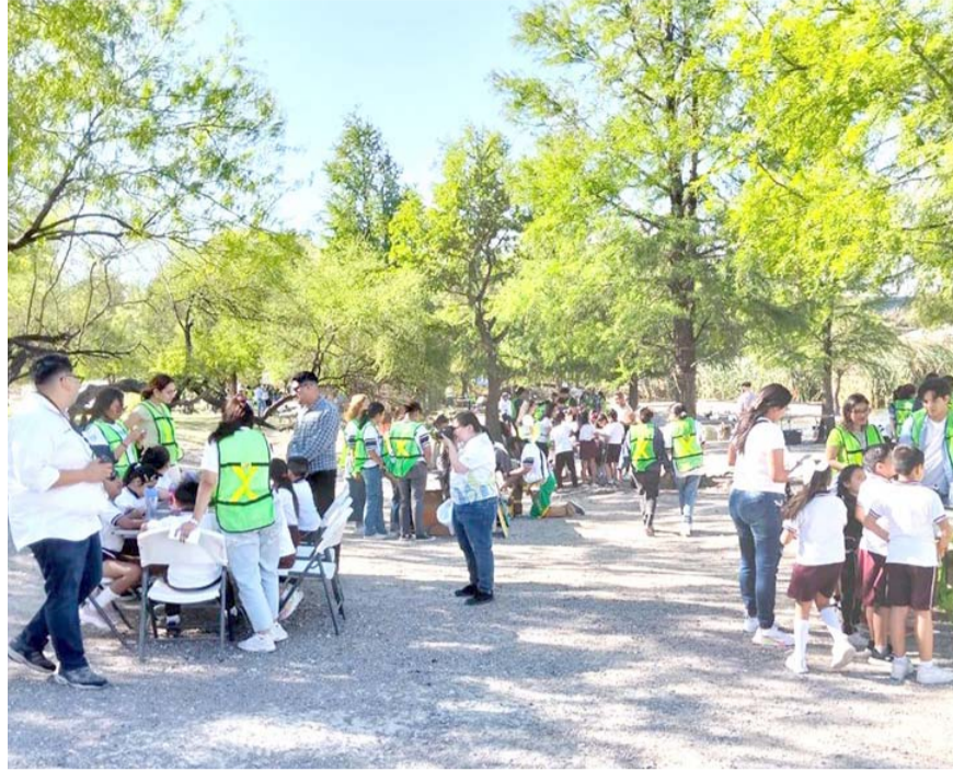
La Feria Ambiental contó con la asistencia de 300 niños y jóvenes, quienes disfrutaron de talleres, pláticas y actividades.