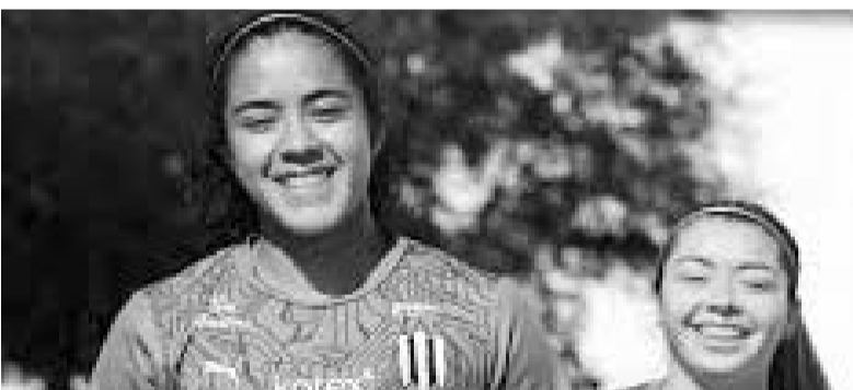
Las albiazules con 20 puntos en 12 jornadas llegan a esta fecha en la séptima posición.