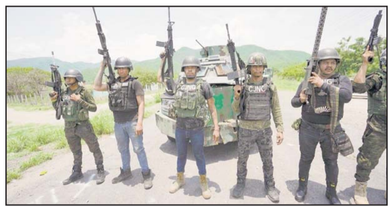
Anuncios en grupos de la red social ofrecen varias vacantes, pero algunos mencionan abiertamente la búsqueda de sicarios.

tado medidas para bloquear contenidos relacionados con el crimen organizado, muchos grupos siguen activos, cambiando de nombres o utilizando códigos para evadir los filtros de la plataforma.