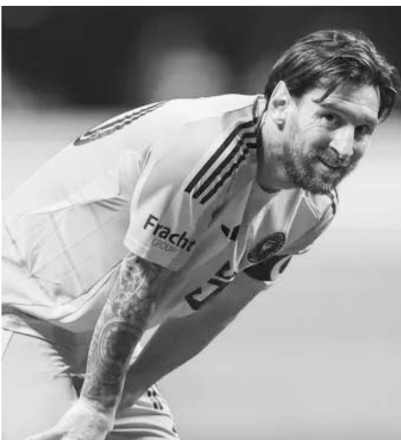
El astro argentino se resintió de una lesión.

Una Copa América más difícil para Colombia Pese a que James Rodríguez no quiso hacer ver sus reclamos como excusas, enfatizó en otro factor que, desde su punto de vista, los perjudicó: las distancias entre partidos.