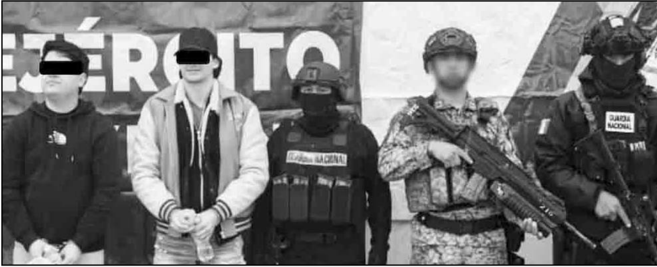
Se informó que con motivo de la Operación se ha realizado la detención de mil 503 personas y el aseguramiento de mil 397 armas de fuego.