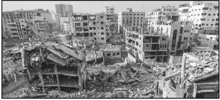
Vista de la devastación en Ciudad de Gaza como consecuencia de los bombardeos de Israel.

Además, un alto funcionario israelí señaló que los ataques continuarán hasta que se logren los objetivos militares, lo que indica una intensificación del conflicto en la región tras 58 días de tregua.