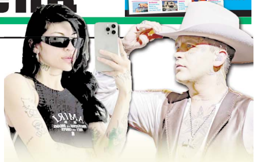
No se ha confirmado si el litigio se lleva a cabo en México o Argentina, pero existen rumores sobre negociaciones por la custodia compartida.

Cena enfrentará a Rhodes en la lucha estelar de Wrestlemania 41 en su último intento por romper la marca de Ric Flair con 17 reinados mundiales en la lucha libre. La nueva faceta 'ruda' del luchador responde a un ángulo que jamás se atrevió a presentar WWE cuando Cena era la cara de la compañía y gran responsable del éxito que tiene la empresa con el público infantil.