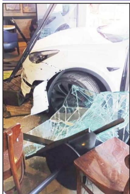
Confundió los pedales.

Los agresores después de cometer la ejecución, se dieron a la fuga a toda velocidad del lugar, sin que se supiera de su paradero, hasta el momento.