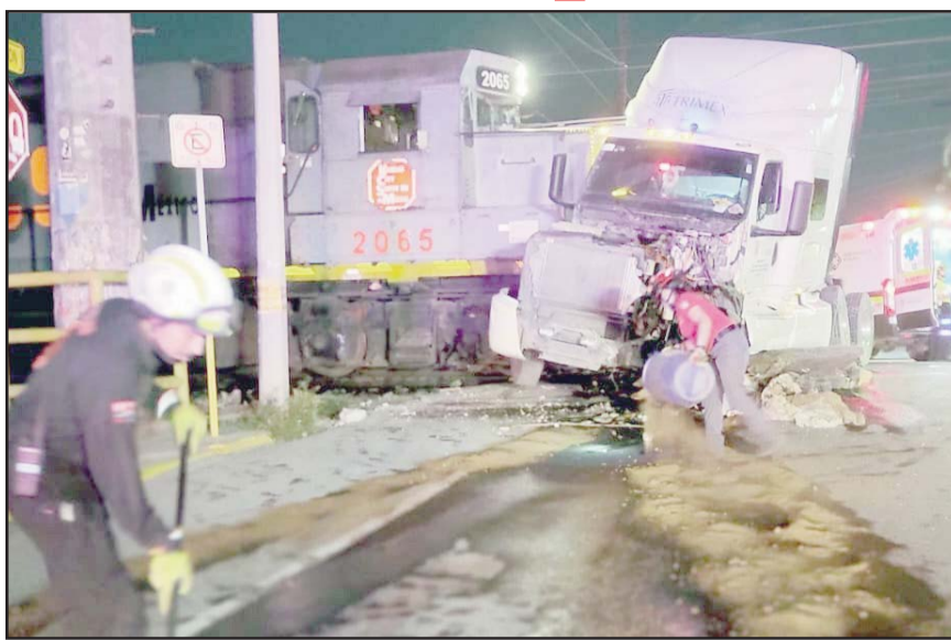
Los hechos se registraron en el Centro de Monterrey.

Fue en esos momentos en que el ferrocarril embistió la caja del tráiler, donde por fortuna no hubo lesionados. Debido al accidente el diésel de la