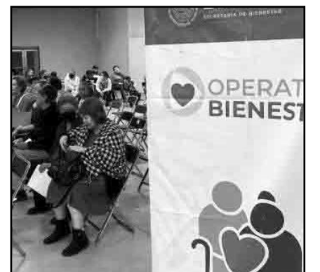
El monto incluye el pago de pensión para adultos mayores, para mujeres de 60 a 64 años.

La implementación de estos avances tecnológicos forma parte del compromiso del gobierno federal de modernizar los programas sociales, asegurando que lleguen de manera directa y efectiva.