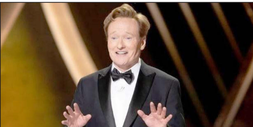
Tras el éxito de audiencia en la pasada ceremonia, que alcanzó los 19,7 millones de espectadores el comediante, repetirá su papel en la ceremonia.