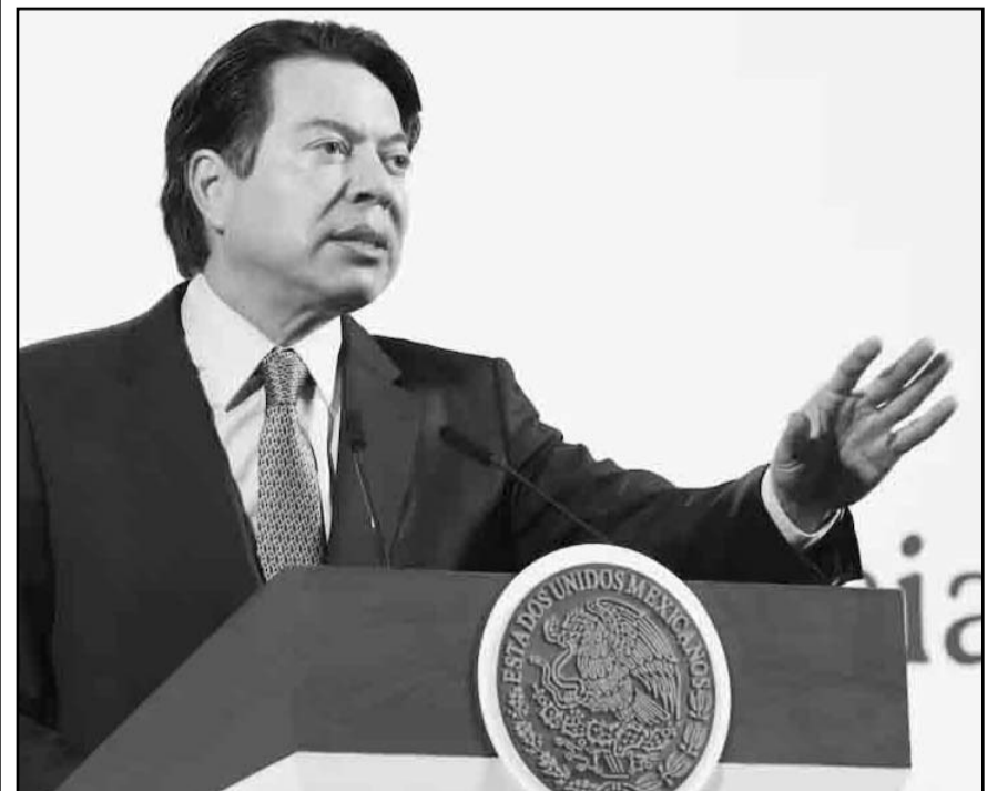
El titular de la SEP anunció que en el nivel de educación media superior ya se tiene un registro de 1.4 millones de estudiantes nuevos.

Además, aseguró que el gobierno federal se compromete a seguir fortaleciendo estos programas y a aumentar las becas disponibles para estudiantes de secundaria, con el fin de seguir combatiendo la desigualdad social y educativa en el país.