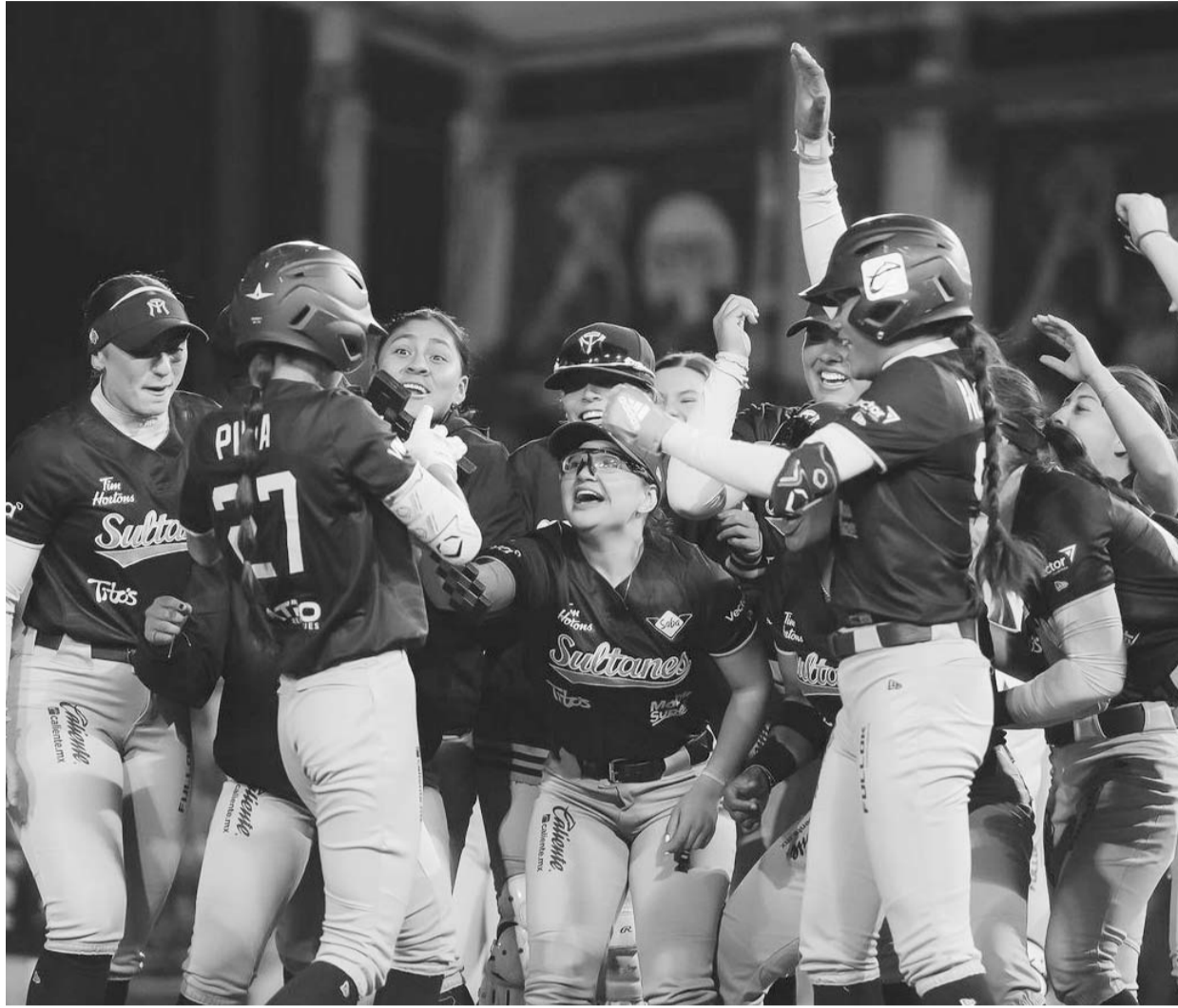
Sultanes abren serie esta noche ante el México.

De conseguir ese objetivo, las regias conseguirían su primer título en la Liga Mexicana de Softbol, lo que se les negó el año pasado tras perder en la disputa de la corona ante las Charras de Jalisco.