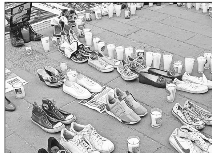
Colectivos y familiares de personas desaparecidas ven algunos avances en la estrategia anunciada por la presidenta Claudia Sheinbaum.

La urgencia, según los colectivos, es transformar la operación de las comisiones locales y las fiscalías para que trabajen de manera eficiente y coordinada en la búsqueda de los desaparecidos.