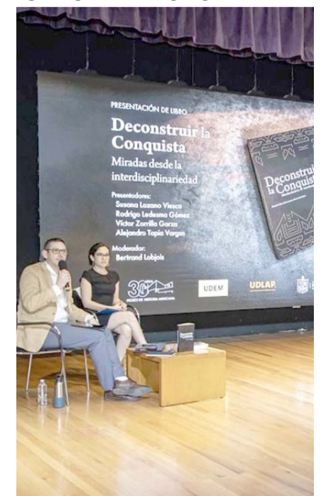
Presentan el libro “Deconstruir la conquista, Miradas desde la interdisciplinariedad”

El panel coincidió en que este libro es una herramienta valiosa para repensar narrativas establecidas, desafiando interpretaciones oficialistas y abriendo espacio para nuevas perspectivas.