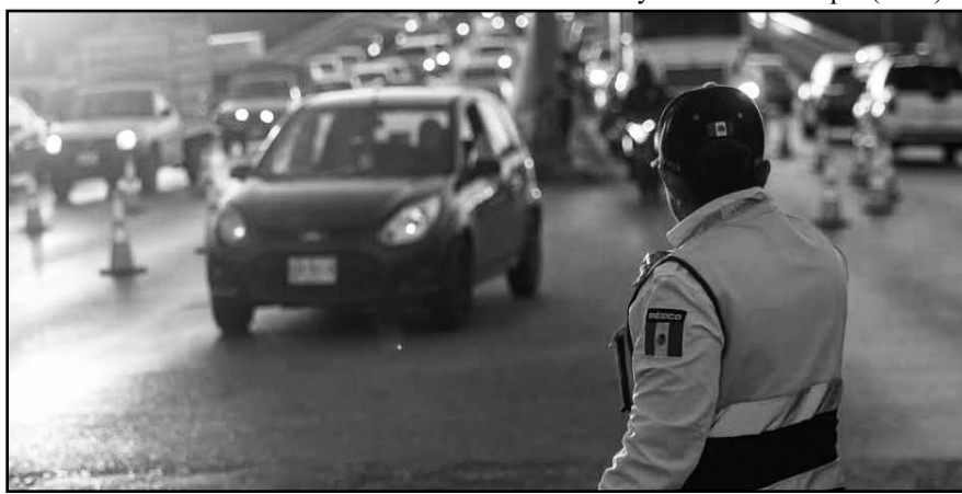
Será de las seis a las ocho de la mañana del centro de Juárez a Guadalupe.

Los que dicen que andan bien portaditos son la mayoría de los gasolineros locales, que a días o mejor dicho horas de cumplirse el plazo (hoy 18), le bajaron sus precios.