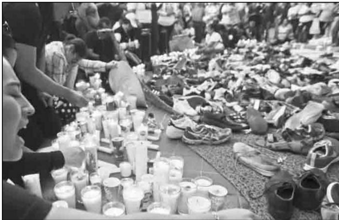
La Comisión Nacional de Búsqueda recibirá equipos avanzados, como tecnología láser y detectores de metal, para mejorar la localización de desaparecidos.

Además, explicó que se firmó un decreto para fortalecer la Comisión Nacional de Búsqueda (CNB), que incluye la adquisición de equipos tecnológicos avanzados, como tecnología láser y detectores de metal, para mejorar la precisión en la localización de personas desaparecidas.