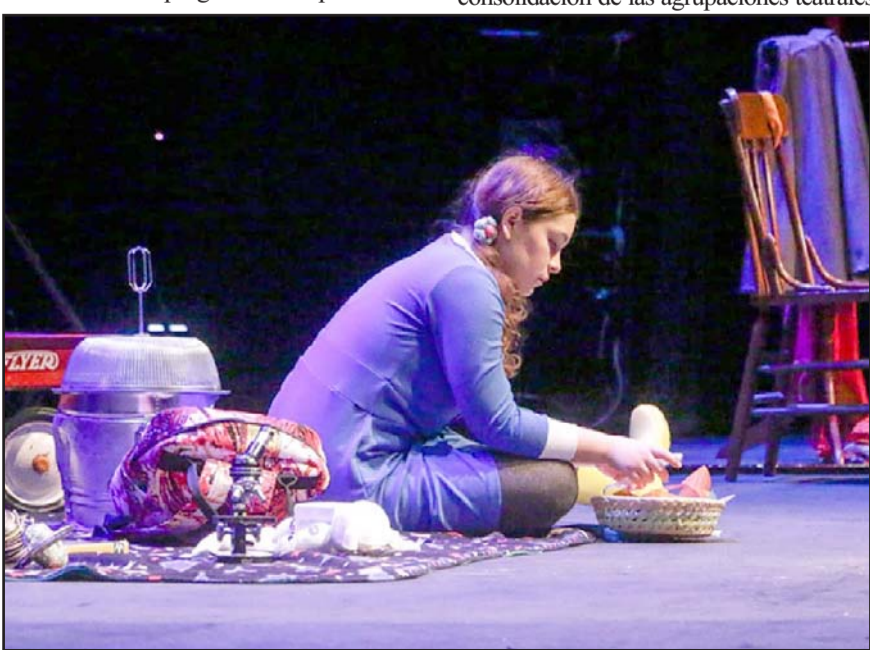
Se recibieron 12 propuestas de diversas agrupaciones de la entidad.