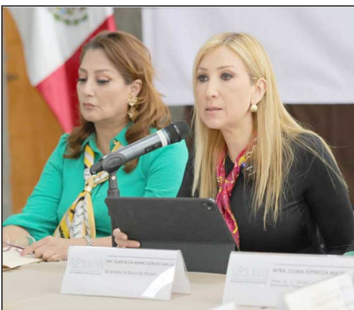
Esto tras el fallecimiento de un bebé de mesy medio