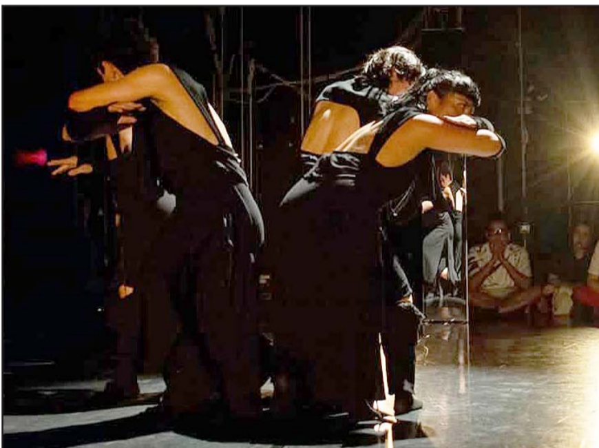
El programa tiene el objetivo de estimular y fomentar el desarrollo de la danza contemporánea en Nuevo León.