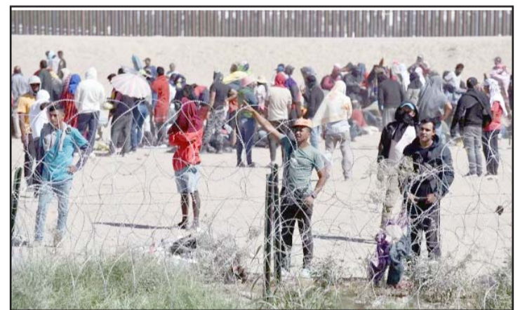
La mayoría de los inmigrantes son mexicanos.

La mandataria mexicana expresó que seguirá el diálogo con los Estados Unidos, pues México busca que se mantenga el T-MEC, pues éste beneficia a los tres países involucrados y se confía en lograr avances.