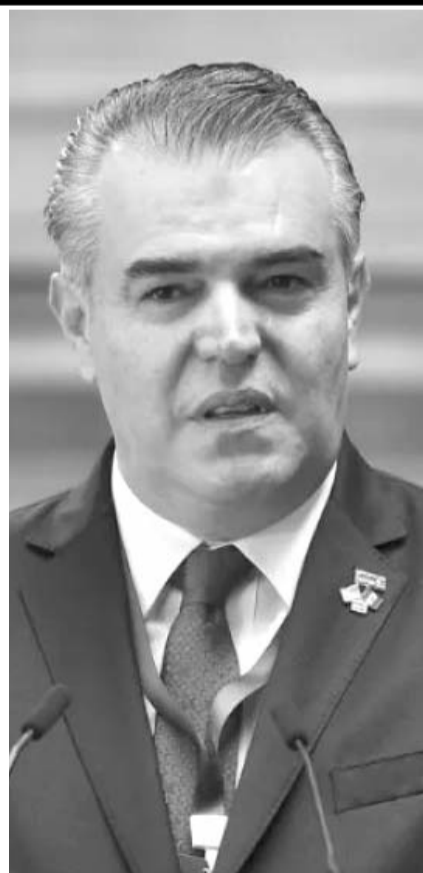
El Consejo Coordinador Empresarial (CCE) reafirmó su respaldo a la presidenta Claudia Sheinbaum Pardo

A nombre los organismos que integran el CCE, reiteró su compromiso de seguir colaborando con el sector públi-