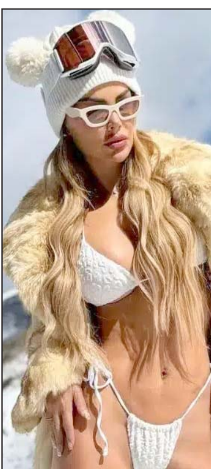
La actriz viajó a Colorado y se tomó fotografías disfrutando de la nieve.