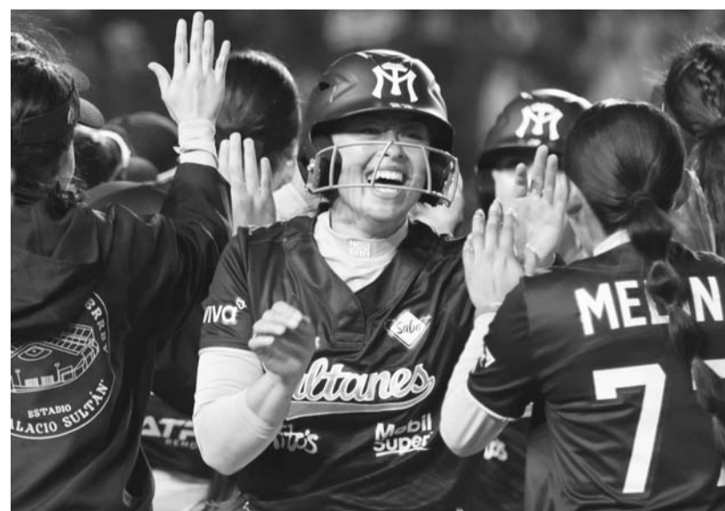
Las regias están cerrando bien la temporada regular.