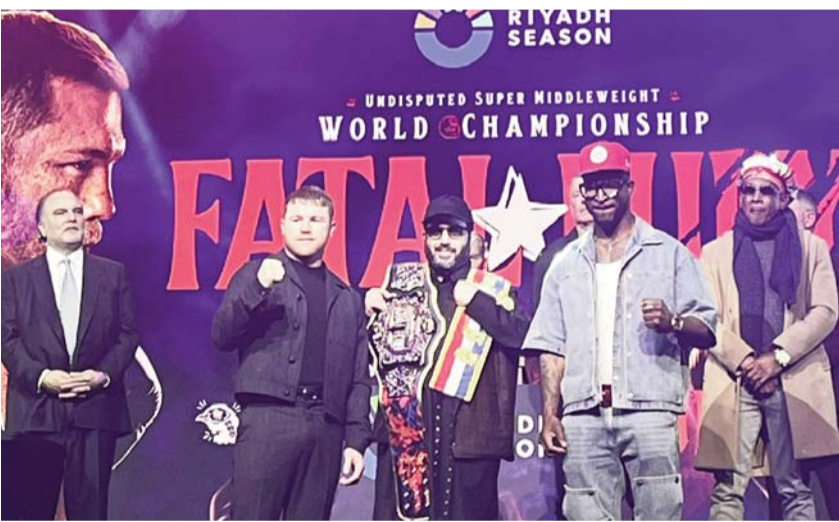
El evento se desarrolló en Nueva York.