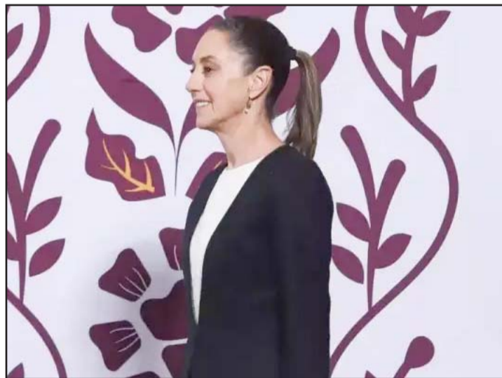
La presidenta de México sostuvo una llamada con Trump.

"Él al principio, pues planteó que se quedaran las tarifas y luego revisárlas, en fin, hubo un