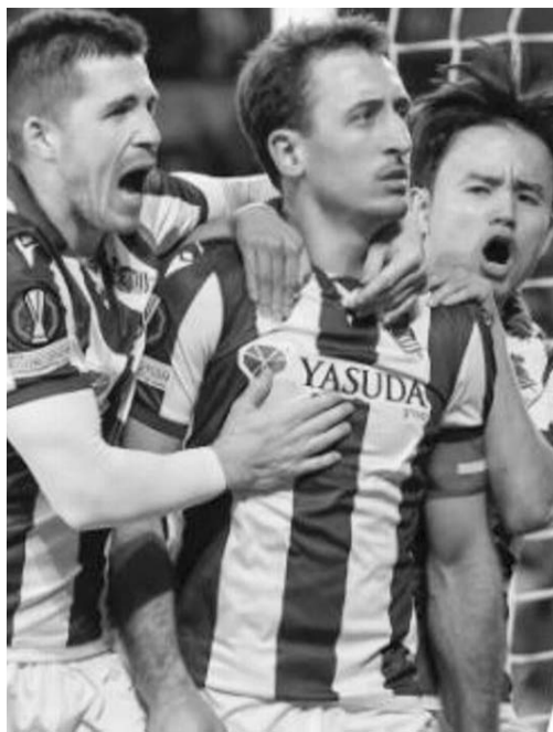
Real Sociedad, con cierta desventaja.