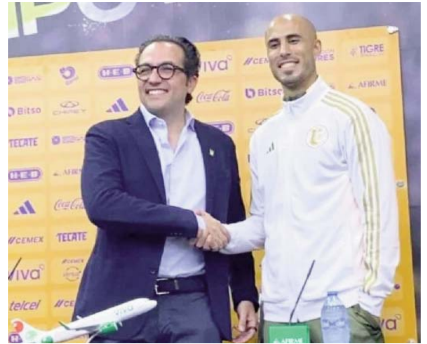
El presidente felino reveló las causas del cambio.