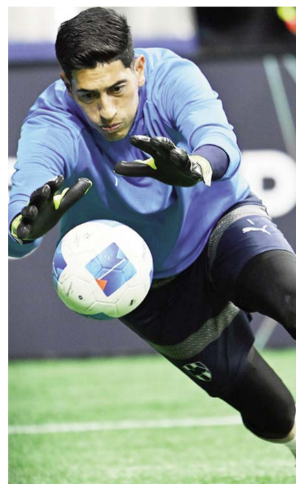
Monterrey enfrenta mañana a Cruz Azul.