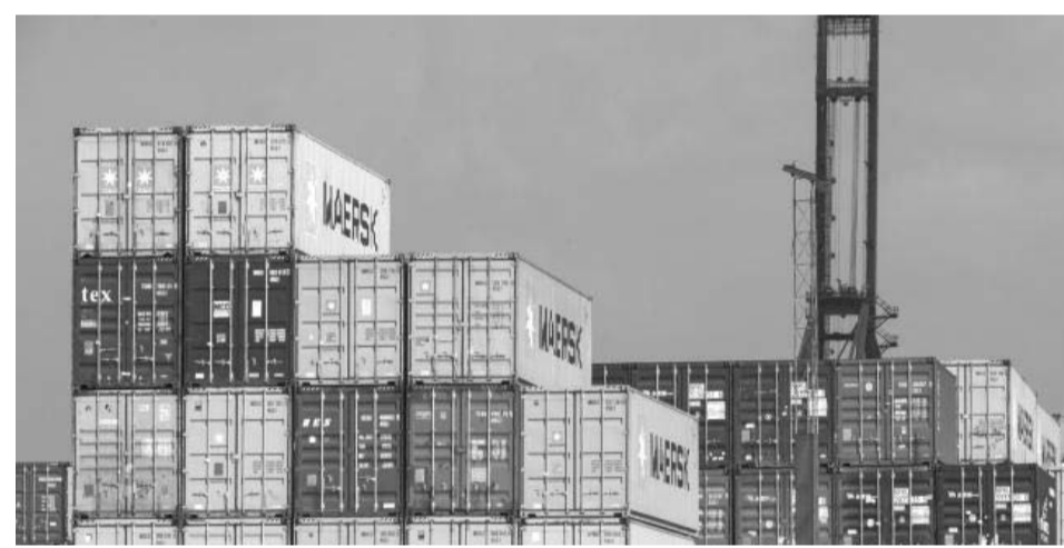
México exportó a Estados Unidos mercancías por un valor de 41 mil 679 millones de dólares durante enero pasado

Los rubros que más crecieron en exportaciones fueron los de bienes de capital, impulsados por la aviación civil y los semiconductores, así como los productos farmacéuticos y la joyería.