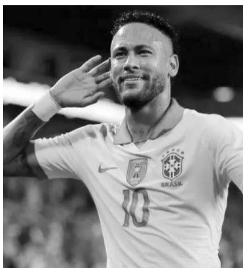
Neymar fue convocado de nuevo.

Ya en más resultados de los octavos de final de ida de la Liga de Europa de la UEFA, Lyon derrotó 3-1 al FCSB, Rangers venció 3-1 al Fenerbahçe, AZ superó 1-0 al Tottenham, Viktoria Plzen igualó 1-1 contra Lazio, Bodo/Glimt derrotó 3-0 a Olympiacos y Frankfurt venció 2-1 al Ajax.