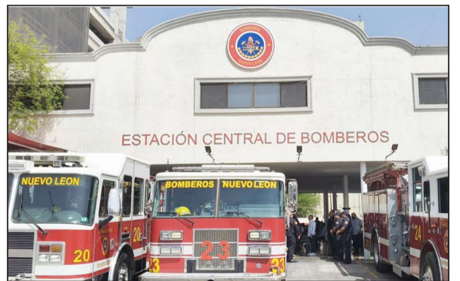
Será para una mayor cobertura y adquisición de equipamiento.

“Con este apoyo vamos a poder mejorar un servicio que no solo salvavidas, sino que también protege el patrimonio de miles de familias”, añadió.