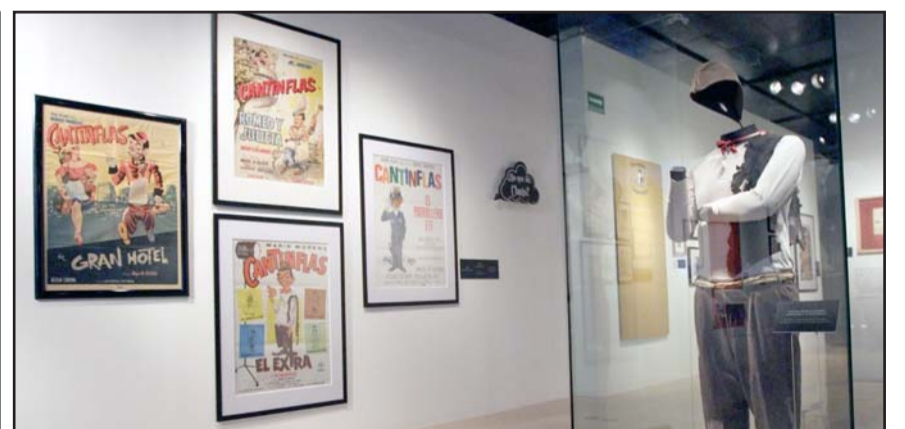
El recinto sería en los antiguos estudios CLASA donde filmaron varias cintas.