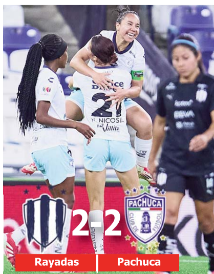
Pachuca aprovechó la compensación.

Todo indicaba que las Rayadas del Monterrey se embolsarían las tres unidades ayer, sin embargo, en el último instante Pachuca las empató al minuto 100 para frustrarles la victoria.