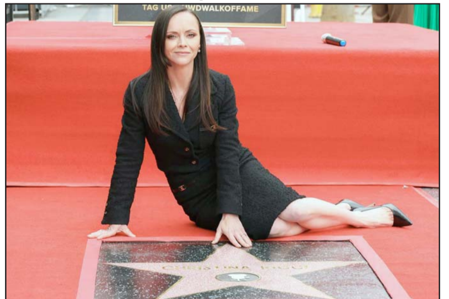
Ricci comenzó su carrera artística desde que era una niña.

Su interpretación de la icónica Wednesday Addams en "La familia Addams" (1991) y su secuela "Addams Family Values" (1993) la catapultó a la fama, seguida por su participación en la exitosa película "Casper" de 1995. Estos papeles no solo le valieron reconocimiento, sino también premios como el NATO Show East Star of the Year y el Star of Tomorrow Award.