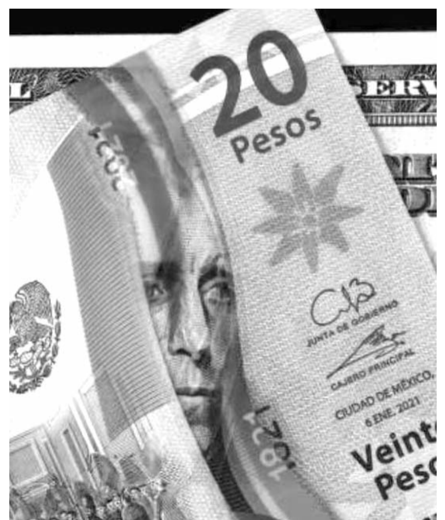
El dólar al menudeo se cotiza este jueves en 20.78 pesos a la venta en las ventanillas de las sucursales de Banamex, 0.57% o 12 centavos por debajo del cierre del miércoles.

Agregó que continuarán "trabajando juntos, particularmente en temas de migración y seguridad, que incluyen