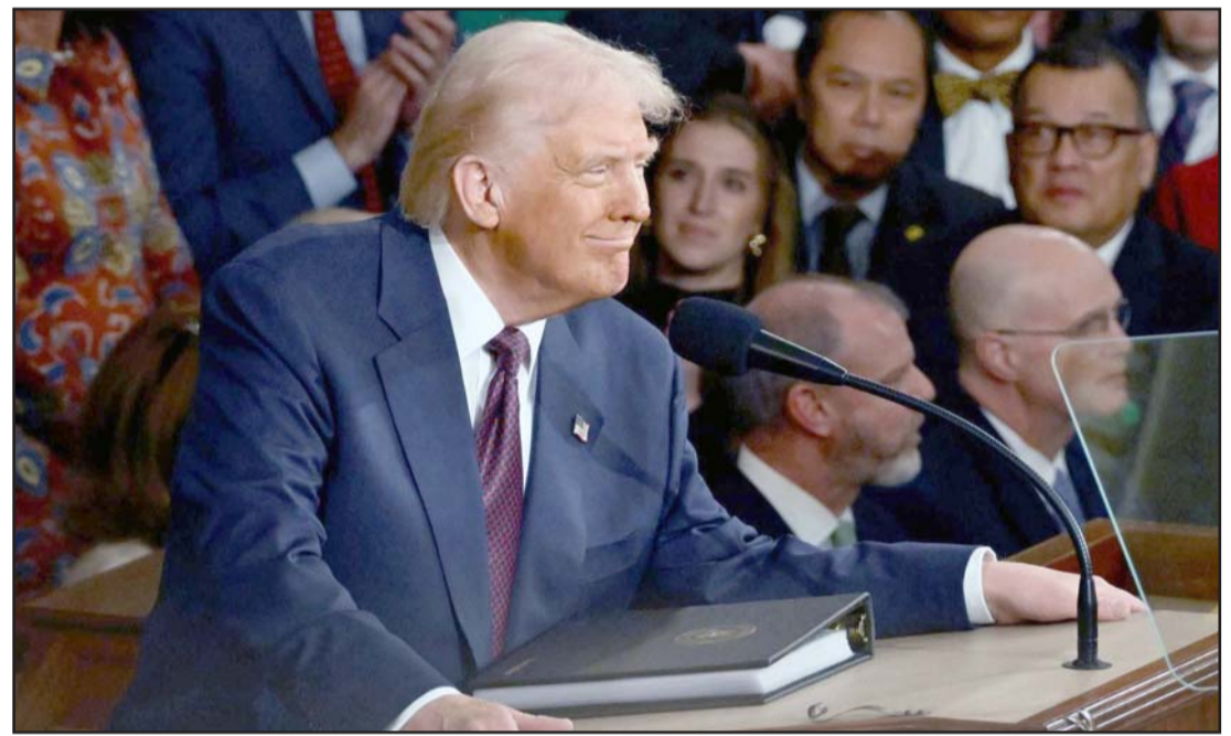
Donald Trump ha mantenido al mundo en vilo por su política proteccionista.

Sheinbaum también reiteró el compromiso de México en la lucha contra el tráfico ilegal de