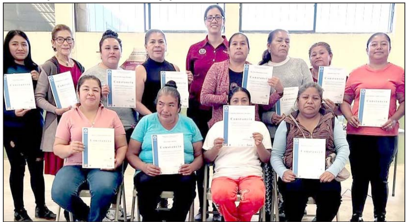
El grupo POEMA está conformado en su totalidad por mujeres, amas de casa, que han vivido en Las Enramadas.