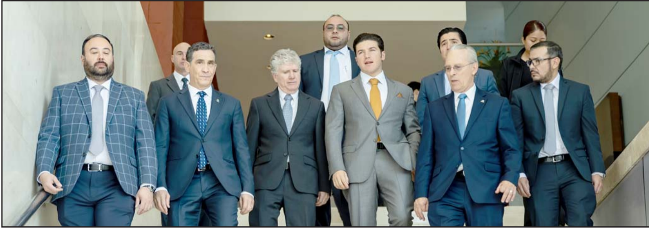
El mandatario estatal dijo que su administración estatal trabajará por mantener a Nuevo León como líder nacional.