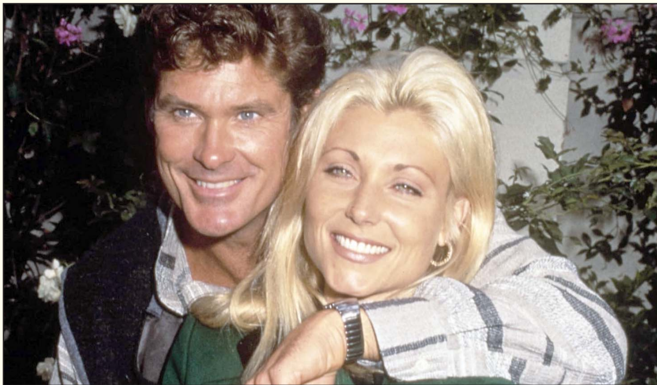
La actriz estuvo casada con David Hasselhoff durante 17 y tuvieron dos hijos. Luego lo acusó de violencia doméstica.