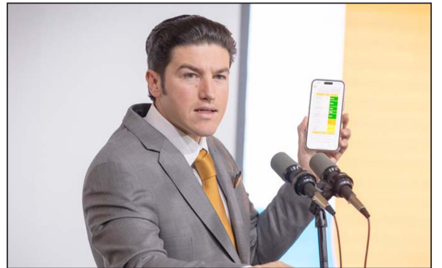
El gobernador Samuel García dijo invertirán 14 millones de pesos.

Se prevé también la reposición del equipo que instaló la empresa Ternium en la Estación Pesquería, a manera de evitar un posible conflicto de intereses.