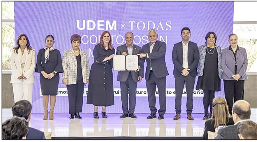
La alianza comenzó a gestarse años atrás pero en 2024 se materializó.