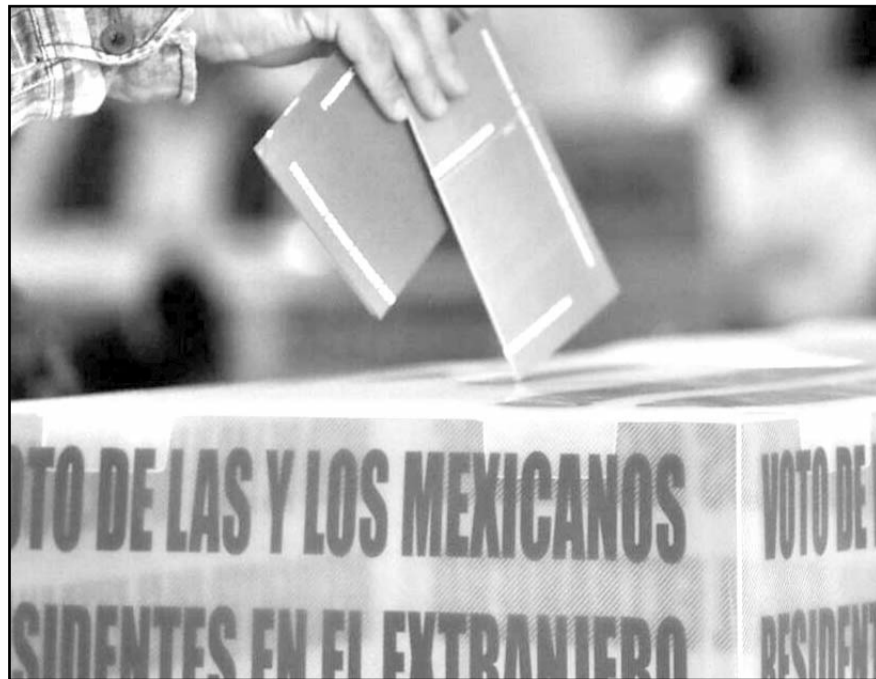
Los ciudadanos depositarán sus boletas en la urna, con la posibilidad de usar una nueva cuando la actual alcance su capacidad máxima.

Durante el flujo de la votación, la persona escrutadora se ubicará en un lugar estratégico en la casilla seccional o seccional única, para orientar a la ciudadanía sobre la ubicación de los cancelos o mamparas, así como la urna en la cual podrá depositar su voto. Además, facilitará el