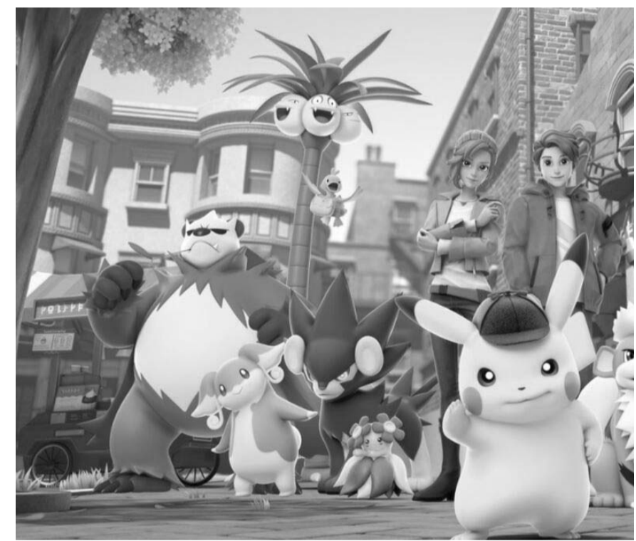
A diferencia de la primera entrega, los personajes tendrán mayor libertad a la hora de los combates, solo que deben tener estrategias bien pensadas para salir victorioso.

con una advertencia en la que se decía que este no era el diseño final del videojuego.