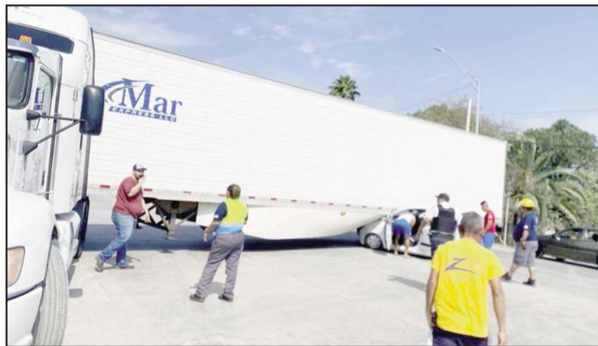
El auto sedán circulaba a exceso de velocidad.

Elementos de Protección Civil se movilizaron hacia la Carretera Nacional, a la altura del Casino