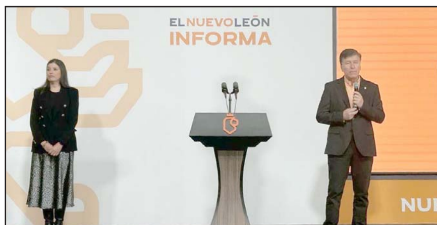
Estará presente Alicia Bárcena, secretaria de Medio Ambiente y Recursos Naturales,