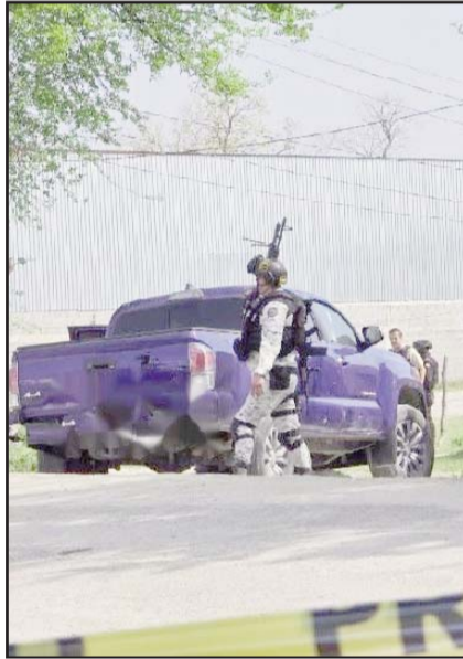
Se registró en Montemorelos.

Hasta el momento las autoridades, no han revelado lo que decía el mensaje que fue dejado por los autores materiales del crimen.