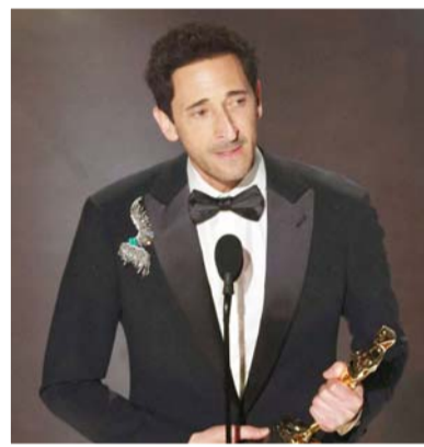
Adrien Brody / Mejor Actor.

ducción subió al escenario a recibir el premio, que fue entregado por Meg Ryan y Billy Crystal, protagonistas de la comedia "Cuando Harry conoció a Sally".