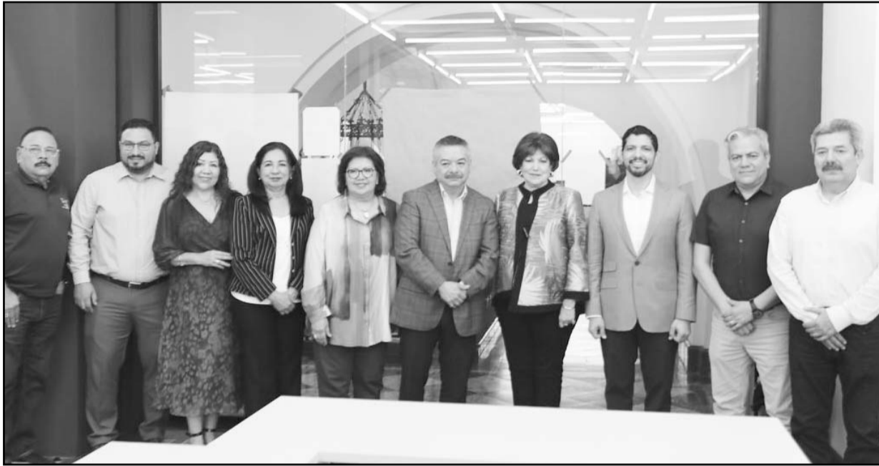
Tendrán como premisa fundamental que primero están los derechos de los agremiados.