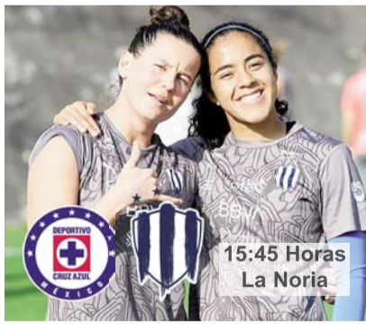
Las albiazules se miden al Cruz Azul.

El equipo que dirige Amelia Valverde se quedó en las 16 unidades cosechadas luego de nueve jornadas, lo que es producto de cinco victorias,