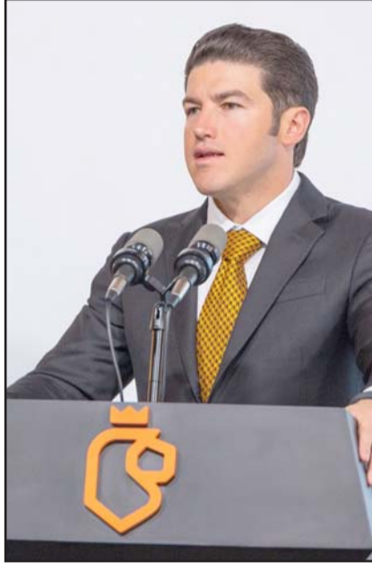
Reconoció que el problema crece.

“La encuesta dice que todo mundo hace más tiempo en el tráfico pues es