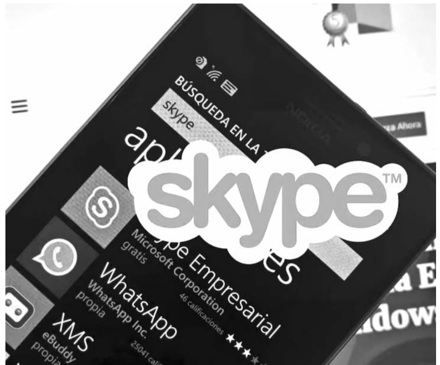
Hasta el momento, muchos usuarios estaban esperando el rediseño de la app de videollamadas, pero este nunca llegó.

Microsoft anuncia el cierre definitivo de la app