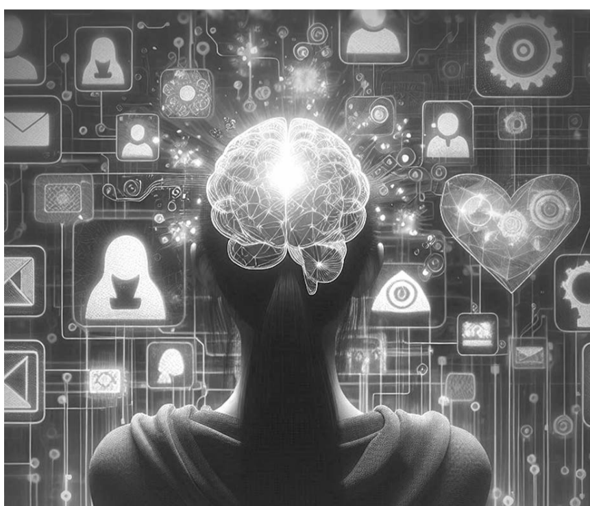
¿La inteligencia artificial podría prevenir los trastornos mentales? Esto dicen expertos en el marco del Día Mundial del Bienestar Mental para los Adolescentes.

En este sentido, la IA es una herramienta que puede ayudar a prevenir los trastornos en la salud mental.