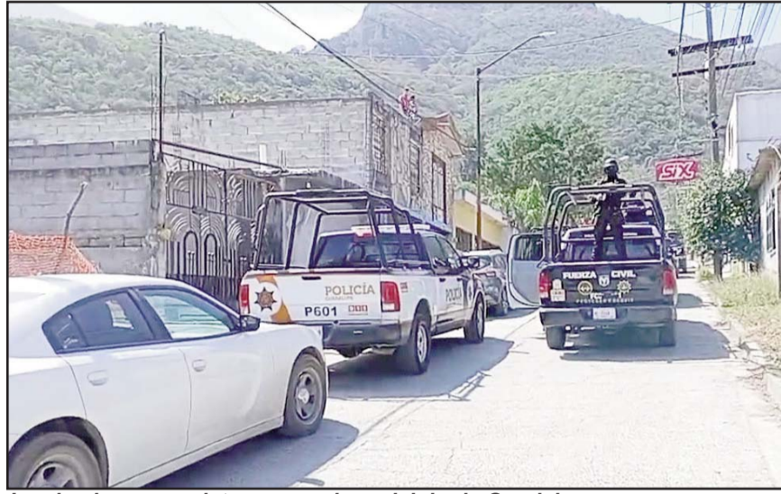
Los hechos se registraron en el municipio de Guadalupe.

El área quedó asegurada por fuerzas de los tres órdenes de gobierno, para llevar a cabo las investigaciones y capturar a los responsables.