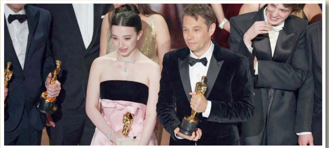
Mikey Madison se llevó la estatuilla a mejor actriz y Sean Baker a mejor director.