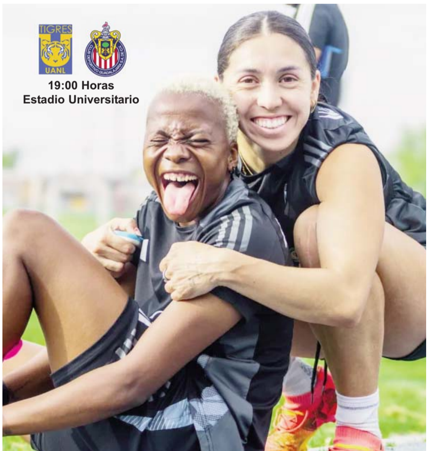
Las felinas buscan escalar peldaños en la Liga Mx.

Tras este resultado, ahora los Rayados volverán a la actividad cuando el próximo miércoles visiten al Vancouver Whitecaps en los octavos de final de ida de la Copa de Campeones de la Concacaf.