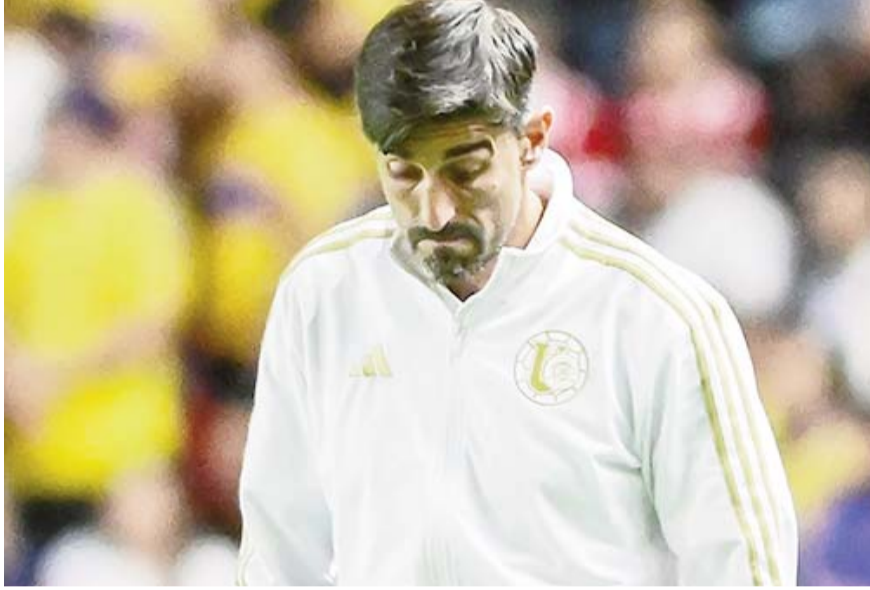
El serbio fue destituido de su cargo ayer.

Sorprende Tigres con cambio en el timón después de una importante victoria ante Necaxa