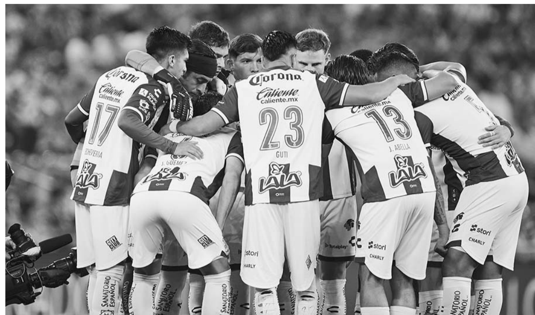
Santos realizó un buen partido en el estadio rayado.