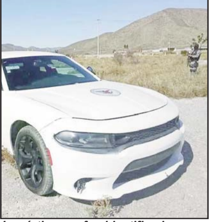
La víctima no fue identificada.

Vecinos del sector expresaron su preocupación por el aumento de la violencia en la zona y pidieron mayor presencia policial para garantizar la seguridad en la comunidad.