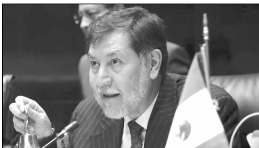
El legislador criticó que Aureoles logró mantenerse en el poder a pesar de perder la gubernatura en su primer intento.