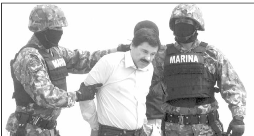
En los últimos tres años, jueces han otorgado la libertad a líderes e integrantes de la delincuencia organizada.

En estos primeros comicios del Poder Judicial se elegirán, a nivel federal, la totalidad de los cargos de las y los ministros de la Suprema Corte de Justicia de la Nación (SCJN); las magistraturas vacantes de la Sala Superior del Tribunal Electoral del Poder Judicial de la Federación (TEPJF); magistraturas de las Salas Regionales del TEPJF; las y los integrantes del Tribunal de Disciplina Judicial, así como la mitad de las personas magistradas de circuito y juezas de distrito.