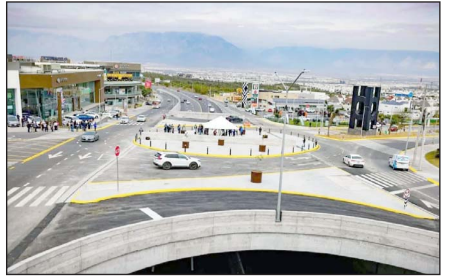
Con ese programa se garantizarán unas mejores vialidades para los regiomontanos.

“Entonces tenemos que meternos a arreglar la movilidad, pero requerimos de la corresponsabilidad. Si cada vez hay más gente y cada uno sigue comprando su carro, el tráfico no se va a arreglar”, destacó.