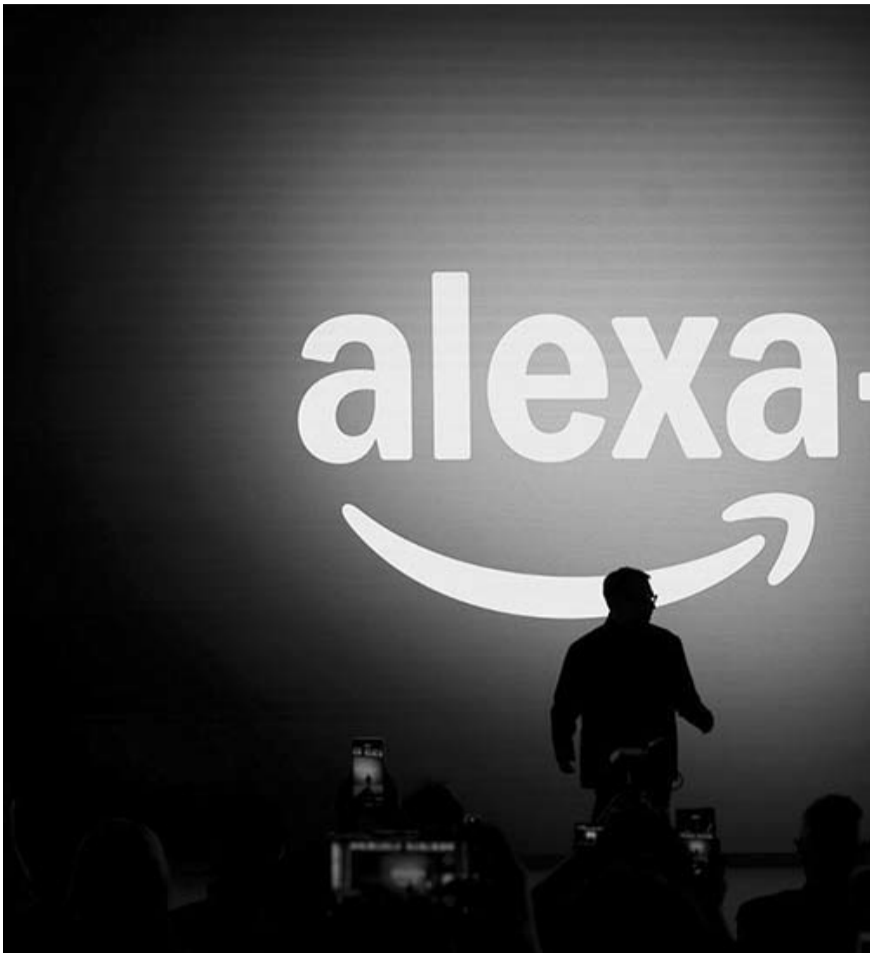
Amazon presentó su nueva versión de asistente de voz Alexa impulsado con inteligencia artificial (IA).