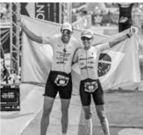
El evento se realizó en el río Santa Lucía.