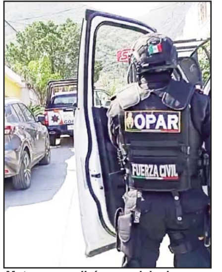
Mataron a policías municipales.

La zona fue acordonada mientras peritos realizaban el levantamiento de evidencias.