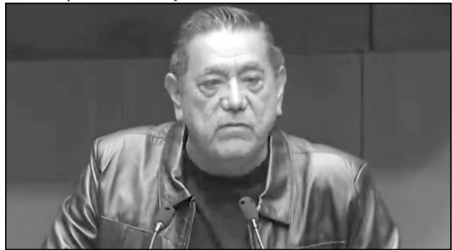
El legislador rechazó que Morena pueda imponer reglas por encima de la Constitución, la cual garantiza su derecho a votar y ser votado.

"Entonces, siguió, lo que el pueblo diga, pero a ver, yo qué digo, yo soy senador hasta 2030, el pueblo me dio chamba, estoy chambeando, yo no tengo ningún problema, yo no he dicho que quiero ser ni he dicho que no voy a ser, yo no he dicho nada, simplemente no he dicho nada, pero sí conozco de leyes", agregó el morenista.