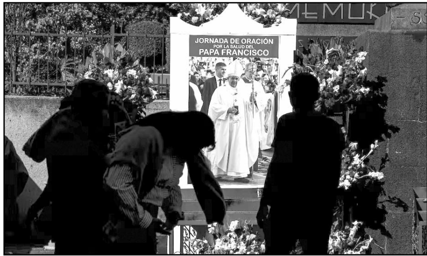
En la Basílica se elevó una plegaria para que la Iglesia viva en unidad, justicia, paz y amor, incluyendo la pronta recuperación del Pontífice.

A pesar de la mejoría reportada, el líder de la Iglesia católica no realizó su tradicional mensaje del Ángelus,