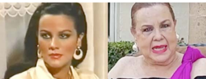
Habría muerto, a sus 72 años, de edad.