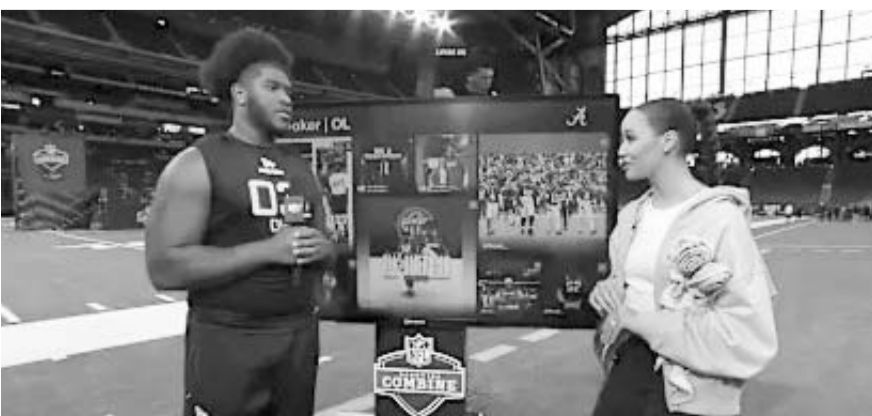
Ahora sólo falta esperar el draft que se celebrará en abril.

Con este triunfo la novena regia aseguró su clasificación en posttemporada, restando solamente cuatro juegos del rol regular; Charros de Jalisco será el próximo rival de Sultanes estos jueves y viernes en punto de las 20:00 horas.