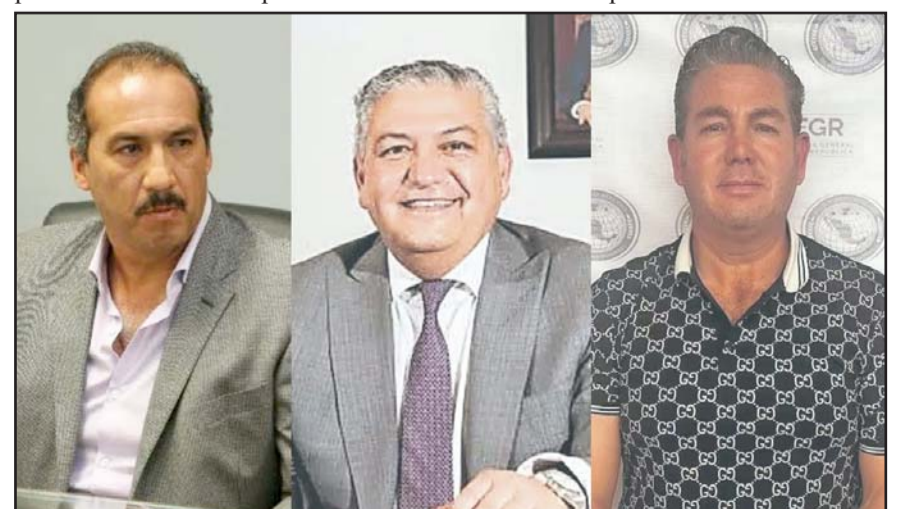
La audiencia duró más de 18 horas y concluyó con la decisión de enviar a los acusados a los penales de Reclusorio Oriente y Santa Martha Acatitla.

Los fiscales señalaron que los terrenos para los cuarteles fueron comprados con los siguientes sobrepagos: Apatzingán, 76 millones de pesos; Huetamo, 37; Jiquilpan, 90; Lázaro Cárdenas; 163; Uruapan, 63; Coalcomán, 116, y Zitácuaro 103 millones de pesos del Fondo de Aportaciones para la Seguridad Pública (FASP) y que se transfirieron mediante 90 operaciones bancarias.