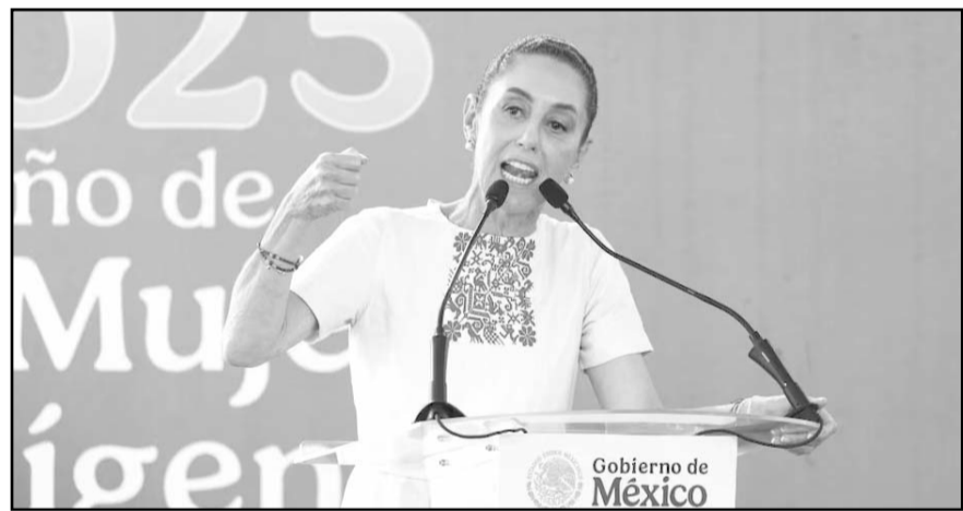
La mandataria argumentó que, a diferencia del Ejecutivo y el Legislativo, el Poder Judicial ha sido controlado por decisiones internas

Al encabezar el inicio de obras del programa de construcción de viviendas en Colima, la jefa del Ejecutivo federal afirmó que México es un gran país, libre, independiente y soberano. "Díganles a nuestros paisanos que están del otro lado de la frontera, que aquí está su Presidenta y su pueblo para defenderlos.