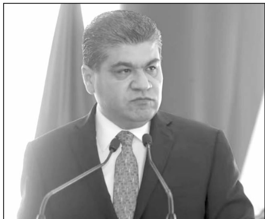
El senador propuso la creación de un Registro Único de Homicidios Dolosos de menores para mejorar la prevención y atención del problema.

"El Estado tiene la obligación de garantizar la vida, seguridad e integridad de nuestra niñez. No podemos seguir permitiendo que estos delitos queden impunes ni que la violencia siga creciendo sin control", concluyó Miguel Ángel Riquelme.