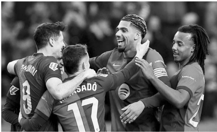
El conjunto catalán goleó a la Real Sociedad.

La escuadra blaugrana alcanzó las 57 unidades luego de 26 jornadas para retomar la cima en la Liga de España y tener un punto de ventaja sobre el sublíder Atlético de Madrid.