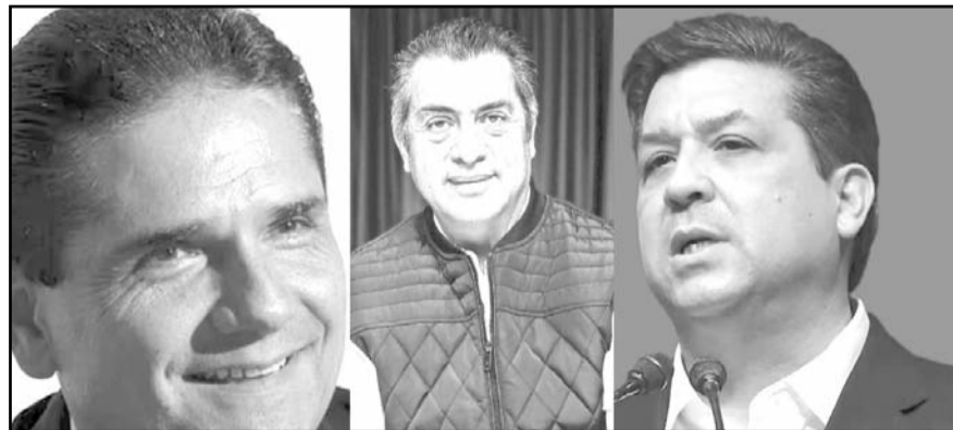
El grupo de gobernadores opositores que surgió en 2020, se desintegró tras las victorias de Morena en 2021 y fue declarada "muerta" en 2022.

También formaron parte de la alianza Miguel Ángel Riquelme, Enrique Alfaro, y Diego Sinhué Rodríguez, quienes no han sido señalados por irregularidades.