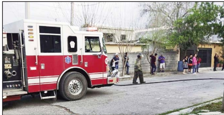
Amenazaba con extenderse hacia la zona habitada.

Hasta este momento se desconoce las causas que originaron el siniestro, cuyas llamas se extendieron en pocos minutos.