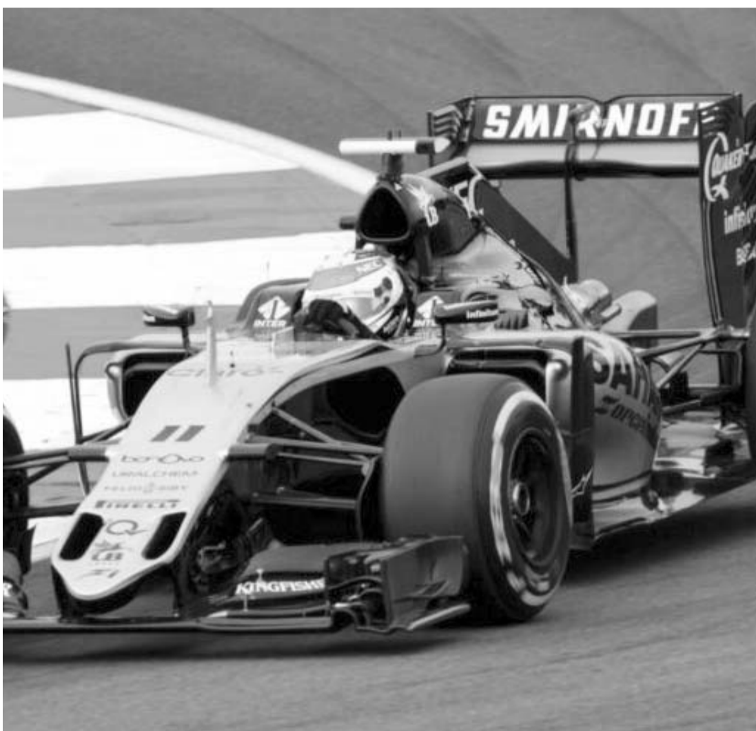
El regio escaló doce posiciones en un buen día para él.

Tras esta situación, ahora el regiomontano volverá a la actividad en su temporada de IndyCar cuando el próximo 23 de marzo pueda correr en el Gran Premio de Thermal