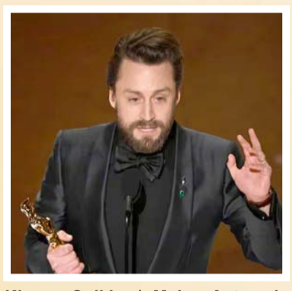
Kieran Culkin / Mejor Actor de Reparto.

Cuando el cantante británico Mick Jagger llegó al escenario a presentar el Oscar de Mejor canción, el también británico Elton John se levantó