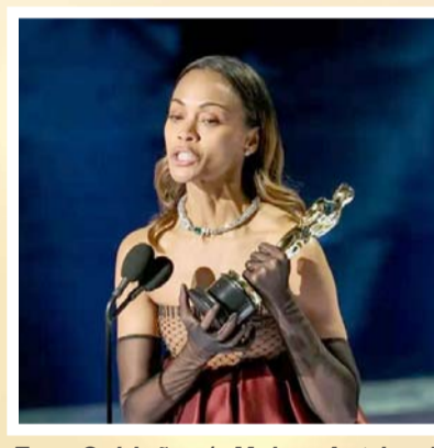
Zoe Saldña / Mejor Actriz de Reparto.

Sean Baker, director de "Anora", se dijo sumamente sorprendido por el resultado; sin embargo, destacó la importancia del cine independiente actual: "Hicimos esta película de forma independiente, si alguna persona que está viendo la ceremonia está haciendo cine independiente, sigue haciéndolo, necesitamos más películas así", dijo.