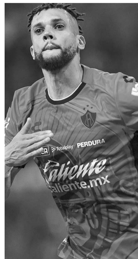
Atlas le dio la vuelta al San Luis.