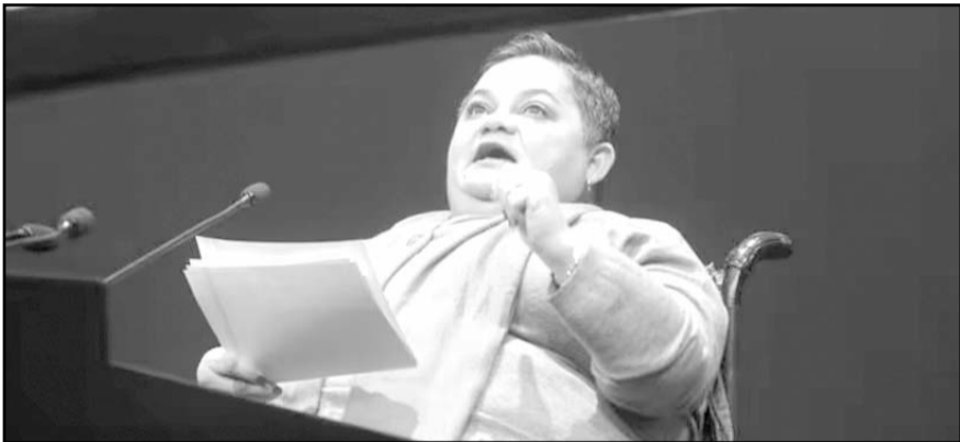
La exfuncionaria fue reconocida por su entrega y pasión en la construcción de políticas a favor de la inclusión.

Sin embargo, su estado de salud sigue generando preocupación, especialmente tras la recaída del viernes, cuando sufrió una crisis respiratoria por broncoespasmo.