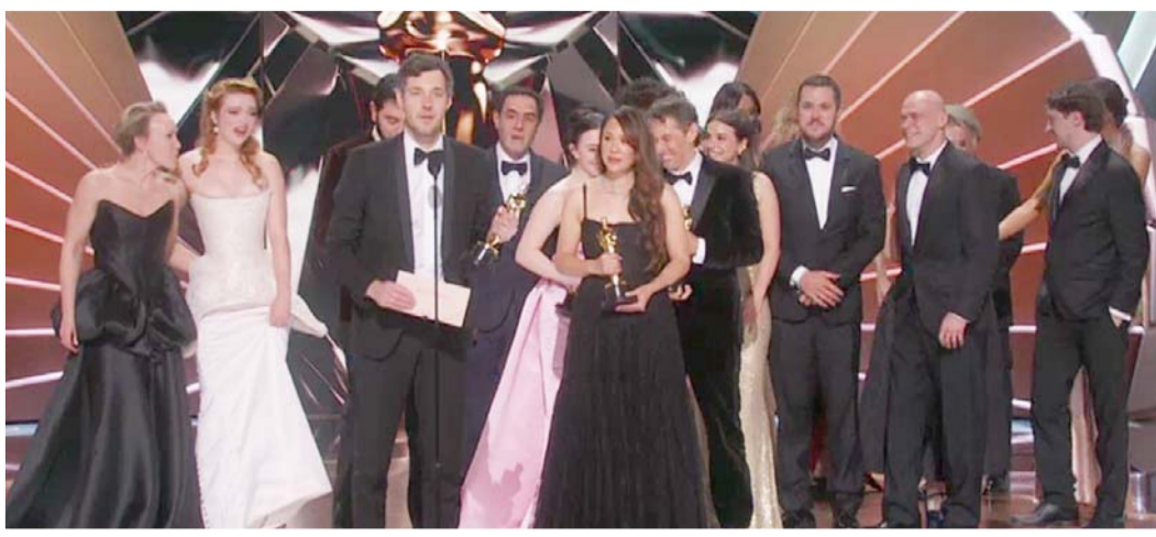
Anora se convirtió en la mejor película del 2025.