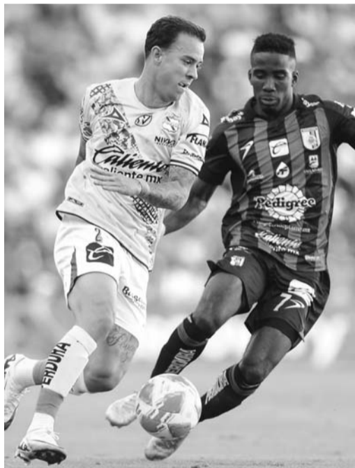
Querétaro se impuso al Puebla.

Querétaro sumó de a tres unidades luego de vencer en casa y por un marcador de 2-0 al Puebla en la jornada 10 de la Liga MX.