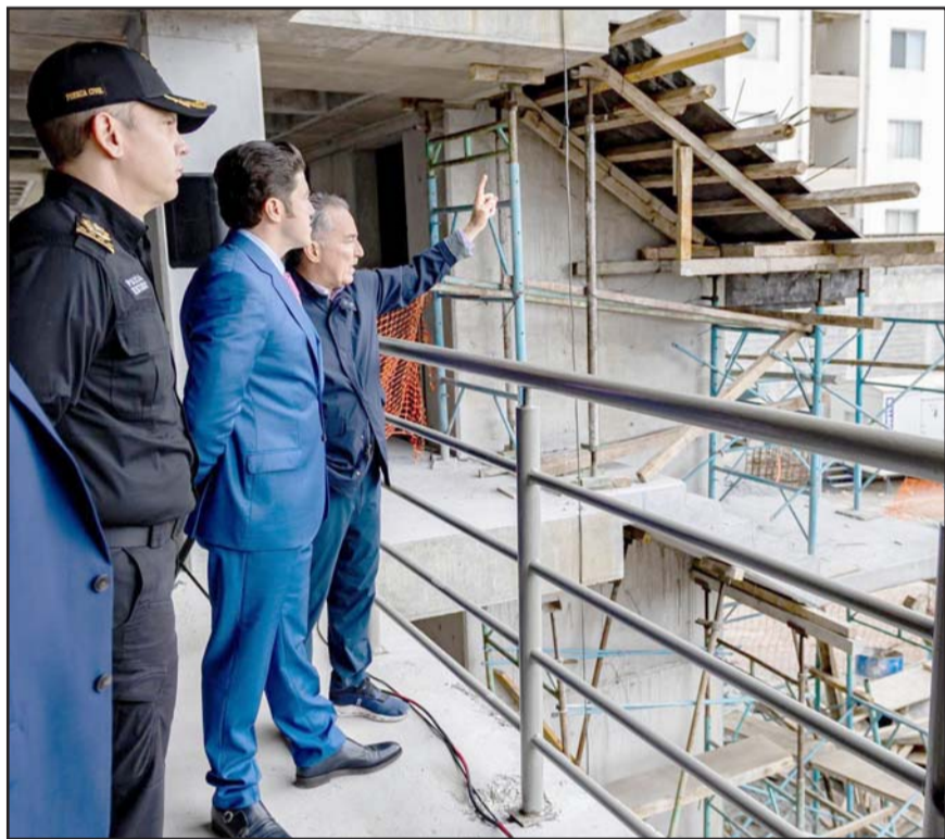
El gobernador hizo un recorrido por las obras del nuevo cuartel.

En tanto, recordó que el mantenimiento de calles y avenidas es continuo ya que sufren afectaciones de forma natural por el uso, por el paso del tiempo o por otras obras.