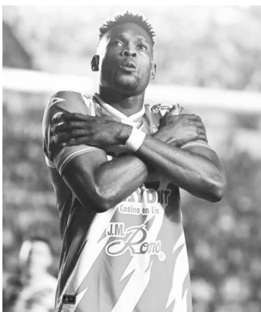
Cambiando, por más goles.

La jornada ocho del Torneo Clausura 2025 va a iniciar este viernes con dos partidos, entre los cuales Necaxa intentará vencer al Mazatlán para seguir escalando lugares en la parte alta de la tabla de posiciones.