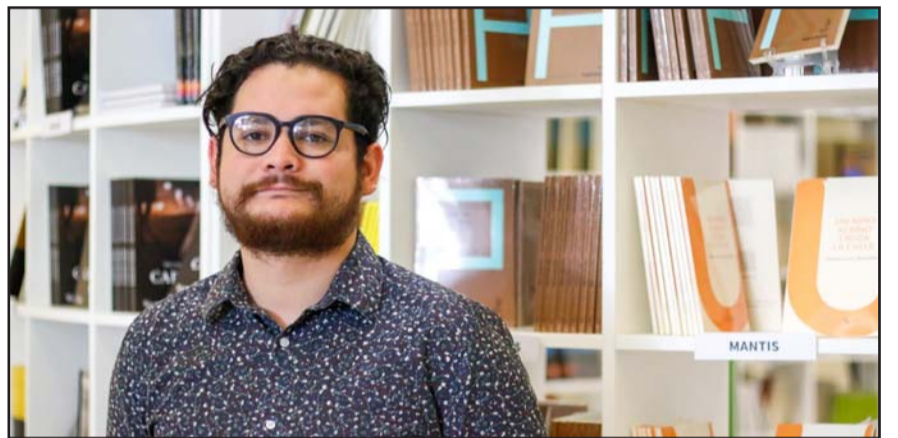
La obra resultó ganadora del Premio Nacional de Poesía Carmen Alardín 2024.

Esta feria literaria se realiza cada año con el propósito de dar a conocer las novedades de la industria editorial mexicana.