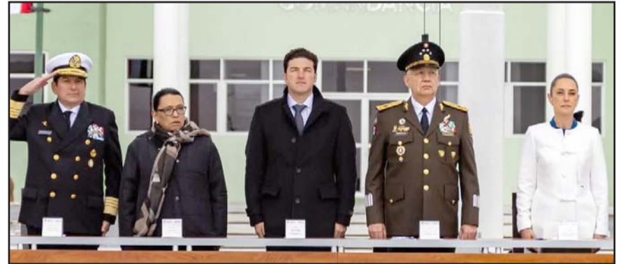
Así lo dio a conocer el gobernador Samuel García Sepúlveda.

El mandatario estatal resaltó que durante los primeros tres años de su administración la Refinería de Cadereyta se comprometió a invertir en reducir sus