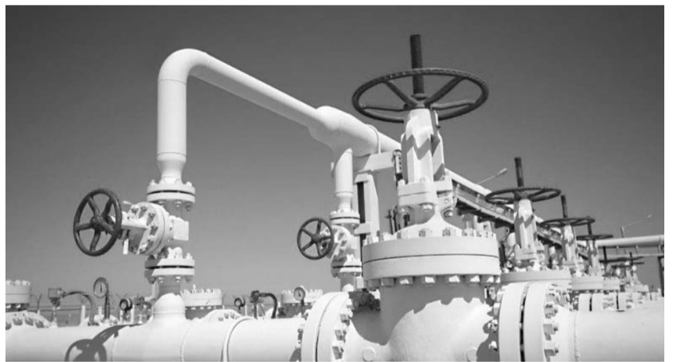
Actualmente representa el 70 % de sus importaciones.

El reporte prevé que la participación del gas transportado desde Estados Unidos en el mercado mexicano seguirá en ascenso en los próximos años. Esto será posible gra-