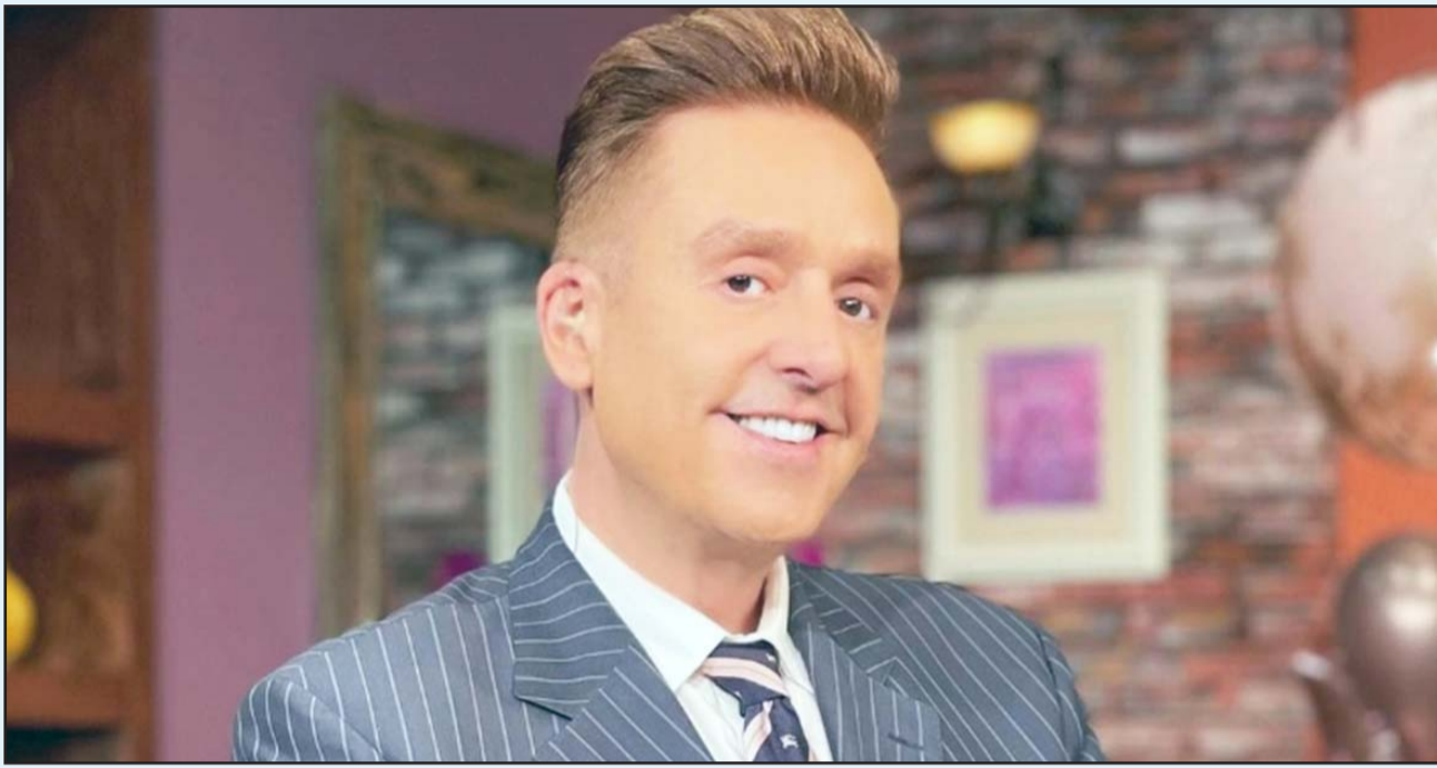
El conductor de "Ventaneando" llevaba varios días hospitalizado tras presentar una nueva crisis de salud.