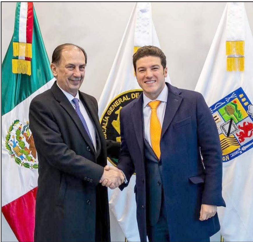
Ambas partes refrendaron el compromiso de trabajar en coordinación