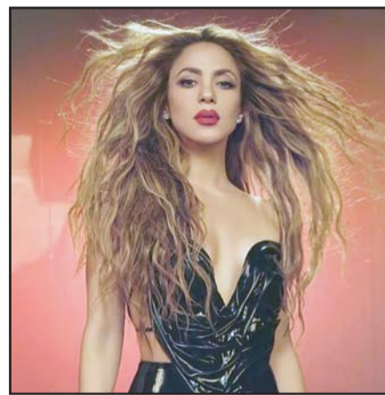
Shakira y Carín León fueron los más galardonados en la ceremonia.

Las presentaciones en vivo fueron variadas, con actuaciones de Natti Natasha, Reik, y una colaboración entre Thalía y las hermanas Ha*Ash.