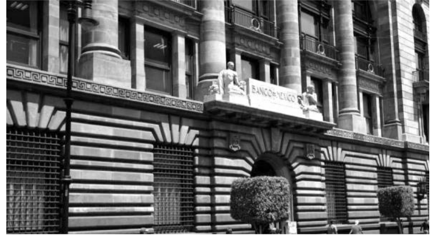
Al reiterar que podría reducir otra vez en 50 puntos base la tasa de referencia, Banco de México (Banxico), advirtió que la inflación de las mercancías podría aumentar.

y combate al narcotráfico, específicamente fentanilo. De lo contrario, amenaza con imponer aranceles generales a México de 25 por ciento.