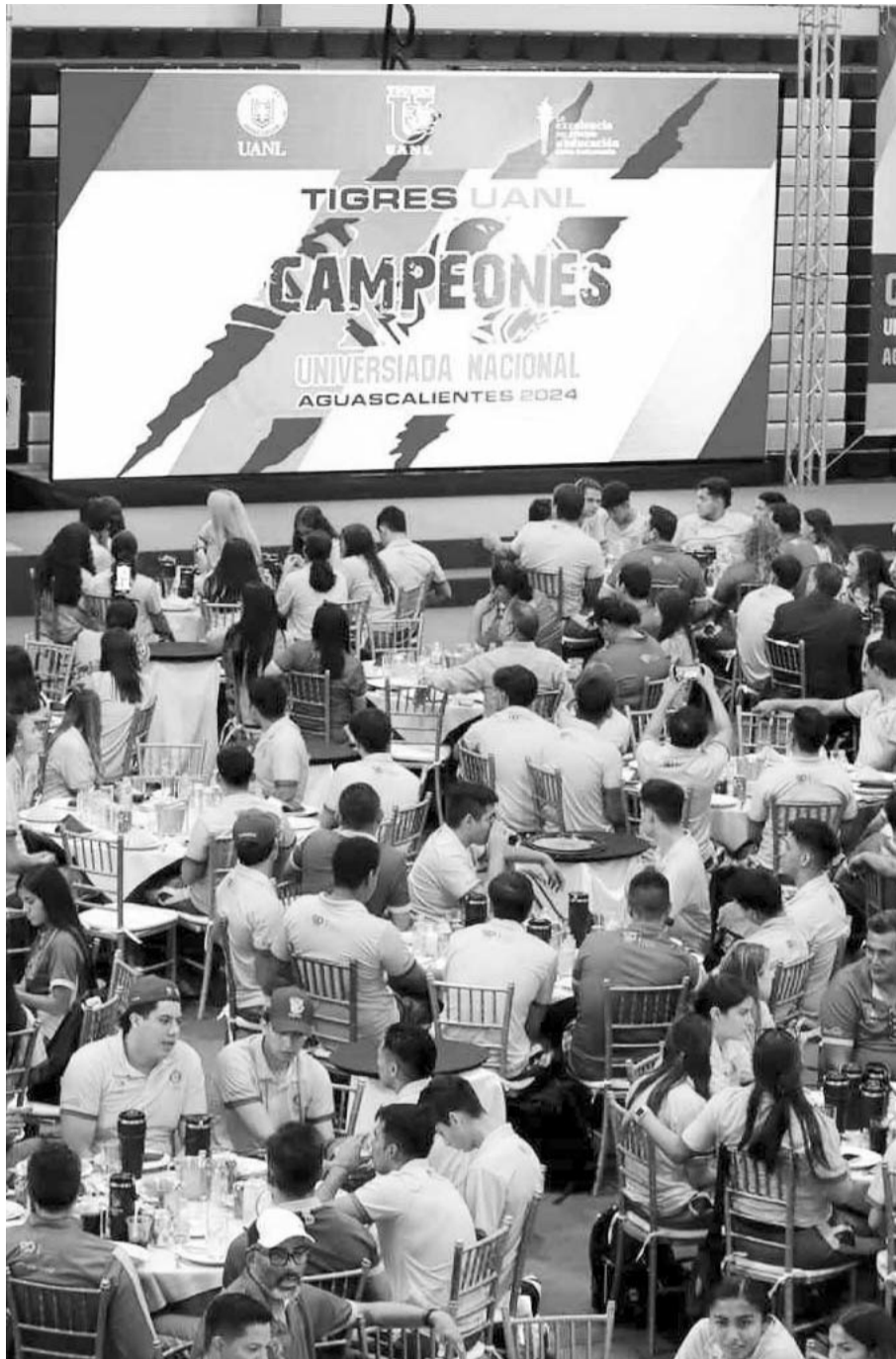
La UANL es multicampeona en estos eventos.

La monarca de los anteriores Juegos Nacionales Conade y la cual se está preparando para las próximas copas del mundo de la federación internacional de gimnasia, está practicando en las instalaciones de la Conade, en la capital del país, en donde está aprendiendo de Landi. (AC)