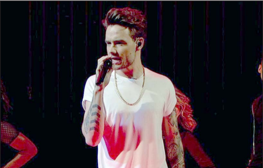
El cantante perdió la vida el 16 de octubre, al caer de un balcón de un hotel.