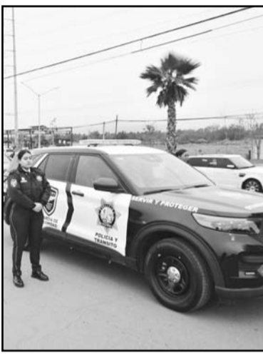
Serán 42 nuevas unidades.

En aras de brindar una mejor seguridad al agente de Apodaca, esta semana el Alcalde César Garza Arredondo se dio a la tarea de reforzar el área con más u mejores patrullas de alta calidad. Así es que al asignar más patrullas nuevas a la Secretaría de Seguridad Pública y Vialidad, con lo que se llega a 42 unidades nuevas entregadas en los primeros meses de su mandato, el alcalde de Apodaca César Garza Arredondo destacó que la seguridad del municipio es una de sus principales prioridades.