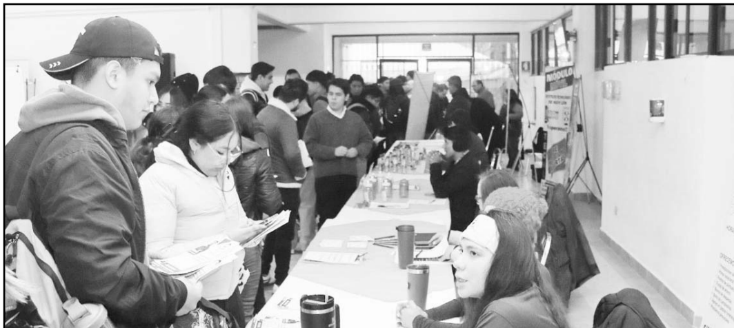
La idea es garantizar oportunidades laborales para todas las personas.