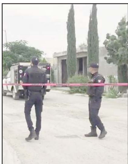
Estaba envuelto en una lona.