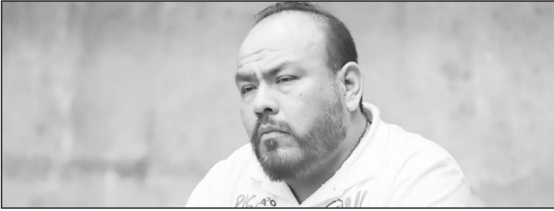
El dirigente del comité estatal del PAN dejó en claro que seguirán siendo oposición.