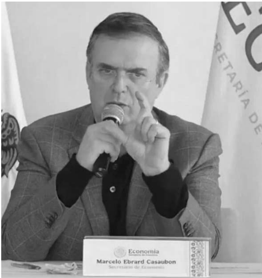
Ebrard, con su equipo, informó que sostuvo una reunión con "Howard Lutnick, secretario de Comercio de los Estados Unidos, así como Jamieson Greer, de USTR, y el Consejo Económico del presidente, Kevin Hassett".

El gobierno de Donald Trump dio un plazo de un mes a México, el cual se cumple el próximo 4 de marzo, para trabajar en materia de migración ilegal