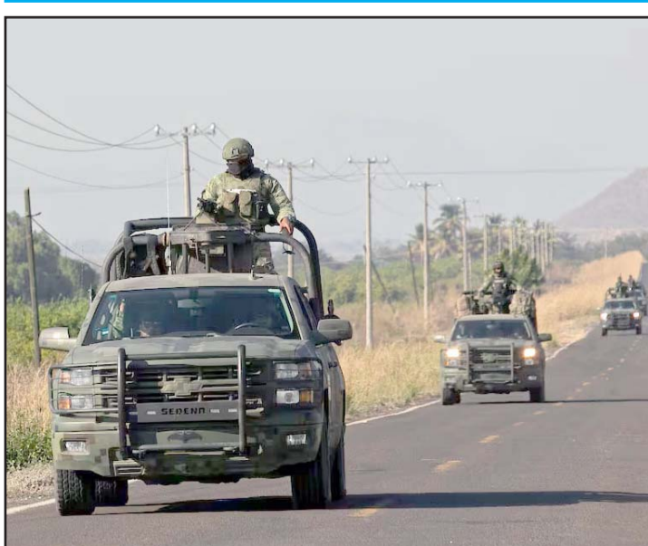
Desmantelaron 20 narcolaboratorios en Sinaloa.