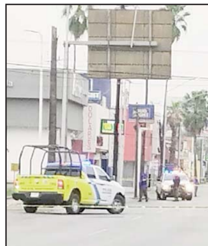
Colonia Vista Hermosa.

El acusado es investigado con relación a su implicación en delitos de alto impacto cometidos en esta zona.