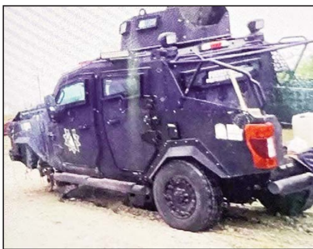
Los hechos ocurrieron en el municipio de Doctor Coss.

Los agentes estatales fueron llevados a un hospital