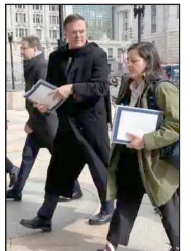
El diálogo fue sobre comercio.

El comercio entre México y Estados Unidos superó los 800 mil millones de dólares el año pasado, y las recientes amenazas de Trump incluyen la imposición de un 25% de aranceles a todas las importaciones mexicanas y canadienses, medida que ha sido suspendida hasta el 4 de marzo. Sin embargo, los nuevos aranceles al acero y al aluminio, que alcanzarán el 50% para México y Canadá, entrarán en vigor el 12 de marzo.