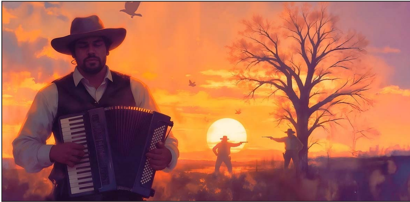
Los corridos y la música norteña se volvieron populares después de los años 40, tras la migración en Nuevo León.