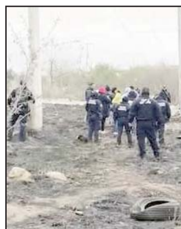
Municipio de Escobedo.

Mencionaron que el predio se ubica en los límites del municipio de Escobedo y El Carmen, Nuevo León.