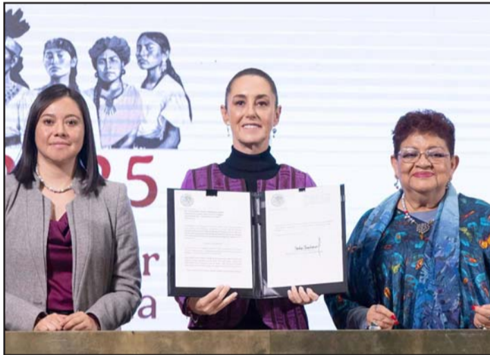
Claudia Sheinbaum envió una iniciativa.

La modificación al artículo 40 constitucional ahora mencionará que no se aceptará intervenciones, intromisiones o cual-