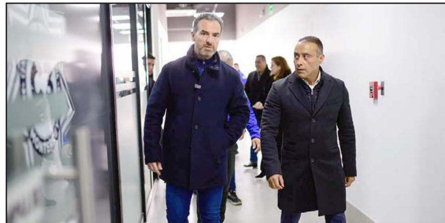
El alcalde regiomontano le mostró lo que se hace para fortalecer la Policía de Monterrey

El delegado está a cargo del operativo “Enjambre” en Nuevo León, que busca desmantelar redes de protección criminal desde las corporaciones municipales de seguridad pública.