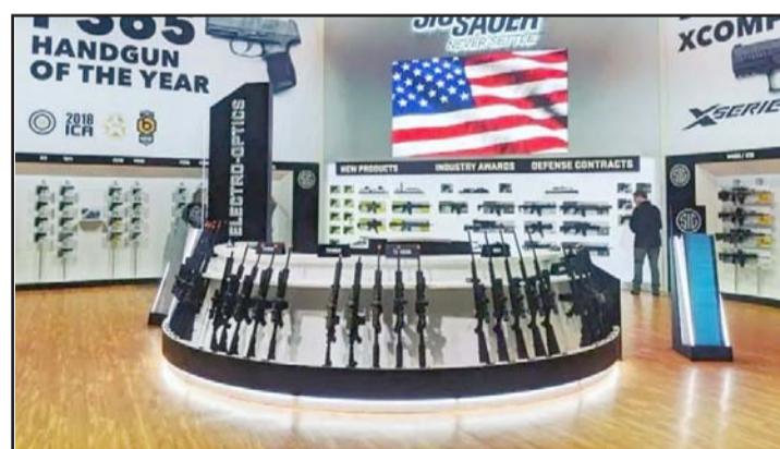
Las armadoras de Estados Unidos surten a los cárteles.

"Entonces va a haber además una ampliación de esta demanda por complicidad de aquellos que vendan armas que son introducidas en nuestro país",