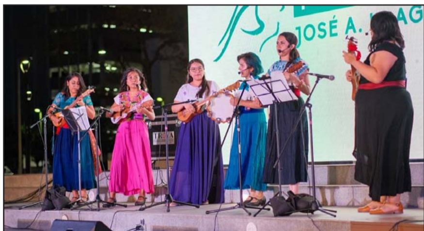
Hacen iniciativa para desarrollar actividades de fomento a la lectura.