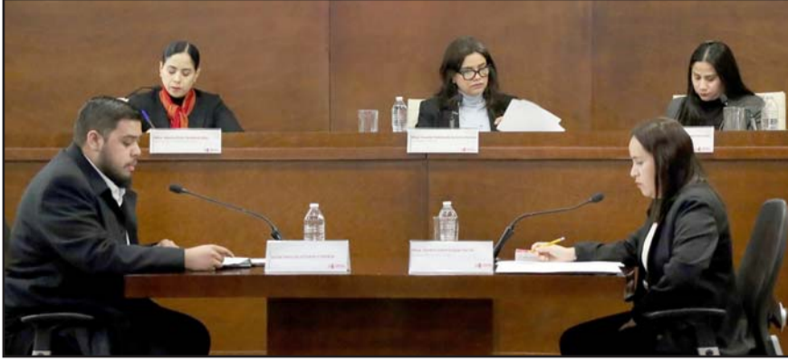
Ayer una vez más el Tribunal Electoral del Estado emitió una sanción.