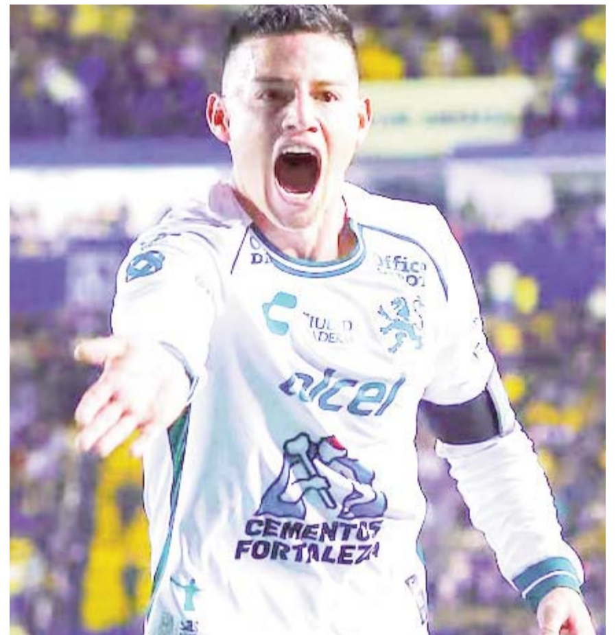
Todo México está a la expectativa del duelo.

A ese duelo llegará la "Fiera" del León con 20 unidades para estar en la cima, mientras que Tigres arribará al mismo con 16 unidades y aspirando al subliderato.