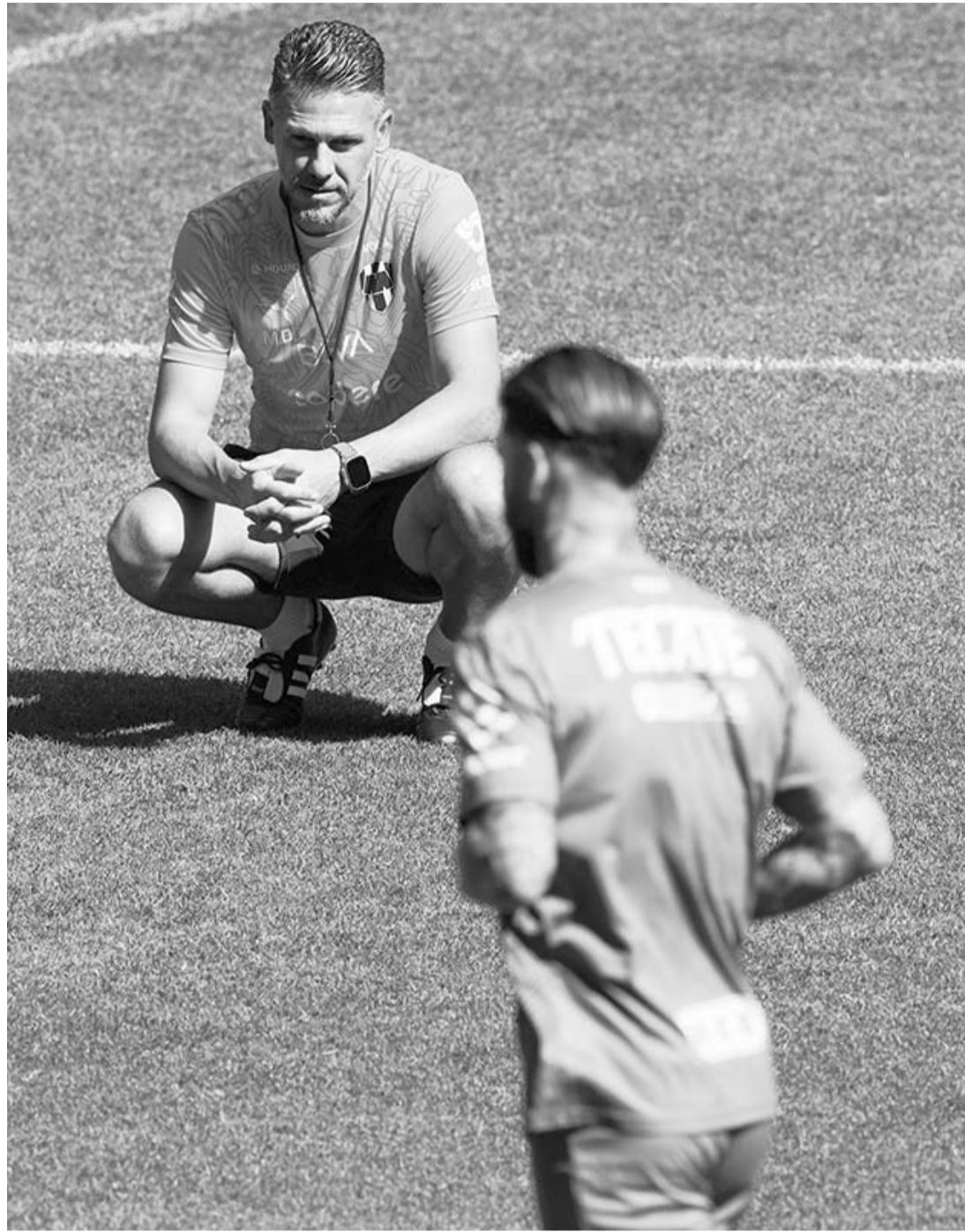
El técnico Martín Demichelis observa al español en la práctica.

Ahora el objetivo de Ramos será poner en práctica lo antes mencionado durante ya mañana, todo esto si el técnico Martín Demichelis decide debutarlo en el cruce ante los potosinos. (AC)