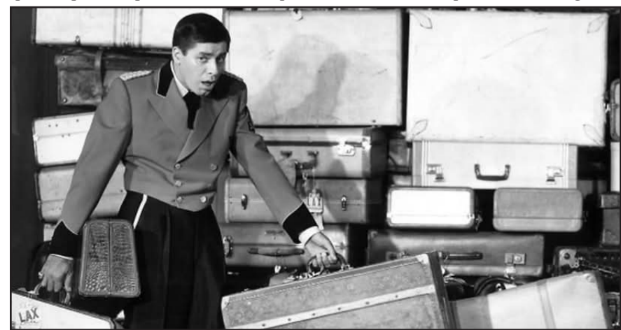
El ciclo se llevará a cabo del 1 al 29 de marzo.

Jerry Lewis falleció el 20 de agosto de 2017 en su casa de Las Vegas (Nevada) a los 91 años de edad por causas naturales, y rodeado de su familia.