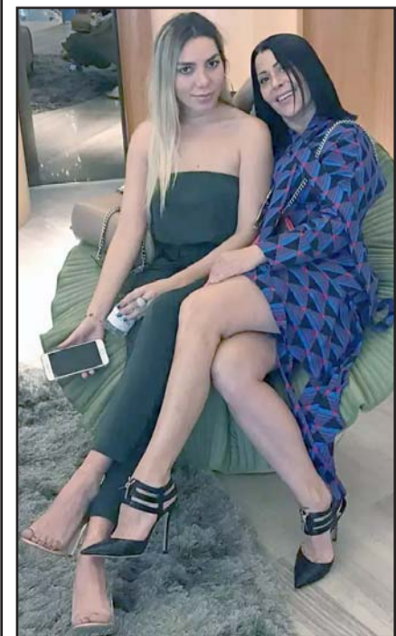
La relación entre ambas no ha sido la mejor.

Alejandra Guzmán y Frida Sofía estuvieron separadas por cuatro años, sin hablarse y sin convivir, hasta hace unos días.