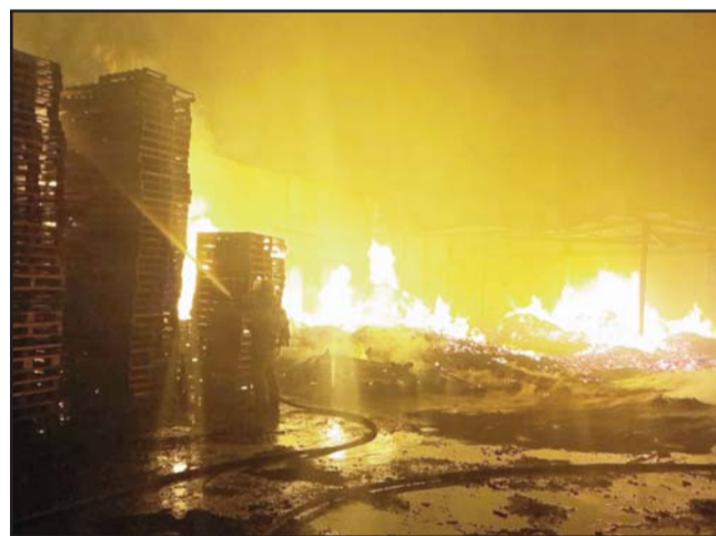
Ocurrió en la madrugada en Santa Rosa, Apodaca.

En otro asunto, la volcadura de un tráiler movilizó ayer a las autoridades en la Carretera Nacional, munici-