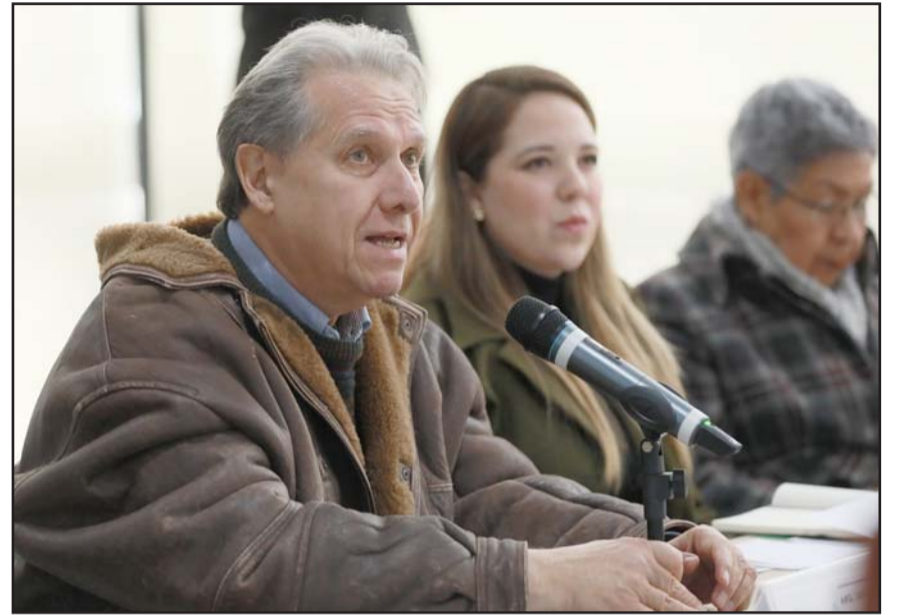
El funcionario estatal mencionó que 275 millones de pesos son para alimentar con agua suficiente la zona norponiente de Monterrey. las reparaciones no se llevarán a cabo en horas pico.

Para evitar congestionamientos viales, el funcionario estatal aseveró que