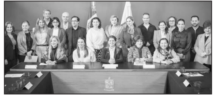
Habrà trabajos con universidades e iniciativa privada.

“Tenemos ya claridad de los focos para este 2025, por un lado con legislación, infraestructuras, trabajo colaborativo entre sectores, en conjunto con la Secretaría de Educación, la