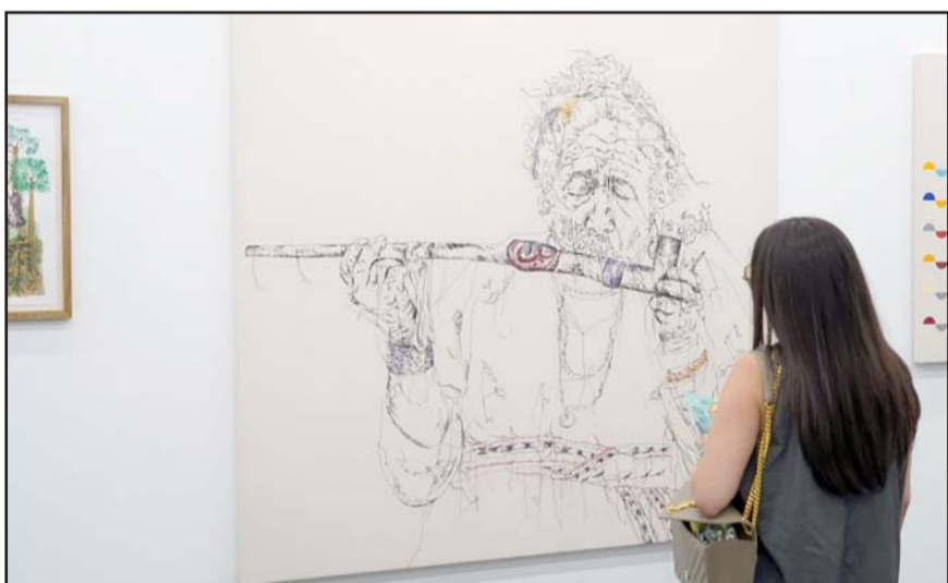
La UDEM estuvo representada en la Feria Material y en Zona MACO.