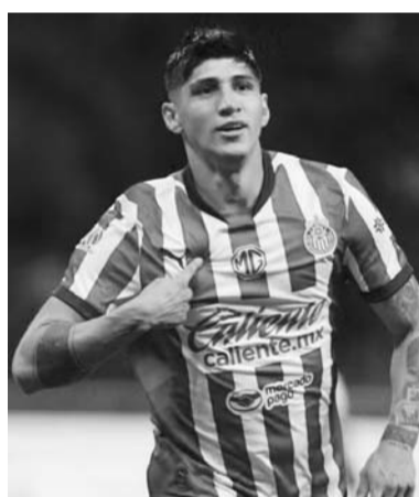
Pulido, a seguirse puliendo.

Primero, las Chivas necesitan clasificar. Si no lo logran, el fracaso será mayúsculo. Por tal motivo, el propio García es consciente de