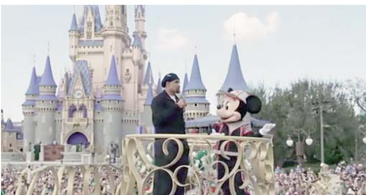
Jalen Hurts, con Micky Mouse.