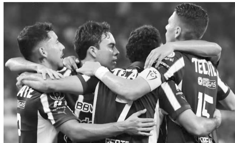
La Pandilla tiene todo para repuntar en este mes.