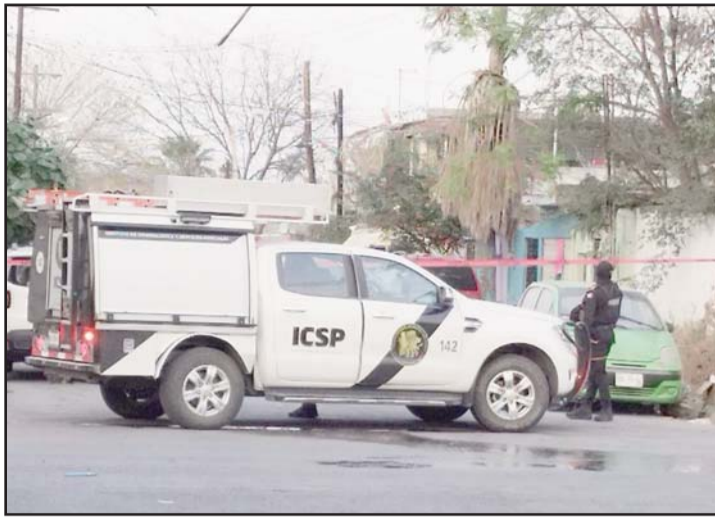
La víctima se encontraba en la vía pública.

Una fuente mencionó que "La Toncha" estaba en las calles antes mencionadas, cuando fue agredido a balazos.