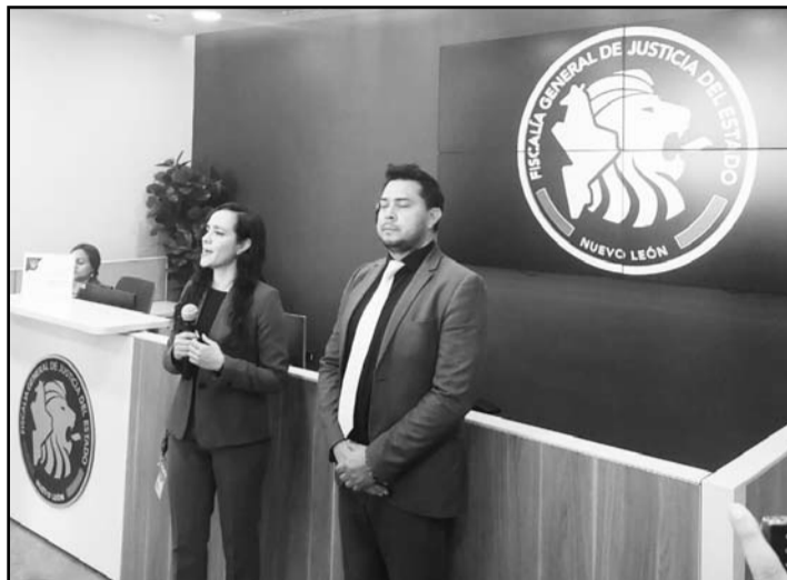
En el 70 por ciento de los casos se ha encontrado a la mujer

“En lo que va del año tenemos en la fiscalía unos 100 reportes de mujeres con no localización, de los cuales aproximadamente el 70% han sido localizadas con éxito en las primeras 72 horas y los demás se encuentran bajo investigación”, manifestó el fiscal de personas desaparecidas. (AME).