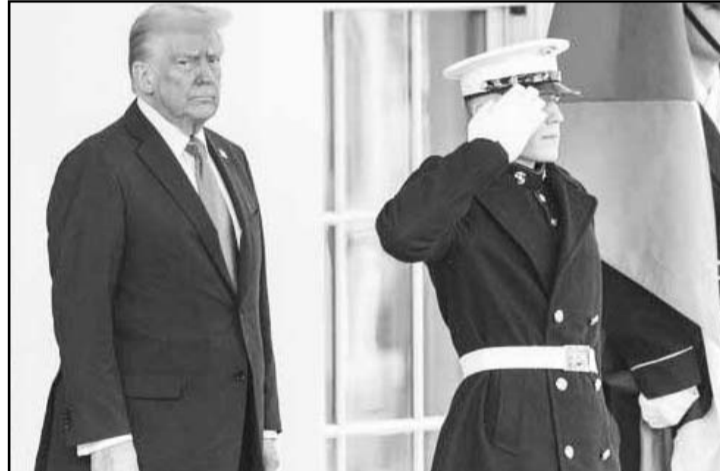
Trump eleva el tono y plantea reubicar a palestinos en una "parcela" en Jordania o Egipto

El mandatario estadounidense detalló su plan para transformar Gaza en un "desarrollo económico a una escala