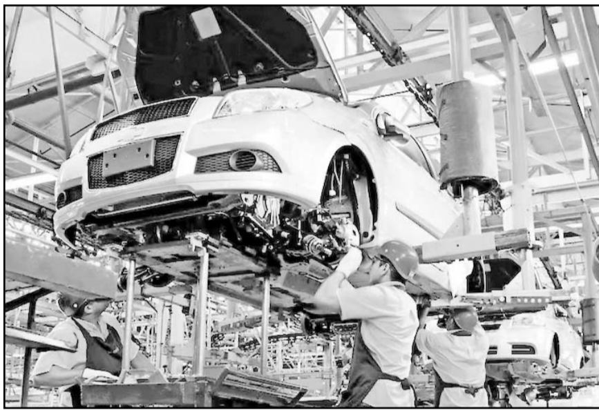
El sector automotriz sostuvo reuniones con el gobierno mexicano junto con EU y Canadá para analizar impactos en cadenas de suministro.

Esa situación pondrá "en riesgo empleos e inversiones clave en nuestro país", además de que afectará a toda la cadena metalmeccánica de Norteamérica y pondrá en riesgo la competitividad y la integración de esta región, cuando la prioridad debe ser frenar la amenaza del exceso de capacidad de acero chino y asiático, agregó.