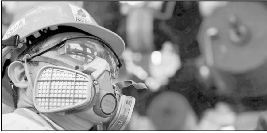
Versiónes indican que las refinerías estadounidenses están rechazando cargamentos de crudo mexicano.

MONTERREY, N.L. MIÉRCOLES 12 DE FEBRERO DE 2025