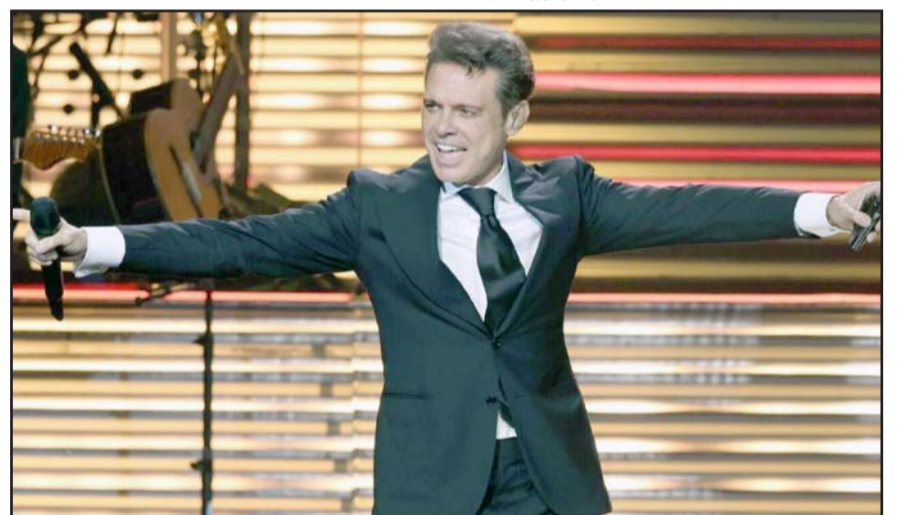
El cantante sigue demostrando que su música no tiene fecha de caducidad.

Con esto, Luis Miguel sigue demostrando que su música no tiene fecha de caducidad y es capaz de seguir conquistando los corazones del público a pesar del tiempo, lo que ya lo ha consolidado como una de las figuras más influyentes dentro de la industria musical.