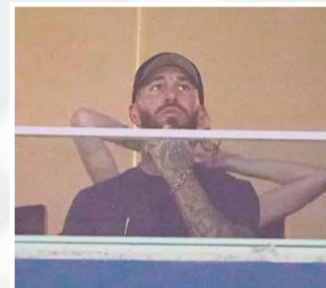
Ramos estuvo en un palco.

Conocen regios calendario de Leagues Cup / Página 2