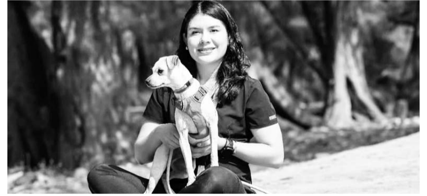
Será el próximo domingo 16 de febrero en el Parque Tolteca.

El registro para la "Caminata Perrona" será el mismo día del evento a partir de las 10:00 horas de la mañana.(IGB)