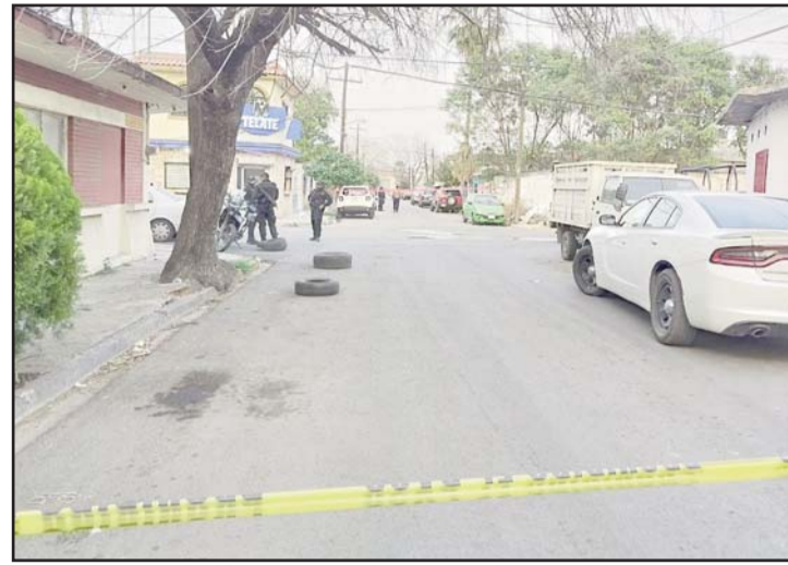
El agresor logró darse a la fuga.

cadáver estaba cerca de un arroyo, por lo cual lo agentes ministeriales y policías arribaron al lugar de los hechos.