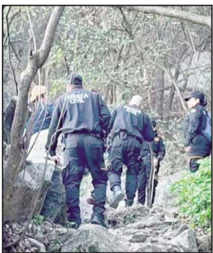
Buscan determinar cómo murió.

Horas después, su cuerpo fue llevado al anfiteatro del Hospital Universitario para realizar los estudios forenses necesarios al cuerpo.