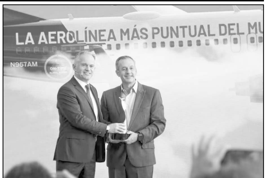
La aerolínea se deslistó de la Bolsa en 2022 tras la pandemia y su proceso de reestructura financiera.

Este resultado fue posible gracias a inversiones y mejoras en diversos pilares como grupos de trabajo enfocados a la orientación a resultados, protocolos de respuesta ante contingencias, eficiencias en flota, tripulaciones y atención de pasajeros. Así como uso de tecnología para optimizar operaciones.