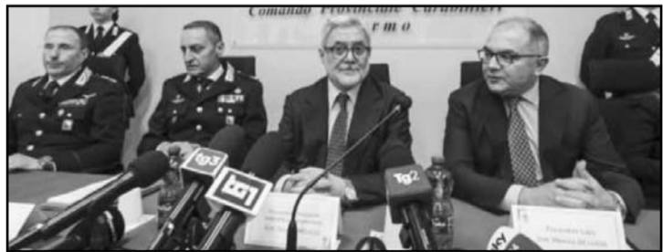
La Cosa Nostra no recibía un golpe igual desde hace más de 40 años.

Sin embargo, la propuesta de Trump ha sido recibida con fuerte rechazo en el mundo árabe, especialmente por la idea de desplazar a los palestinos fuera de su territorio natal.