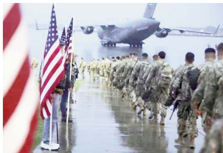
El general Ricardo Trevilla informó que solo se han identificado dos vuelos estadounidenses el 31 de enero y el 3 de febrero.

Para las labores de espionaje, la Fuerza Aérea de Estados Unidos uti-