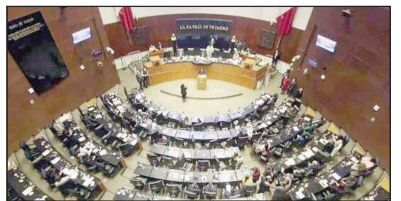
"Damos la bienvenida a la colaboración con EU como aliados estratégicos, conscientes del potencial de ese apoyo", aseguraron los legisladores.

Previamente, en sesión de la Comisión de Marina, su presidente Alejandro Moreno informó que los militares estadounidenses que ingresen a México portarán el armamento, municiones, material y equipos especiales necesarios para el entrenamiento de la unidad de operaciones especiales de la Secretaría de Marina, a fin de adiestrar al personal en la ejecución de tácticas, técnicas y procedimientos de combate convencional y no convencional en operaciones anfibas, en el ambiente marítimo, terrestre y aéreo.