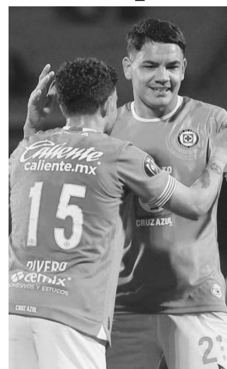
La Máquina pitó en la Concacaf.

Ahora, Cruz Azul tendrá que esperar un par de semanas para conocer a su próximo rival en los octavos de final. El ganador entre Seattle Sounders de la MLS y Antigua de Guatemala será el próximo desafío para los cementeros en esta Concacaf Champions Cup 2025.