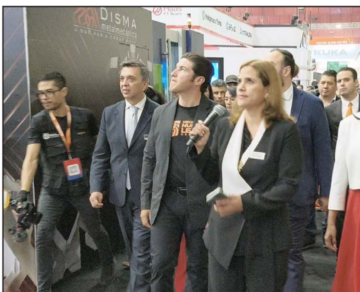
El mandatario estatal aprovechará la visita de la presidenta.