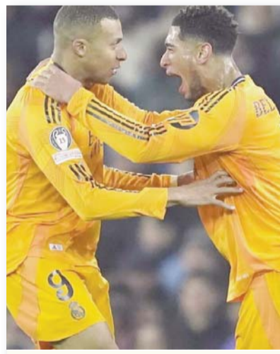
El Madrid fue letal al final.