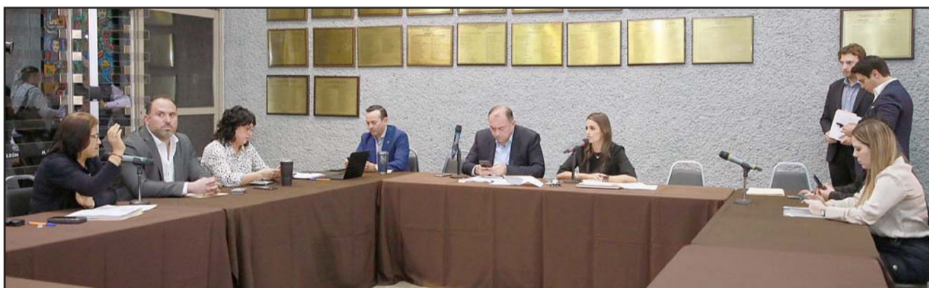
Se refieren a los que juicios en contra del gobernador, en cuya votación MC lo hizo en contra y Morena se abstuvo

“Esperemos pronto podamos tener la buena noticia y si es importante reconocer que los demás compañeros de las diferentes bancadas están en un buen ánimo para sacar el presupuesto, bueno es importante también reconocer que se están llegando estos acuerdos, lo cual yo celebro”, agregó.