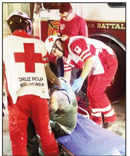
Colonia Jardines del Río.

Protección Civil y Bomberos de Pesquería informaron, que el accidente se reportó a las 7:00 horas de este martes en la Carretera Pesquería- Santa María La Floreña, frente al mencionado parque industrial.