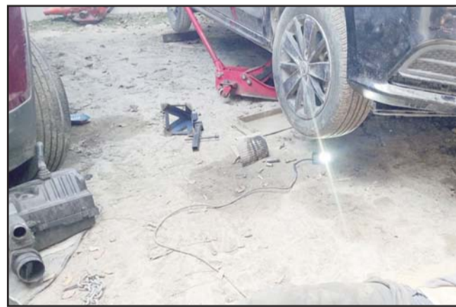
Ocurrió en el municipio de Guadalupe.

Elementos de la Policía municipal también arribaron al lugar del incendio para tomar conocimiento.