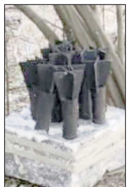
Los artefactos fueron descubiertos en una localidad de Tierra Caliente.

Aunque se habla de varios civiles más lesionados, no se ha confirmado todavía por parte de alguna dependencia de seguridad o de procuración de justicia.