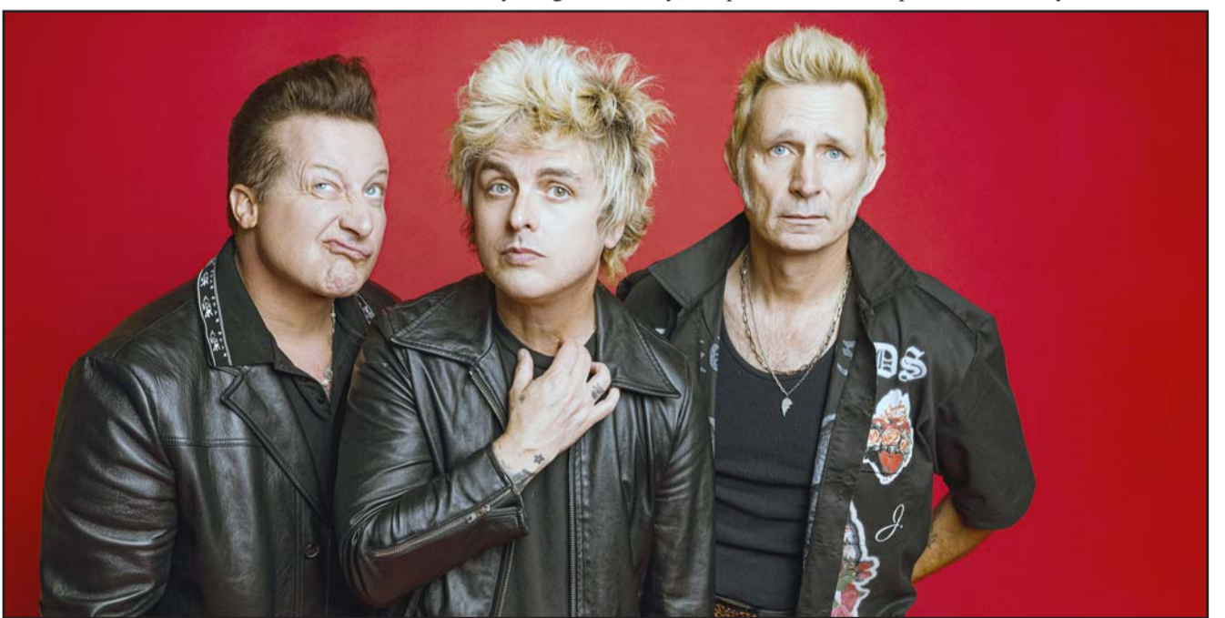
La película llamada "New Years Rev" será dirigida por Lee Kirk, conocido por su trabajo en "The Office".

Este nuevo proyecto llega en un momento clave para la banda, que además será una de las grandes atracciones del festival de Coachella este año, donde compartirán cartel con Lady Gaga y Post Malone. Sin duda, 2025 se perfila como un año lleno de sorpresas tanto en el cine como en los escenarios para Green Day.