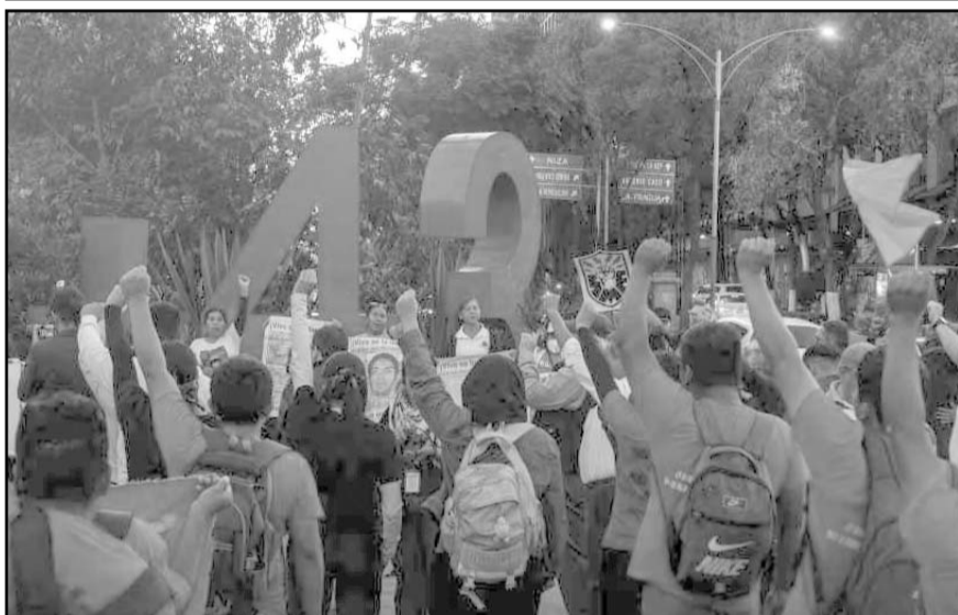
Sheinbaum explicó a los familiares que la extradición depende exclusivamente del gobierno de Israel.