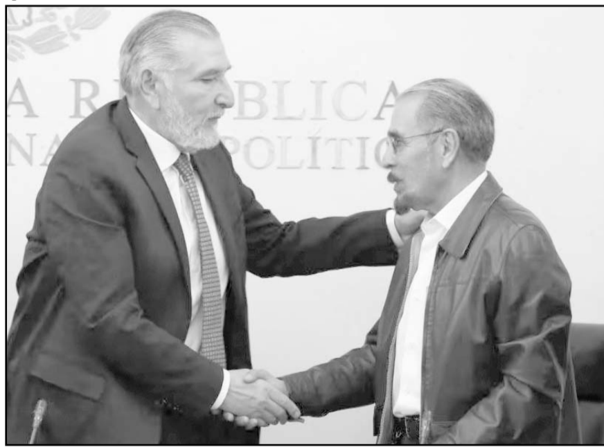
Dirigentes sindicales y empresariales se reunieron con Adán Augusto López para analizar la reforma al Infonavit.

Por parte del sector privado, asistieron los dirigentes de la Concamín, la Concanaco y la Coparmex.