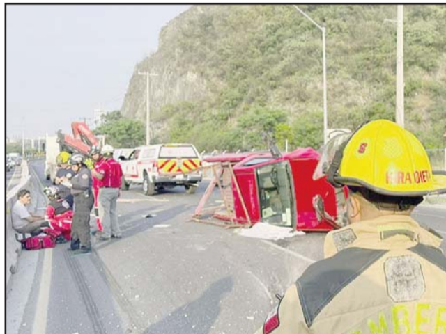
Avenida Morones Prieto, en San Pedro.

Mientras que el conductor fue identificado como