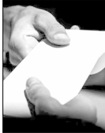
Señalaron que el 83% de los mexicanos consideran la corrupción un problema frecuente.

Durante el periodo de evaluación, distintos medios reportaron múltiples casos en los tres niveles de gobierno, evidenciando posibles nexos entre funcionarios y organizaciones criminales.