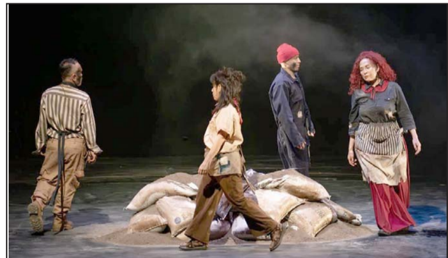
La obra está inspirada en la alegoría de la caverna de Platón.

El montaje muestra cómo el mito de la caverna sigue siendo una poderosa metáfora para entender fenómenos actuales. En un mundo saturado de información, liberarse de las "cadenas" requiere esfuerzo, pensamiento crítico y apertura al aprendizaje, es lo que deja de lección este trabajo escénico.