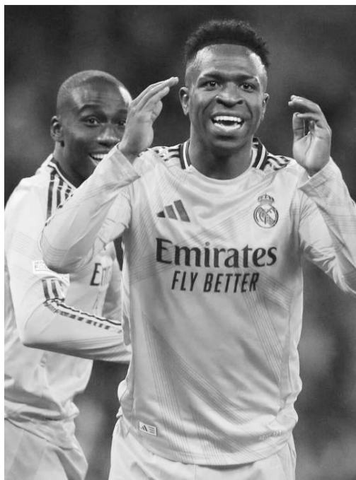
Vinicius, nuevamente ofendido.