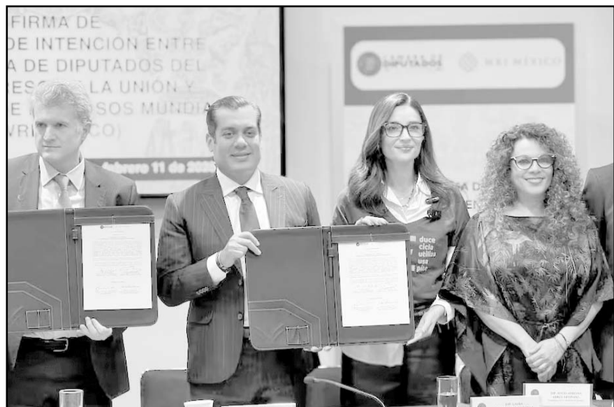
El Congreso también trabajará en un diagnóstico sobre el uso del agua y la eficiencia energética en sus instalaciones.