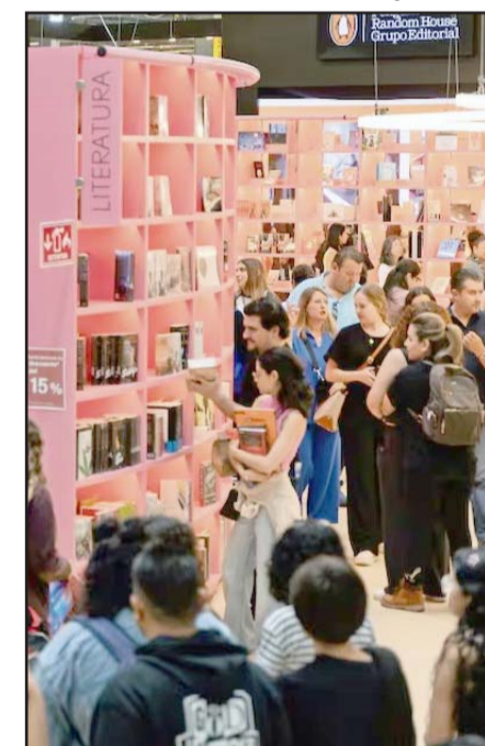
En 1987 se realizó la primera edición.