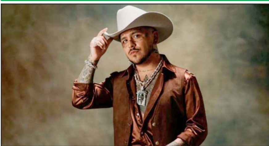
Se espera que presente canciones de su reciente disco "Pa'l Cora 2.0".