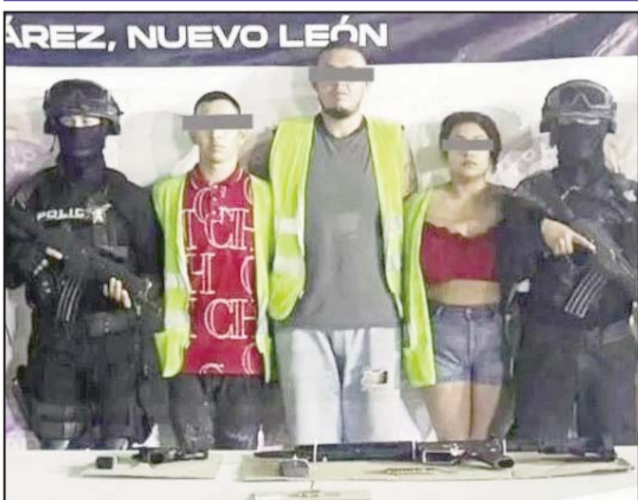
Los detuvieron en el municipio de Juárez.

Con algunos golpes leves resultó el conductor de un