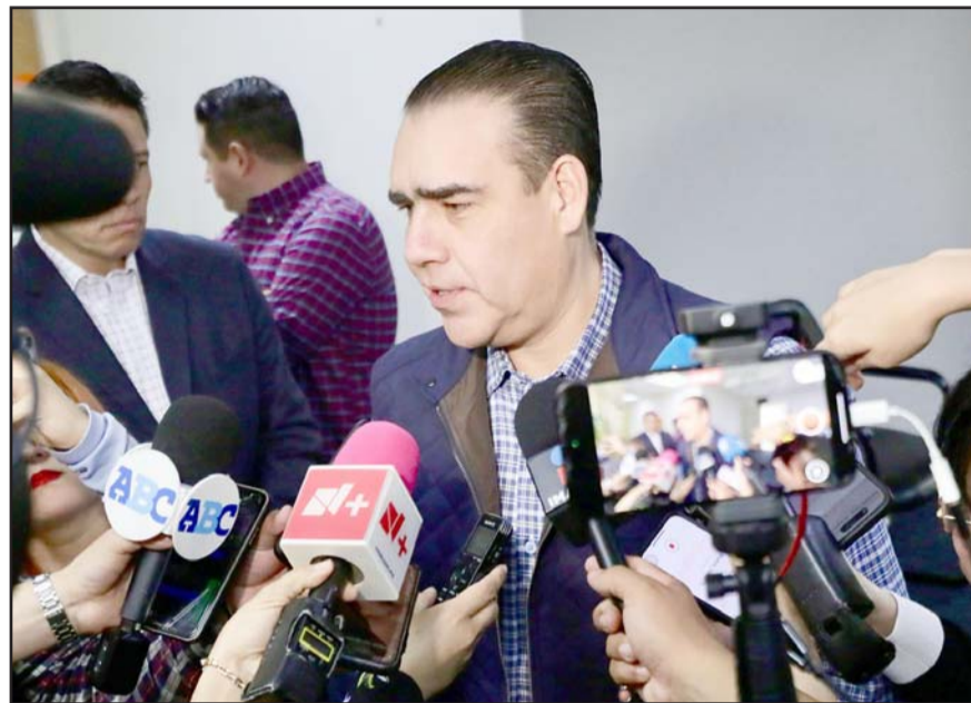
El coordinador de los diputados priistas dijo que tienen que reunirse