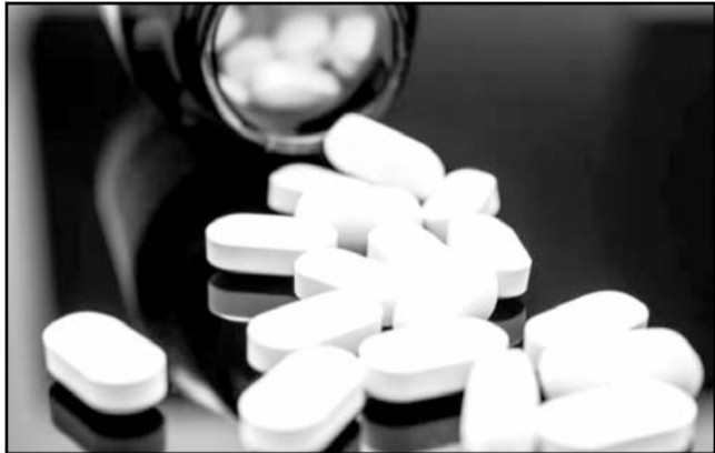
La Embajada de China en México negó que los precursores de fentanilo provengan de su país.