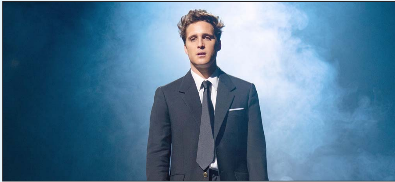
Camil se acogió a la Ley Olimpia, que protege a las personas de la difusión no consentida de contenido íntimo.