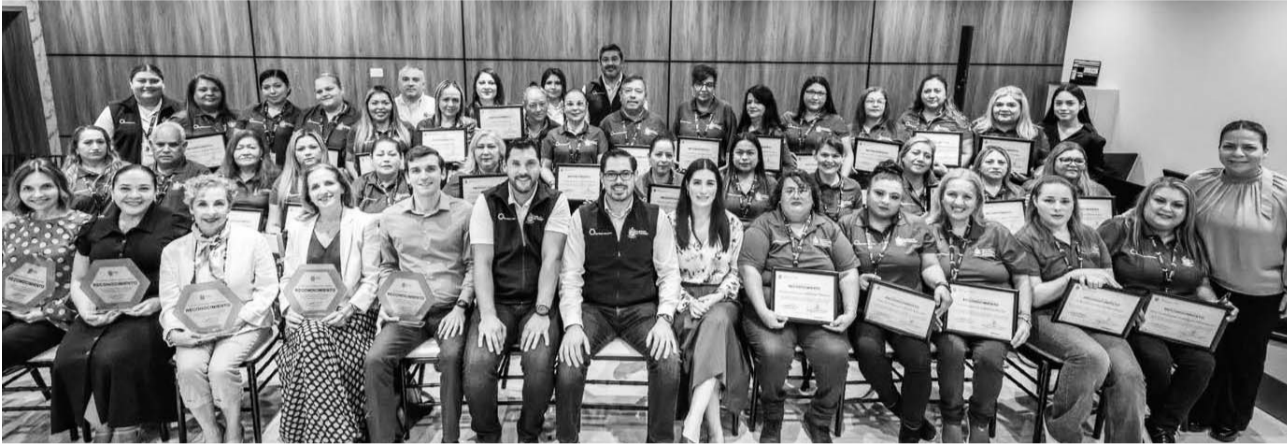
La finalidad es fortalecer las capacidades personales y generar un servicio más empático con la comunidad