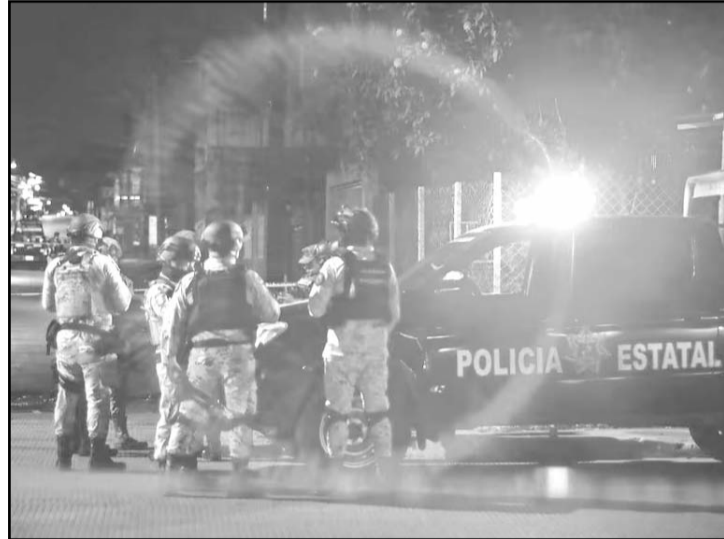
La incidencia de delitos de alto impacto ha caído un 39.5% desde 2018, aunque la extorsión aumentó un 21%.

La secretaria ejecutiva del Sistema Nacional de Seguridad