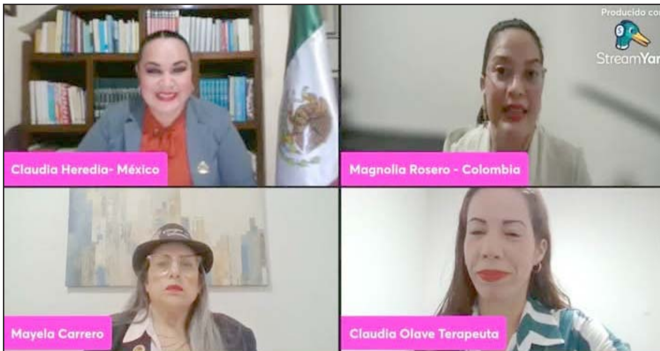
"EMPODERADAS" arrancó el 21 de enero, en forma de ruta rumbo al Día Internacional de la Mujer 2025.