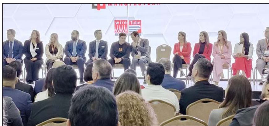
Esto de cara a una posible afectación por la política arancelaria de Trump