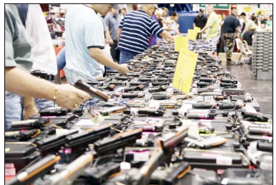
El tráfico de armas sigue latente desde la unión americana.

Añadió que el Gobierno de México seguirá fortaleciendo su estrategia integral en el combate al tráfico ilícito de armas, explorando todas las vías legales a su alcance en los planos nacional, regional y global, para reducir los flujos de estos productos que generan violencia en nuestro país.