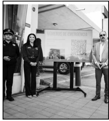
Buscan prevenir los acosos.