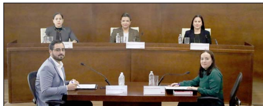
Las resoluciones en contra del mandatario estatal no paran.

Razón suficiente para que los magistrados consideraron que a el mandatario estatal no solamente impacto en el proceso electoral local, sino también en el federal.