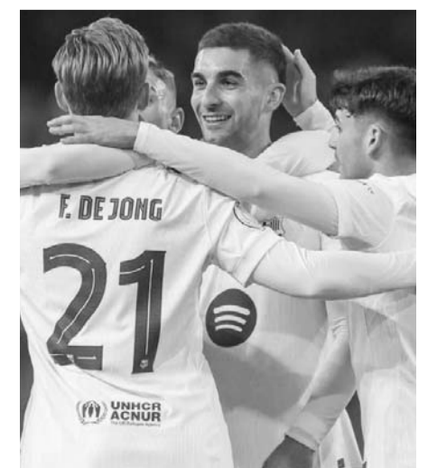
Barcelona goleó al Valencia.

Con goles de Cody Gakpo, Mohamed Salah, Dominik Szoboszlai y Virgil Van Dijk, lograron el pase a la final, en donde enfrentarán al Newcastle.