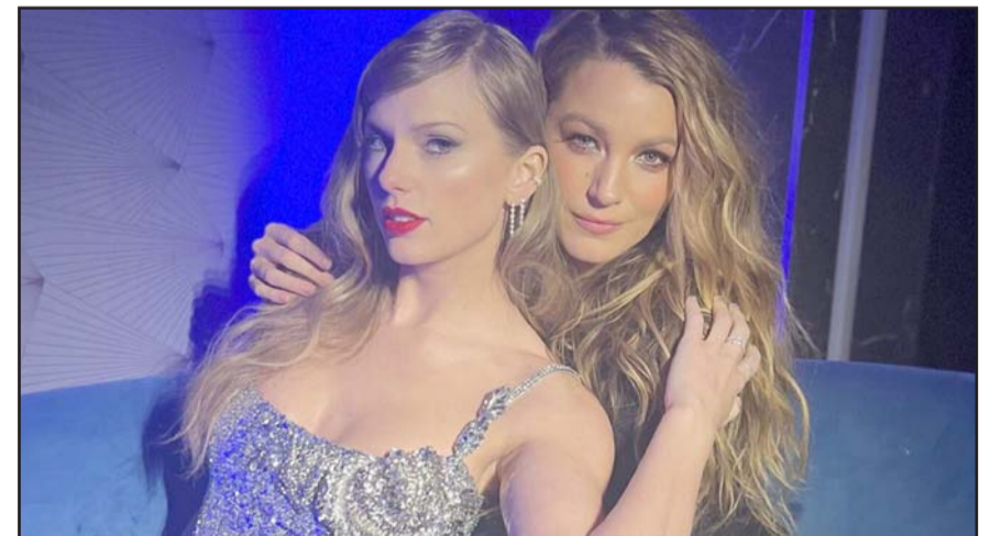
La posibilidad de que la cantante se vea obligada a declarar podría influir en las negociaciones, acelerando un posible acuerdo.

La amenaza de una declaración de Swift, junto con la demanda por difamación, podrían estar presionando a las partes involucradas a llegar a un acuerdo rápidamente. Mientras tanto, los seguidores de este conflicto legal aguardan atentos a su resolución.