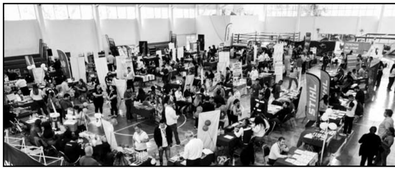
La Feria del Empleo fue en la Unidad Deportiva Osvaldo Batocletti.