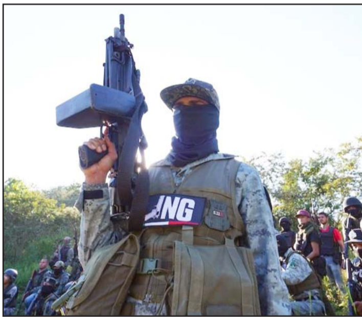
Buscan nuevas estrategias para la lucha contra el narco.

En cuanto a la situación penal de los criminales, las autoridades se enfocarán en los altos mandos de los cárteles y las organizaciones criminales; es decir, los integrantes de menor rango ya no serán prioridad y, en caso de ser detenidos, serán deportados si no cuentan con permanencia legal en territorio