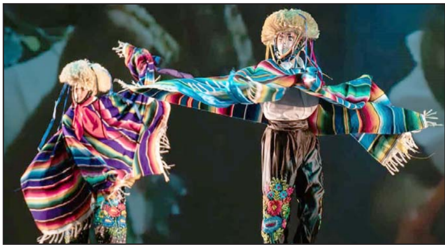
Es ofrecido por la Compañía Folklórica Citlali en el Teatro de la Ciudad.