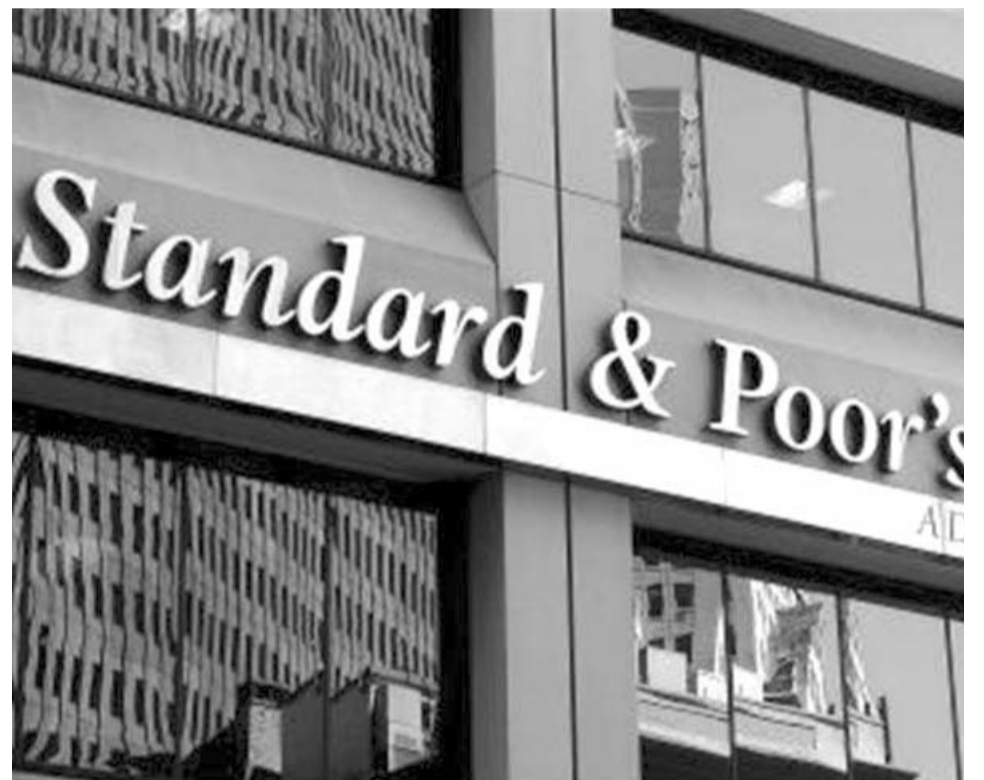
Un arancel de 25 por ciento a los productos que entren de México a Estados Unidos representa un desafío importante para la calidad crediticia de las empresas, advirtió la calificadora Standard and Poor's.

económicos podrían incluir una contracción económica, que afectaría el consumo, un tipo de cambio peso-dólar más débil y mayor inflación.