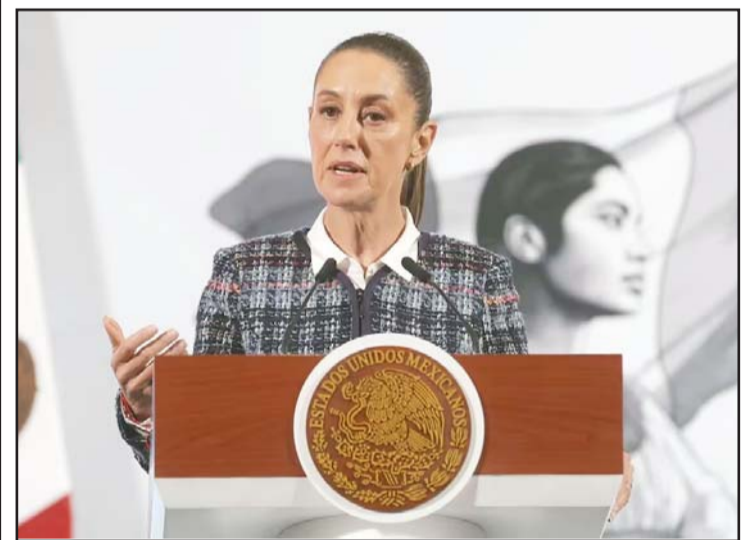
Claudia Sheinbaum quiere la colaboración con EU.

Estos son los cárteles y organizaciones criminales transnacionales contemplados: Cártel de Sinaloa (México), Cártel Jalisco Nueva Generación (México), Banda del Tren de Aragua (Venezuela) y Mara Salvatrucha (El Salvador).