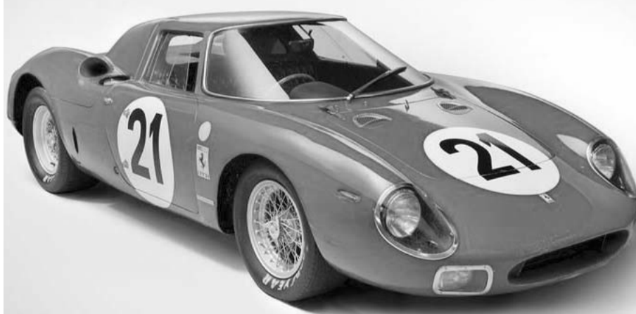
El vehículo se vendió en una subasta de París.