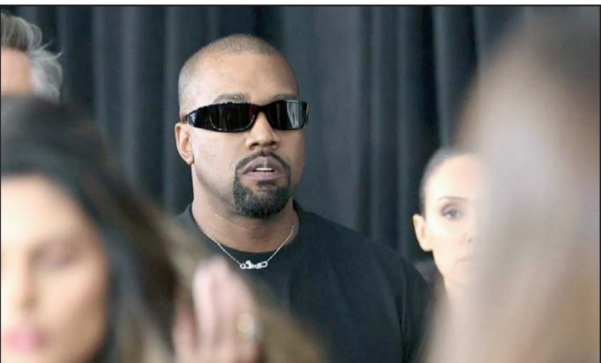
Confesó que su comportamiento errático ha sido un desafío.