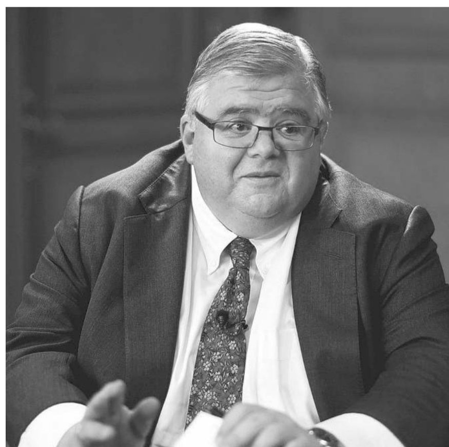
Carstens afirmó que los aranceles son negativos al crecimiento económico, empleo e inflación.

Así lo dijo al dictar la conferencia magistral Lecciones aprendidas y desafíos futuros para los bancos centrales de las Américas en la Conferencia Chapultepec, organizada por la oficina de representación del BIS