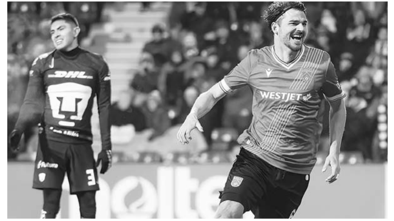
La escuadra unamita no estuvo a la altura.

Con este post el Real Madrid alabó la decisión de Sergio Ramos de portar el 93