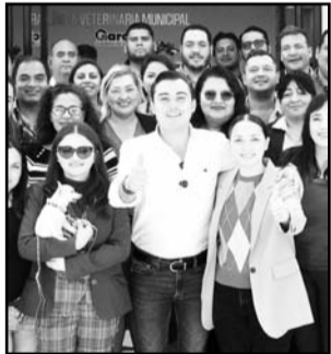
El alcalde cortó el listón

La nueva clínica se ubica en Camino a Icamole S/N, esquina con Camino al Panteón en la colonia Popular, kilómetro 5.0. (IGB)