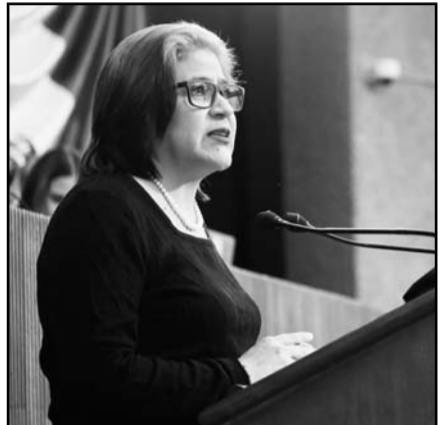
Diputada Sandra Pámanes

este tipo de conducta al interior del Congreso del Estado", expuso Pámanes, "tenemos una gran responsabilidad frente a la ciudadanía y es ahí donde buscamos un mecanismo interno que nos ayude a frenar este rezago legislativo.