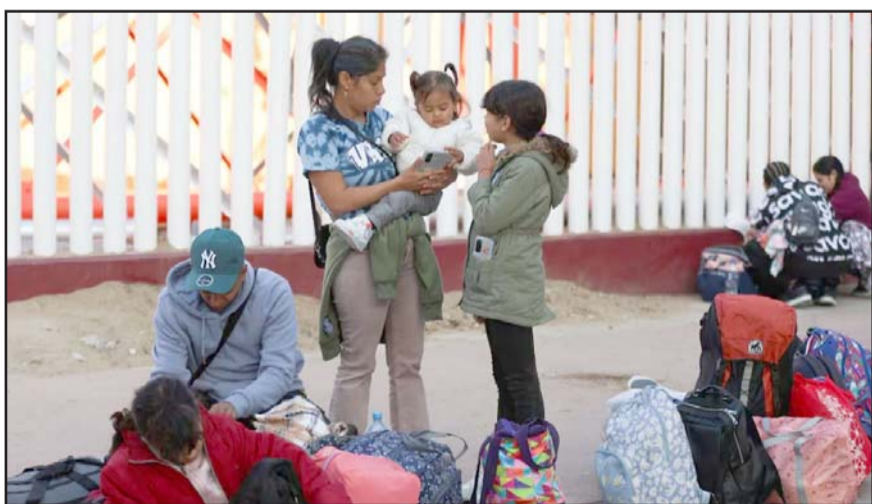
Visitaron un centro de atención instalado en Reynosa.