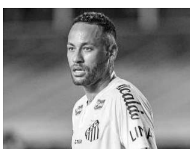
Neymar Junior, en la temporada 2013-2014.

Cabe destacar que Neymar volvió al fútbol brasileño luego de poco más de 12 años de espera desde que se marchó al Barcelona