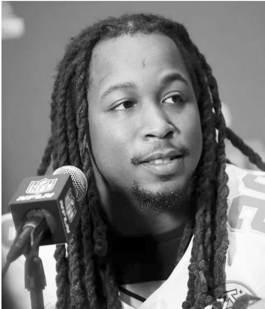
Kareem Hunt, de los Jefes de Kansas City.

Por último, Creed Humphrey, jugador de los Jefes, de igual forma habló ante la prensa y él hizo hincapié en la necesidad de solamente centrarse en el juego del