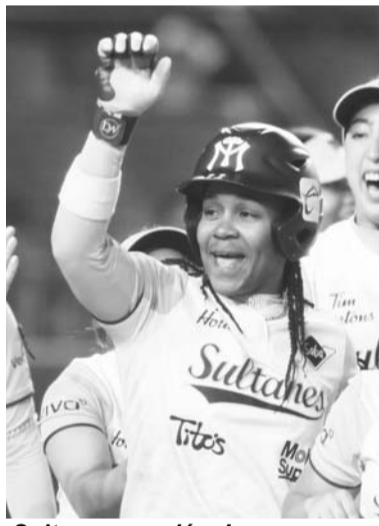
Sultanes venció a Laguna.

regia alcanzó un récord de tres triunfos por seis traspis en la campaña.