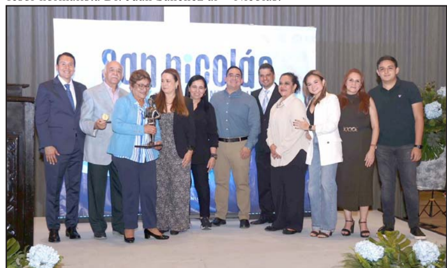
Reconocieron a comerciantes, empresarios, deportistas, docentes y una familia ejemplar.

Los eventos para celebrar el 428 Aniversario de San Nicolás continúan hasta el domingo, por lo que la administración municipal invita estar al pendiente de las redes sociales del Gobierno de San Nicolás.