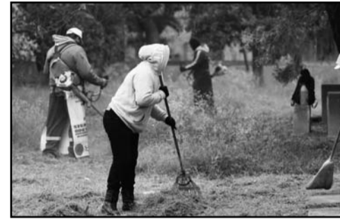
Se realizó en plazas públicas y camellones

“Tenemos que tener el Guadalupe limpio que merecemos, porque intervenimos con pintura la infraestructura urbana, adicional el barrido fino, cambiando así la imagen de las colonias. Los vecinos se van temprano a sus trabajos y cuando regresan por la tarde o noche ven su entorno más bonito”. (IGB)