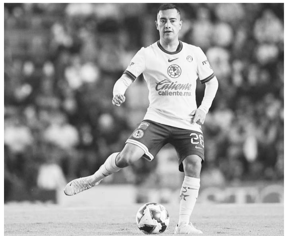
Las Águilas se enfrentan al Puebla.

Puebla necesita del triunfo para llegar a las ocho unidades y con ello aspirar al quinto lugar de la tabla de posiciones, dependiendo de la diferencia de goles a favor en su hipotética victoria.