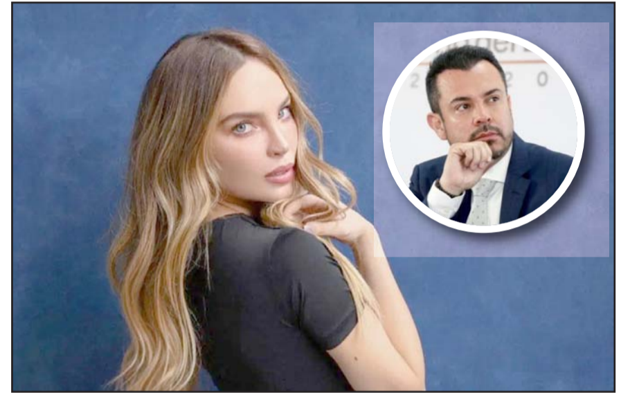
También se ha observado a la intérprete en eventos relacionados con la promoción turística y cultural de Puebla.