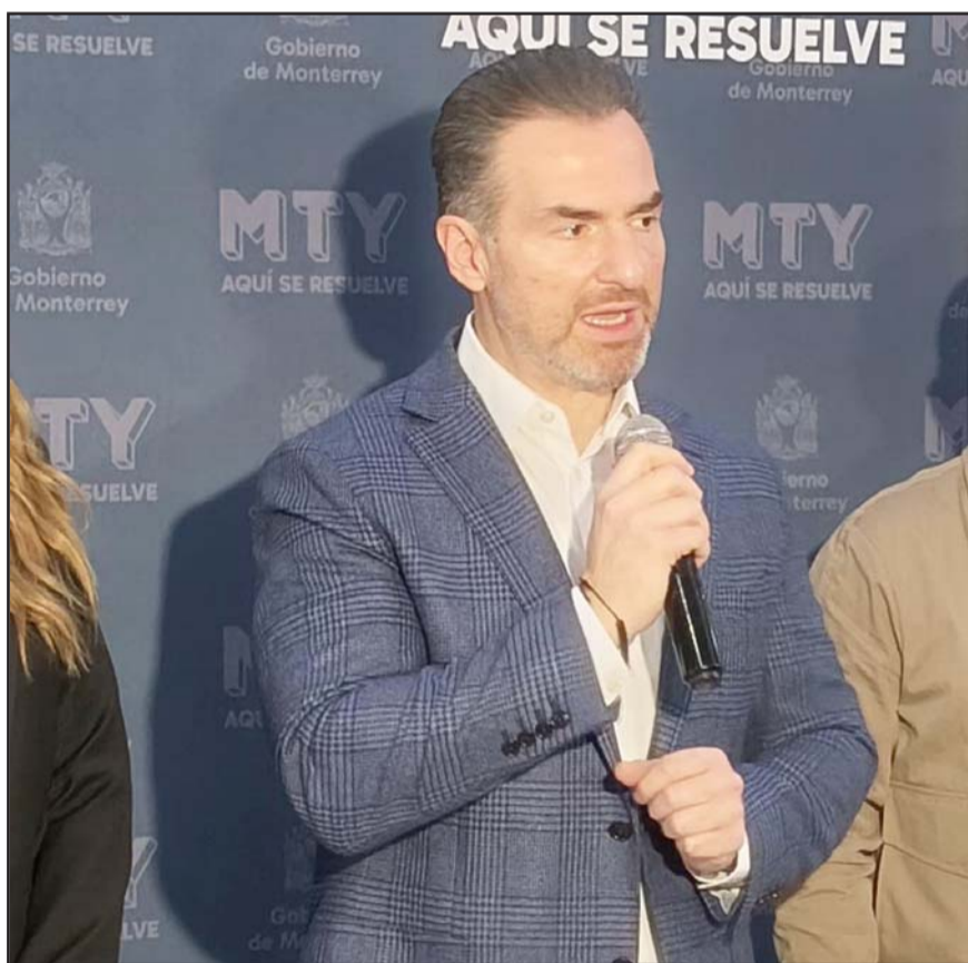
El alcalde regiomontano no quiere que se repita la historia del 2023