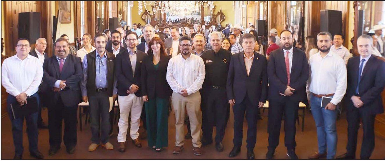
Lo dio a conocer tras la firma del Acuerdo Nacional por el derecho humano del Agua celebrada en Palacio de Gobierno.