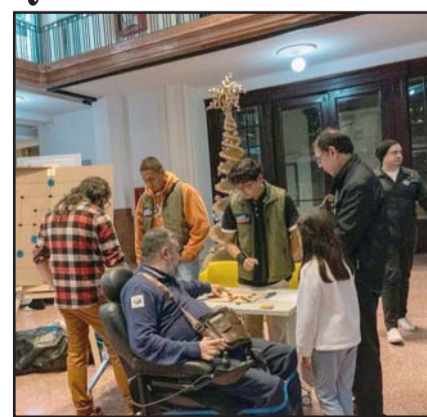
Buscan soluciones para la comunidad.

"Procuró siempre resaltar que el papel fundamental de LABNL al generar estos procesos se centra en ofrecer un espacio único para la invención ciudadana, proporcionando las herramientas y el apoyo nece-