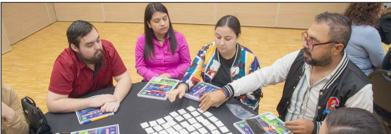
Participaron docentes de 4°, 5° y 6° grado de primaria de 367 escuelas en el taller "Docentes Prest Math".