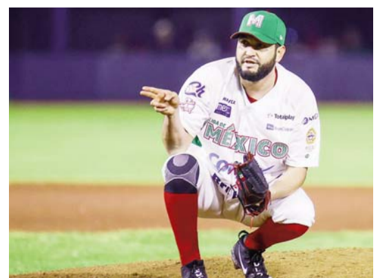
El encuentro será en Mexicali.

México aspira este día en los Charros a su décimo título en la Serie del Caribe y República Dominicana va por su vigésimo tercero con la oportunidad que tendrán esta noche con los Leones del Escogido, motivo por el cual se esperaría un gran encuentro entre ambos equipos, deseando que el título se quede en casa.