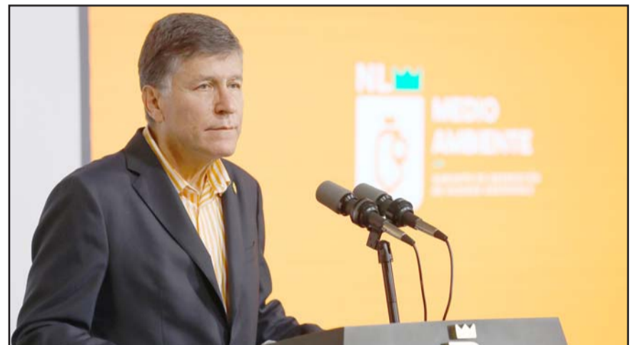
El secretario de Medio Ambiente, Alfonso Martínez hizo la advertencia a la empresa

En rueda de prensa Nuevo León Informa, el funcionario estatal destacó que suman 793 recorridos de calidad del aire; 333 visitas de inspección; 103 suspensiones; 61 atenciones a incendios y 9 suspensiones en La Huasteca.