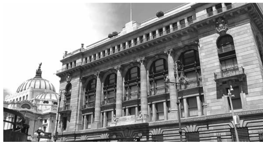
El ajuste a los tipos de interés fue avalado por mayoría, sólo el subgobernador Jonathan Heath, votó por una reducción de 25 puntos.

Así, tras la primera sesión del 2025, el órgano colegiado del banco central mexicano anunció que relajó más la política monetaria, lo que significa un "soplo de aire fresco" al costo del