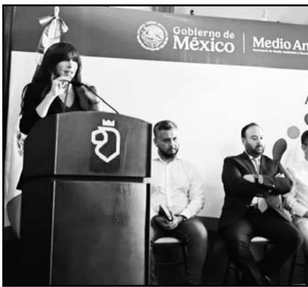
Para eso se tomó un acuerdo.

Por último, cabe mencionar que, dicho acuerdo también establece lineamientos cla-