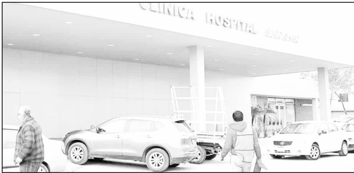
Se integraron a los servicios médicos los cónyuges y concubinos de las trabajadoras de la Educación

Una resolución de la Suprema Corte de Justicia permitió que cónyuges y concubinos de las Trabajadoras de la Educación pudieran ingresar al Sistema de Servicios Médicos de la Sección 50 del SNTE.