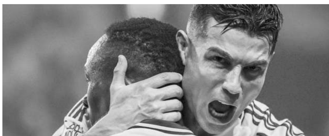
El portugués sigue con su cosecha impresionante de goles.