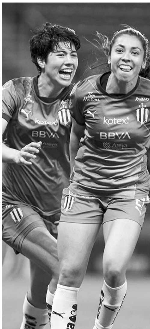
Monterrey sigue peleando arriba.

Tras esta situación, ahora las Rayadas volverán a la actividad hasta el próximo domingo cuando en la fecha seis de la temporada regular de la Liga MX Femenil y como locales enfrenten a las Xolas.