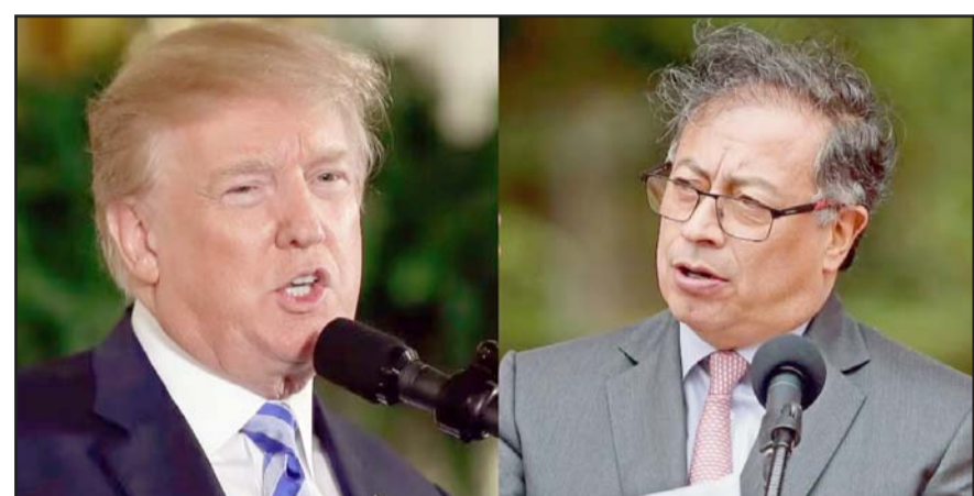
El presidente colombiano Gustavo Petro rechazó los vuelos militares, argumentando que los migrantes deben ser tratados con dignidad.

Los migrantes ya fueron informados por las autoridades migratorias y se han enterado por las noticias y lo que les dicen sus familiares, de que el gobierno de Donald Trump, cerró la aplicación CBP One, sin embargo, precisan que su deseo es llegar al territorio norteamericano.