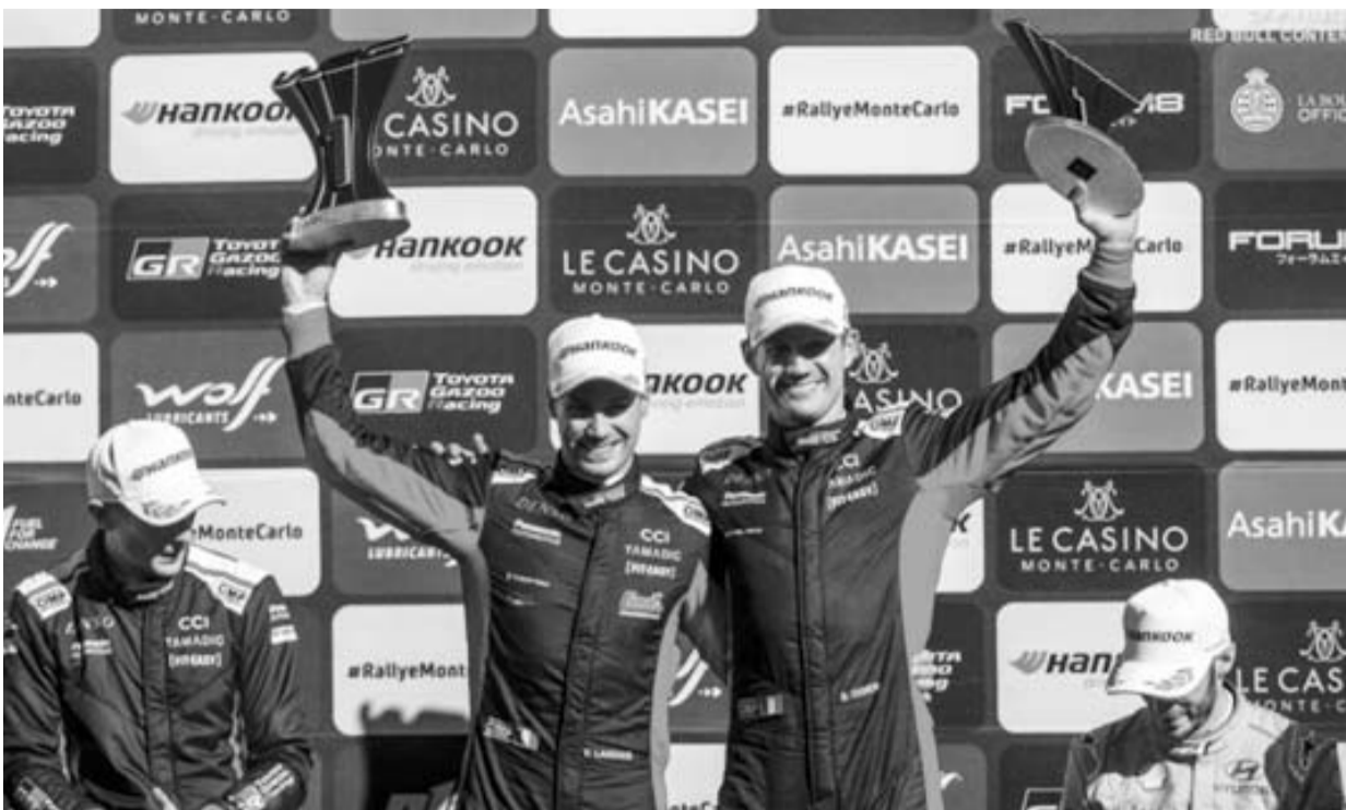
Sebastián Ogier sigue haciendo historia en esta competencia.

ataque final de Fourmaux por solo 7.5 segundos a pesar de un terrible roce con una pared de roca.