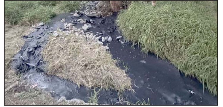
Habitantes de la colonia Riberas del Río ya pusieron la denuncia.

Está contaminado, con basura, descargas de aguas negras, mobiliario en malas condiciones,