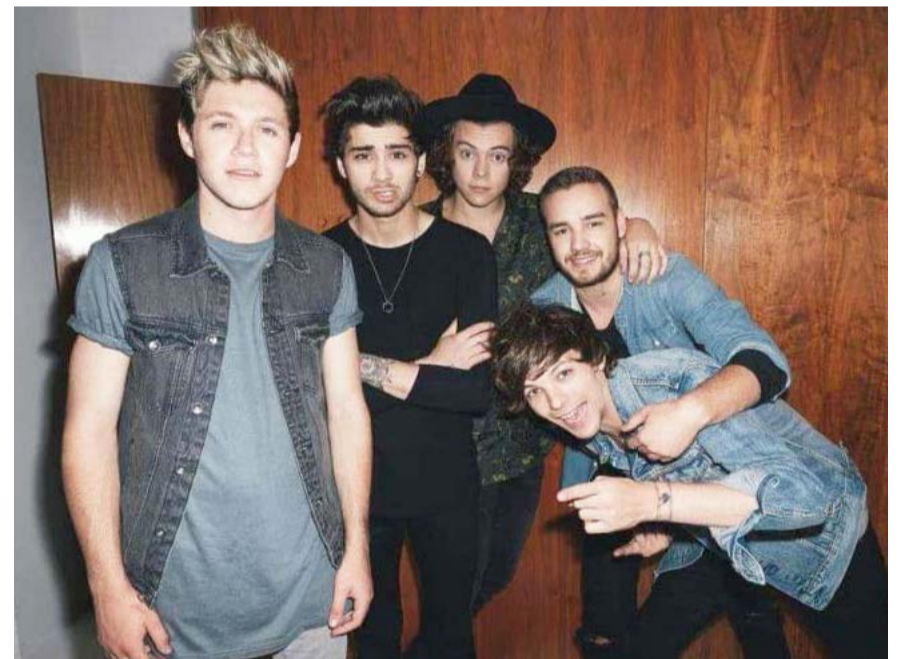
Se planea que otras figuras de la música también se unan al homenaje.