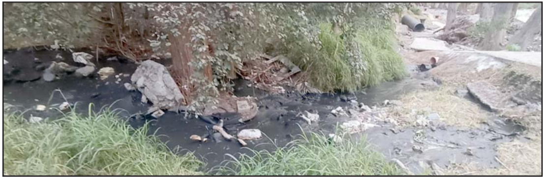
Está contaminado con basura, descargas de aguas negras, mobiliario en malas condiciones y sin iluminación