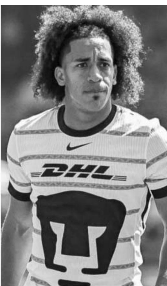
Pumas no pudo con el Atlas.