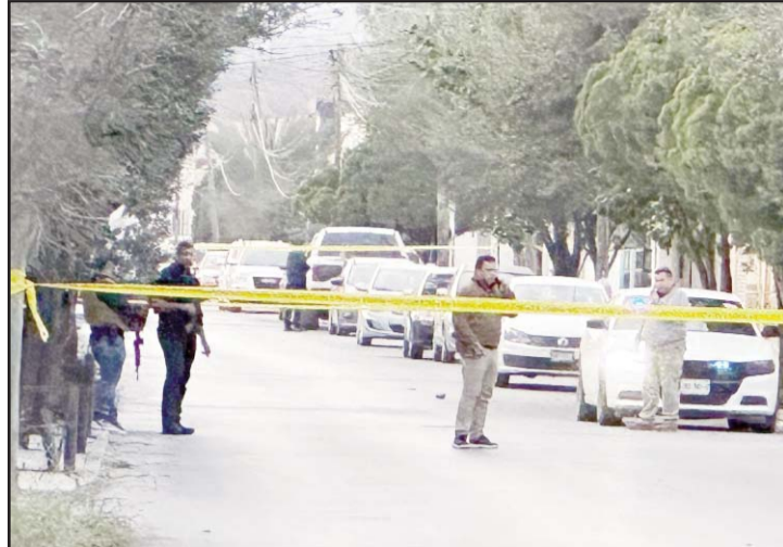
Los hechos se registraron en el municipio de García.

biertos por sus rivales, abrieron fuego contra ellos, hiriendo al agente ministerial que quedó gravemente herido.