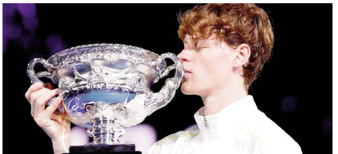
Sinner venció por parciales de 6-3, 7-6 y 6-3 al alemán.

momento a su rival. A su vez, este éxito en Melbourne significó el tercer título de Grand Slam para Sinner en su todavía corta carrera deportiva. Después de coronarse, Sinner habló en rueda de prensa y mencionó que su gran nivel tenístico se debió a lo que se enfocó al 100 por ciento en lo que tenía que hacer dentro de la cancha y no tanto respecto a las críticas que podía recibir en Australia luego de dar positivo a dopaje durante el año anterior.