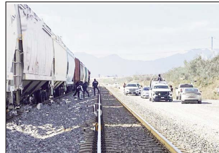
La víctima mortal no ha sido identificada.

Hasta el momento la víctima no ha sido identificada por las autoridades, siendo una joven de aproximadamente 25 años de edad, complexión delgada y cabello negro.