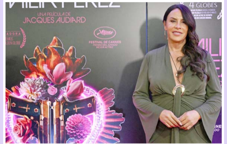
En la conferencia en el Festival de Cine de José Ignacio (JIIF).

"Es muy feo. Siempre igual, ¿no? Venimos de un odio tremendo simplemente por haber hecho una película, por ser diferente, aunque yo no me con-