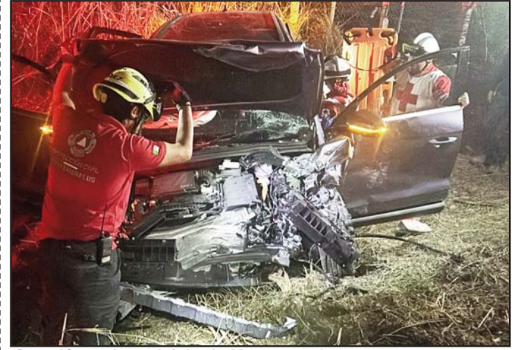
Ocurrió en el municipio de Montemorelos.

De acuerdo con una fuente, el agente ministerial que fue atacado a balazos estaría realizando las investigaciones de