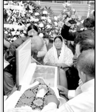
Explicaron que no se harán declaraciones públicas de la investigación.