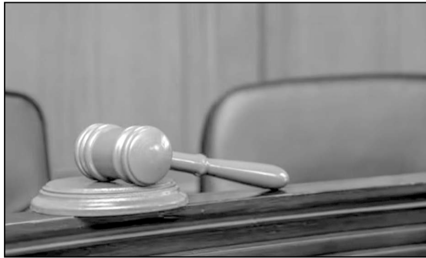
El proyecto del TEPJF también propone la inclusión de aspirantes cuyo comité de evaluación cometió errores en la valoración de requisitos.