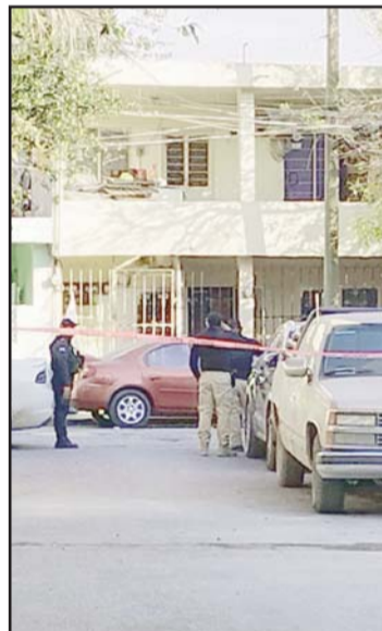
Recibió unos ocho disparos.

Peritos acudieron a la escena del crimen y recogieron más de ocho casquillos.