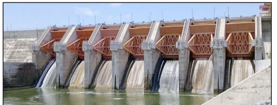
El nivel récord que tenían los embalses ya es historia, pues ya han bajado los niveles.

Sin embargo, en este mismo asunto declararon la inexistencia de promoción personalizada por parte del mandatario estatal, al considerar que no se ejerció propaganda gubernamental.