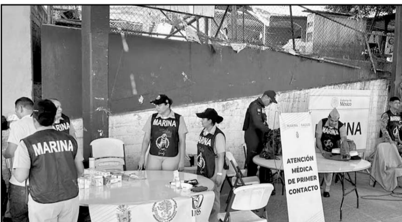
La dependencia federal detalló que el programa, activo desde el 20 de enero, ha ofrecido más de 5 mil pláticas de salud preventiva.

Este programa, en su primera fase, se encuentra activo desde el pasado 20 de enero, y se planea concluir el próximo 9 de febrero de este año, en el cual participa personal de Sanidad Naval, perteneciente a las diferentes unidades, en conjunto con personal de Sector Salud, a través de brigadas compuestas con personal de médicos y enfermeros.