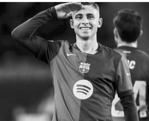
Barcelona sigue en tercero.

En actividad de la Serie A de Italia, Milán derrotó 3-2 al Parma, la Roma venció 2-1 al Udinese, Inter goleó 4-0 al Lecce y Fiorentina superó 2-1 a Lazio.