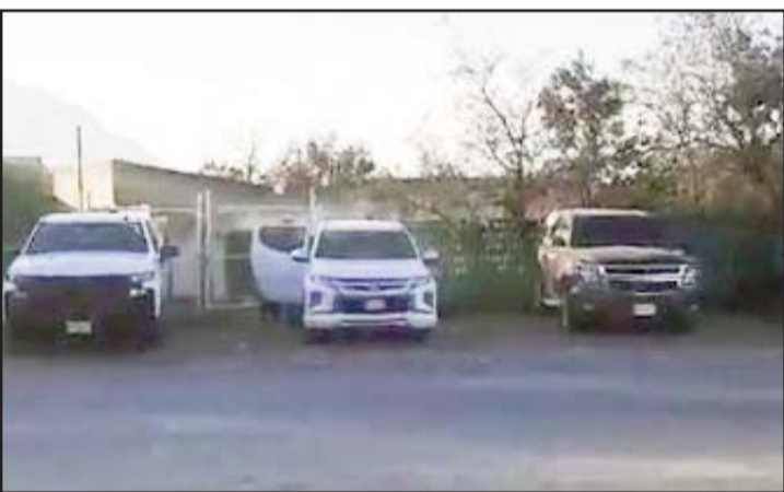
Se espera que pronto den los resultados del operativo.