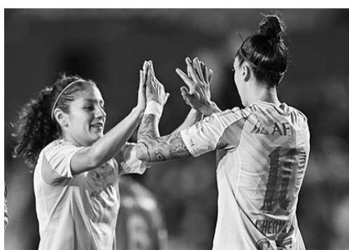
Las auriazules alcanzaron las siete unidades en las cinco jornadas que van del torneo.