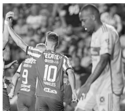
Su última derrota fue en un Clásico.