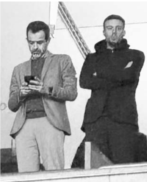
Anselmi se olvidó de la Máquina.