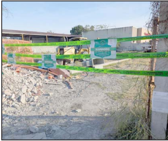
Varios establecimientos fueron cerrados al ser sorprendidos violando algunas normas ambientales