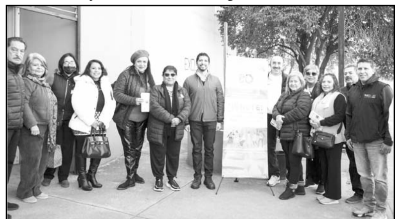
Estos procesos los lleva a cabo la Secretaría de Educación.