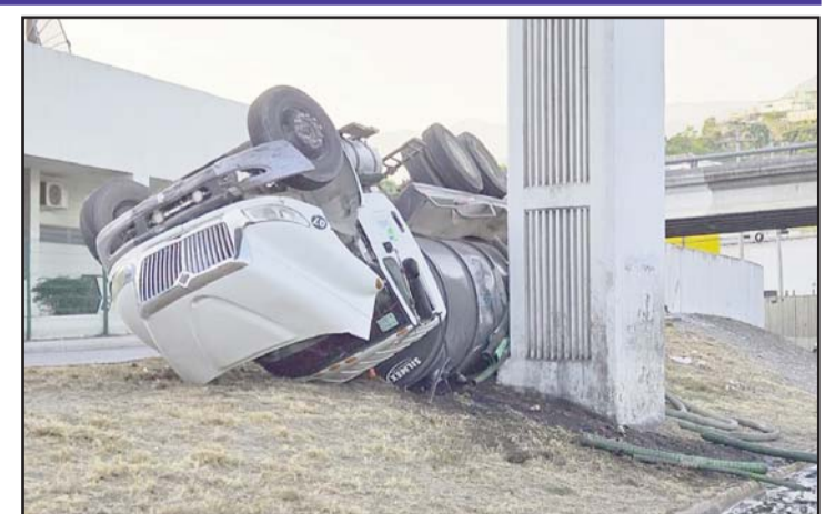
Se registró en el cruce de Garza Sada y Revolución.

Los hechos ocasionaron problemas en la vialidad de Revolución en sentido de norte a sur, ya que hasta esos carriles llegó parte de la carga.