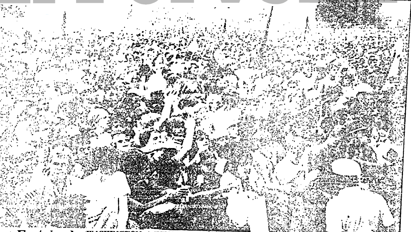
Festean la Independencia WASHINGTON, 4 (UPI). - Miles de personas se reunieron hoy en el monumento a Washington en esta ciudad para escuchar un recital que incluyó desde música rock hasta clásica, como parte de los festejos para celebrar el 209 aniversario de la independencia norteamericana. Celebraciones de todo tipo se realizaron a todo lo ancho del país. (UNIFAX).

WASHINGTON, 4 (EFE-AFP). - El gobierno estadounidense tiene el compromiso de contribuir a una solución “justa y eficaz” de la crisis de la deuda exterior, aseguró hoy el secretario de Estado norteamericano, George Shultz, a los embajadores de los países latinoamericanos.