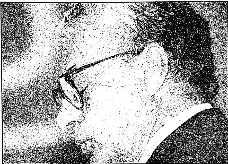
Gustavo Petricioli, embajador de México en EU.

defraudación bursátil, recibieron la notificación del auto de formal prisión en sus celdas.