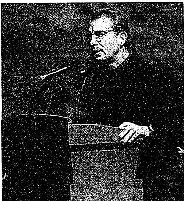
Zedillo anunció $300 millones para reforestación.

Acompañado por los secretarios del Medio Ambiente, Julia Carabias, y de la Defensa Nacional, Enrique Cervantes Aguirre, así como por el gobernador José Murat, el Jefe del Ejecutivo señaló que la participación social será un valioso