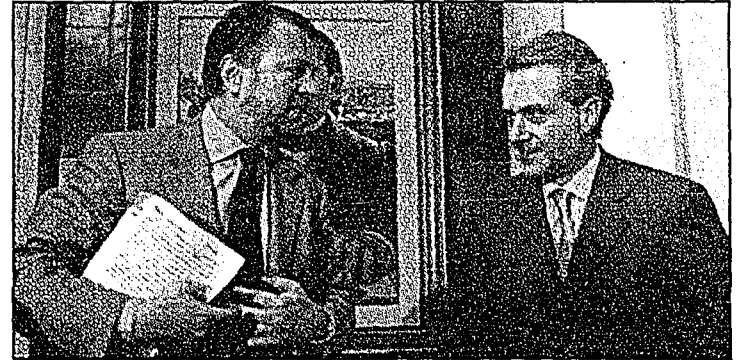
Los secretarios Creel (der.), y Castañeda anunciaron la liberación.

Con la excarcelación de Gallardo Rodríguez, el gobierno de México puede mirar de lejos al mundo y decir que el país se promueve la protección de los derechos humanos, señaló Creel, quien expresó que el gobierno está dispuesto a platicar con el militar para valorar las medidas de seguridad que pudieran solicitar.