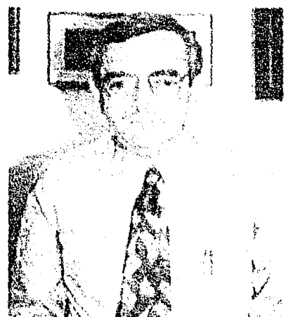
Castillo Peraza. Líder del CEN.

A nombre del Comité Ejecutivo Nacional (CEN) del PAN propuso que la situación de Tabasco se discutan los partidos y el gobierno en la Mesa de Coyuntura de la Reforma del Estado, que se creó precisamente para atender los conflictos políticos que pudieran ser un obstáculo a la reforma del Estado.