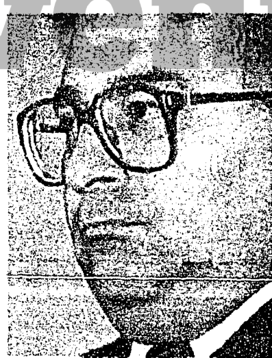
Chuayffet, secretario de Gobernación.

Agregó que "conforme a las normas de la Constitución General de la República, los partidos políticos son entidades de interés público que han asumido el compromiso expreso, al momento de solicitar su registro nacional, de actuar dentro de la ley. Frente a la violación del orden jurídico, el apoyo partidista no es sino presión