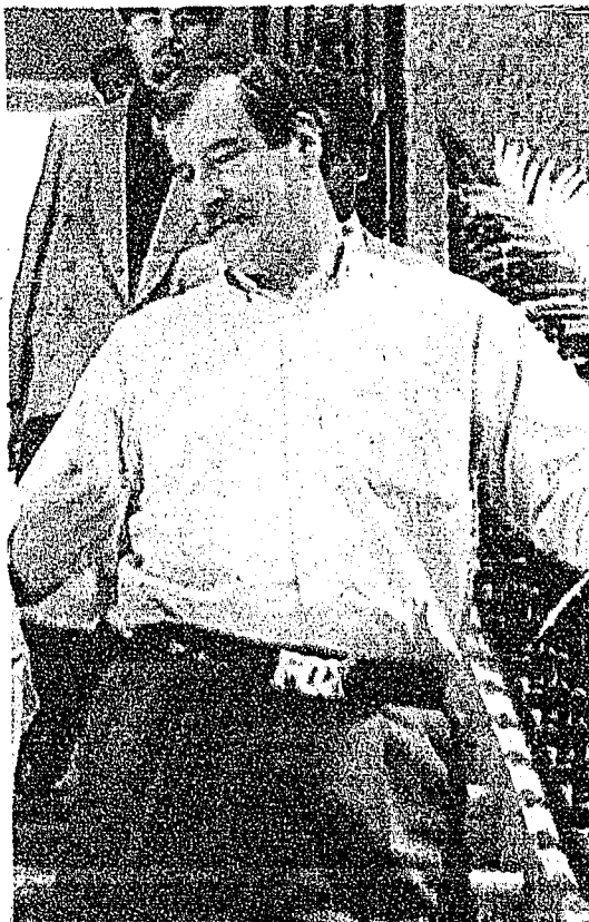
Vicente Fox Quesada

Los partidos en la Cámara no están afectando la viabilidad económica del país -siguió el candidato de la