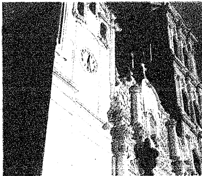
La Iglesia rechazaría las limosnas de narcotraficantes.