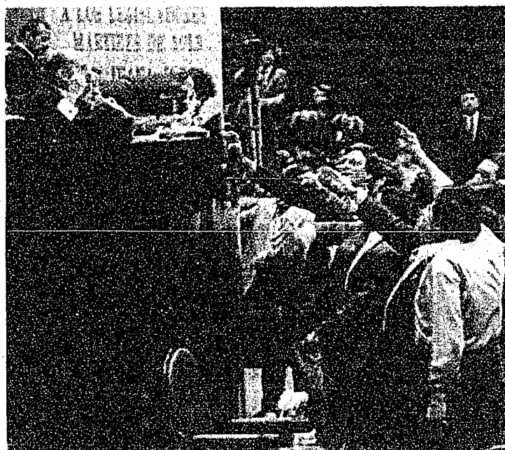
Los coordinadores parlamentarios esperan llegar a un consenso.

El diputado del PRI aclaró que el acuerdo alcanzado por los coordinadores parlamentarios y los representantes del Gobierno Federal deben ser ratificados por cada una de las fracciones legislativas, a fin