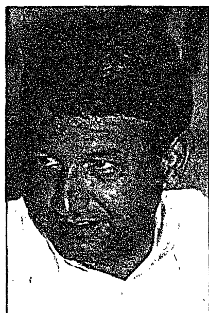
López Obrador ha recibido en sus filas a los disidentes.