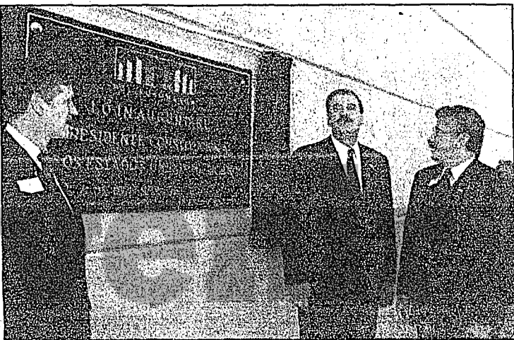
El presidente Fox inauguró el Poliforum de León, Guanajuato.

■ Buscarán disminuir inflación a un nivel del 6.5 por ciento