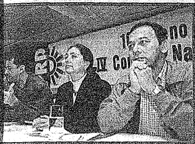
deres del PRD apoyan la pacificación de Chiapas