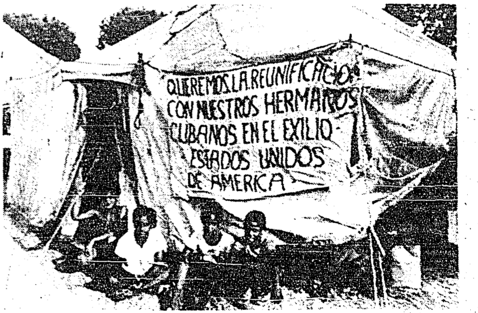
LIMA, 28 (UPI).- Los cubanos que fueron exiliados aquí luego de haber solicitado asilo político al Perú, viven con el deseo de emigrar un día a Estados Unidos, según lo indican con este letrero, puesto en la carpa que les sirve de vivienda. (UNIFAX).

Otro de los convenios, el de cooperación técnica, puntualiza que las partes se comprometen a fomentar programas técnicos para el desarrollo de acuerdo a sus posibilidades y necesidades. El convenio lo suscribieron los cancilleres mexicano e italiano, respectivamente, Jorge Castañeda y Emilio Colombo.