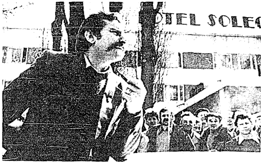
VARSOVIA, 28 (UPI).- El líder Lech Walesa dirigiendo la palabra a unos reporteros antes de partir de un hotel para negociar con las autoridades con relación a los pa-

La directiva nacional de la CROC manifestó en un documento que ese fenómeno es fomentado tanto por la injusticia del sistema económico, que se traduce en mala distribución de la riqueza, como por la insuficiente educación de las masas y por el resquebrajamiento de la familia, que debiera ser la base de las instituciones en los países modernos.