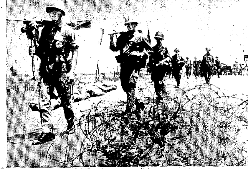
TAY NINH, Sudvietnam, 12 (AP).- Aspecto de la marcha de un batallón de soldados sudvietnamitas rumbo al frente de Tay Ninh en donde la ofensiva norvietnamita y vietcong logró cortar en dos la carretera 22 que es vital para suministrar a Saigón y otras ciudades de alimentos. Si los soldados no tienen éxito en reabrir esa carretera, se harán necesarios los puentes aéreos. (TELEFOTO).