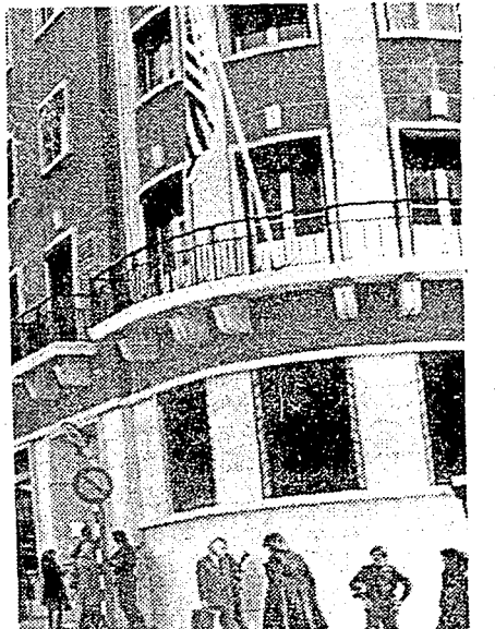
LISBOA, 12 (AP).- Algunos piquetes de soldados portugueses montan guardia ante el edificio de la embajada de los EE. UU. en esta ciudad. El jefe de la policía, General Otelo Saraiva de Carvalho, implicó a los Estados Unidos en los sucesos del fallido golpe de Estado de ayer y pidió al embajador americano que abandone Portugal, pero el Depto. de Estado ha negado todos los cargos. (TELEFOTO).

El movimiento de las fuerzas armadas, coalición de oficiales que tomó "temporalmente" el poder el 25 de abril pasado, con una promesa de establecer una democracia parlamentaria, reafirmó el compromiso de celebrar elecciones el 12 de (Ver: Portugal Pág. 5 Col. 1)