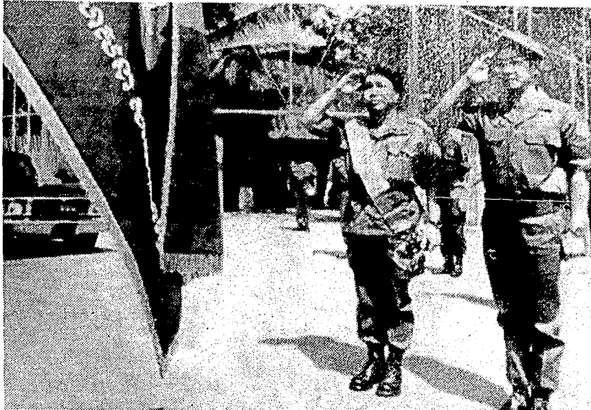
PHNOM PENH, Camboya, 12 (AP).- El nuevo Comandante de las fuerzas militares camboyanas, General Sak Su Sakhan, saludando el lábaro patrio durante la ceremonia del cambio de mando en esta ciudad el miércoles. Reemplaza al General Sostenes Fernández. El ayudante que aparece a la izquierda no fue identificado. (TELEFOTO).