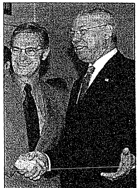
El canciller Derbez saluda con el secretario de Estado de EU, Colin Powell.

El funcionario mexicano dijo que la presentación de Powell refuerza la convicción de México sobre la necesidad de avanzar sobre un desarme efectivo y verificable de las